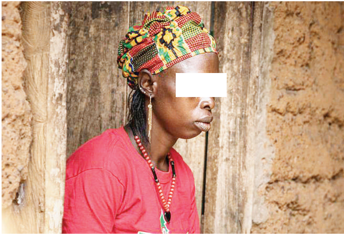
Anayeshukiwa kuwa na shida ya afya ya akili, wakati huo akiwa kwake: PICHA: JARIDA UMOJA WA MATAIFA

mtaenda sawa. Vinginevyo ni kumnyima furaha na amani mwenzio, jambo ambalo ‘in a long run’ (ikichukua muda mrefu) linaweza kumsababishia mwenzio hasira (negative emotion) au msongo wa mawazo.