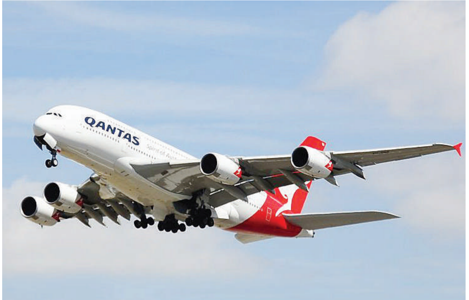
Ndege ya Shirika la Ndege la Australia, Qantas, miaka miwili ijayo inatarajiwa kuanzisha safari ya saa 19 angani, ambayo katika sura ya pili kuna changamoto ya afya ya abiria wake.

Kijiolojia, inaelezwa kadri panapo mgandamizo kwenye ndege unavyobadilika, hewa katika mwili wa abiria nao hubadilika na hiyo inaongezeka, kadri ndege inapopanda na mgandamizo wa hewa unapungua na kinyume chake wakati ndege inashuka,