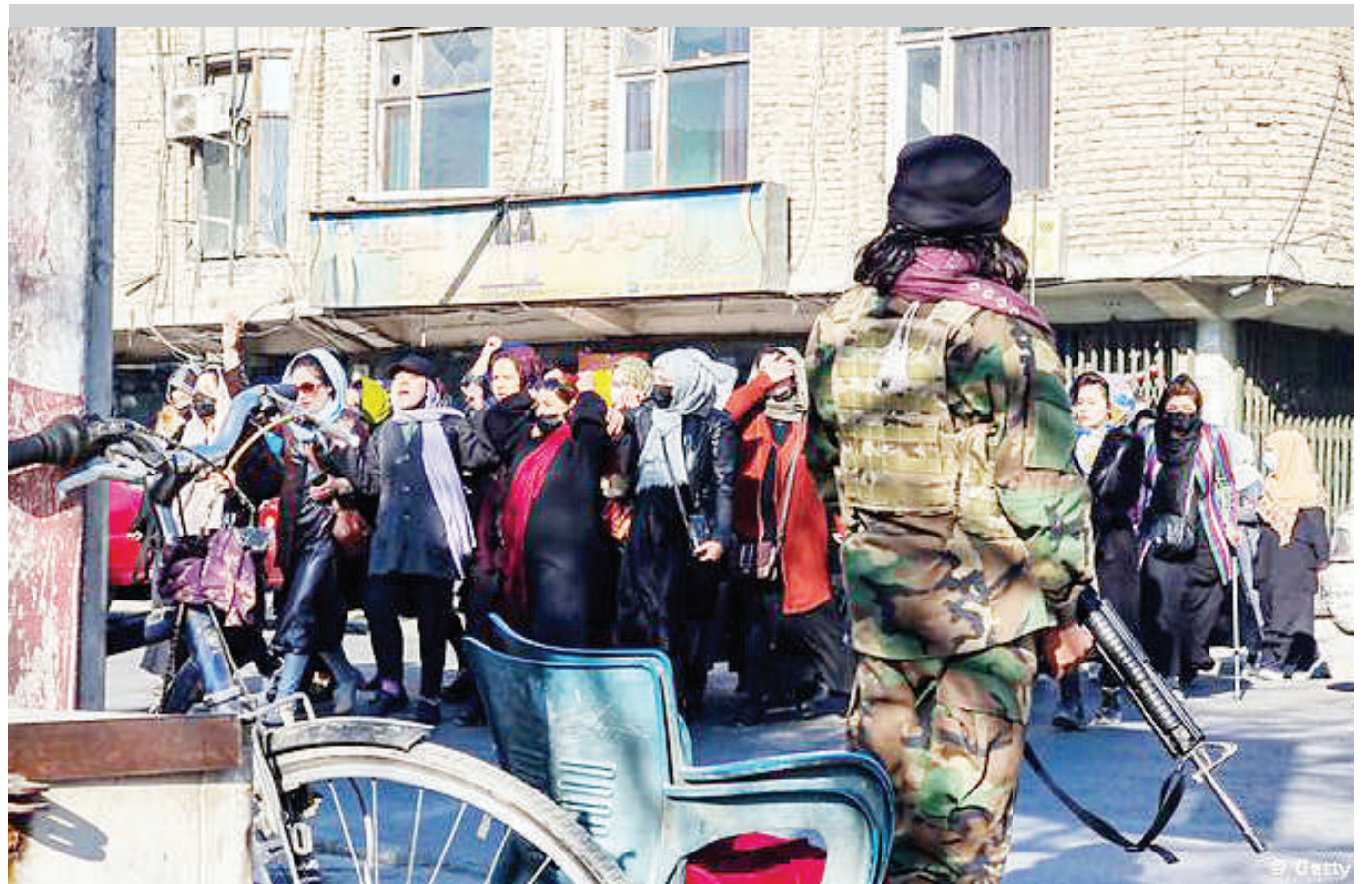
Wanawake wa Afghanistan wakiandamana kupinga marufuku ya serikali dhidi yao kupata elimu ya vyuo vikuu.

Shirika la 'Save the Children' limethibitisha katika taarifa yake kuwa limeanzisha tena shughuli zake kutokana na hakikisho la Taliban. DW