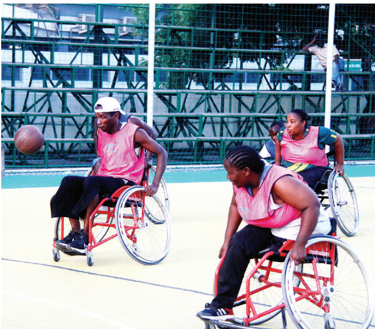
Wachezaji wa mpira wa kikapu timu ya wenye ulemavu wakifanya mazoezi katika Viwanja vya Jakaya Kikwete jijini Dar es Salaam juzi.

Alisema ligi msimu huu ina ushindani mkubwa kila timu imeji-panga kupata matokeo mazuri hivyo atapambana kuhakikisha wanafanya vizuri kwenye michezo yao iliyobakia msimu huu ili atimize malengo yake.