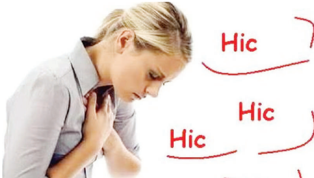
Mgonjwa wa kwikwi, akijipa huduma ya kwanza.

Kwa mujibu wa daktari huyo, watu wengi hupata kwikwi na kisha inaondoka yenyewe. Pia kuna mazingira kwikwi huondoka kwa tiba za awali. Vilevile anataja, kuna kwikwi zinazochukua muda