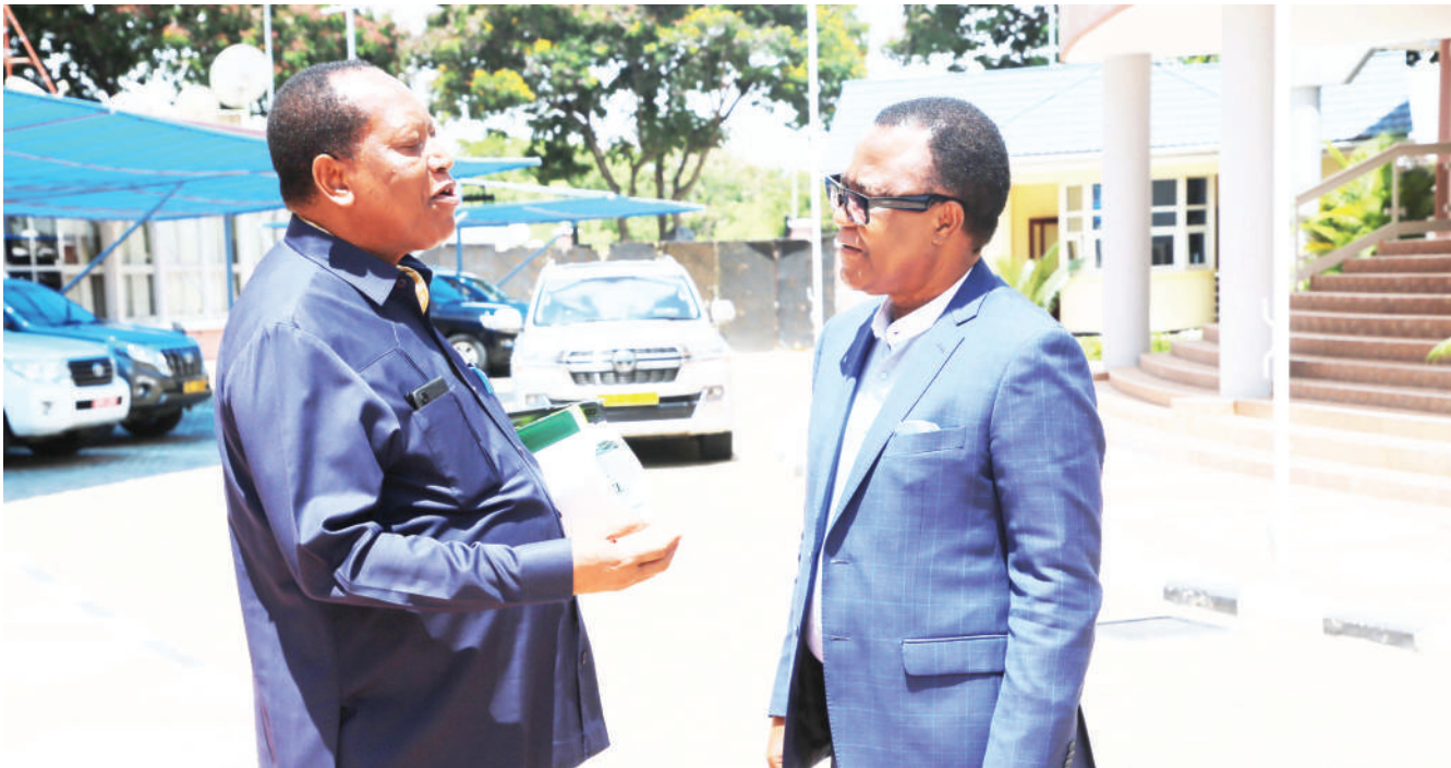
Mbunge wa Kilosa, Prof. Palamagamba Kabudi (kushoto), akijadiliana jambo na Mbunge wa Ismani, William Lukuvi, walipokutana katika viwanja vya Bunge jijini Dodoma jana.