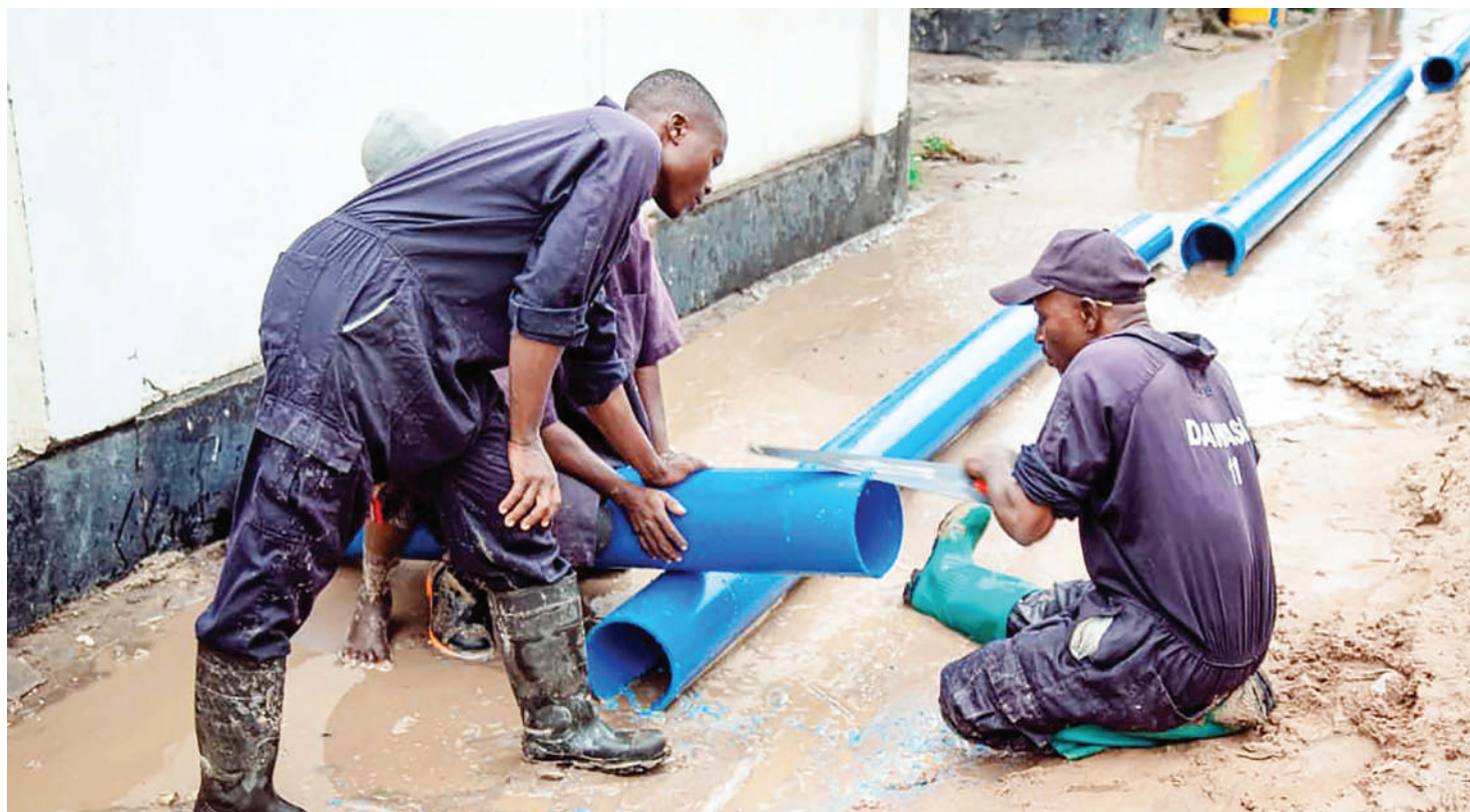
Mafundi wa Mamlaka ya Maji na Usafi wa Mazingira Dar es Salaam (DAWASA), wakilaza mabomba katika mtaa wa Buza, Kata ya Buza, wilayani Temeke juzi, ikiwa ni utekelezaji wa mradi wa maji Jet-Buza awamu ya tatu utakaonufaisha wakazi takribani 173,810.

Ilidaiwa mahakamani na Mwendesha Mash-taka wa Serikali, kuwa mshtakiwa alimfanyia ukatili mtoto wake kwa kumnajisi ambaye ni mwanafunzi wa darasa la nne.