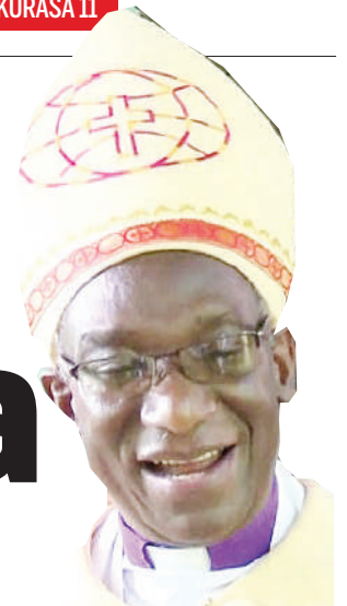
Askofu Dk. Fredrick Shoo