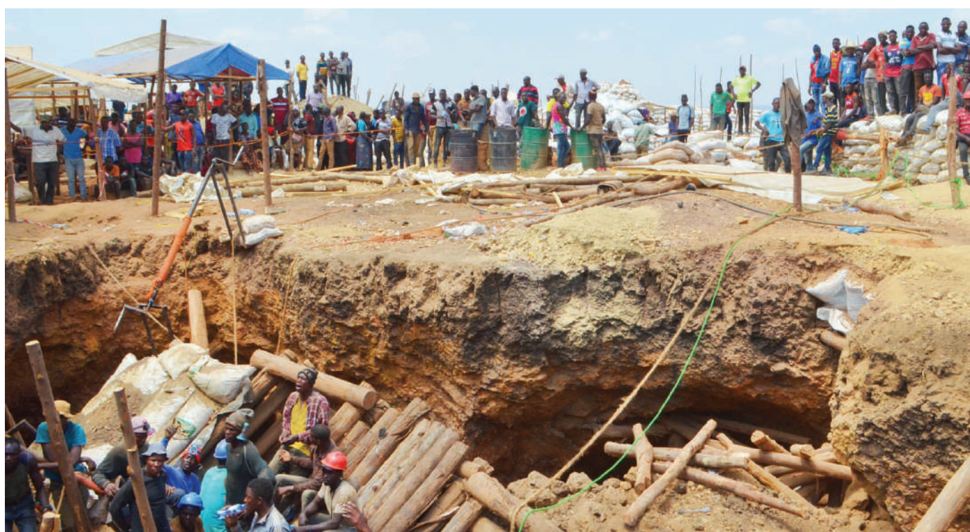
Timu ya mafundi na waokoaji katika mgodi wa Nyandolwa wilayani Shinyanga, wakiingia shimoni kuokoa watu waliofukiwa na kifusi, wanne waliokolewa katika mashimo hayo ya dhahabu mwishoni mwa wiki.