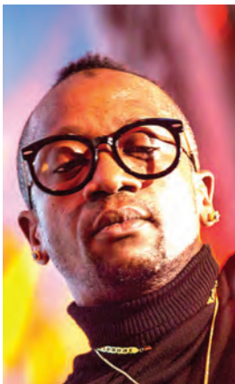
TID UKURASA 12