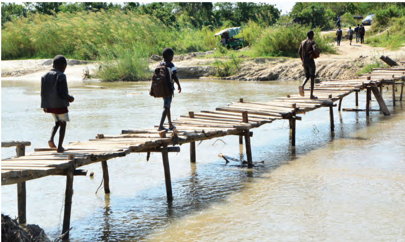
Watoto wa kitongoji cha Kiembeni, kata ya Mapinga wakivuka kwenye daraja lililotengezwa kwa miti na mbao bila ya kuweka kingo za pembeni katika Mto Mapinga, wilayani ya Bagamoyo, mkoani Pwani jana, kitendo ambacho ni hatari kwa wavukaji.

“Gharama hizi ni pamoja na mishahara ya watumishi, ankara za umeme na maji,” alisema.