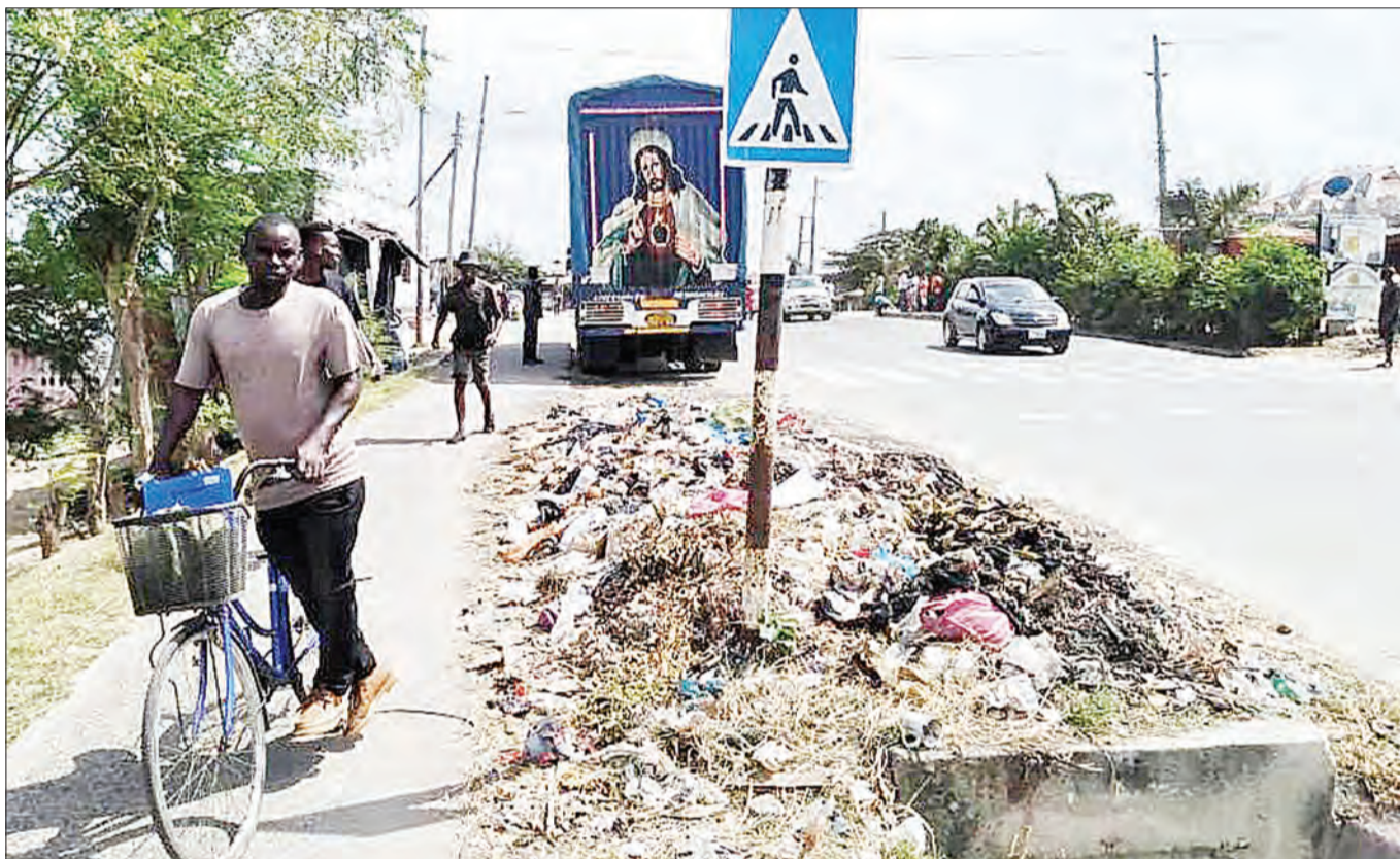
Wakazi wa Jiji la Dar es Salaam, wakipita jirani na taka zililorundikwa kando ya barabara jirani na Shule ya Msingi Rutihinda, eneo la Kigogo, jijini humo jana.

Awali, akiongea kwa niaba ya Kamishina wa Ardhi Msaidizi mkoani hapo, Ruteganya Speratus, alisema ofisi yake tangu ifunguliwe Machi 3, mwaka huu, imepokea ramani 1,330 kutoka Dodoma, zenye viwanja 43,227, zikiwamo 78 zenye kunyesha mipaka ya vijiji 30.