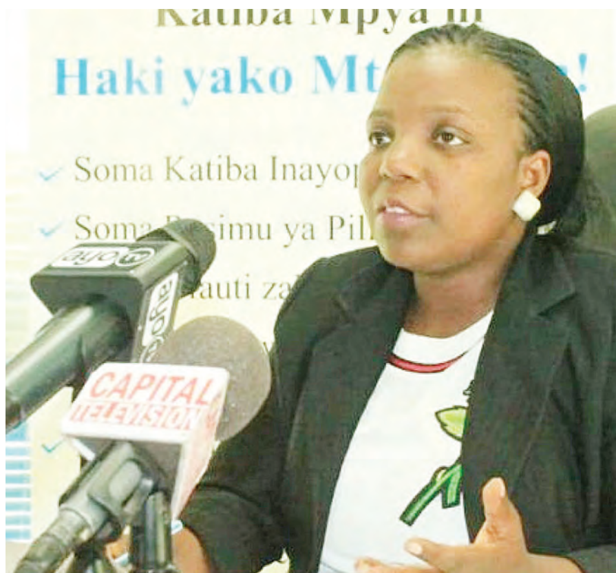
Kupiga kura ni haki yako ya msingi lakini pia kuzungumzia mafanikio, kuhoji upungufu, changamoto, ahadi zilizotolewa na udhaifu wowote wa kiongozi wako au serikali ni haki yako pia.

Ni wazi kuwa wapigakura wanakipigia chama kura kutokana na sera, miongozo na