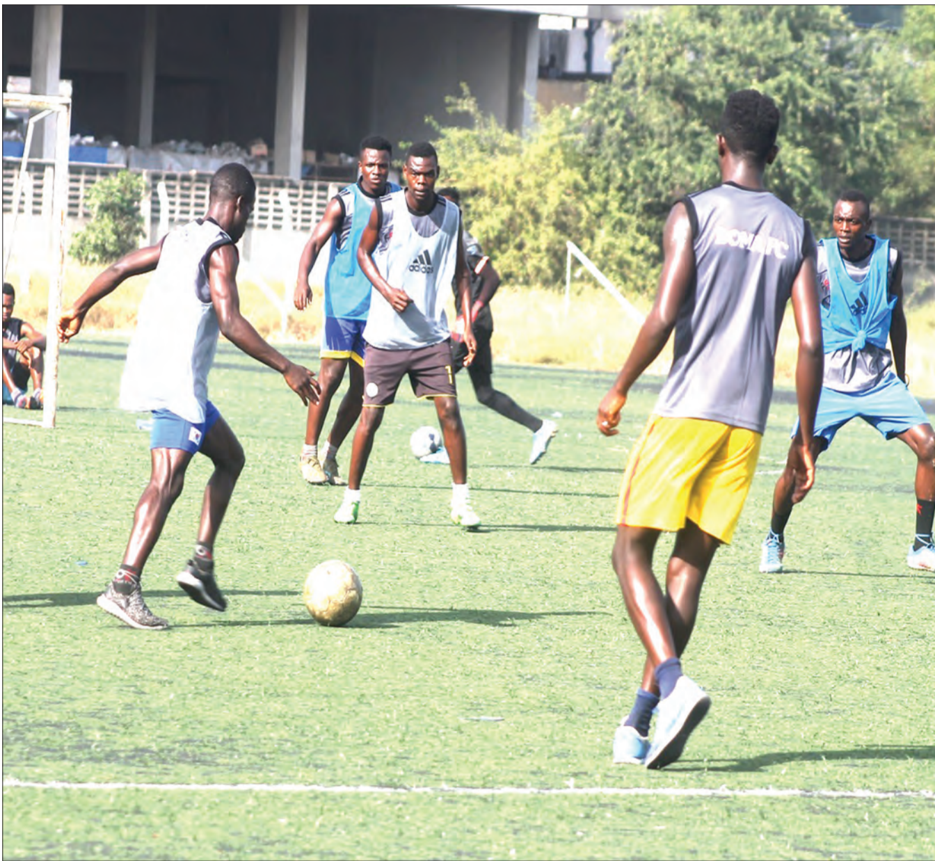
Wachezaji wa Boma FC, wakifanya mazoezi kwenye Uwanja wa Karume jijini, Dar es Salaam, kujiandaa na michezo mbalimbali ya Ligi Daraja la Kwanza inayoendelea hapa nchini.

Coastal Union yenye pointi 48, ipo katika nafasi ya tano kwenye msimamo wa Ligi Kuu Tanzania Bara na leo inatarajiwa kuikabili Alliance FC kwenye Uwanja wa CCM Kirumba jijini, Mwanza.