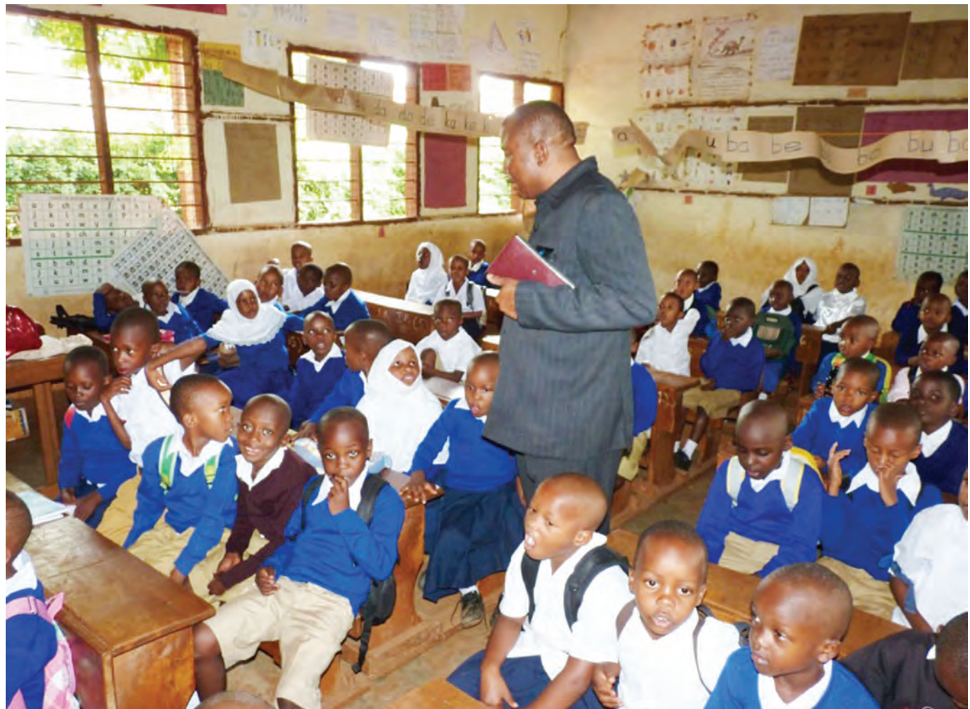
Mwalimu na wanafunzi wake darasani.

zote zinamudu matumizi, akimaanisha kundi la wanaotoka kwenye familia maskini.