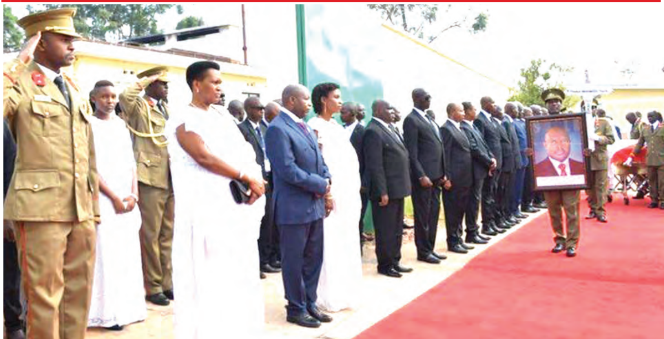
Safari ya mwisho ya aliyekuwa Rais wa Burundi Pierre Nkurunziza.