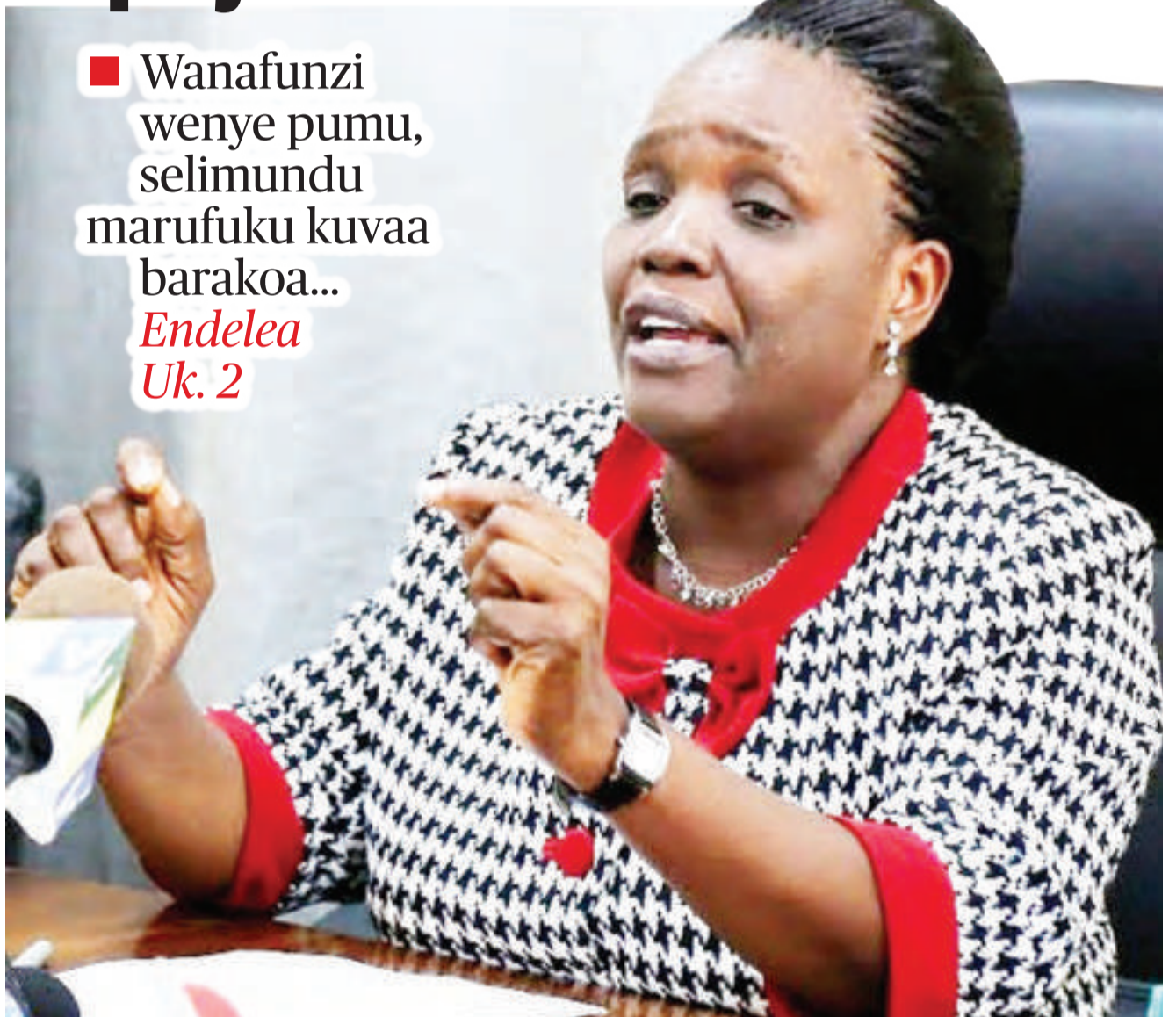
Waziri wa Elimu, Sayansi na Teknolojia, Prof. Joyce Ndalichako