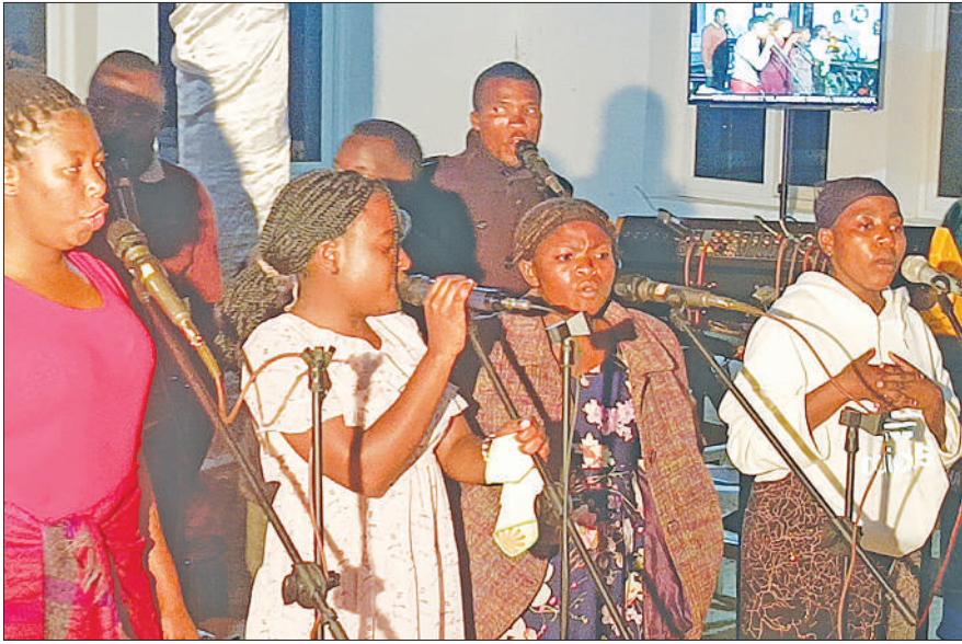
Waimbaji wa kwaya ya kusifu na kuabudu kutoka Kanisa la Kiinjili la Kilutheri Tanzania Usharika wa Mlandege, mjini Iringa, wakiimba nyimbo za kumshukuru Mungu kwa kuvuka mwaka 2024 na kuanza mwaka mpya 2025 wakati wa mkesho kanisani hapo jana.