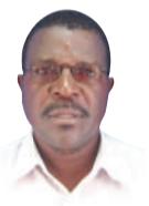
Na Mwandishi Wetu