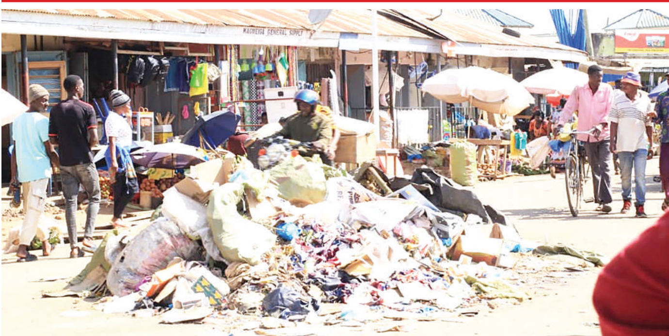
Taka zikiwa zimerundikwa mbele ya maduka mjini Mugumu Serengeti mkoani Mara jana kutokana na kilichoelezwa kuwa mzabuni kugoma kuzoa kwa madai ya kutolipwa fedha zake.

Kilamhama alisema kukamilika kwa ujenzi wa shule hizo kutasaidia kupunguza tatizo la wanafunzi kukosa nafasi za masomo wanapofaulu mitihani yao ya mwisho ya kumaliza elimu ya msingi.