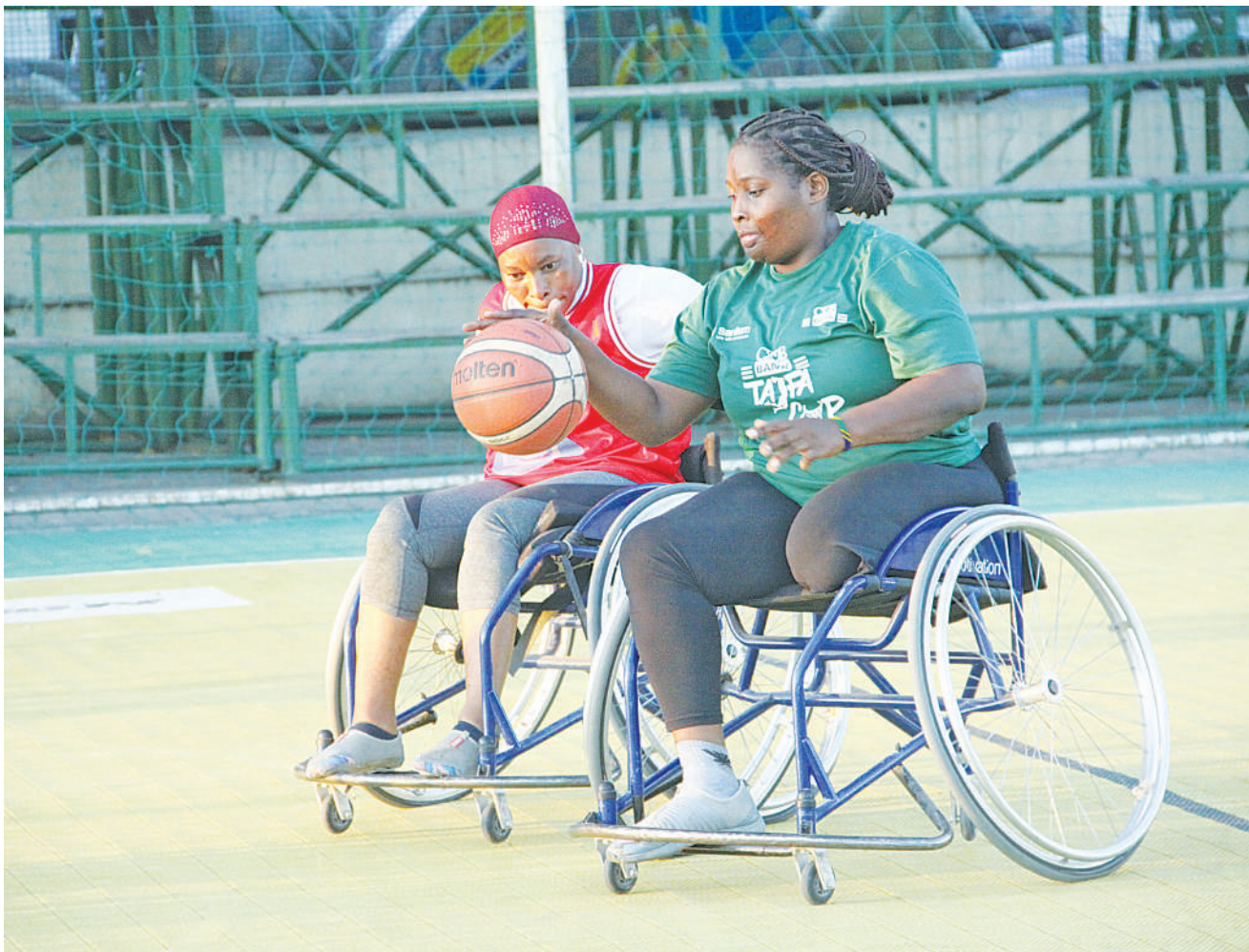
Wachezaji wa mpira wa kikapu kwa watu wenye ulemavu, wakifanya mazoezi katika Kituo cha Michezo Jakaya Kikwete, Dar es Salaam kama walivyokutwa juzi.