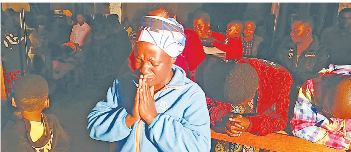
Waumini wa Kanisa la Kiinjili la Kilutheri Tanzania Usharika wa Mlandege mkoani Iringa wakiupokea mwaka 2025 kwa maombi ya kuliombea Taifa jana.