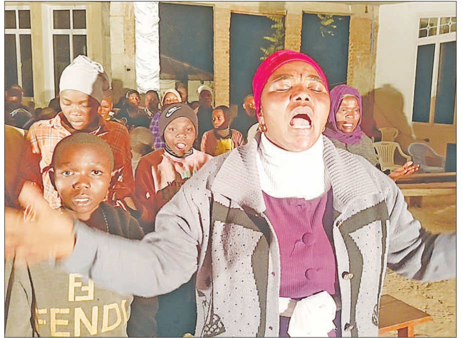
Mmoja wa waumini akiwa kwenye maombi wakati wa mkesho wa Mwaka Mpya jana.