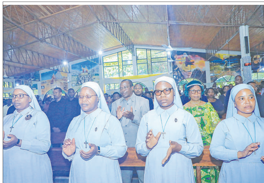
Baadhi ya waumini wakiwa katika ibada maalum ya Adhimisho la Misa Takatifu ya Serehe ya Bikira Maria Mama wa Mungu na Mwaka Mpya 2025 iliyofanyika katika Kanisa Katoliki Parokia ya Mwenyeheri Maria Theresa Ledochowska Kiwanja cha Ndege Dodoma jana.