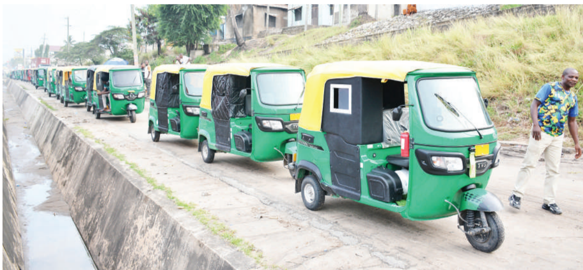
Madereva wa bajaji wakiwa kwenye foleni ya kujaza gesi kwa saa zaidi ya saba wakisubiri kupata huduma hiyo katika kituo cha Tabata jijini Dar es Salaam jana.

Kwa maoni: +255 677 020 701 Email: customerrelations@guardian.co.tz