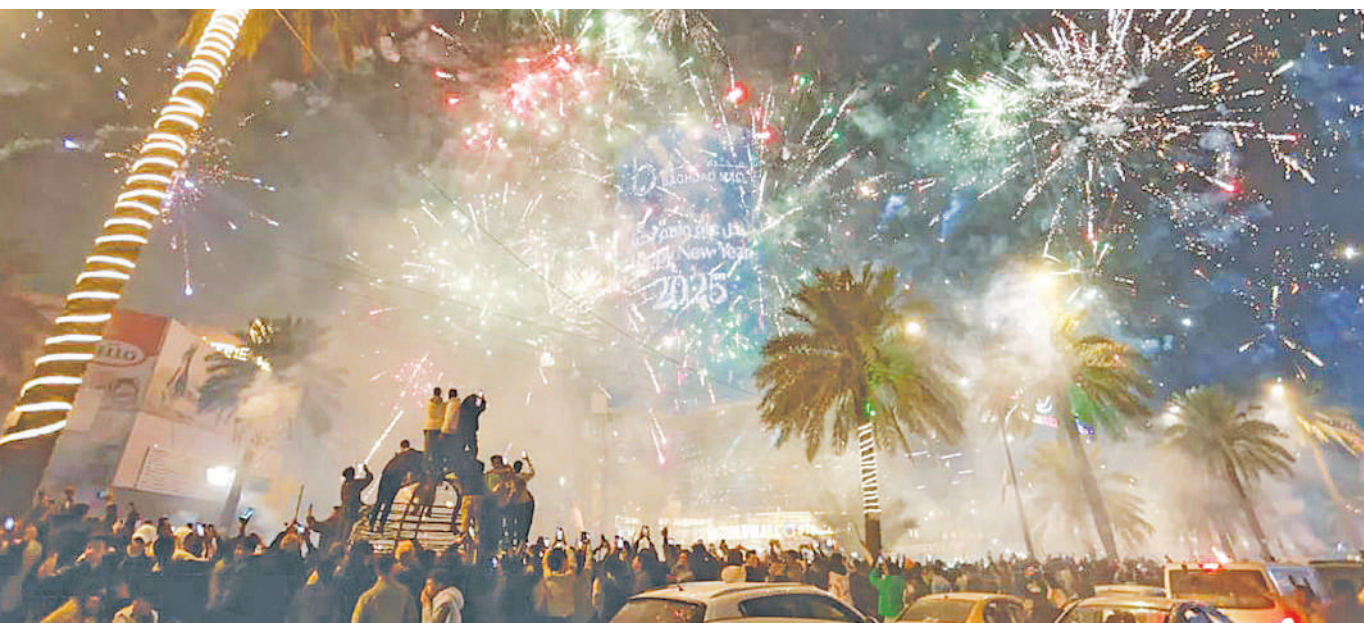
Wakazi wa Jiji la Baghdad, Iraq wakifurahia mafataki ya kuukaribisha Mwaka Mpya wa 2025 usiku wa kuamkia jana.