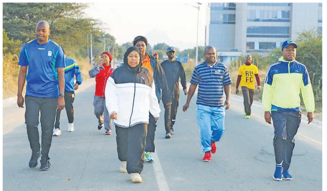
Rais Dk. Samia Suluhu Hassan, alipokuwa Makamu wa Rais mnamo Agosti 2020, aliposhiriki matembezi ya kilomita nne yaliyoanzia kwenye makazi yake Mtaa wa Farahani Kilimani jijini Dodoma, akihitimisha kwa kuwasisitiza Watanzania kuzingatia mazoezi ya mwili.