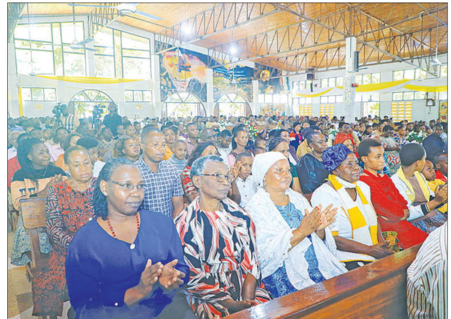
Baadhi ya waumini wakiwa katika ibada ya Adhimisho la Misa Takatifu ya Serehe ya Bikira Maria Mama wa Mungu na Mwaka Mpya 2025.