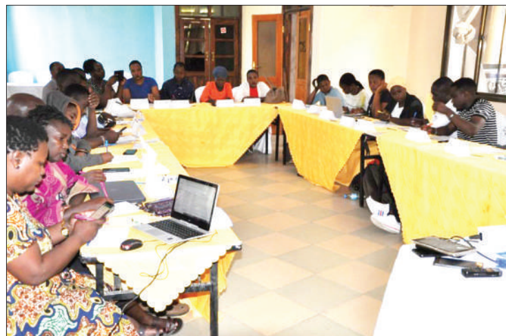
Wanahabari wakiwa katika mafunzo ya taaluma yao jijini Dodoma

Kituo cha Sheria na Haki za Binadamu (LHRC), kinasema wanawake na wasichana wengi wanakatiliwa kijinsia na hawafahamu mifumo ya kuwapa haki, pia namna ya kuwasaidia, wanapokumbana na madhila ya kikatili.