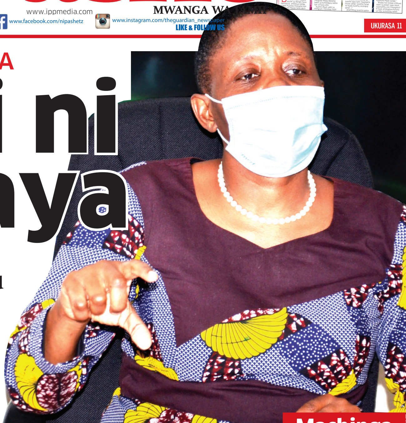
Waziri wa Afya, Maendeleo ya Jamii, Jinsia, Wazee na Watoto, Dk. Dorothy Gwajima, akizungumza na waandishi wa habari jijini Dar es Salaam jana kuhusu mwenendo wa corona nchini.