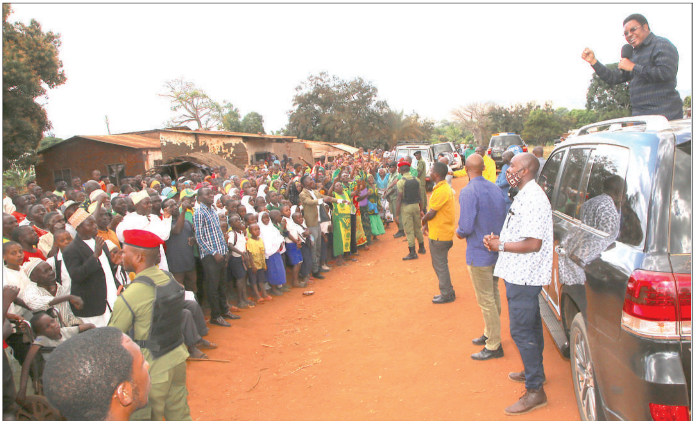
Waziri Mkuu Kassim Majaliwa, akizungumza na wananchi wa Kijiji cha Chinokole wilayani Ruangwa mkoani Lindi jana.

Alisema mfumo huo umeunganishwa na taasisi mbalimbali za serikali kama mfumo wa malipo ya serikali kielektroniki, Wakala wa Usajili wa Leseni za Biashara (BRELA) na Mamlaka ya Mapato Tanzania (TRA), na kuwawezesha kupata taarifa mbalimbali za mwombaji tofauti na awali walipomtaka kuzipeleka mwenyewe Idara ya Kazi anapowasilisha maombi.