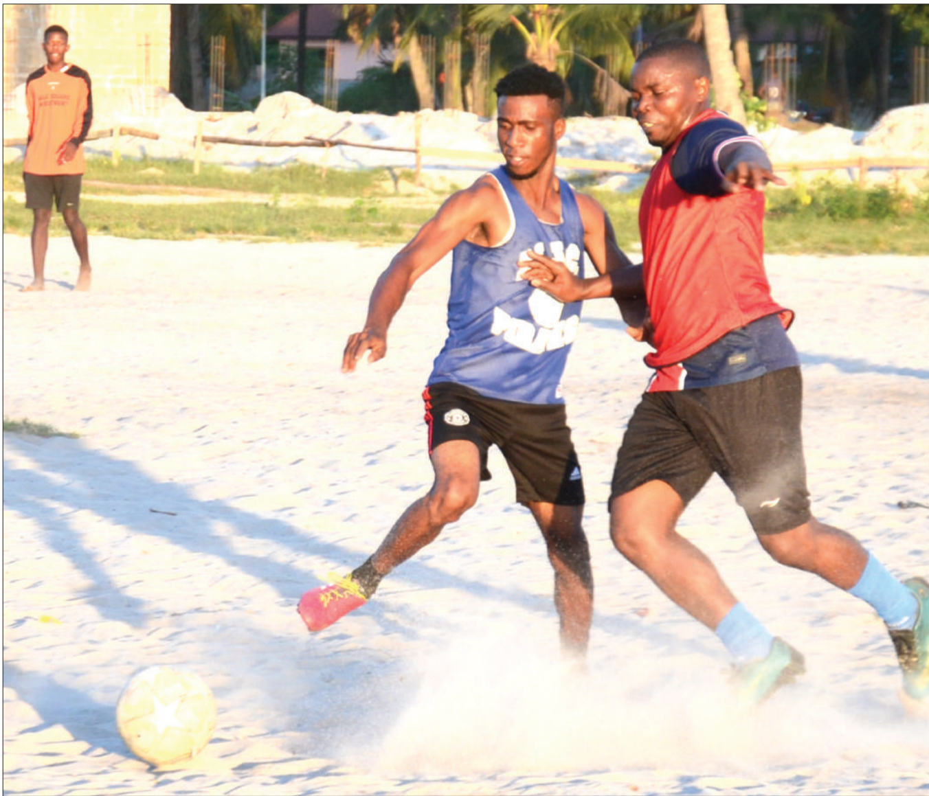
Wachezaji wa timu ya Fedha FC, wakifanya mazoezi katika Uwanja wa Hospitali ya Kivule jijini Dar es Salaam juzi.