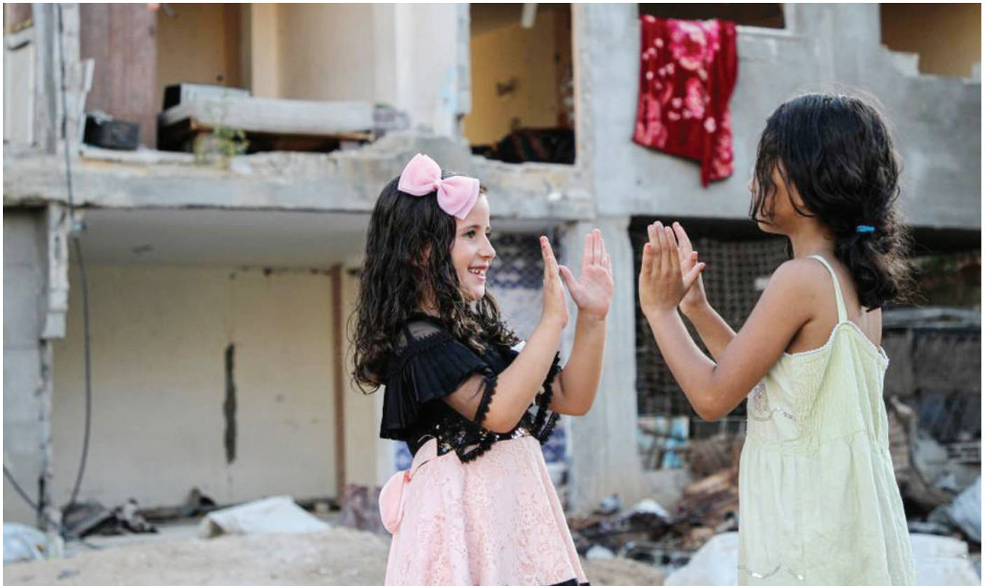
Watoto wakicheza nje ya makazi yao katika siku ya Sikukuu ya Eid al-Adha Kaskazini mwa Ukingo wa Gaza, mjini Beit Hanoun, juzi.