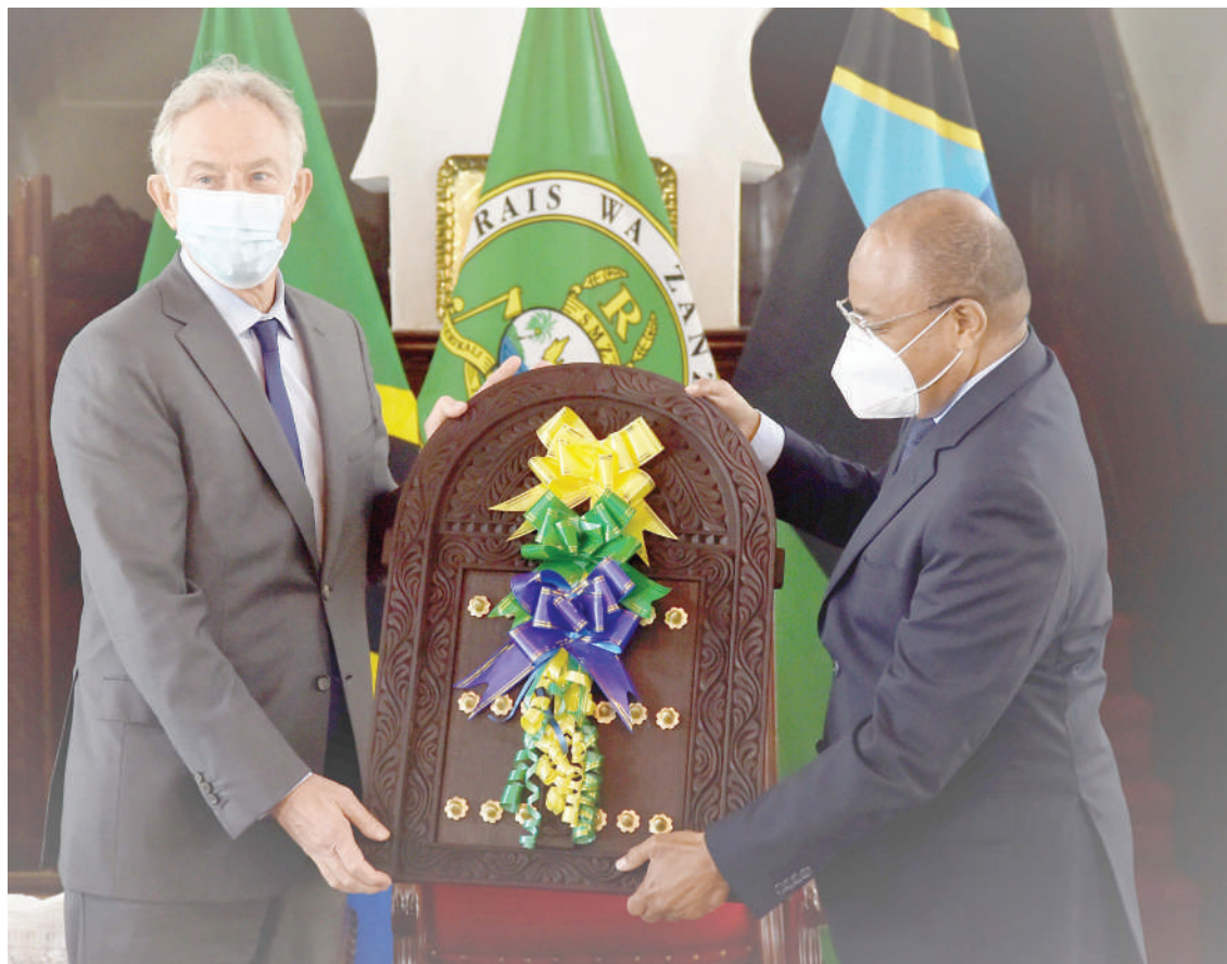
Rais wa Zanzibar na Mwenyekiti wa Baraza la Mapinduzi, Dk. Hussein Ali Mwinyi, akikabidhi zawadi ya mlango wa Zanzibar kwa mgeni wake Waziri Mkuu mstaafu wa Uingereza, Tony Blair, baada ya mazungumzo yao, Ikulu jiji Zanzibar jana.

"Watumishi waongo na wachongonishi siwapendi, watu wanaochonganisha watu, hasa Halmashauri ya Wilaya ya Kondoa, tumekutanishwa na kazi, tufanye kazi tuheshimiane, kiongozi haongozwi," alisema.