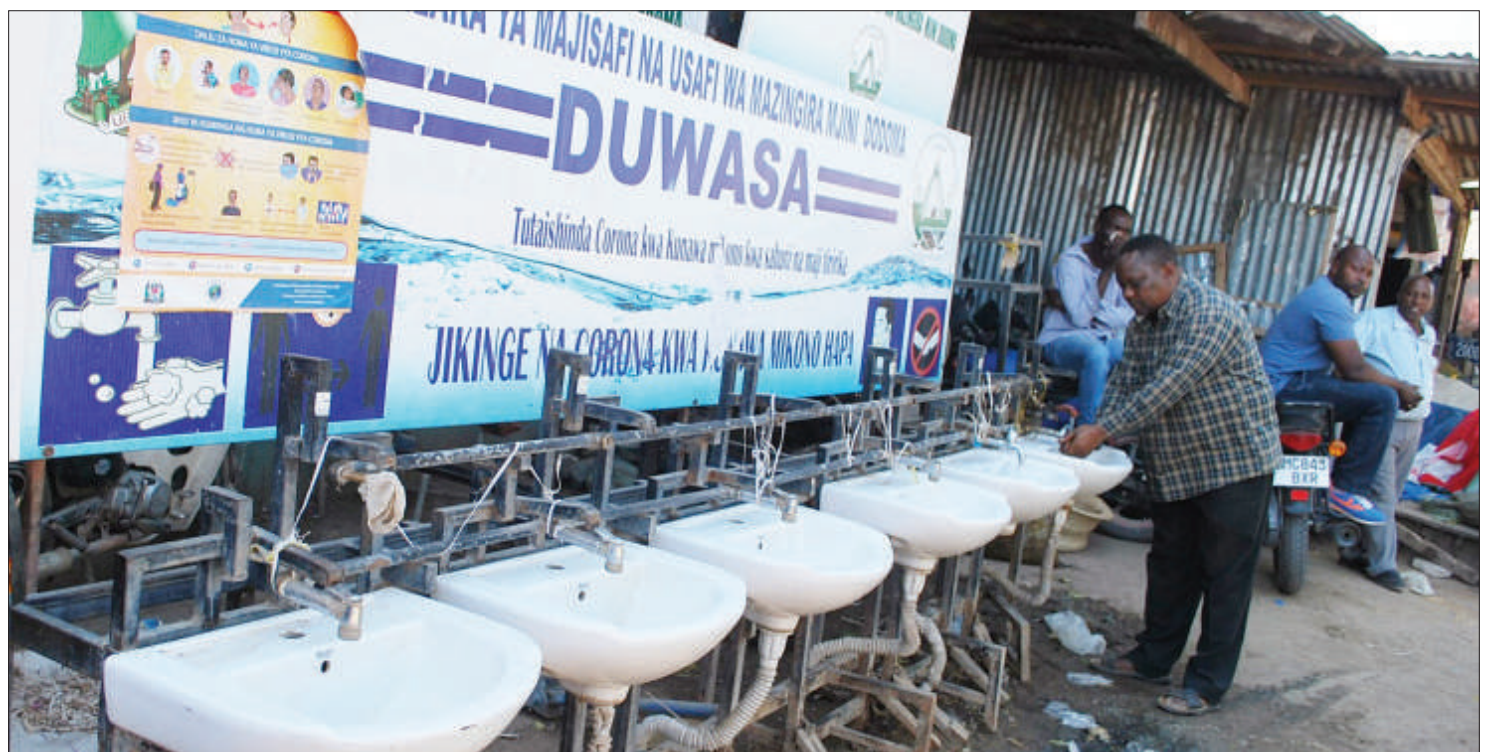
Mkazi wa Jiji la Dodoma, akinawa maji tiririka kwenye moja ya masinki katika lango kuu la kuingia kwenye Soko Kuu la Majengo jijini humo jana, ambapo asilimia kubwa ya mabomba yake ni machakavu na hayatoi maji.

Alisema taasisi yao inajishughulisha na wakulima wadogo, wakubwa na wa kati hivyo wanapaswa kuchangamkia fursa ya mikopo ambayo inatolewa na PASS Leasing ili kuinua kilimo chao cha kila siku.