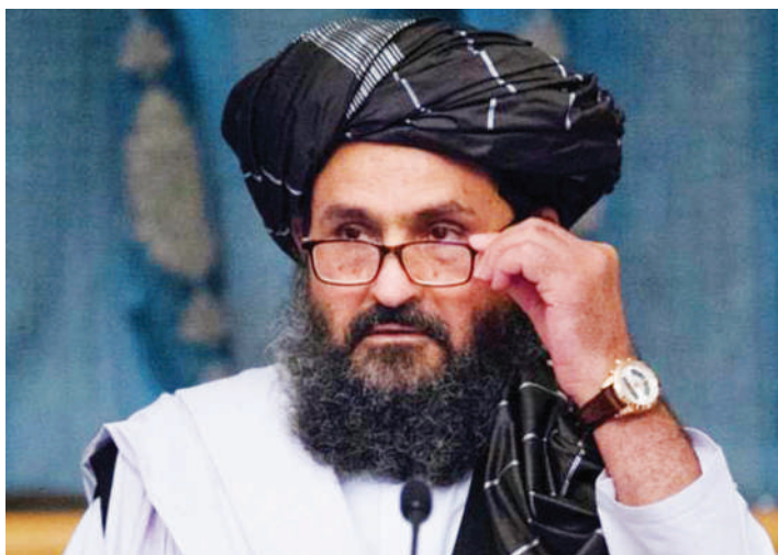
Kiongozi wa Taliban, Mullah Abdul Ghani Baradar

itetea maamuzi yake baada ya Kabul kuingia mikononi mwa Taliban, ni kuwa aligundua kuwa 'hakuna muda unaofaa' kwa Marekani kuondoa majeshi yake.