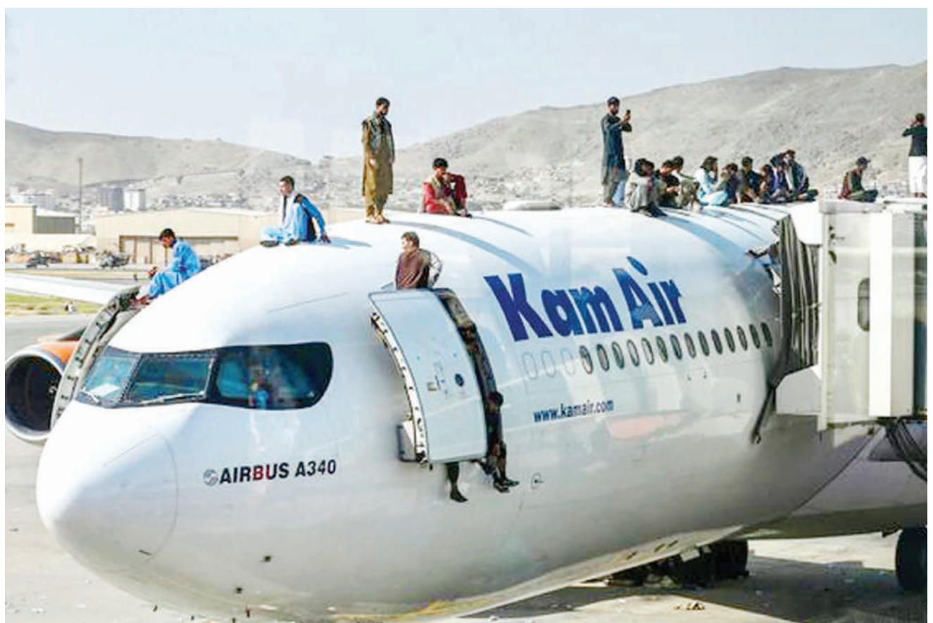
Maelfu ya watu wakivamia Uwanja wa Ndege wa Kabul nchini Afghanistan, wakitumaini kukimbia nchi baada ya Taliban kuchukua mamlaka. Watu wawili walioning'ina katika ndege ya kijeshi ya Marekani walifariki dunia, wakati ikianza kuondoka na kusababisha safari za ndege kusitishwa juzi.

Wakimbizi nchini humo wanaoishi katika makazi au vijijini na wenyaji na baadhi yao wamepewa kipande cha ardhi na kuruhusiwa kufanya kazi. BBC