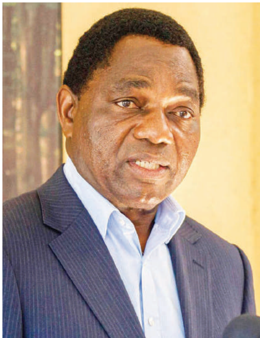
Hakainde Hichilema almaarufu HH.