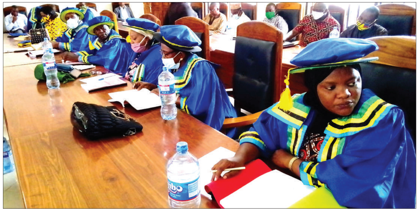
Madiwani wa Manispaa ya Shinyanga, wakipitia makabrasha kwenye kikao cha baraza cha kawaida jana, wakijadili ajenda mbalimbali, ikiwamo miundombinu ya barabara, elimu, maji, na umeme.

Mahakama ilikubaliana na sababu hiyo ya kwanza ya rufani, iliamua kufuta kutiwa hatiani na adhabu ya kunyongwa hadi kufa. Iliamuru walalamikaji waachiwe huru gerezani kama hakuna makosa mengine ya kuwafanya waendeleo kuwapo.