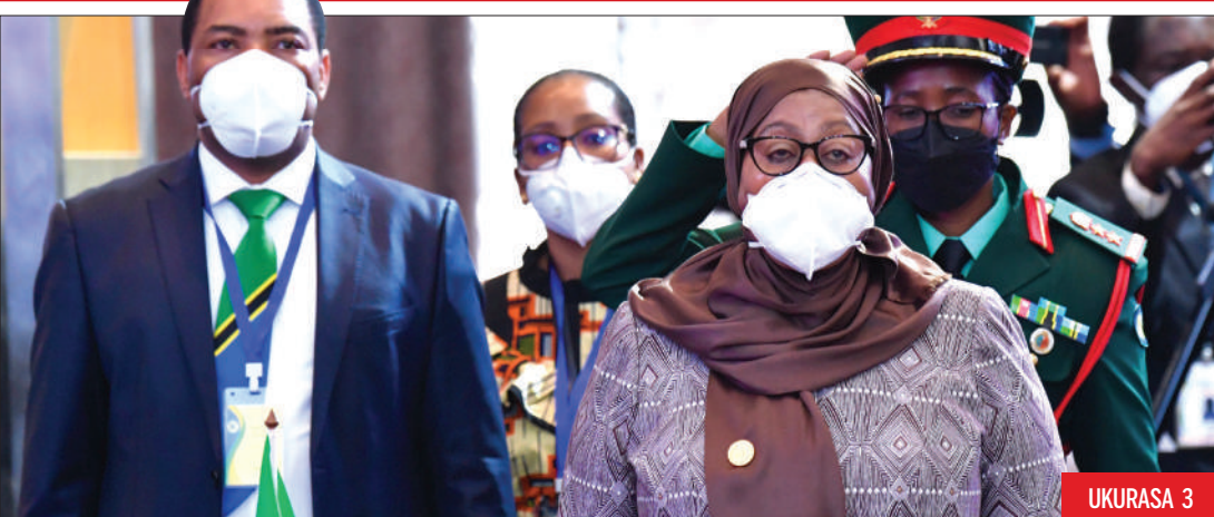
Rais Samia Suluhu Hassan akihudhuria Mkutano wa 41 wa Wakuu wa Nchi na Serikali wa Jumuiya ya Maendeleo Kusini mwa Afrika (SADC), ulioanza jijini Lilongwe, nchini Malawi jana. Kushoto ni Waziri wa Fedha na Mipango, Dk. Mwigulu Nchemba.