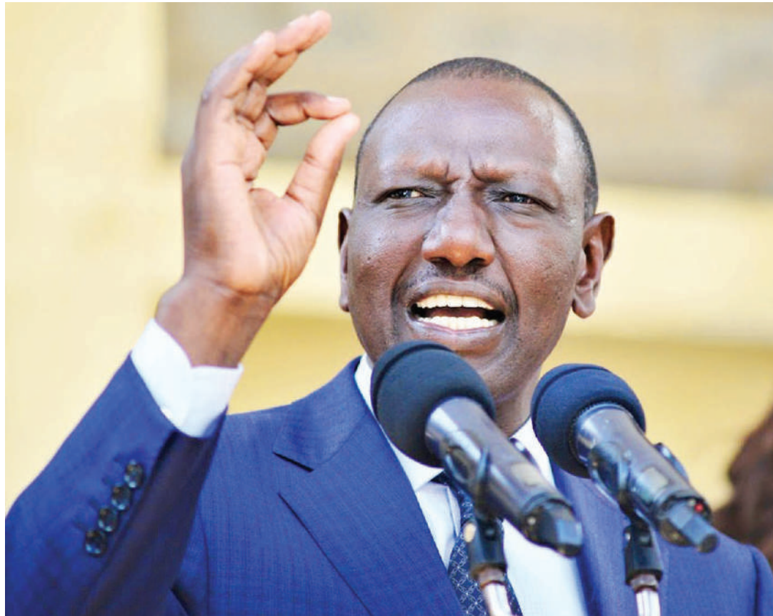
Naibu Rais wa Kenya, William Ruto.

Zipo tafsiri mbalimbali zilizotolewa na wachambuzi za siasa za Kenya na kwingineko barani Afrika, zikielezea kwamba licha ya uhasama uliojitokeza kati ya