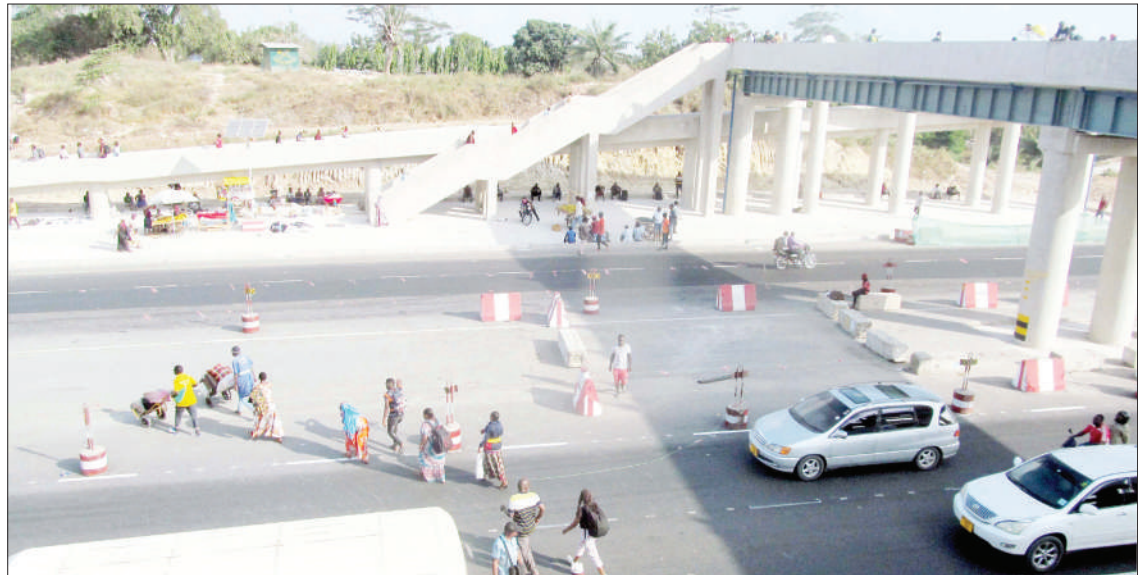
Wapita njia wakivuka Barabara ya Morogoro, Mbezi Mwisho, mkoani Dar es Salaam jana, bila kutumia daraja la waenda kwa miguu, hali ambayo inaweza kuhatarisha usalama wao.

Kesi hiyo ilifikishwa mahakamani kwa mara ya kwanza Julai 29, mwaka huu na jana ilitarajiwa kutolewa uamuzi juu ya mapingamizi yaliyowekwa na serikali.