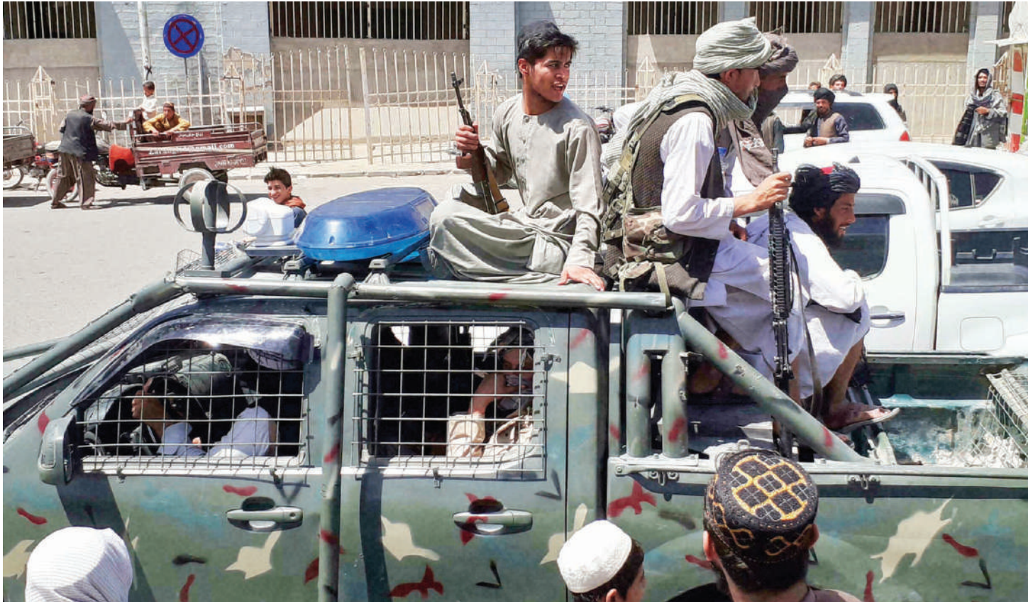
Majeshi ya Taliban yakiongeza ulinzi mitaani.

• Rais akimbia, Al Shabaab Somalia washereheka, huenda Nigeria itafuata