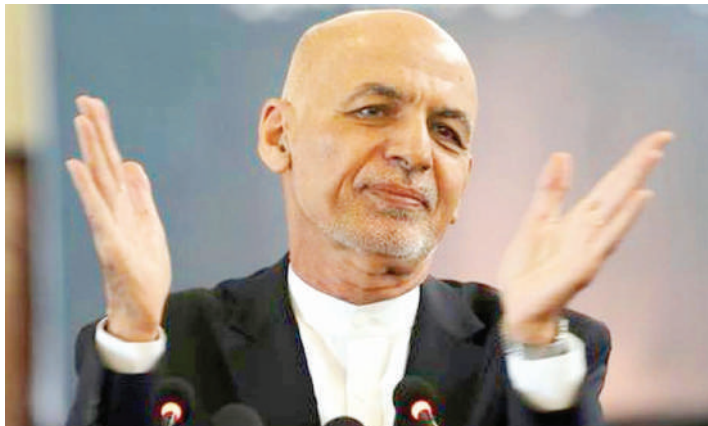
Rais wa Afghanistan, Ashraf-Ghani, aliyekimbia nchi.

Marekani kwa miaka 10 ilipigana na majeshi ya ukombozi wa chi hiyo, kuzuia utawala wa Kikomunisti wa Vietnam ya Kaskini, usiiteke nchi yote.