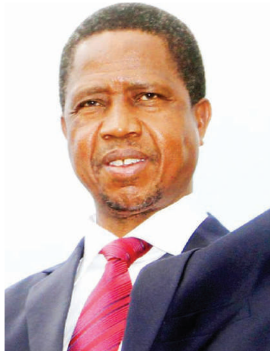
Edgar Lungu.

“ Zambia ndiyo nchi pekee ambayo marais wawili walifia madarakani, ambao ni Levy Mwanawassa na Michael Satta na warithi wao walikuja kuondolewa madarakani.