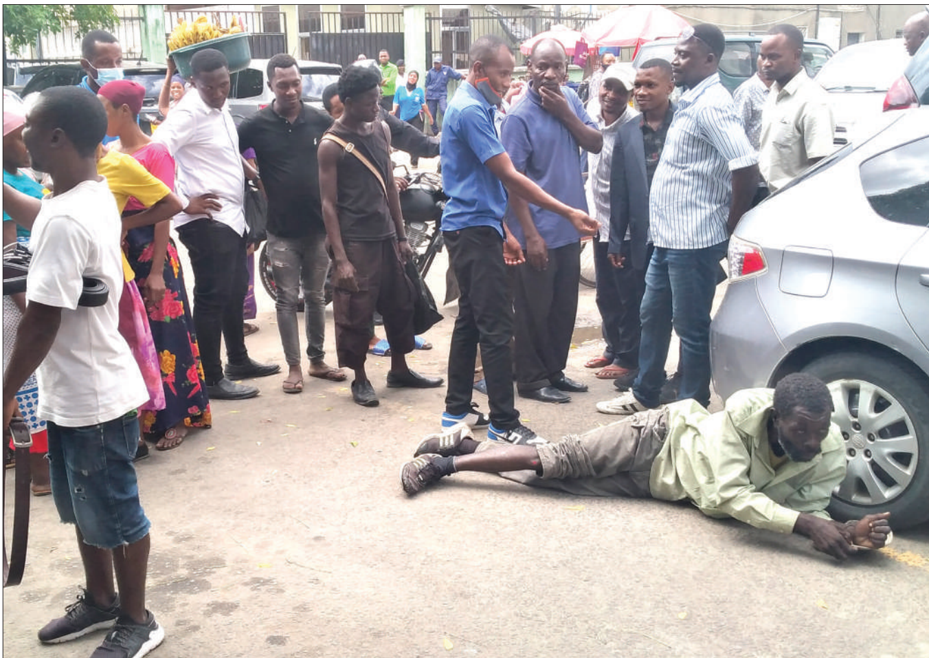
Wananchi wakiwa wamemdhhibiti mtu mmoja kwa kumlaza chini, baada ya kutuhumiwa kumnyanyasa kijinsia mwanamke aliyekuwa akipita njia, eneo la Posta Mpya, jijini Dar es Salaam jana.

Mkuu wa Idara ya Bima kupitia benki kutoka Kampuni ya Sanlam, Klispinana Shirima, aliwahakikisha wateja wa huduma hizo kuwa ni bora na zinalenga kuwagusa wanajamii moja kwa moja, huku akibainisha kuwa kampuni hiyo imejipanga kuhakikisha huduma hiyo inatolewa kwa kukidhi matakwa na malengo ya kuanzishwa kwake.