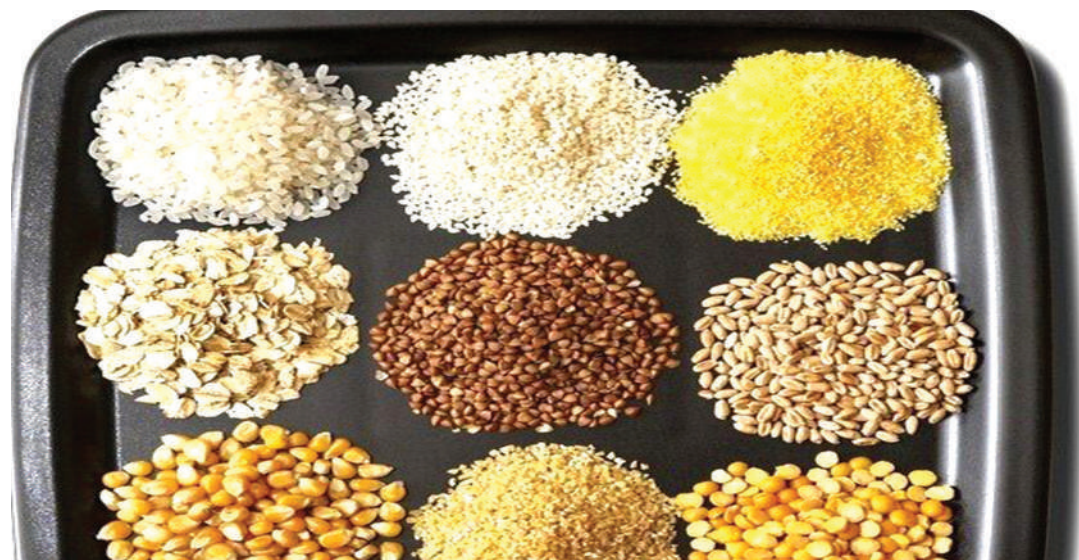
Malighafi nafaka inayotumika kuandaa lishe.

“Unapokosa lishe nzuri unapata matatizo ya afya. Kinamama wajawazito kukosa mtoto mwenye afya na mama mwenye afya nzuri, watoto huwa na udumavu wa akili na mwili. Serikali itapata hasara kwa sababu ya kuwa na watu wasio na afya bora kutokana na maradhi kwa kukosa lishe bora,” anasema.