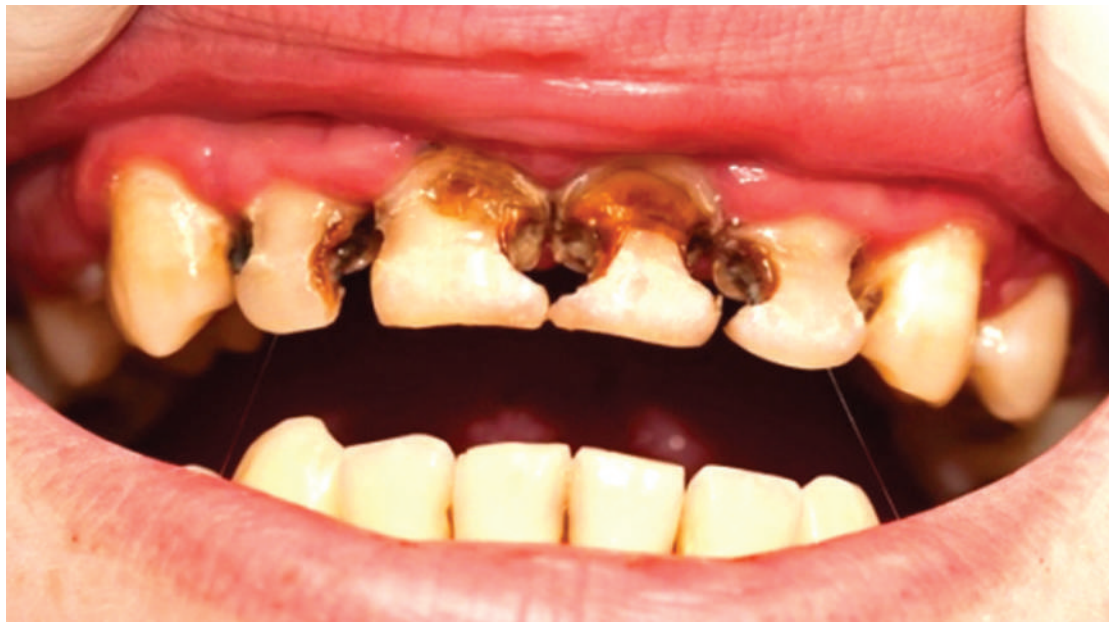
Uhalisia wa meno ya binadamu yenye kasoro katika sura tofauti.

Hali kadhalika, anatoa wastani kati ya watu wazima 10 wenye umri miaka 55 au zaidi, kuna wana wana magonjwa ya fizi.