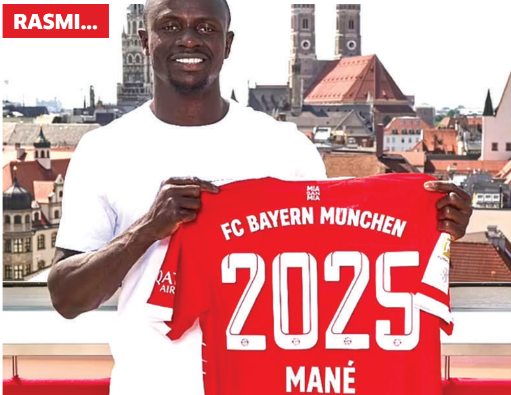
Mshambuliaji wa Liverpool, Msenegal Sadio Mane, amejiunga rasmi na Bayern Munich.