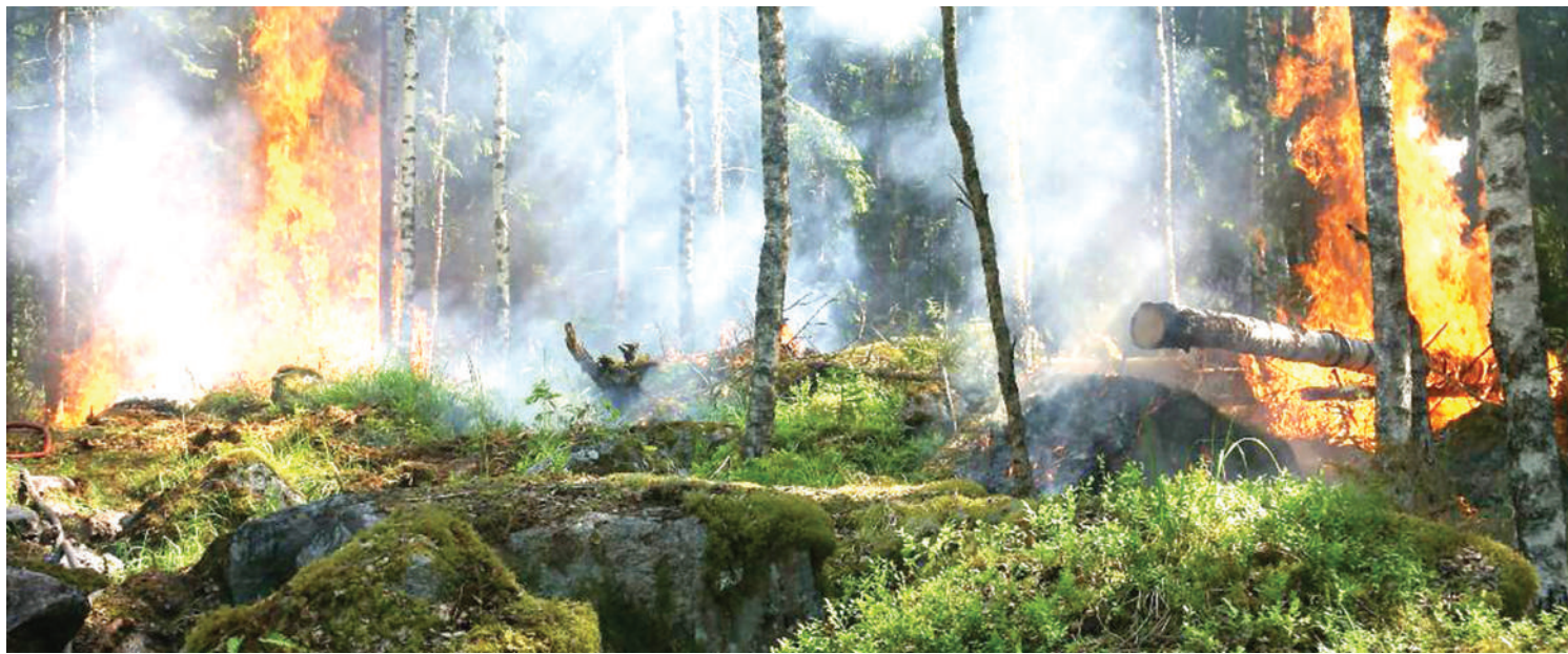
Hali halisi ya maliasili zinazochomwa mkoani Songwe.