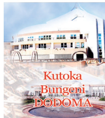
Habari zote na Augusta Njoi, DODOMA

Hata hivyo, alisema kutokana na mwenendo huo, matarajio ni kwamba lengo la ukuaji wa mikopo kwa sekta binafsi la asilimia 10.6 kwa mwaka 2021/22 litafikiwa na hivyo kuchangia uwekezaji, uzalishaji na kuongeza ajira nchini.