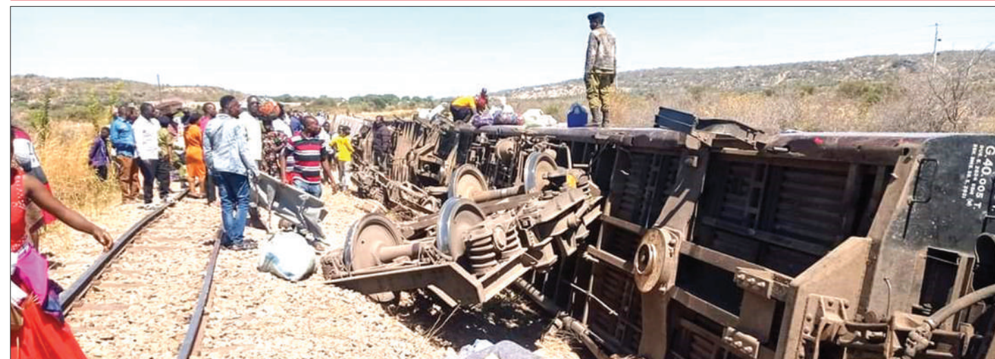
Baadhi ya abiria wa treni iliyokuwa ikitoka Kigoma kwenda Dar es Salaam wakiwa nje ya mabehewa baada ya kupata ajali eneo la Malolo mkoani Tabora jana. Abiria wanne walipoteza maisha na wengine 132 kujeruhiwa.