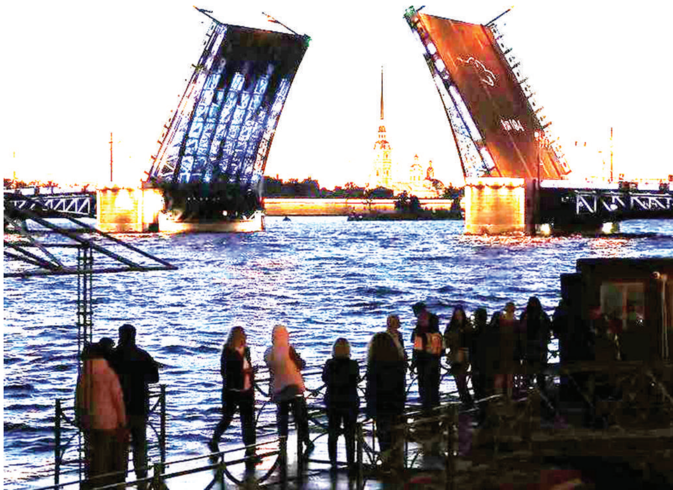
Watalii wakifurahia kutazama kile kiitwacho ‘Usiku Mweupe’, katika kituo cha kihistoria cha mji wa St. Petersburg jana, tukio hilo huvutia maelfu ya watalii wanaotembelea nchi ya Russia.

Wawili hao walikuwa wameahidi kupambana na ufisadi serikalini. BBC