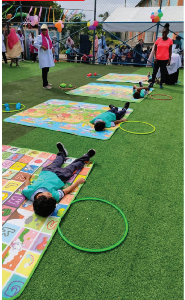
Baadhi ya wanafunzi wa Shule ya Awali ya Feza Zanzibar, wakishiriki michezo tofauti katika Bonanza maalum lililoandaliwa shuleni hapo kwa lengo la kuwajenga watoto kiafya ili baadaye kuwa fiti kushiriki mashindano tofauti ya michezo ndani na nje ya nchi