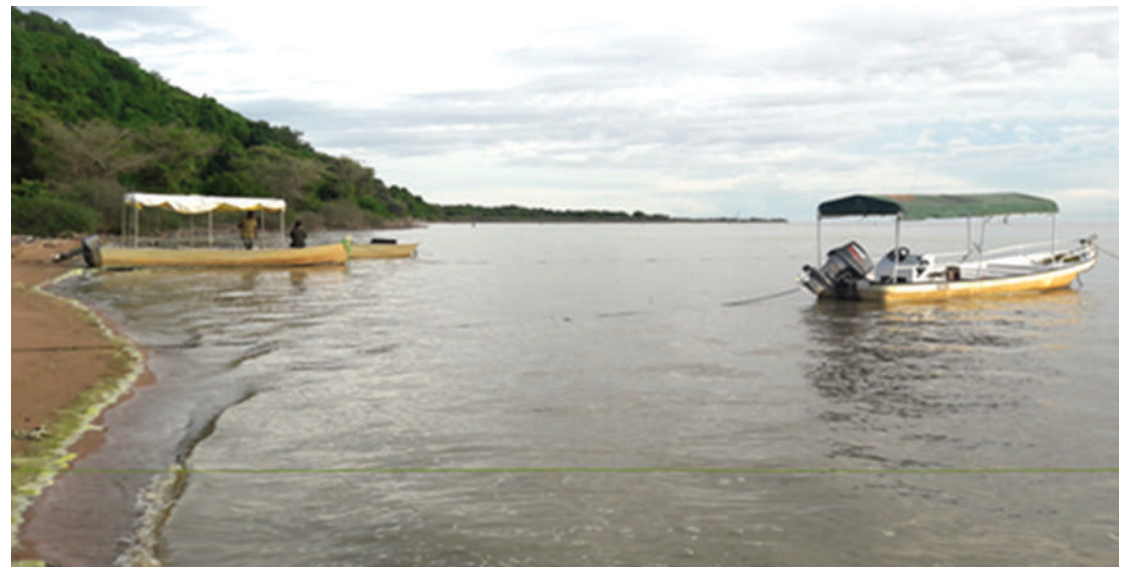
Mandhari ya mazingira ya Ziwa Rukwa.

Mwandishi anapatikana kwa mawasiliano: baruapepe; yassin.ibrahimu@yahoo.com na simu + 255 766 936392 na 0718 382817.