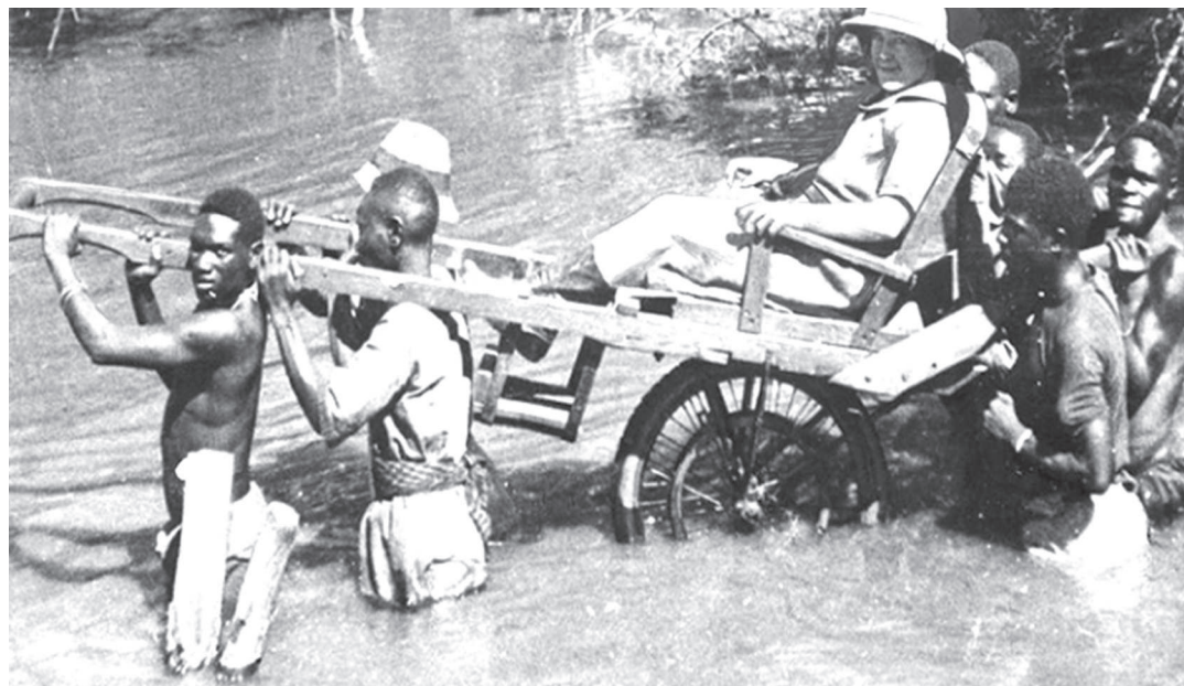
Ndivyo ilivyo saikolojia na falsafa ya maisha ya kikoloni, ilivyoangukia hatima ya afya.

Kabla ya ujio wa wakoloni wa Kizungu barani Afrika, historia inao-nyesha amani ilitawala na maadili ya Afrika yakafuatwa na Waafrika wenyewe.