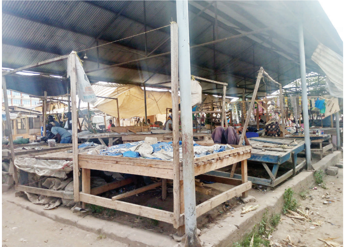
Baadhi ya meza za wafanyabiashara ziko wazi katika soko hilo.