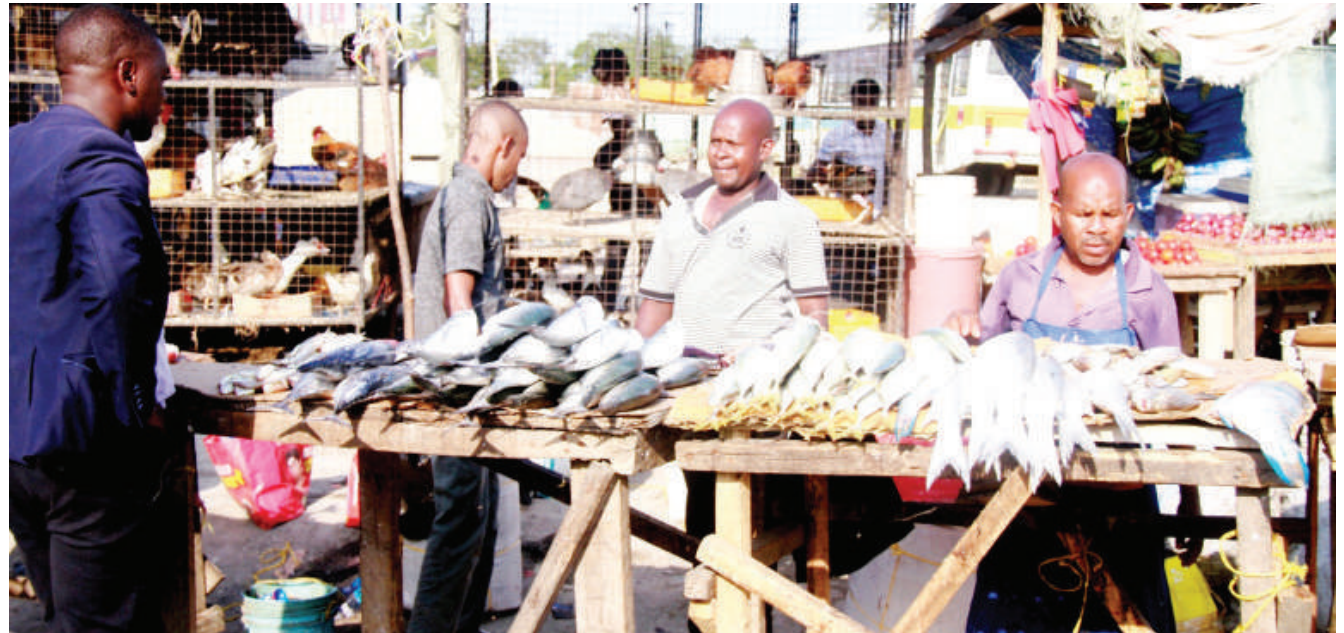
Wachuuzi wa samaki wakisubiri wateja katika eneo la Ukonga Banana, jijini Dar es Salaam jana. Samaki mmoja anauzwa kwa bei ya 5,000/- hadi 30,000/- kulingana na ukubwa wake.

Vilevile, Nyandahu alitoa wito kwa wananchi kuacha kujichukulia sheria mkononi huku akibainisha mpango mkakati wa Jeshi la Polisi kuwa hatua za kisheria zitachukuliwa kwa yeyote atakayevunja sheria huku upelelezi wa tukio hilo ukiendelea ili kubaini undani wake.