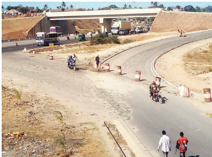
Barabara ya mchepuko inayopita juu ya daraja la magari eneo la Mbezi Mwisho Manispaa ya Ubungo. Dar es Salaam, ikionekana kukamilika ambapo inatarajiwa kupunguza msongamano wa magari katika Barabara ya Morogoro.

Lwiza Mchilasi, mmoja wa wauzaji wa mbolea hizo alisema: "Kutokana na madeni ya nyuma serikali kushindwa kulipa, kampuni nyingi zinaogopa kutoa mbolea hizo. Tatizo ni mfumo yaani madeni ya nyuma, lakini wakala akija na ana vigezo tunamhudumia kama kawaida. Kuna haja ya serikali kulitazama hili kwa upya ili kampuni ziwe na imani nayo."