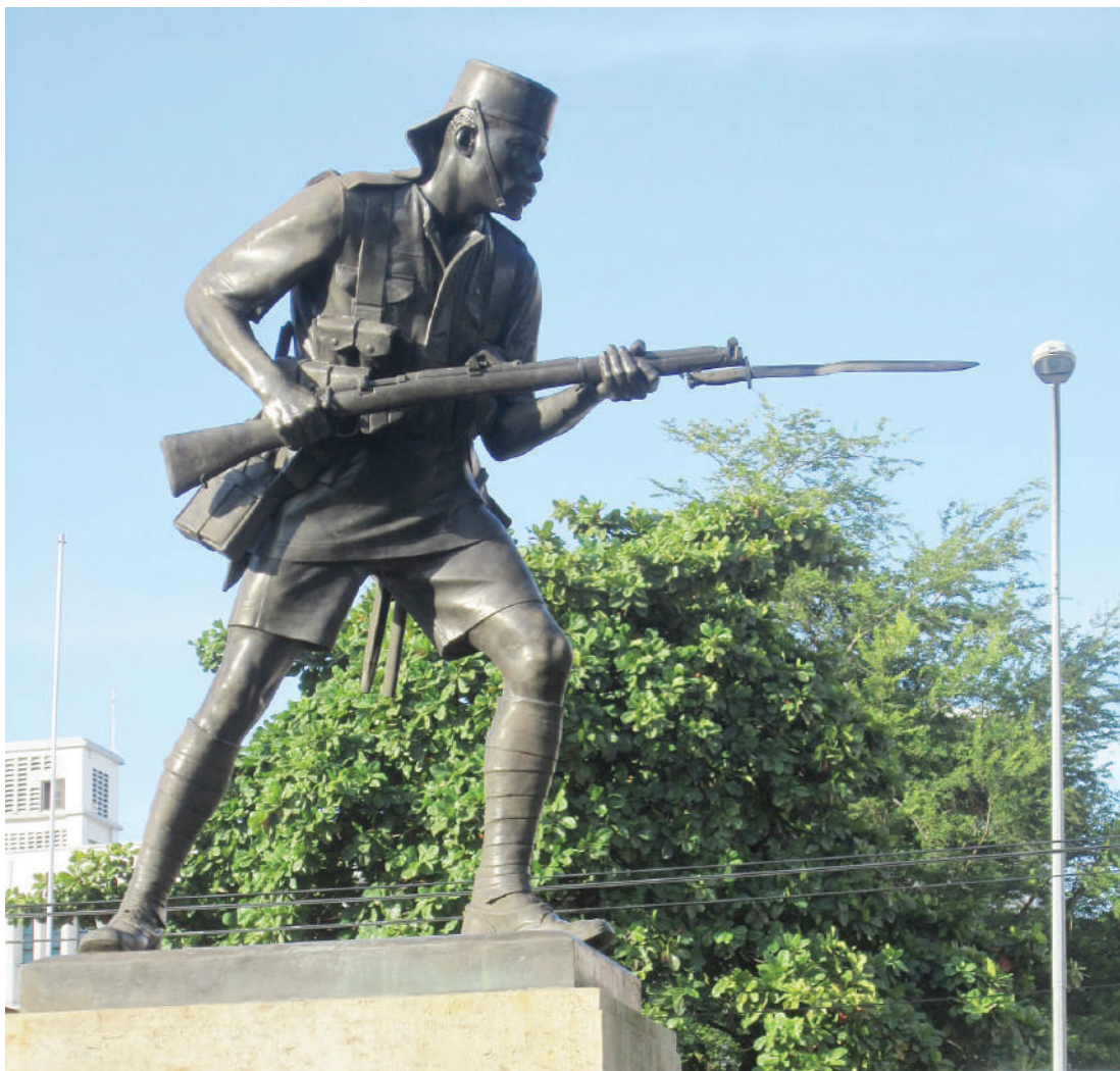
Sanamu ya askari mweusi kuwakilisha mwafrika aliyepigana vita kuu ya kwanza ya dunia lililopo maeneo ya Posta Dar es Salaam maarufu kama 'picha ya Bismin'.