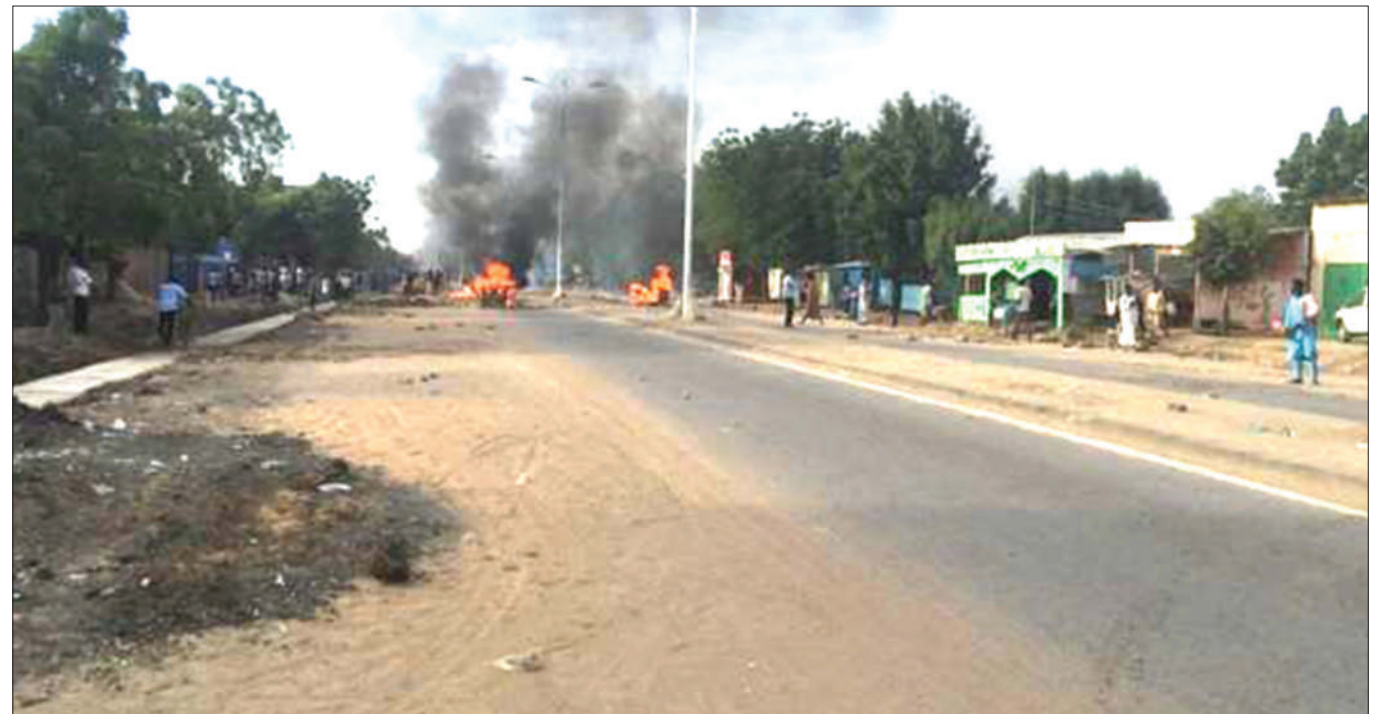
Moto unaoambatana na moshi ukionekana juu ya barabara baada ya waandamanaji kuweka kizuizi kwa kuchoma matairi wakati wa maandamano nchini Chad.