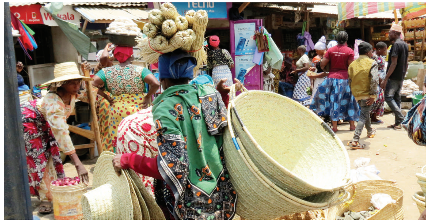
Mama mchuuzi vikapu, kofia na fagio, akisaka wateja wa bidhaa zake katika eneo la kituo cha daladala cha Sabasaba, jijini Dodoma jana. Kikapu kimoja alikiuza kwa bei ya 3,000/-, kofia 2, 500/- na fagio 1,500/-

Mkurugenzi wa Idara ya Habari na Msemaji Mkuu wa Serikali, Gerson Msigwa alisema serikali inafanya kazi kubwa kuandaa wanasayansi kutoka shule za msingi mpaka shahada za kwanza ambapo kwa sasa inajenga shule moja ya sekondari ya masomo ya sayansi kwa kila mkoa kwa ajili ya wasichana.