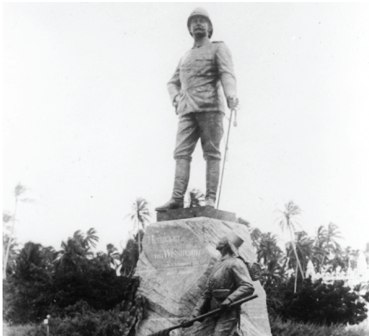
Sanamu ya Gavana wa zamani wa Ujerumani nchini, Herman Von Wissman kabla ya kuwekwa la sasa.

Baada ya Vita Kuu ya Kwanza ya Dunia iliyopiganwa kuanzia mwaka 1914 hadi 1918, Waingerere walishinda na kuchukua koloni la Tanganyika, ndipo mwaka 1916 sanamu la Bwana Von Wissman liliondolewa na likawekwa Sanamu la sura ya askari mweusi Mwafrika katika sare ya kijeshi ya King's African Rifles wakati wa Vita Kuu ya Kwanza ya Dunia (1914-1918) akishika bunduki yenye kisu cha kando na kutazama upande wa bahari mwaka 1927 Hii ilikuwa ni kama ishara ya kuthamini Waingerere kutambua mchango wa Askari Waafrika waliopigana kwenye Vita hivyo. Sanamu imeidumu hadi leo hapo panapoitwa Askari Monument Garden, Posta Dar es Salaam.