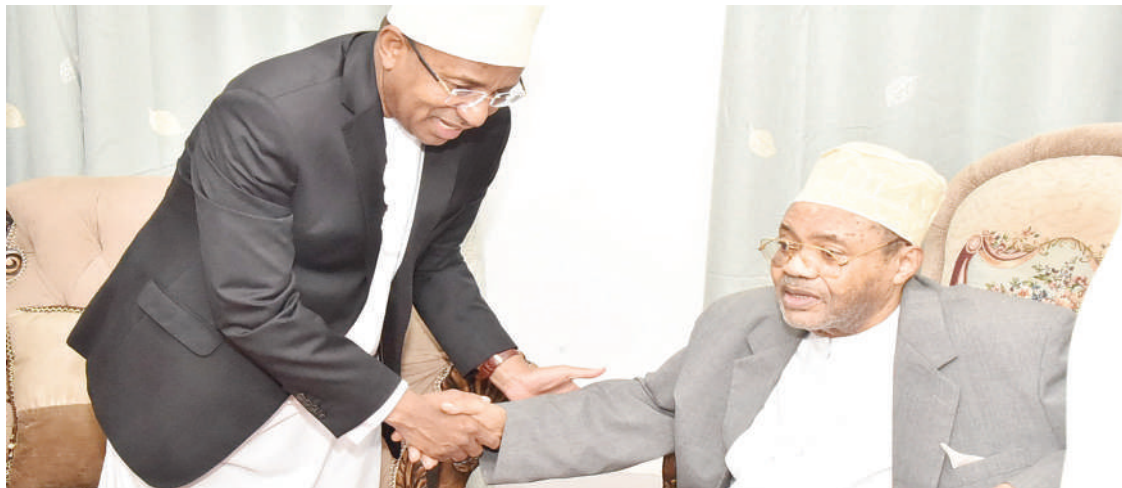
Rais wa Zanzibar Alhaj Dk. Hussein Ali Mwinyi (kushoto), akisalimiana na Rais mstaafu wa Zanzibar, Dk. Salmin Amour Juma (Komando), alipofika nyumbani kwake, Kijiji cha Kidombo, Mkoa wa Kaskazini Unguja jana, baada ya kujumuika na viongozi na waumini wa Dini ya Kiislamu katika Hitma na Dua maalum ya kuwaomba Wazee.