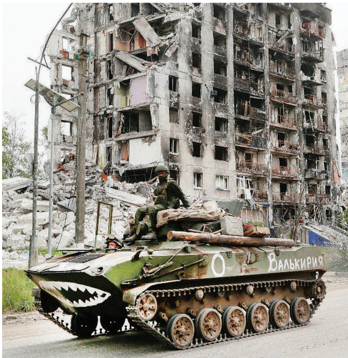
Kifaru cha Russia kikiwa katika mji wa Severodonetsk baada ya kupata udhibiti kamili jana.

Akizungumza kabla ya kuanza kwa mkutano wa kilele wa viongozi wa mataifa saba yaliyopiga hatua kiviwanda ya G7m katika jimbo la Bavaria, kusini mwa Ujerumani, Michel alisema serikali ya Russia inatumia chakula kama silaha ya kivita isiyo na sauti.