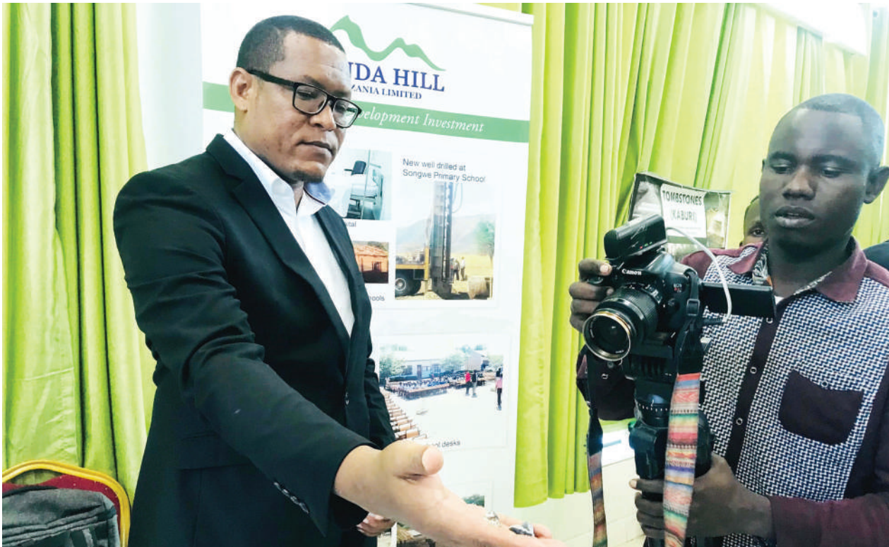
Mwakilishi wa Kampuni ya Panda Hill Tanzania inayojihusisha na uchimbaji wa madini wa Niobium mkoani Mbeya akiwaonyesha wanahabari sampuli za madini hayo jana, katika kongamano la nishati na madini linalofanyika jijini Mbeya.