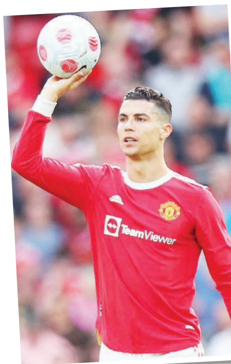
#6 Cristiano Ronaldo - Dola Mil. 55

Makala haya inawatazama wanamichezo sita ambao walipata mapato mengi zaidi kutokana na mikataba ya nje ya uwanja kwa msimu wa 2021-22.