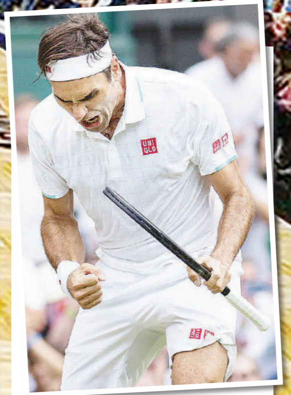
12 iliyopita, lakini ni dola milioni 0.7 pekee zilizopatikana kutokana na kucheza tenisi.

Federer, mchezaji wa tenisi anayelipwa zaidi duniani alilingiza dola milioni 90.7 katika miezi