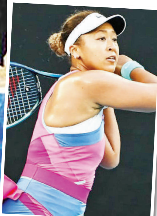
#4 Naomi Osaka - Dola Mil 58

Messi, ambaye aliweka rekodi ya kutwaa Ballon d'Or ya saba mwaka wa 2021, pia ni mwanamichezo wa kwanza kuwa balozi wa kampuni ya Hard Rock International. Anaendelea kuwa mmoja wa wanamichezo wenye ushawishi mkubwa kwenye sayari hii licha ya kutokuwa na msimu mzuri wa kwanza kule Paris Saint-Germain.