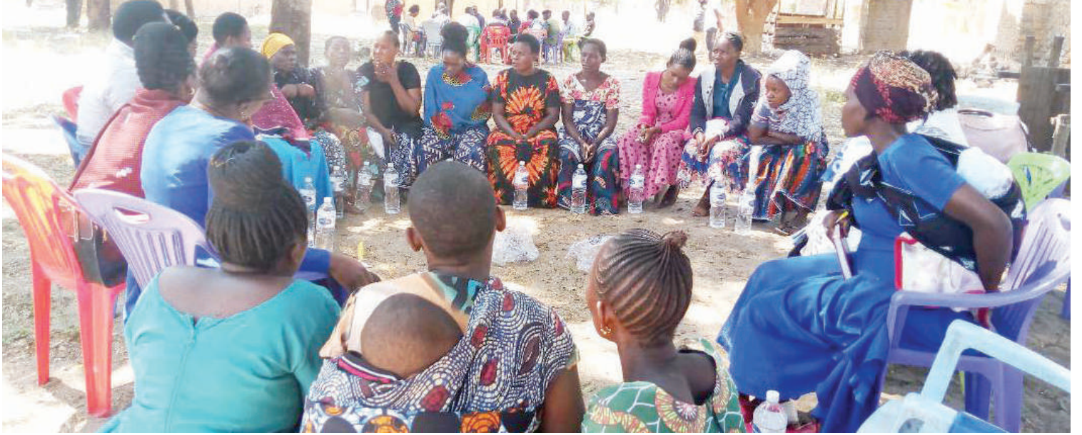
Wazazi wa kike walipokuwa katika mdahalo.

"Mnapowaficha, wenzenu wakienda huko nje wanafanya na wengine wanapata matatizo, bora umwambie mwanangu sikwambii ufanye ila ikitokea umefanya tumia kinga."