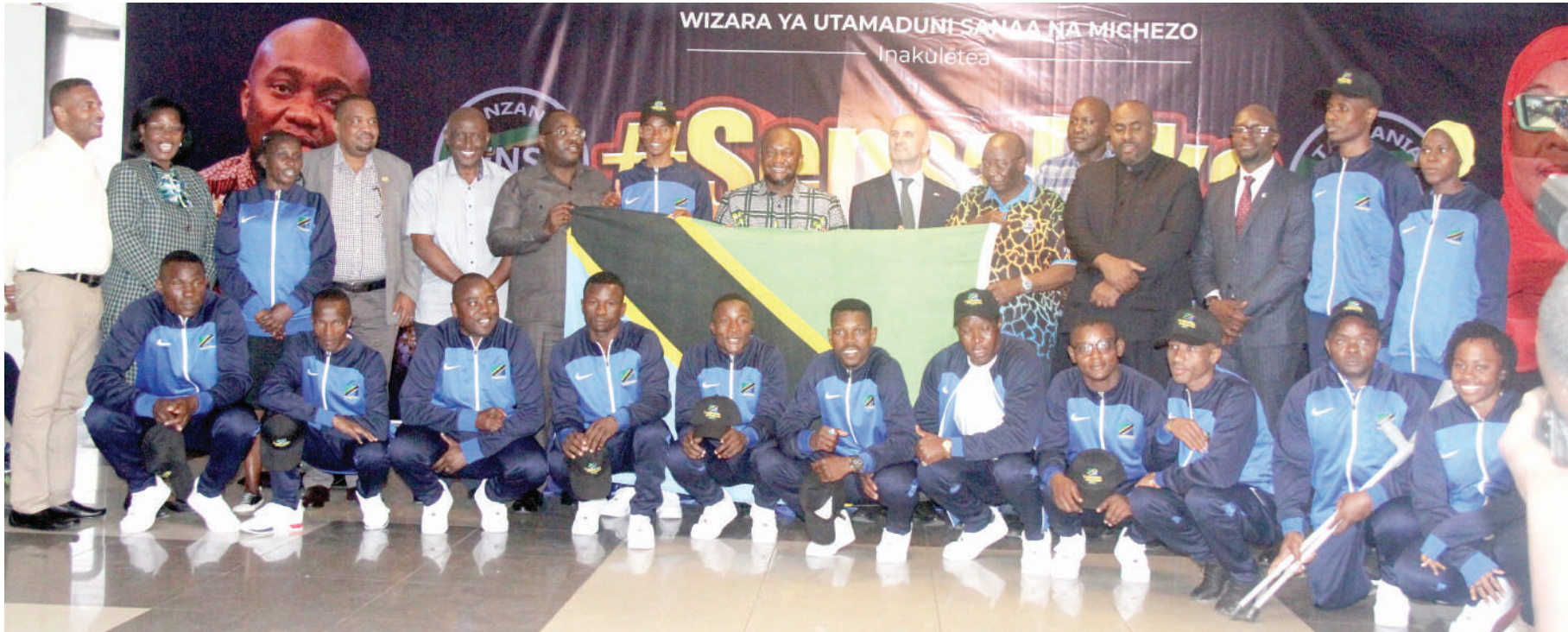
Waziri wa Utamaduni, Sanaa na Michezo, Mohammed Mchengerwa (katikati), akikabidhi bendera ya Taifa kwa wanariadha wanaotarajia kwenda Uingereza kushiriki mashindano ya Jumuiya ya Madola.