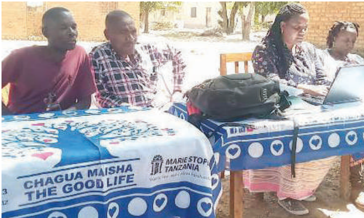
Katikati ni Kaimu Mratibu wa Kitengo cha Mama na Mtoto wa Halmashauri ya Wilaya ya Mlele, akitoa elimu ya afya ya uzazi kwa wazazi wa kike na kiume (hawapo pichani).