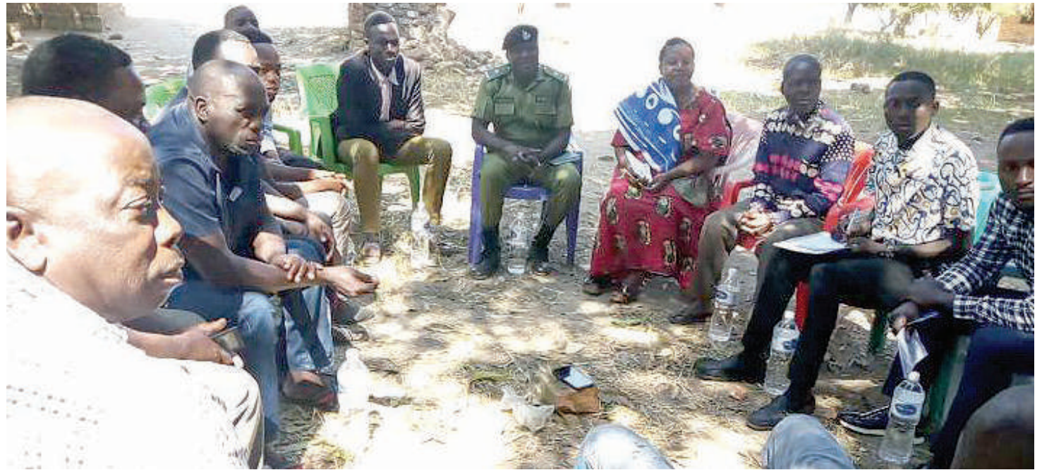
Vijana wakieleza changamoto zao na kupewa elimu ya afya ya uzazi na ukatili wa kijinsia kijijini Mapili, wilaya ya Mlele, Katavi.

Mtindo uliotumika, kila kundi kijinsia na umri lilipewa faragha yake, wakihofu kuwachanganya kungewanyima uhuru, vijana kuwaogopa wazee kueleza yao na wazee wakisita kunena mbele ya vijana wao, vivyo hivyo wake kwa waume katika changamoto za malezi walio nayo kwa ujumla. Kupitia mbinu hizo, wadau wa