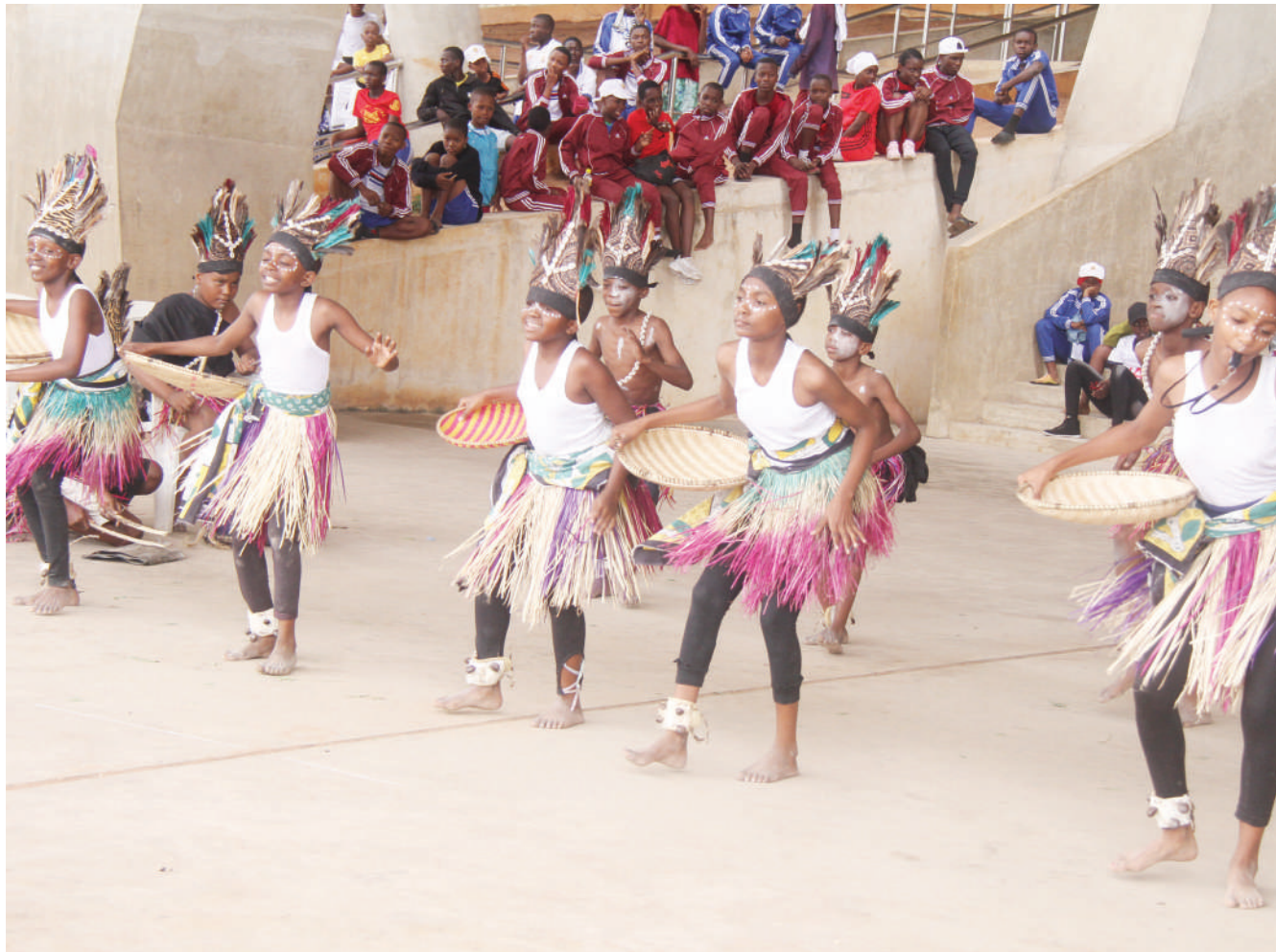
Wanafunzi kutoka shule mbalimbali za Manispaa ya Ubungo jijini Dar es Salaam wakifanya mazoezi ya kucheza ngoma kwa ajili ya kujiandaa na michezo ya UMISETA itakayofanyika mwezi ujao mkoani Tabora.

Hata hivyo, kuna taarifa kuwa kutokana na mchango wake mkubwa alioutoa kwa timu hiyo, huenda akapata ajira rasmi kwani timu hiyo inamilikiwa na Jeshi la Magereza Tanzania.