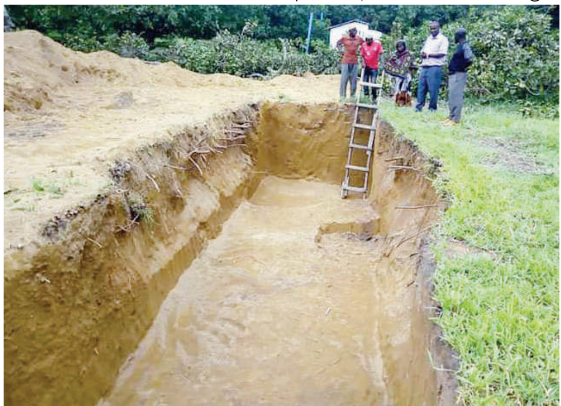
Vyoo vya shule katika sura tofauti, vilivyokamilika na vilivyo katika hatua ya ujenzi.