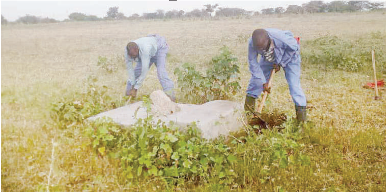
Shughuli za uhamishaji kaburi, eneo la Nyakabindi, Bariadi, zikiendelea.