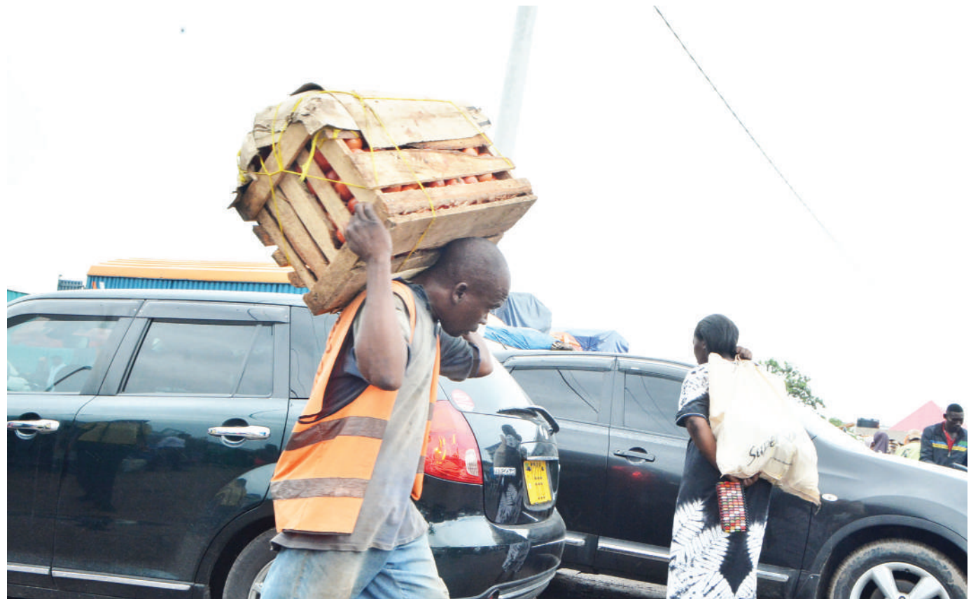
Kijana akimbebea mteja tanga la nyanya katika Soko la Mabibo, jijini Dar es Salaam jana. Gharama ya kulitoa ndani soko hadi nje ni Sh. 1,000.

Aliwataka maafisa hao kuise-mea wizara kwa nguvu moja ili kufikia malengo ya kuongeza idadi ya watalii nchini.