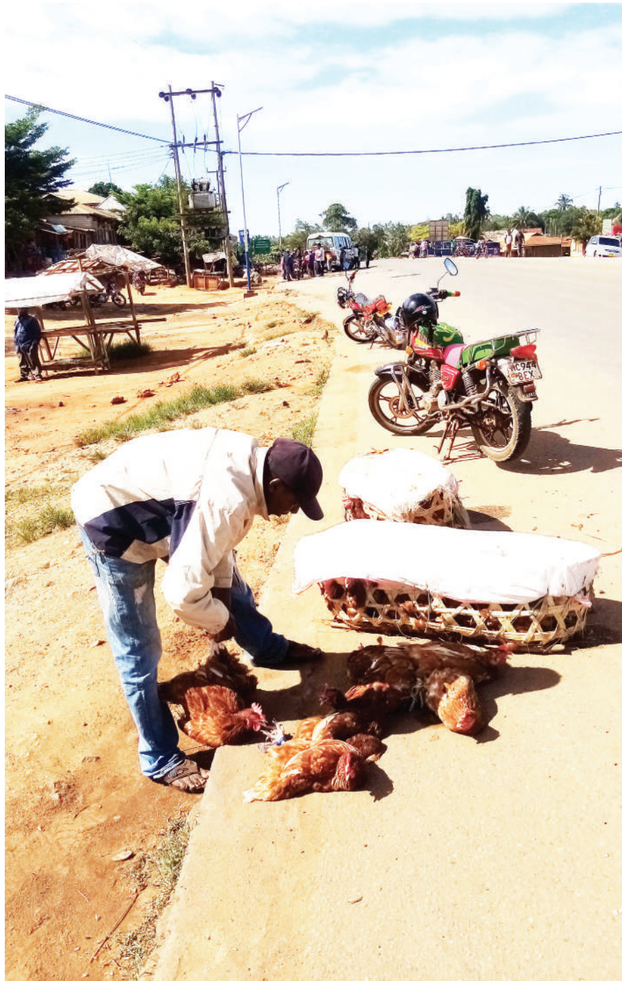
Muza kuku akiwatoa kwenye tanga jana kwa ajili ya kuwauzia wateja Mtaa wa Majengo Shimoni wilayani Muheza, mkoani Tanga. Mmoja aliuza kwa Sh. 6,000.

Kumiliki nyara za serikali ni kinyume cha kifungu cha 86 (1), 2(b) cha Sheria ya Uhifadhi wa Wanyamapori Na. 5 ya Mwaka 2009, kikisomwa pamoja na Aya ya 14 ya Jedwali la Kwanza na Kifungu cha 57 (1) na 60 (2) cha Sheria ya Uhujumu Uchumi, Sura ya 200 iliyoifanywa Marejeo Mwaka 2002.