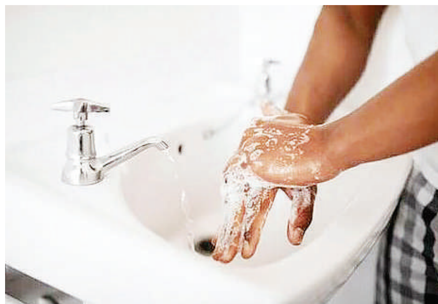
Mtu akinawa mikono.

Kwa muktadha uliopo inaelezwa kuwa watu wanashindwa kunawa ikiwa yapo