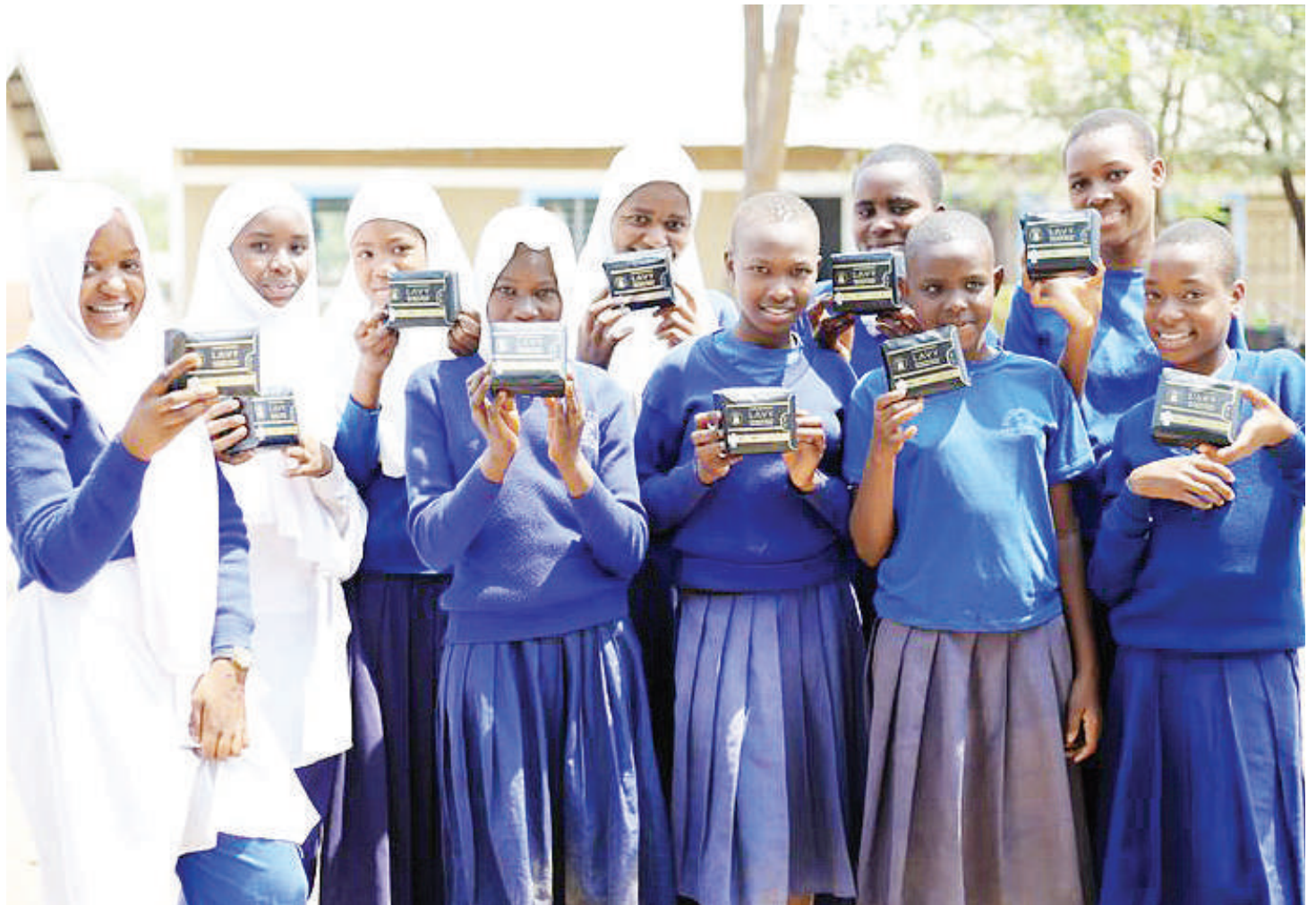
Wanafunzi wa mkoani Shinyanga wakiwa na moja ya huduma walizopewa kuwasitiri masomoni.

“Baada ya kujengewa chumba maalumu cha hedhi shuleni hapa na uwekaji wa Taulo za kike kwenye chumba hicho, hakuna utoro tena kwa wanafunzi wa