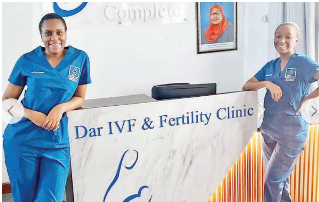
Wataalamu wa afya, katika kituo kinachotoa huduma ya uzazi kwa kwa njia ya IVF, jijini Dar es Salaam.

"Tatizo linapofika kwa wataalamu na mnakuta hamuwezi kullitua, inabidi mtu atoke aende