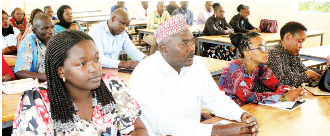
Wajumbe wa kamati ya kupinga ukatili dhidi ya wanawake na watoto (MTAKUWWA) katika kata za Tinde na Masengwa wilayani Shinyanga wakiwa kwenye kikao cha kupanga mikakati na kupitisha maadhimio ili kukabiliana na vitendo vya ukatili wa kijinsia ikiwamo mimba na ndoa za utotoni, kikao hicho kiliandaliwa na Shirika la Women Elderly Advocacy and Development Organization (WEADO) juzi.