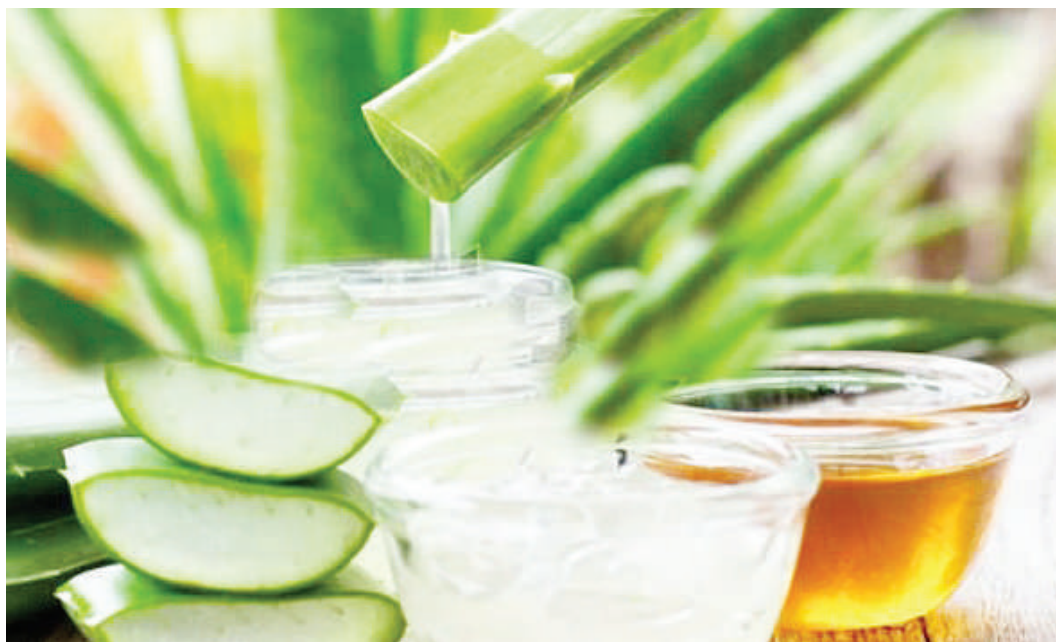
Mmea aloevera katika sura tofauti za matumizi.