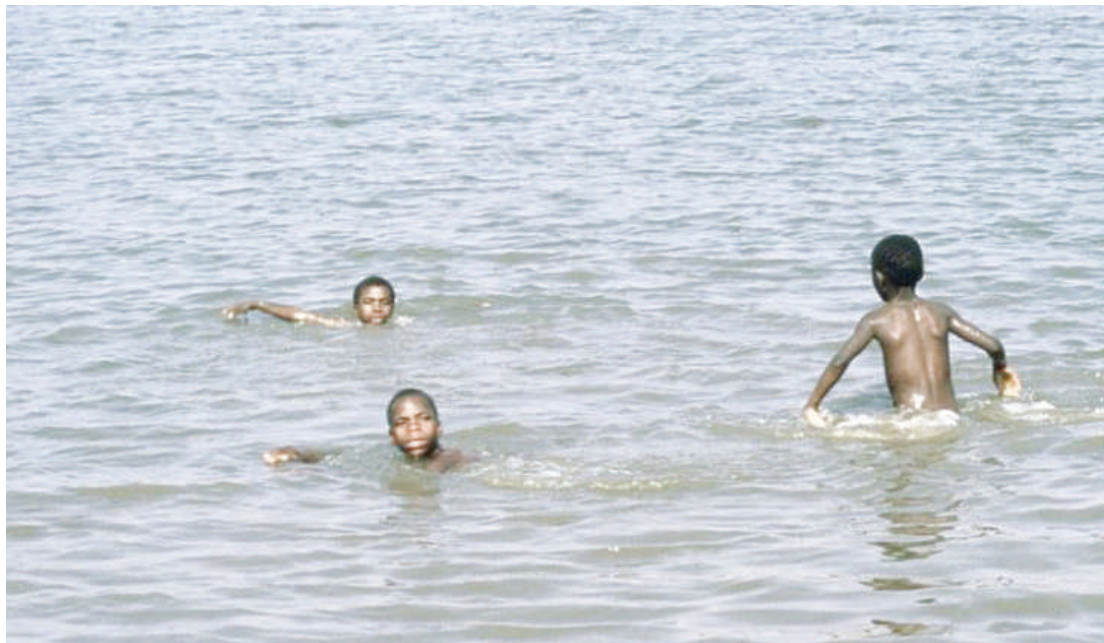
Picha mbili zenye mazingira rafiki yanayokaribisha maradhi kichocho.

wanatajwa kuwa ni watoto wenye umri wa kwenda shule, ambao hawajaanza shule na watu wazima, sababu kuu ni kugusa maji.