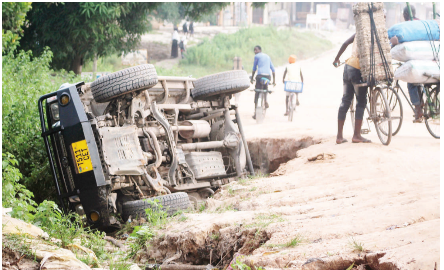
Gari lenye namba za usaji T 511 CET, likiwa limeanguka katika mtaro, baada ya dereva wake kushindwa kulimudu katika eneo la Kivule, jijini Dar es Salaam jana.

Alisema serikali ilichukua uamuzi wa kufuta ada hiyo baada ya kutafakari juu ya magari mengi ambayo yalikuwa mabovu na hayatembei. Aidha, serikali ilitoa msamaha wa kodi, riba na adhabu zinazoambatana na madeni yote ya ada hiyo yaliyolimvikizwa miaka ya nyuma.