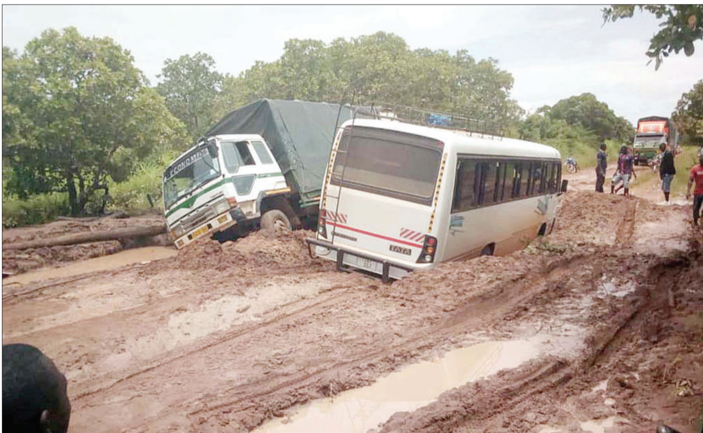
Magari yakiwa yamenasa katika tope, eneo la Kiangara, katika barabara ya Liwale - Nachingwea, mkoani Lindi juzi, kufuatia mvua zinazoendelea kunyesha maeneo mbalimbali nchini, ambazo zimesababisha maafa na uharibifu wa miundombinu ya barabara: PICHA: MPIGA PICHA WETU

"Bajeti ya sekta ya elimu ni halisia na imejikita kwenye mahitaji halisi ya Watanzania, bajeti za huko nyuma zilikuwa zimejaa makokoro mengi na kulikuwa na fedha za kusafiri ovyo nje, fedha za chai ambazo zilikuwa hazisaidii chochote na upigaji mwingine," alisema.