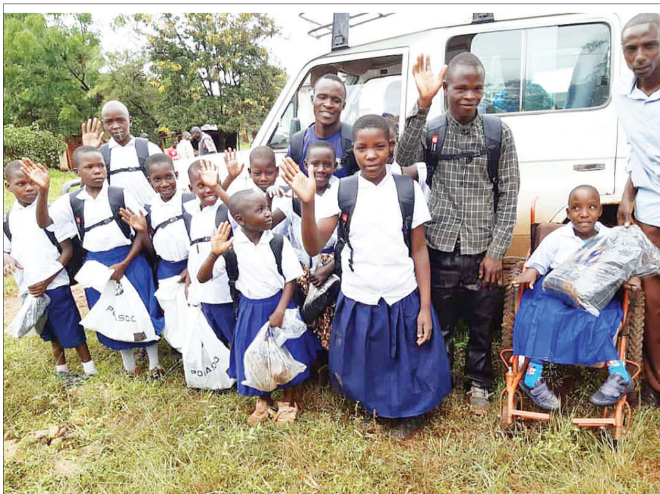
Baadhi ya wanafunzi walemavu na watu wazima wenye tatizo hilo kutoka Kata ya Makojo, wakiwa na baadhi ya vitu walivyopewa msaada na Mradi wa kusaidia watu wenye ulemavu na wanafunzi wa BMZ wa serikali ya Ujerumani, katika ofisi zake katika Hospitali Teule ya Shirati wilayani Rorya mkoani Mara juzi. BMZ imetoa vifaa vya shule na vyakula vyenye thamani ya Sh. milioni 16 kwa kata 10 za wilaya ya Musesa.