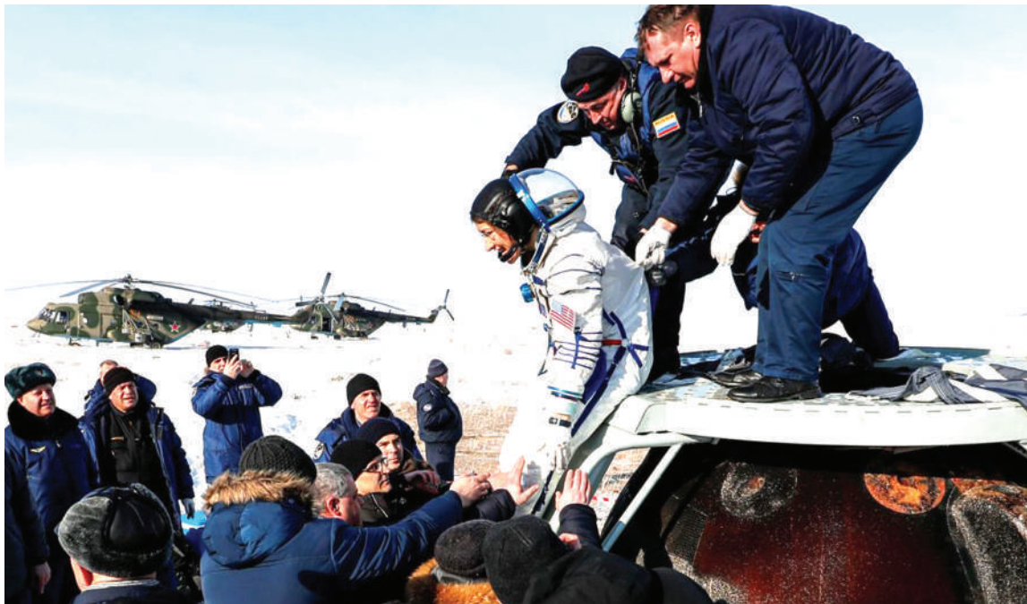
Wataalam wa Wakala wa Anga ya Juu ya Marekani (NASA), wakimsaidia mwanaanga pekee mwanamke, Christina Koch, muda mfupi baada ya kutua ardhini na chombo cha Urusi cha Soyuz MS-13, kusini mwa Zhezkazgan katika mkoa Karaganda nchini Kazakhstan.

"Ninataka kusema tena kwa raia wa Marekani ninaomba radhi kwa kile nilichokisema na kwa mzigo mkubwa waliobeba wabunge na raia wa Marekani kwa ujumla," Bwana Clinton alieleza. BBC