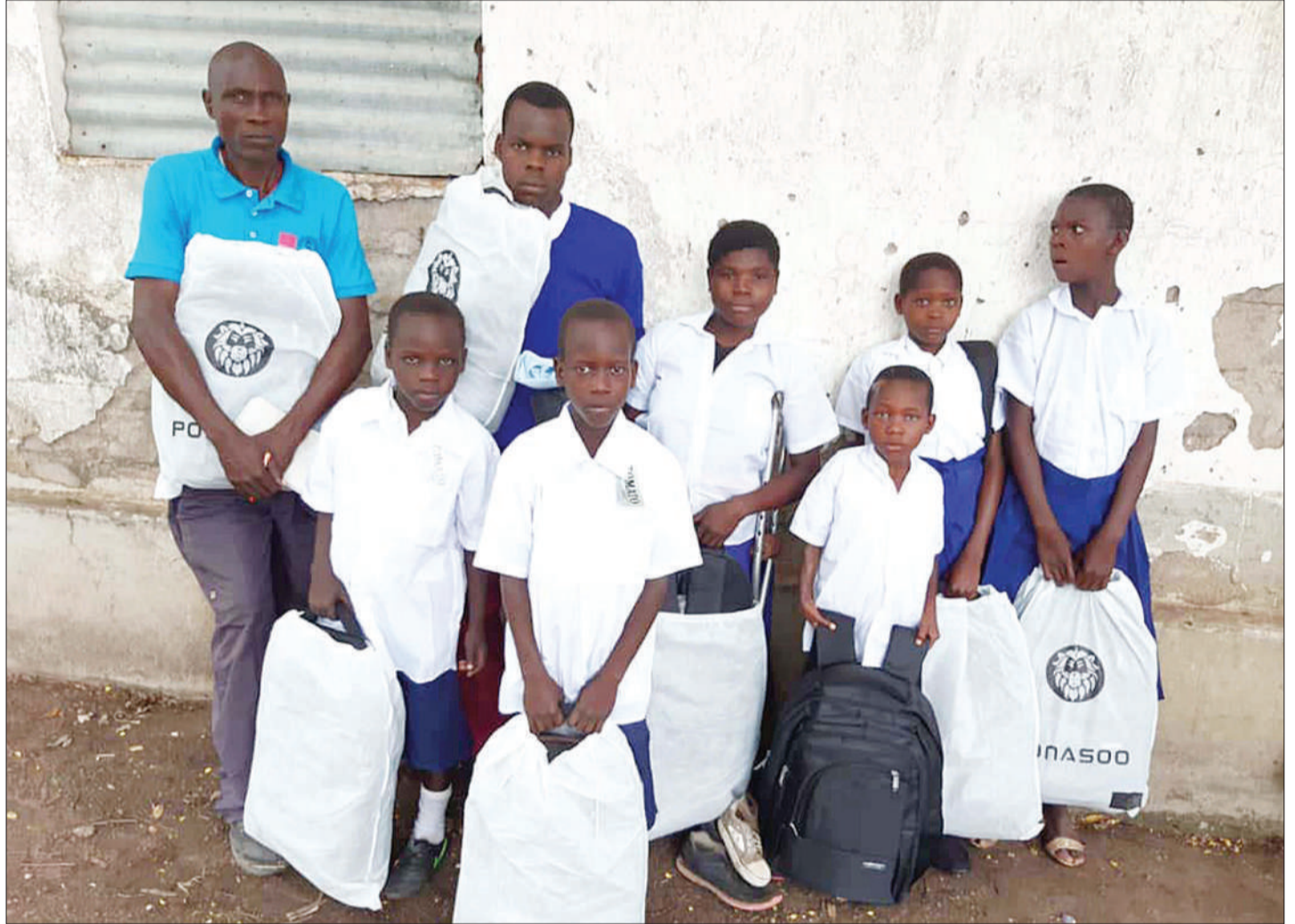
Baadhii ya walemavu wa Kata ya Makojo waliopata msaada.