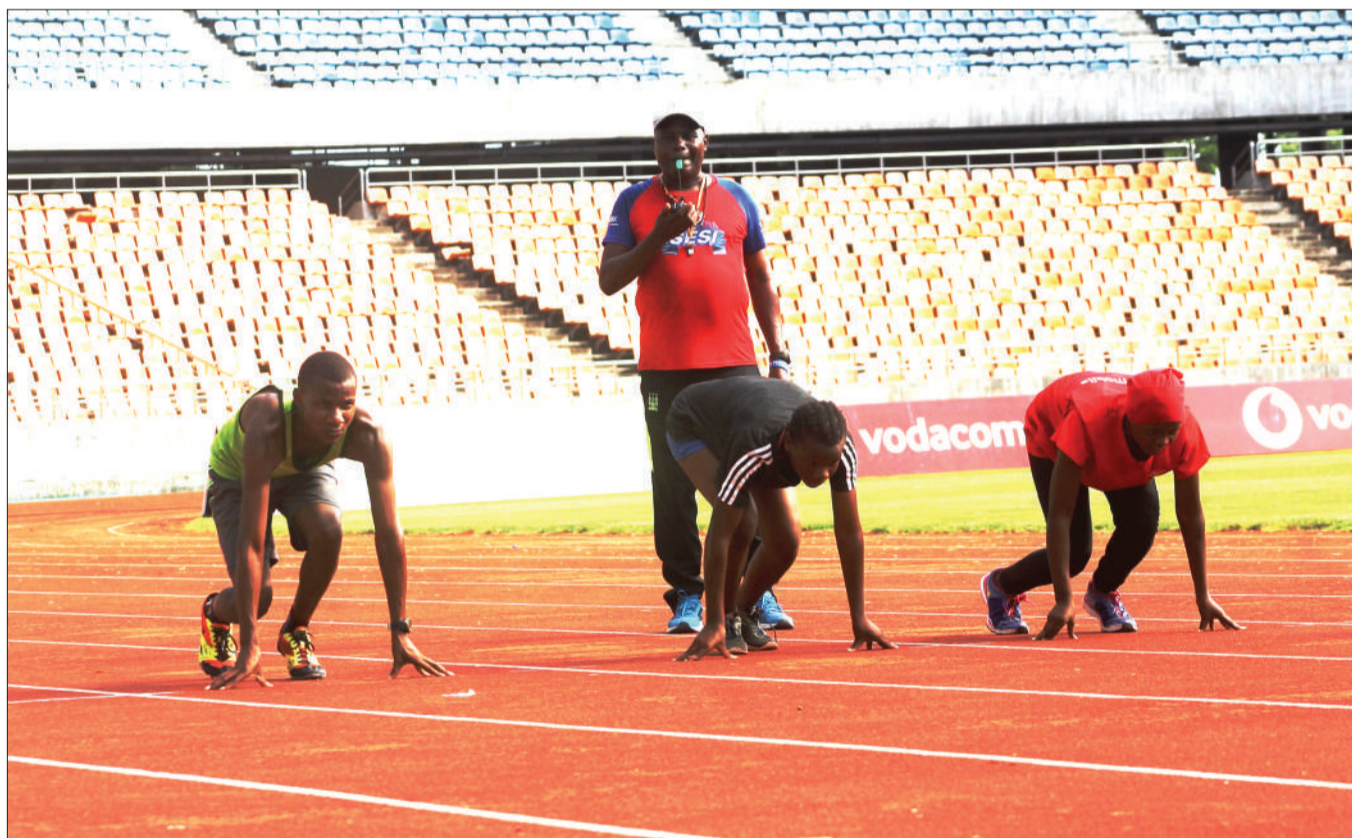
Wanariadha wa Kituo cha Mlimani wakiwa katika mazoezi kwa ajili ya kujiandaa na mashindano yatakayofanyika baadaye mwezi huu katika Uwanja wa Taifa jijini Dar es Salaam jana.

Azam FC yenye pointi 38 iko katika nafasi ya pili kwenye msimamo wa ligi wakati KMC walioko katika nafasi ya 15 wana pointi 20 mkononi wakati vinara na mabingwa watetezi wa ligi hiyo ni Simba yenye pointi 50.