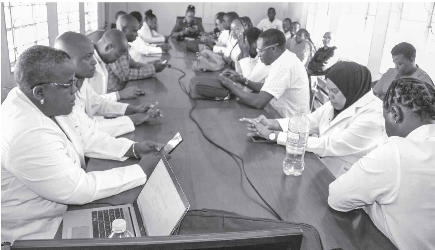
Kambi ya madaktari bingwa 30 wa Rais Samia Suluhu Hassan wakiwa wamewasili mkoani Shinyanga tayari kwa kutoa huduma za matibabu ya kibingwa kwa wakazi wa mkoa huo juu, ambao watatawanyika watano watano katika halmashauri zote.

Walisesema licha ya kuboresha huduma za afya nchini, Samia ameendelea kuwapelekea wananchi madaktari bingwa hadi pambazoni mwa miji.