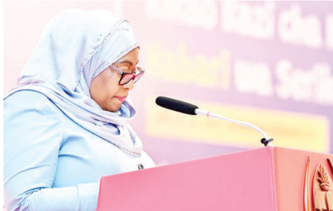
Rais Samia Suluhu Hassan akifungua Kongamano la Pili la Sekta ya Habari jana.

Rais Samia alisema, amefanya juhudi kuimarisha uhuru wa vyombo vya habari na kusisitiza ni wajibu wao kuutumia kwa