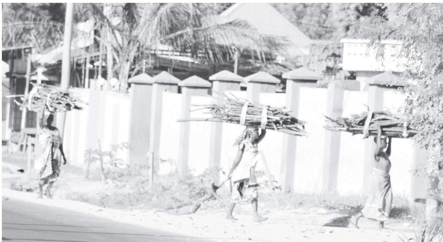
Akinamama wakitoka kutafuta kuni katika eneo la Chuo Kikuu cha Dar as Salaam jana, kwa ajili ya nishati ya kupikia majumbani.

“Wakati tunagombana na kugawana mali nusu kwa nusu hatuwaangalii watoto na ndipo ukatili unapoin-gia kwa kuwa mama amechukua hamsini zake na baba hamsini zake, watoto wanabaki katikati hatimaye wahuni wanaamua kushughulika na ile familia,” alisema.