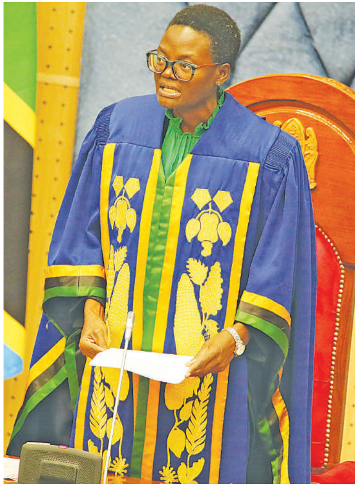
Spika wa Bunge, Dk. Tulia Ackson akitoa taarifa yake, Bungeni jijini Dodoma jana, kuhusu Mbunge wa Kisesa, Luhaga Mpina kukiuka kanuni kwa kuzungumza na maandishi wa habari, baada ya kukabidhi ushahidi wake kwa Spika wa Bunge Juni 14 mwaka huu.

“Mheshimiwa Mpina aliendelea kusisitiza kwamba waziri amedanganya Bunge na kwamba anao ushahidi kuthibitisha jinsi wizara inavyochangia kuendelea kuwa na tatizo la uhaba wa sukari nchi-