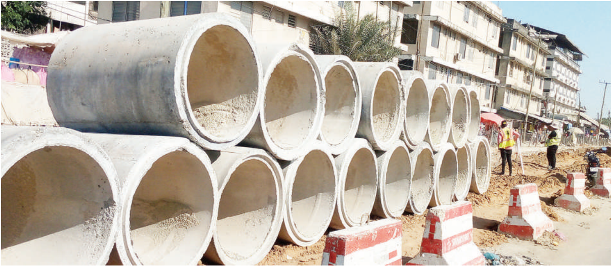
Makara-vati yakiwa yameandaliwa kwa ajili ya ujenzi unaoendelea wa miundombinu ya mabasi yaendayo haraka katika Barabara ya Uhuru, eneo la Buguruni, jijini Dar es Salaam juzi.