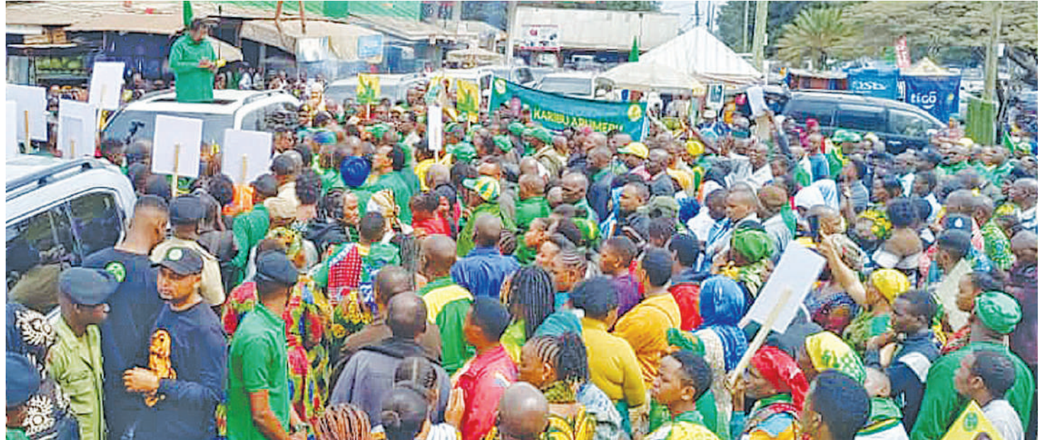
Katibu Mkuu CCM, Balozi Dk. Emmanuel Nchimbi, akisikiliza kero za wana Usa River, Arusha.

Katika kuongeza msisitizo Katibu Itikadi, Uenezi na Mafunzo Makalla, anawakumbusha viongozi wasiwe mabingwa wa kusiki-