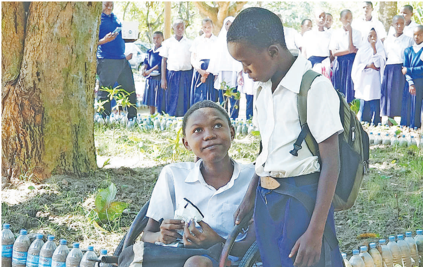
Wasichana wanatakiwa kuwa darasani kusoma badala ya kuathirika kutokana na wazazi na walezi kuhama kusaka malisho.

• Ni chanzo kuacha kusoma, ndoa na mimba utotoni