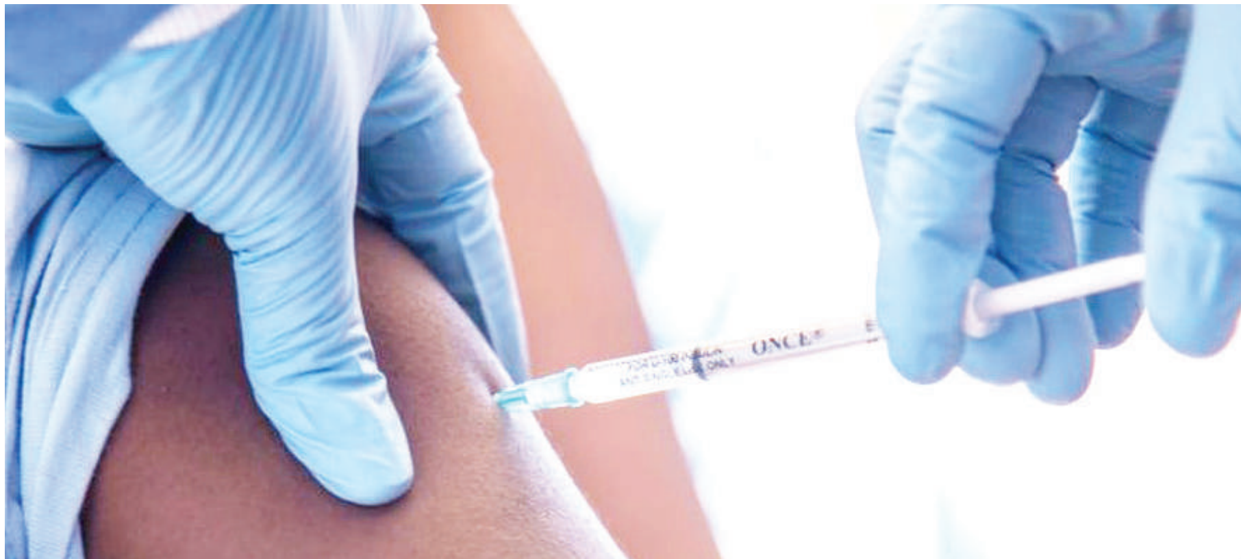
Chanjo ya saratani