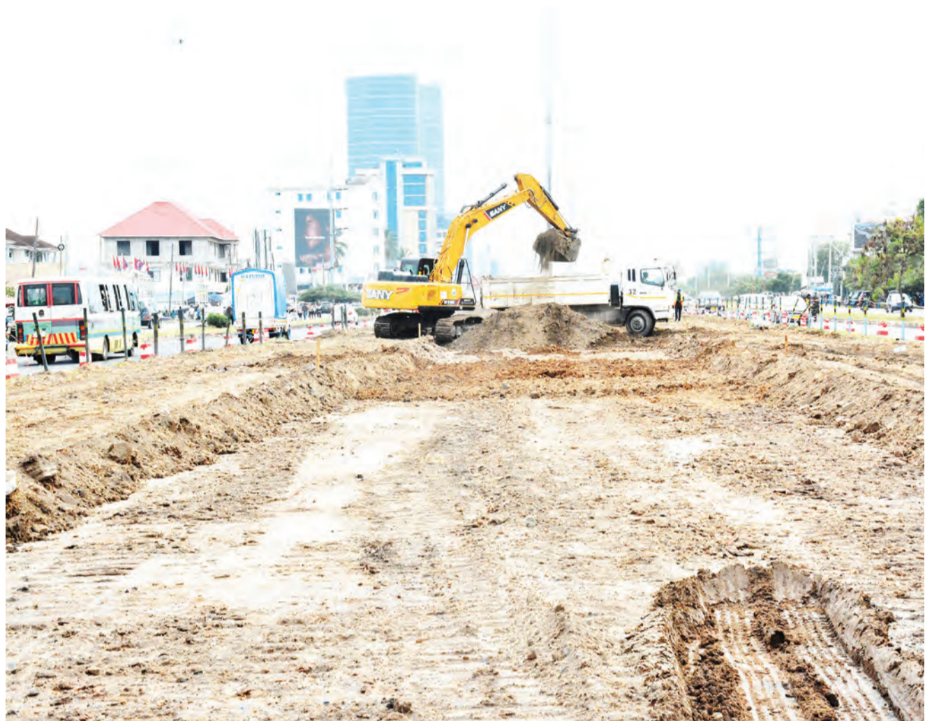
Mkandarasi akiendelea na maandalizi ya ujenzi wa miundombinu ya mabasi ya mwendokasi katika barabara ya Sam Nujoma, Dar es Salaam jana.

Taarifa za awali kutoka kwa wataalam wa afya zilieleza kuwa mabaki hayo yana zaidi ya mwaka mmoja tangu yafukiwe ardhini.