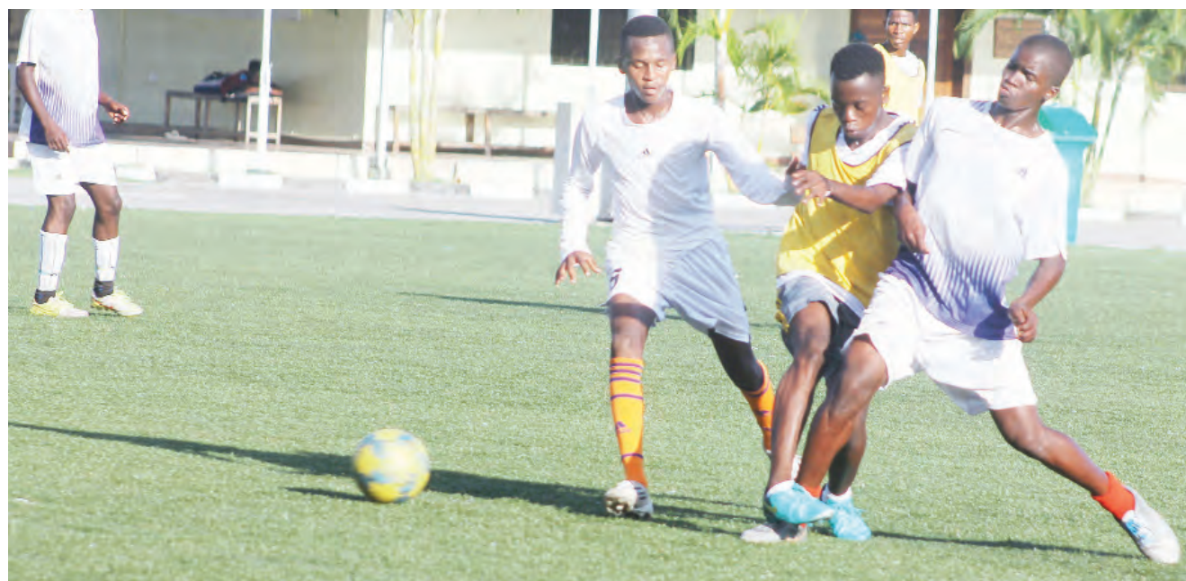
Vijana wanaolelewa katika kituo cha michezo cha Jakaya Kikwete jijini Dar es Salaam, wakiwania mpira wakati walipokuwa wakifanya mazoezi jana.