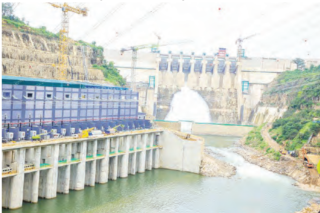
Sehemu ya mtambo wa kuzalisha umeme katika Bwawa la Mwalimu Nyerere.

Mkurugenzi Mkuu wa Shirika la Umeme Tanzania (TANESCO), akaweka wazi makadirio kuwa misimu miwili ya kipindi cha mvua, itaweza kujaza maji katika bwawa hilo.