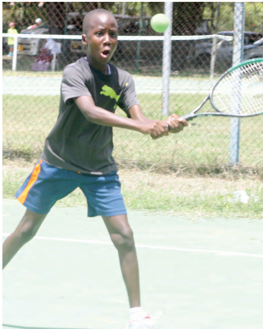
Kijana akipiga mpira wa Teni kurudisha kwa mpinzani wake wakati walipokuwa wakifanya mazoezi katika viwanja vya Gmykhana jijini Dar es Salaam juzi.

"Wachezaji wengi wameshaswili na wako tayari kupambana, tunategemea ushindani utakuwa mkubwa na tutaona vipaji vingi, tunawahimiza mashabiki wa mchezo huu kujitokeza kushuhudia mastaa wakichuana," alisema Magombe