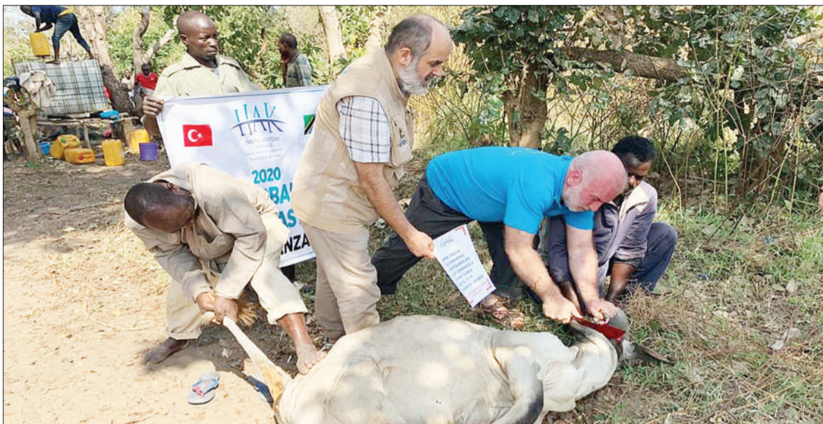
Wawakilishi wa Taasisi ya HAK Humanitarian Aid Organization wakichinja ng'ombe kusherehekea sikukuu ya Idd el Haj kwa ajili ya kuwapa sadaka ya nyama kaya maskini, kambi za wanafunzi na watu wenye uhitaji maalum, mwishoni mwa wiki Wilaya ya Rufiji mkoani Pwani.