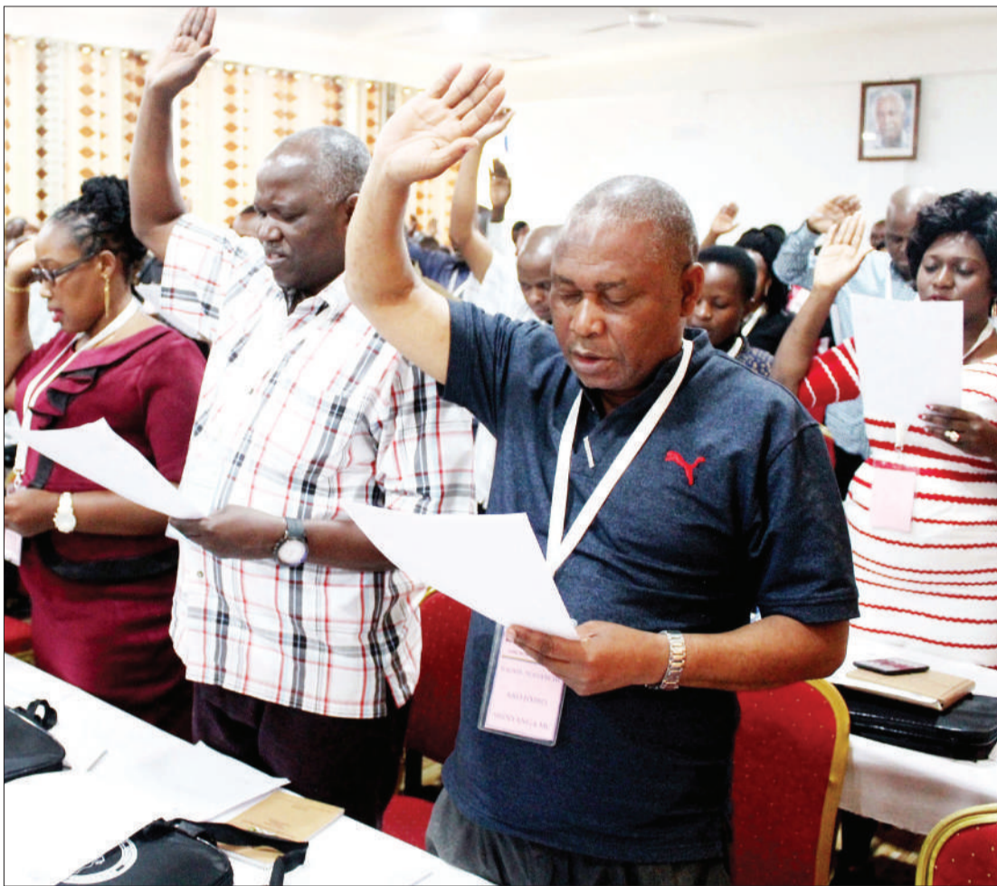
Wasimamizi wa uchaguzi mkuu unaotarajiwa kufanyika Oktoba wa mikoa ya Shinyanga na Simiyu, wakila kiapo cha utii katika kusimamia vizuri uchaguzi huo wa kuchagua madiwani, wabunge na rais, ili ufanyike kwa haki.