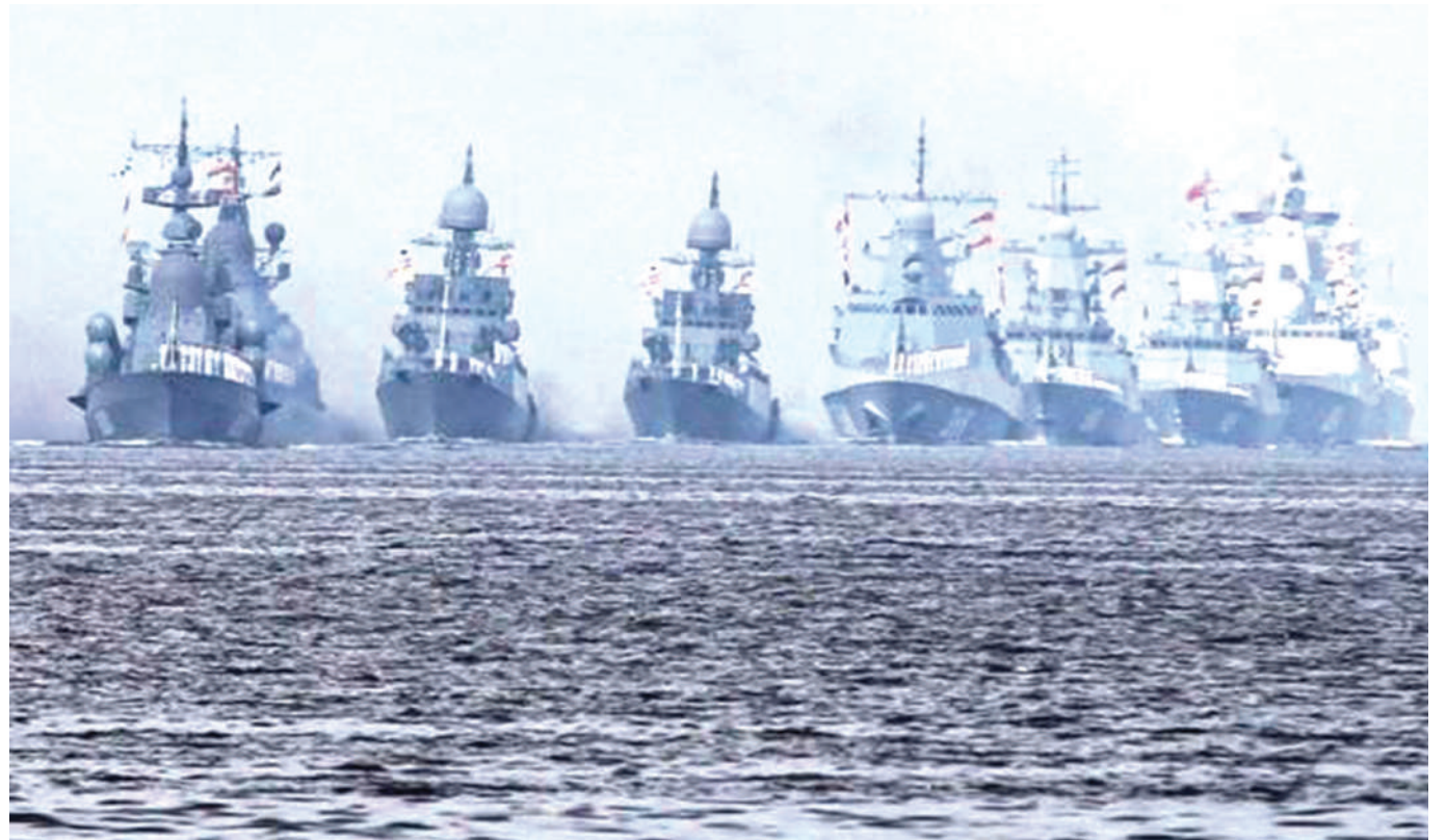
Meli za kivita za Russia zikiwa katika bahari nyeusi ambazo zinadaiwa kutumika kurusha makombora katika miji mbalimbali ya Ukraine.

Hadi kufikia Juni 3, Umoja wa Mataifa ulikuwa umepokea ripoti za madai 124 ya unyanyasaji wa kingono unaohusiana na migogoro kote Ukraine.