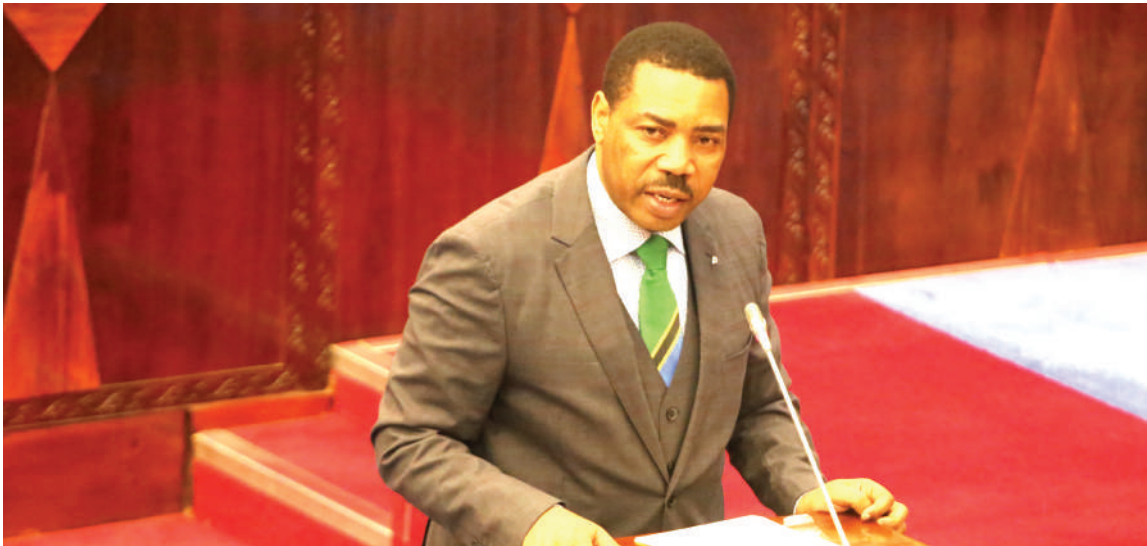
Waziri wa Fedha na Mipango, Dk. Mwigulu Nchemba, akiwasilisha makadirio ya mapato na matumizi ya wizara yake kwa mwaka wa fedha wa 2022/2023, bungeni jijini Dodoma jana.

Waziri huyo, Mbunge wa Iramba na kitaaluma ni mchumi, alieleza kwamba mikoa yote imepata fedha za miradi ya maendeleo, akisifu inatekezwa kwa ufanisi.