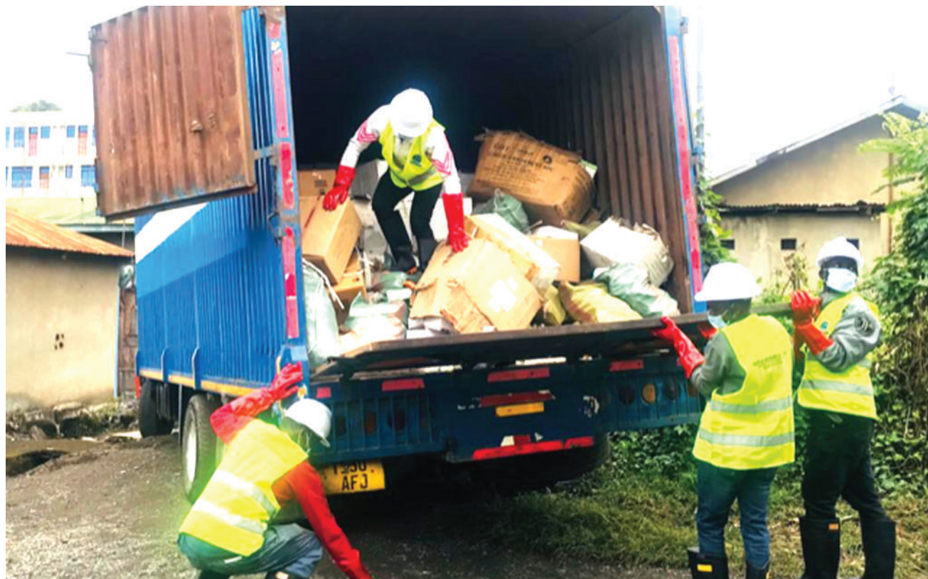
Baadhi ya wataalamu wa kuteketeza dawa wakishusha shehena ya dawa zilizokwisha muda wake, zilizokamatwa nyumbani kwa mtu mmoja ambaye (jina linahifadhiwa), Veta, jijini Mbeya, ili ziteketezwe kwenye eneo maalum la kuchomea lililoko Hospitali ya Iggowe, wilayani Rungwe juzi.

Alisema kwa kuzingatia usalama wa watu na mazingira NEMC imekuwa ikisimamia uchomaji wa taka hatarishi kwa kuzichoma kwenye maeneo maalum ambayo hayawezi kuathiri afya za binadamu.