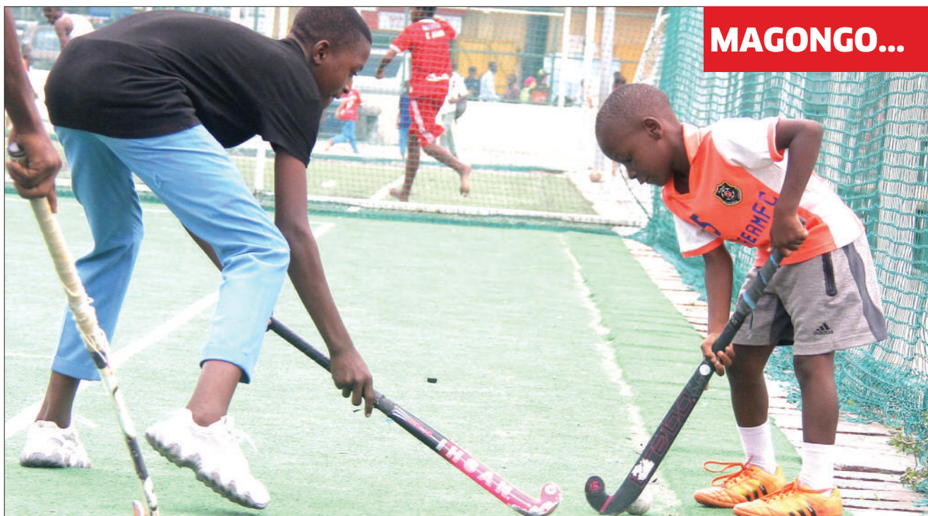
Watoto wakicheza mpira wa magongo katika viwanja vya Jakaya Kikwete jijini Dar es Salaam juzi.

"Hatuna uhakika wa moja wa kushiriki michuano ya kimataifa kama hatufanya vizuri katika michezo iliyosalia ya ligi kwa kupata alama zitakazotupandisha hadi nafasi ya tatu ambayo tunaweza kwenda kushiriki michuano ya kimataifa," alisema.