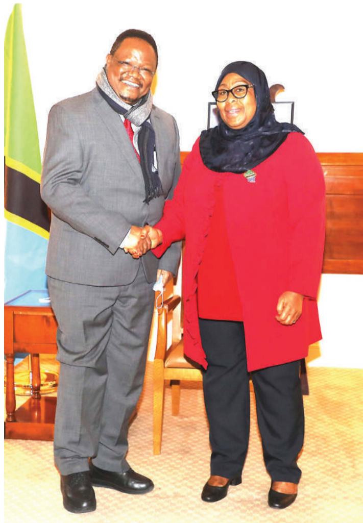
Rais Samia Suluhu Hassan, alipokutana na Makamu Mwenyekiti wa CHADEMA, Tundu Lissu, mnamo Februari 16 mwaka huu, jijini Brussels, Ubelgiji.

Nadharia za sayansi ya siasa na maandiko yake mbalimbali yanagusa dhana kwamba, ili kuwepo mafanikio na ubora wa utawala kisiasa, kuna ulazima mambo kadhaa yakajumuishwa uwepo wake yakiwamo; utawala uliopo ukubalike kwa umma, vivyo uendane na kuwepo utawala bora.