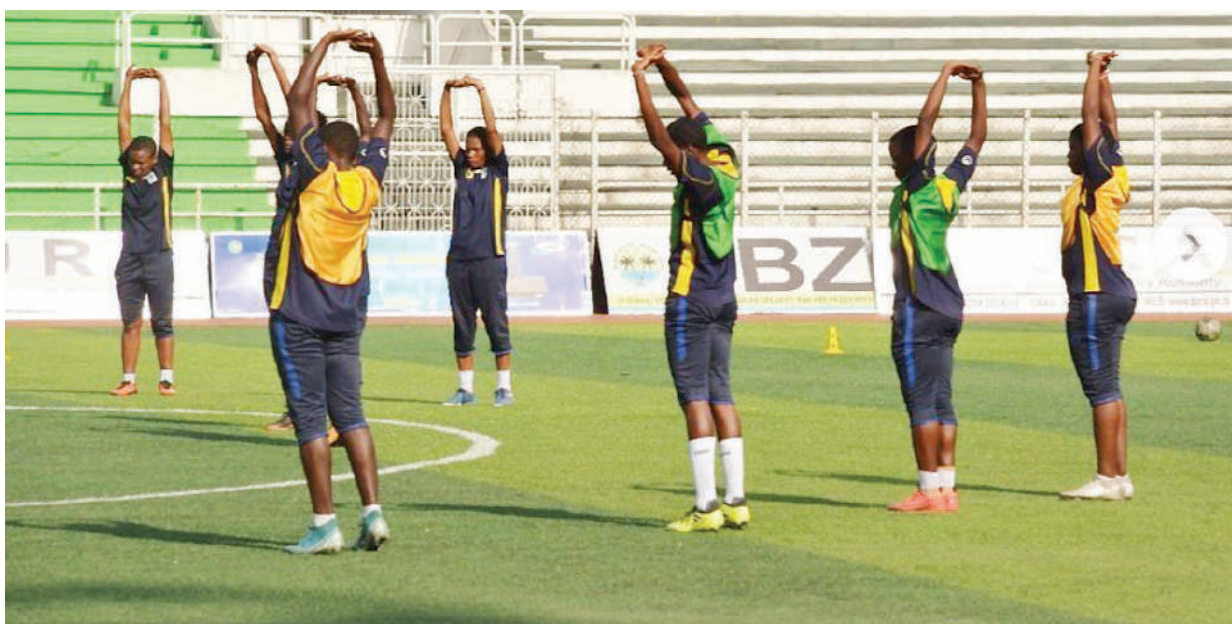
Wachezaji wa Timu ya Soka ya Taifa ya Wasichana ya umri chini ya miaka 17 wakifanya mazoezi kujiandaa na mechi ya kusaka tiketi ya kushiriki fainali za Kombe la Dunia dhidi ya Botswana itakayochezwa kesho kwenye Uwanja wa Amaan, Zanzibar.

“Ligi ni ngumu na kila mechi kwetu ni fainali, tunaenda kupambana kutafuta pointi muhimu katika mchezo huo dhidi wenyeji wetu Azam FC,” alisema nahodha huo.