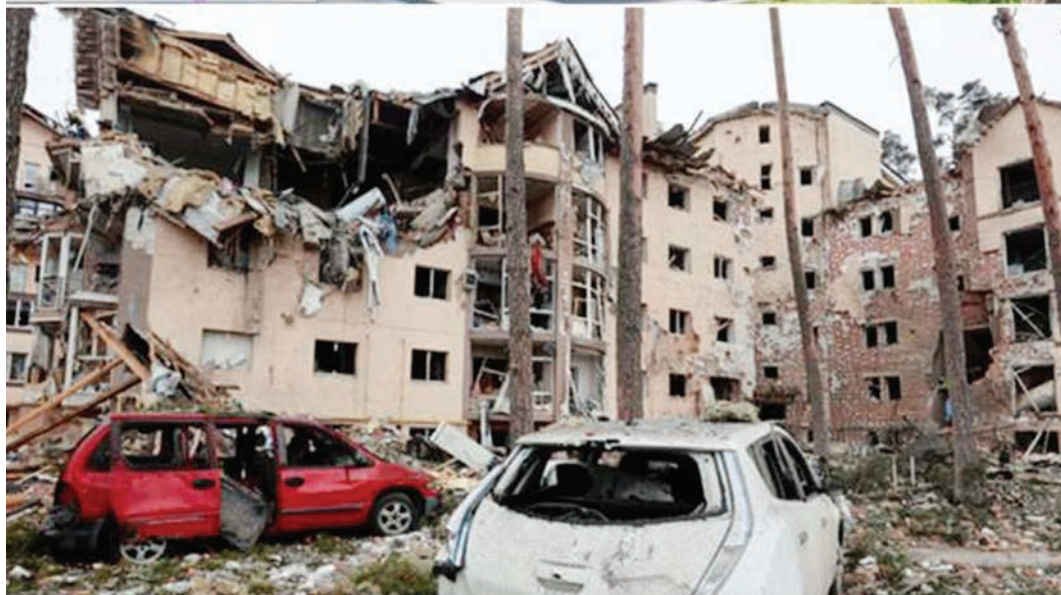
Eneo la makazi ya watu na magari yakiwa yameteketewa na makombora yanayorushwa na vikosi vya Russia katika mji mkuu wa Kyiv nchini Ukraine.

yaliyolenga makazi ya watu katika mji wa Chernihiv, mamlaka ya kikananda imesema. Kazi ya uokoaji ilibidi kusitishwa siku kwa sababu ya kuwepo mlipuko ya mizinga mikubwa.