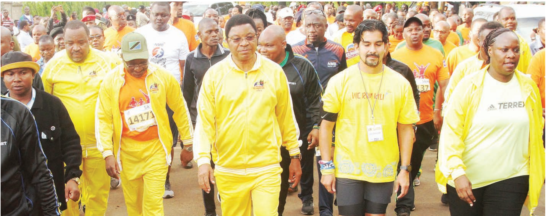
Waziri Mkuu, Kassim Majaliwa (katikati), akiwa ameshiriki mbio za kilomita tano zinazodhaminiwa na Grand Malt katika mashindano ya Kilimanjaro Marathon yaliyofanyika mkoani Kilimanjaro Jumapili iliyopita.