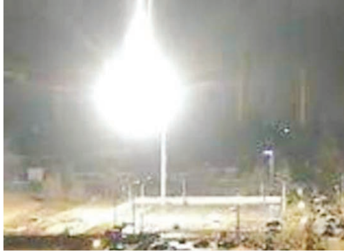
Miale ya moto kutoka katika mtambo wa nishati ya Nyuklia nchini Ukraine baada ya kituo hicho kulipuliwa na mabomu ya Russia jana

Kundi hilo lina wanafunzi 451 kwa mujibu wa mwenyekiti wa