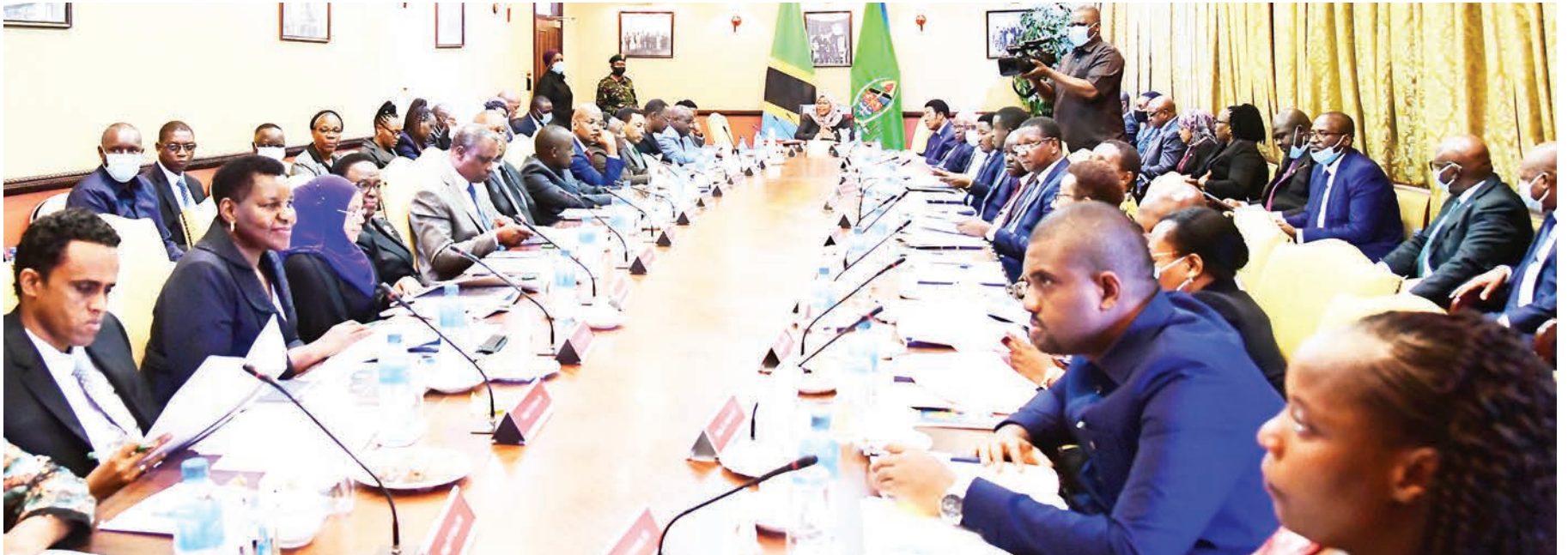
Rais Samia Suluhu Hassan, akiongoza Kikao cha Baraza la Mawaziri, Ikulu, jijini Dar es Salaam jana.