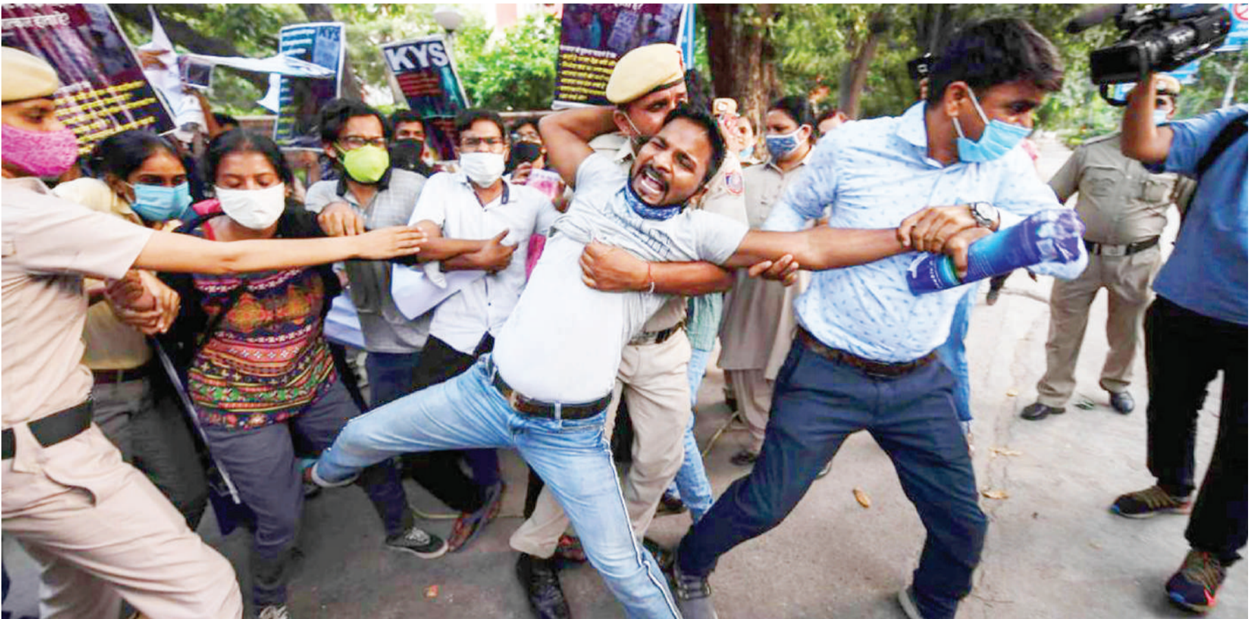
Polisi wakipambana na waandamanaji, ambao wanapinga kifo cha mwanafunzi mmoja wa kike mwenye umri wa miaka 18, ambaye alibakwa na wanaume wanne na kisha kuachwa katika kijiji cha Bool Garhim, jimbo la Uttar Pradesh, nchini India.