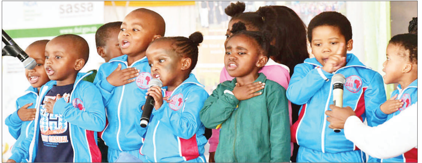
Kila mtoto hana haki ya kulindwa, elimu na kujieleza.

Ikumbukwe ni unyanyasaji unaoavua wasichana ambao ni wazazi wa kesho utu, heshima na thamani yao, kupitia miradi ya kuondoa umaskini kwa kutamani