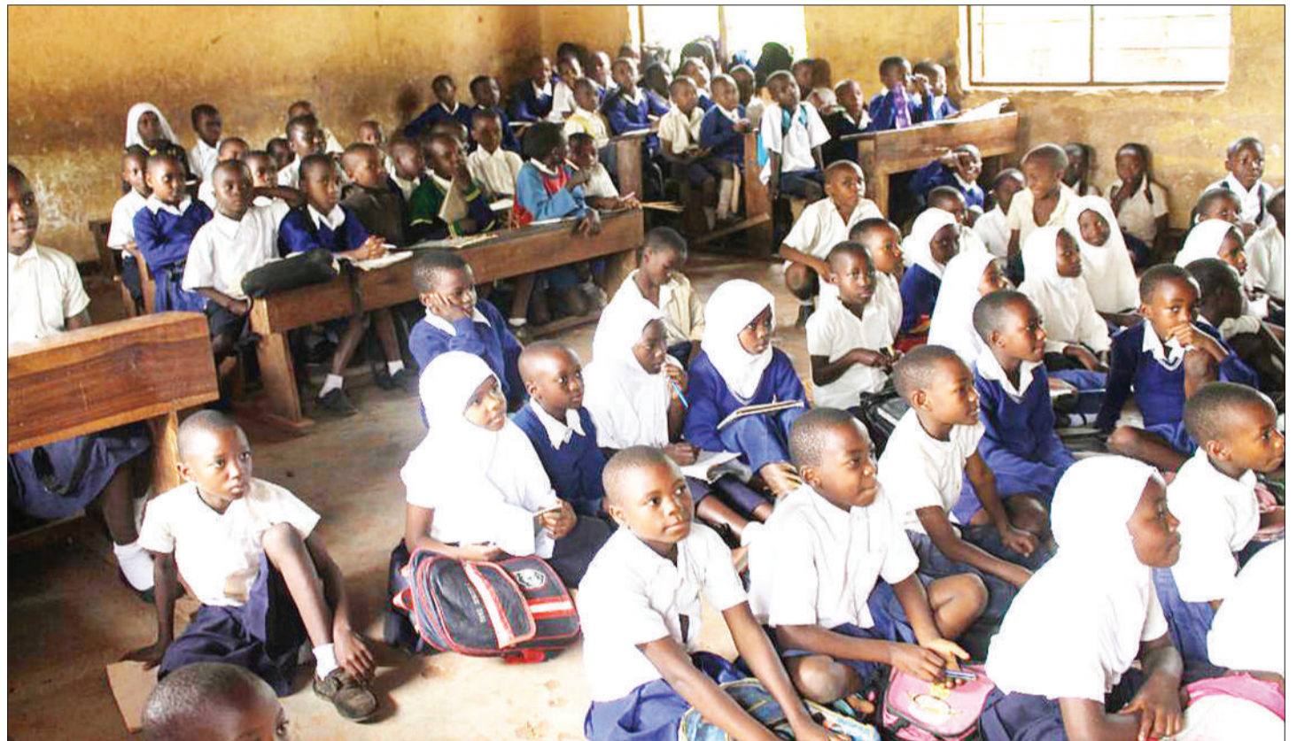
Wanafunzi wa darasa la tatu katika shule ya msingi Majengo katika manispaa ya Kigoma ujiji mkoani Kigoma wakiendelea na masomo.