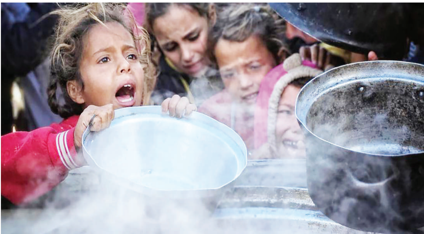
Watoto wakipambana kupata chakula kinachogawiwa kwa Wapalestina waliokimbia mashambulizi ya jeshi la Israel katika eneo la Khan Yunis, kusini mwa Ukanda wa Gaza.