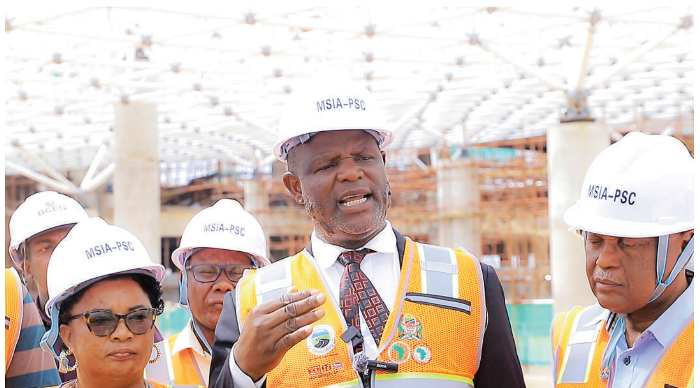
Makamu Mwenyekiti wa Kamati ya Kudumu ya Bunge ya Hesabu za Serikali (PAC), Japhet Hasunga, akizungumza na waandishi wa habari, baada ya kukagua ujenzi wa miundombinu ya Uwanja wa Ndege wa Kimataifa wa Msalato, jijini Dodoma juzi.

Awali, Simbachawene, alisema serikali imetoa Sh. bilioni 47.9 kwa mkoa huo wa Singida kunusuru kaya masikini kwa kuanzisha miradi na kukabiliana na changamoto ndogondogo za maisha.