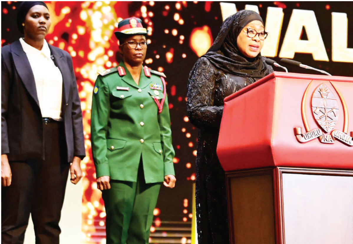
Rais Samia Suluhu Hassan akizungumza wakati wa hafla ya utoaji wa Tuzo za Mlipakodi Bora wa Mwaka 2023/24, Dar es Salaam juzi.