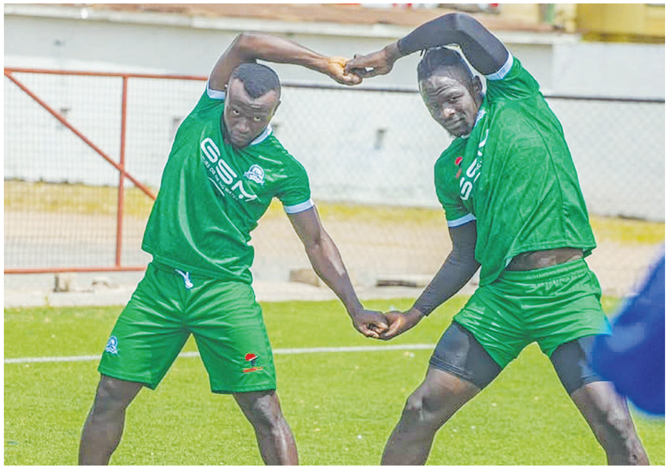
Wachezaji wa Pamba Jiji FC ya Mwanza wakifanya mazoezi ili kujiandaa kuwafuata wenyeji Dodoma Jiji kwa ajili ya mechi ya Ligi Kuu Tanzania Bara itakayochezwa Februari 5, mwaka huu kwenye Uwanja wa Jamhuri.

Katika msimamo wa ligi hiyo, KMC inashika nafasi ya 10 ikikusanya pointi 19 kibindoni baada ya kucheza michezo 16, ikishinda mitano, sare nne na kupoteza michezo saba.