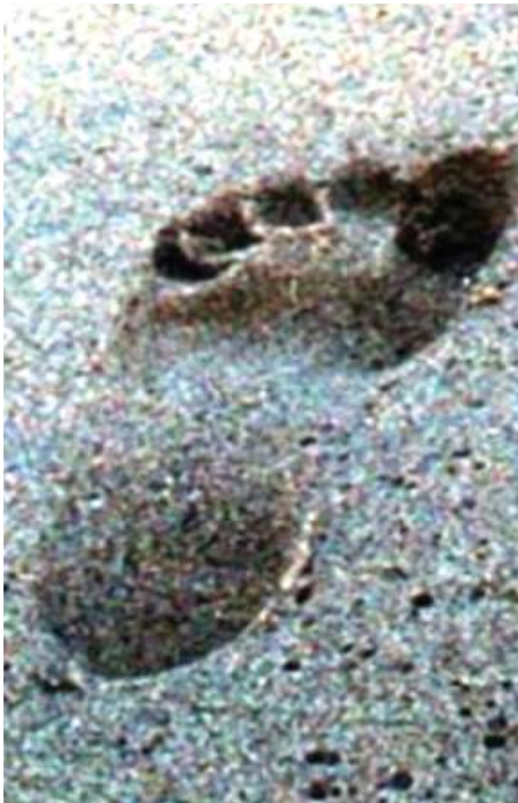
Ugunduzi mpya wa nyao za binadamu eneo la Laetoli lililoko ndani ya Mamlaka ya Hifadhi ya Ngorongoro (NCAA), ambazo ni za watu wanaodaiwa kuishi miaka milioni 3.7 iliyopita.

kuna hadithi inayomuunganisha na waliyoleta alama za miguu.