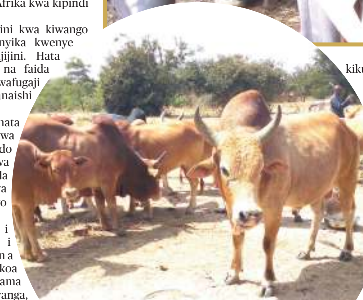
Mifugo aina ya ng'ombe na punda wakila mashudu na pumba zilizotolewa na Shirika lisilo la Kiserikali la Haki na Ustawi wa Wanyama Tanzania.