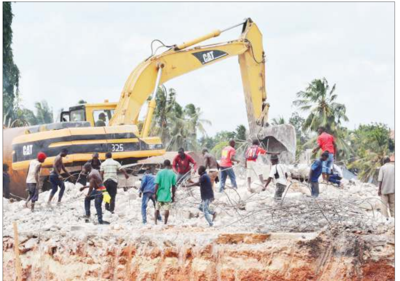
Wananchi wakitoa nondo baada ya kituo cha mafuta Mbezi Mwisho, Barabara ya Morogoro, kuvunjwa jijini Dar es Salaam jana, ili kupisha upanuzi wa barabara unaoendelea.