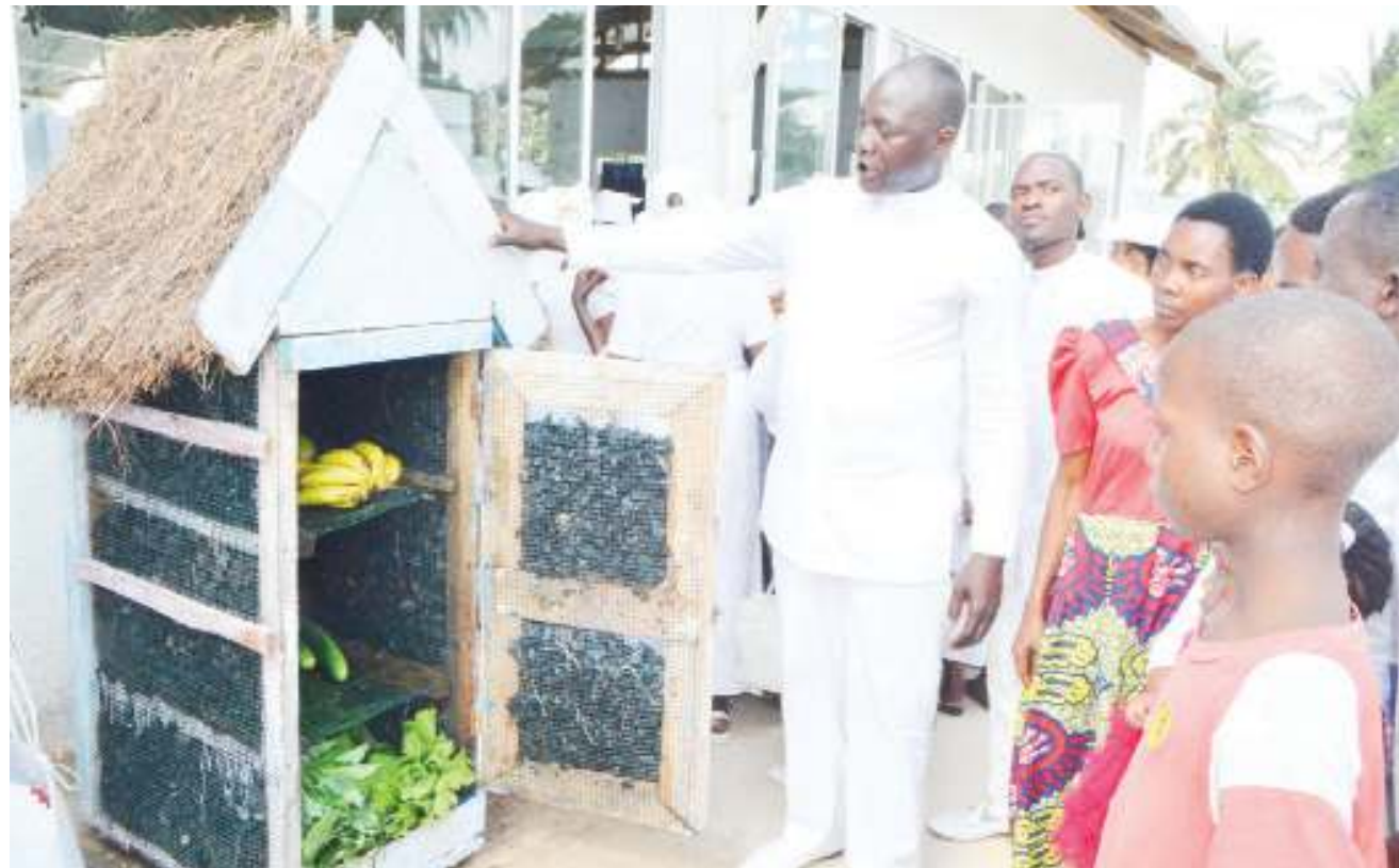
Kuhani wa Kanisa la Halisi la Mungu Baba, Jambo Jipya (kushoto), akionyesha waumini wa kanisa hilo, friji inayotumia mkaa alilolubuni, katika maonyesho ya uzalishaji yaliyoandaliwa na kanisa katika eneo la Tegeta, jijini Dar es Salaam jana.