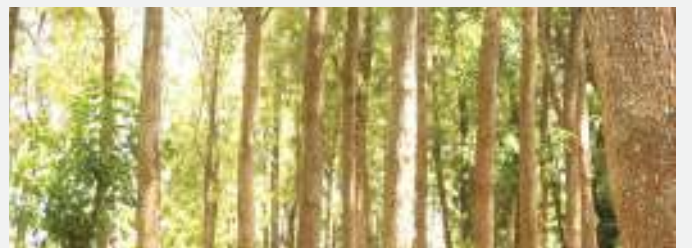
Baadhi ya misitu ya kupandwa ambayo utafiti unaonyesha inanyonya hewa ukaa ambayo sasa inaongezeka kutokana na mabadiliko ya tabianchi. PICHA: MTANDAO