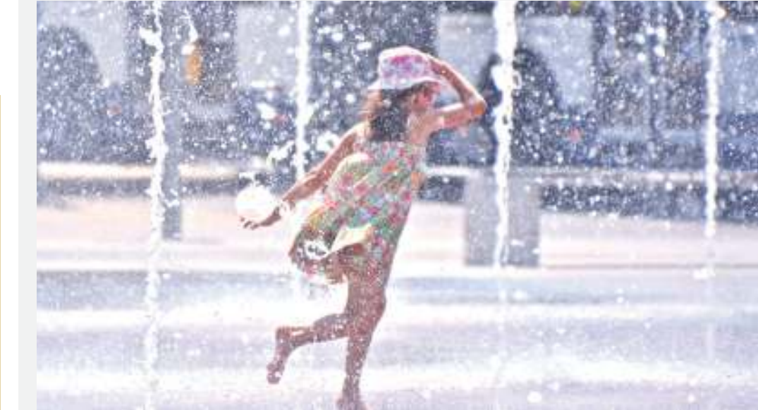
Mtoto akicheza kwenye maji wakati wa msimu wa joto kali.

V WANGO vya joto barani Ulaya, Marekani na baadhi ya maeneo ya Kaskazini mwa Afrika, ni vya juu na vinatishia afya ya binadamu, kilimo na mazingira.