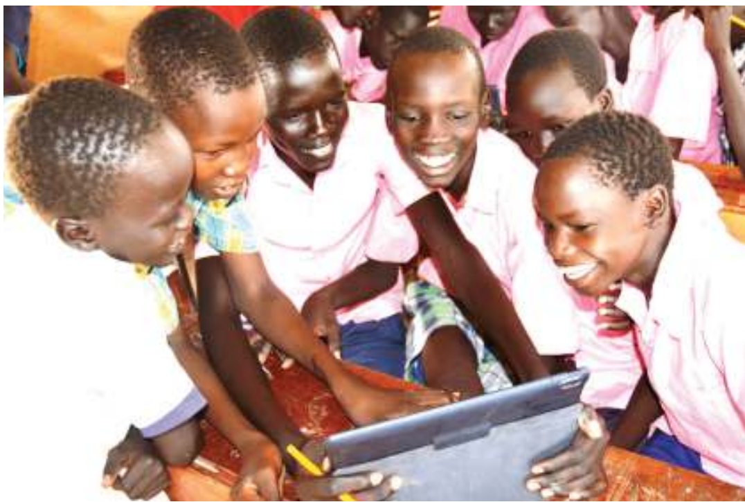
Wanafunzi wakitumia kompyuta mpakato katika mradi wa shule wa (INS) kwenye kambi ya wakimbizi ya Kakuma nchini Kenya. Mradi wa INS ni wa ushirikiano baina ya UNHCR na wakfu wa Vodafone.