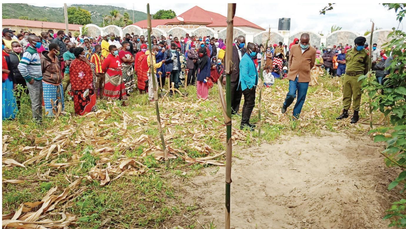
Mkazi wa Kitwiru Mjini Iringa na askari polisi wakitazama kaburi (kulia), ambalo baada ya kulifukua halikuwa na maiti, lililokutwa juzi jioni katika kiwanja cha askari wa kikosi cha usalama barabarani mkoani humo, huku wahusika wa tukio hilo, wakiwa hawajajulikana.

"Mtakumbuka siku za nyuma mataifa makubwa yalitumia silaha kali kuangamiza, haitashangaza kama atatumia biolojia kuangamiza watu, ndiyo maana ni vyema jeshi likafanya utafiti," alisema Nahodha ambaye amewahi kuwa Waziri Kiongozi wa Awamu ya Sita wa Serikali ya Mapinduzi ya Zanzibar.