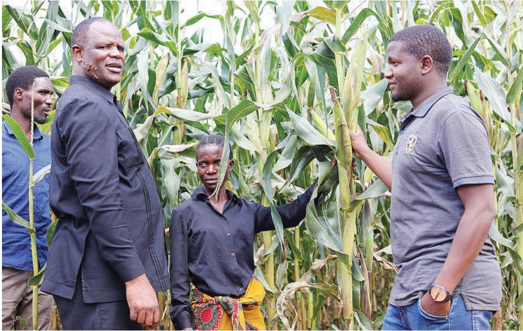
Waziri wa Kilimo, Japhet Hasunga, akiteta jambo na wakulima hivi karibuni.

○ Imegeuka zama wakulima kujihudumia ○ Aandaa makombora 8 kilimo kiwe 'supa'