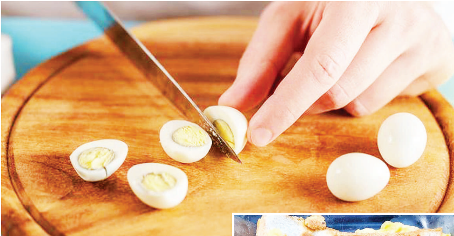
Mlo wa yai la kuchemsha. PICHA ZOTE: MTANDAO

• Tiba mifupa, nywele, kucha, sumu, macho, ubongo wa wazee & watoto