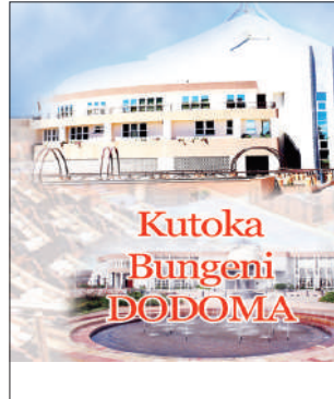
Habari na Augusta Njoji

tika kuhakikisha huduma inaboreka zaidi mnamo Januari, mwaka huu Mamlaka ya Majisafi na Usafi wa Mazingira Mtwara (MTUWASA), imepewa jukumu la kusimamia huduma zote za maji katika mji huo.