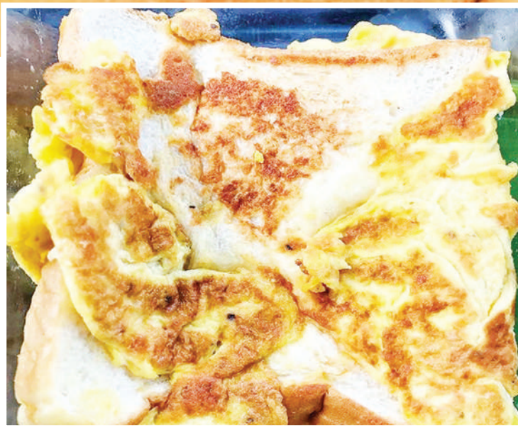
Mayai ya kukaanga yakiwa na mkate.

Mayai yanaelezwa tena kwa nafasi kubwa yanapunguza madhara yanayotokana na kuchakaa mboni na lensi ya macho, ikiwamo matokeo ya umri wa mwanadamu.