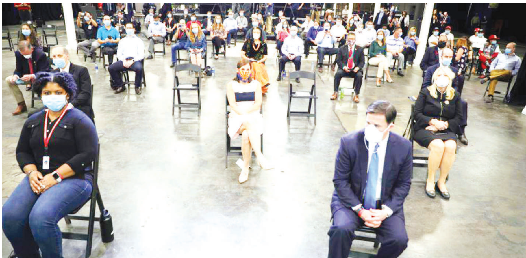
Wafanyakazi wa kiwanda cha kutengeneza vifaa vya kujikinga na virusi vya corona cha Honeywell, wakimsubiri Rais Donald Trump, alipotembelea kiwanda hicho.