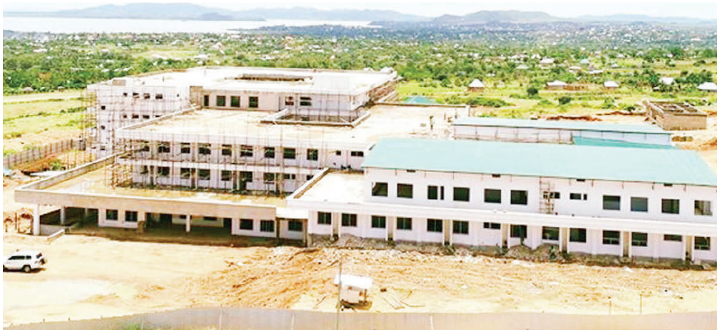
Jengo jipya la Hospitali ya Mkoa Mara, ujenzi wake ukiendelea.

“Kukamilika hospitali hii itakuwa mkombozi kwa wananchi wa mkoa wa Mara ambao watakuwa wakipata huduma za hospitali ya rufani katika mkoa wao tofauti na sasa wanalazimika kwenda Bugando, Mwanza.”