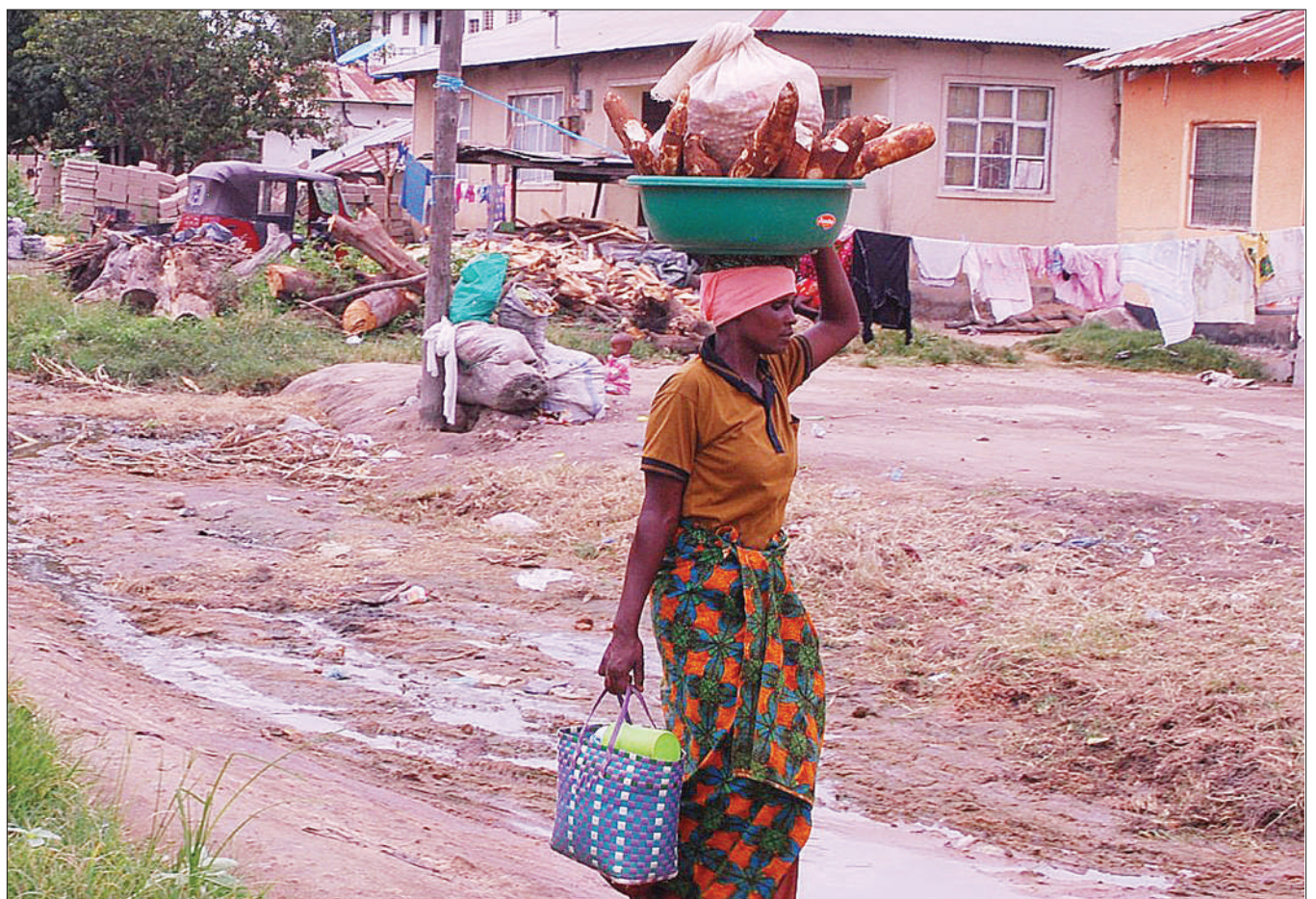
Mchuuzi wa mihogo akisaka wateja katika Mtaa wa Bonanza, Chamwino, jijini Dodoma jana. Mihogo hutumiwa katika maandalizi ya futari, hasa kipindi hiki cha mfungo wa Mwezi Mtukufu wa Ramadhani.

"Tunataka kuona vijana wanafanya kazi na si kutumia dawa za kulevya kama mtaji, kitu ambacho hakikubaliki hata kidogo kwa sababu tunapoteza nguvu kazi ya Taifa," alisema.