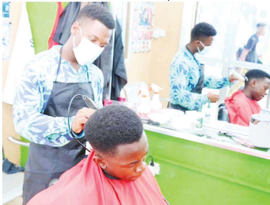
Mtoa huduma katika saluni, akiendelea na kazi, huku akiwa katika kinga ya barakoa.

Serikali kupitia Wizara ya Afya, imetoa wito kwa wafanyakazi katika maeneo ya saluni kuchukua tahadhari ili kujikinga na maambukizoya homa kali ya mapafu, inayosababishwa na virusi vya corona katika maeneo yao.