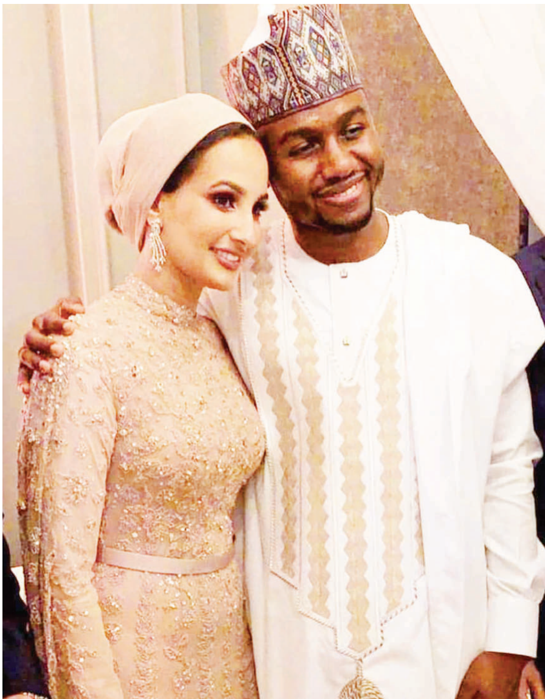
Moja ya harusi ya kifahari iliyofanyika ughaibuni. Uimara wake, Pia unategemea sana ubora wa maadili toka kwa wawili.

Ni aina ya ndoto na falsafa za wengi, kutokana na hali halisi ya maisha iliyoko katika jamii, bila ya kusahau uchumi wa soko unaojipenyeza katika maisha.