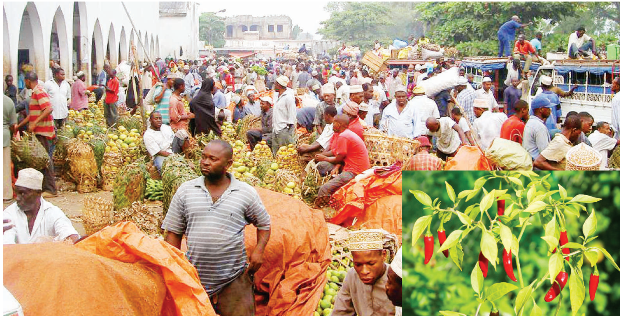
Soko Kuu la Mwanakerekwe, ambako kunatarajiwa bidhaa mpya ya pilipili kichaa kuuzwa.

• Waziri awahakikishia kipato njia nyeupe • Darasa la Bagamoyo lawapa jibu uhakika • Shirika Biashara: Iko wazi soko linawangoja • Kila mwezi 'mshahara'... staili ya kazini