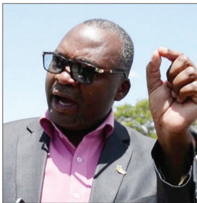
Naibu Waziri wa Ujenzi, Uchukuzi na Mawasiliano, Elias Kwandikwa.

Kauli ilitolewa jana bungeni na Naibu Waziri wa Ujenzi, Uchukuzi na Mawasiliano, Elias Kwandikwa, alipokuwa akijibu swali la nyongeza la Mbunge wa Korogwe Mjini (CCM),