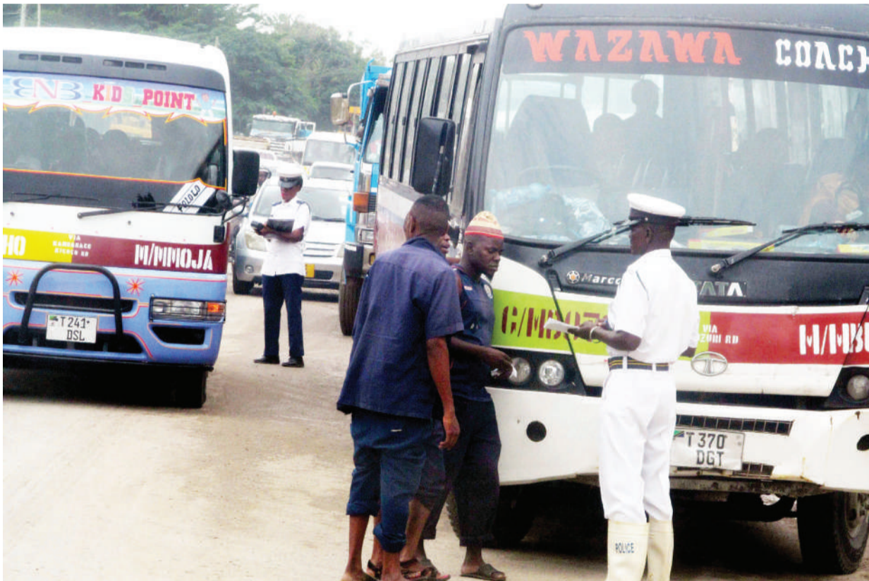
Askari wa Kikosi cha Usalama Barabarani, wakiwa amesimamisha mabasi ya daladala na kuhoji madereva wake katikati ya barabara, eneo la Sinza Mapambano, jijini Dar es Salaam mapema wiki hii, bila ya kujali foleni kubwa ya magari.

Majaliwa alisema anaamini, Watanzania walimuelewa na hasa Wazanzibar na kwamba alichokisema ni sahihi na hao wanaotamka kuwa amewachefua Wazanzibar, ni wanunuzi na sio Wazanzibar.