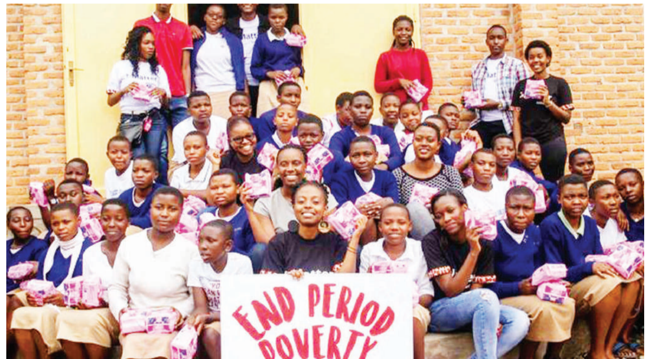
Wasichana waliopokea taalo za kike katika kampeni ya kusaidia wale wasiojiweza Rwanda. Kampeni hiyo imeanzishwa na wasichana 10 na wavulana wawili ya kumaliza ukosefu wa taalo hizo.

Kwa upande mwingine, Jaji Mkuu wa nchi hiyo, amelalamikia vikali kuhusu hatua ya serikali ya kupunguza bajeti dhidi ya idara ya mahakama, jambo ambalo alisema, linavuruga shughuli na usimamizi na utekezaji wa haki. BBC