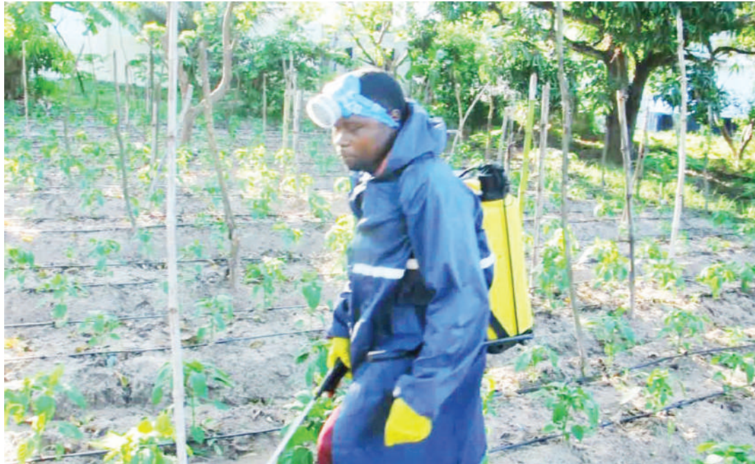
Mkulima wa pilipili hoho akiandaa shamba. Picha ndogo, mazao shambani.

“ Utiriri Mwekundu (Red Spider mites): Ni wadogo wenye rangi nyekundu au machungwa yaliyoiva. Huonekana upande wa chini wa majani na hushambulia mmea kwa kufyonza utomvu wake.