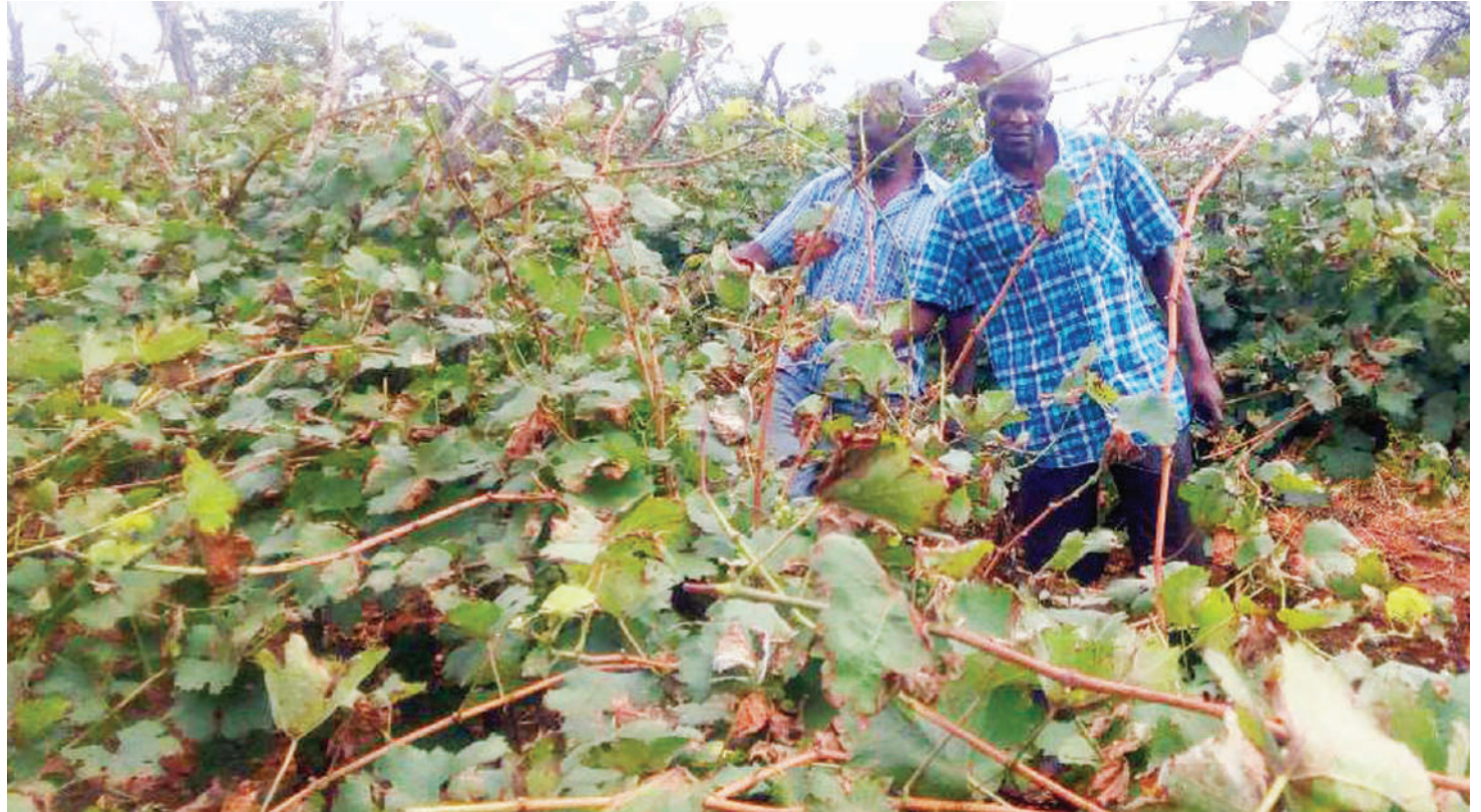
Wakulima wa zabibu Kata ya Hombolo, wakikagua shamba lao.

Kuhusu malengo yake, anataja anahitaji kufika mbali katika utengenezaji kinywaji - mvinyo pamoja na kuwainua wakulima wadogo, ili nao wafikie hatua ali-