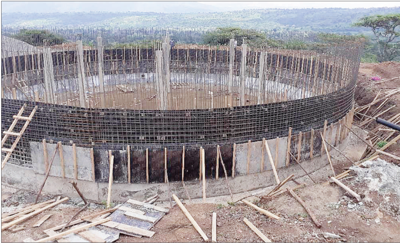
Ujenzi wa tanki la maji ukiwa unaendelea katika kijiji cha Izumbwe, kwajili ya kutekeleza mradi wa maji wa Shongo, ambao unatokana na agizo la Rais Dk. John Magufuli, wakati wa ziara yake mkoani Mbeya.