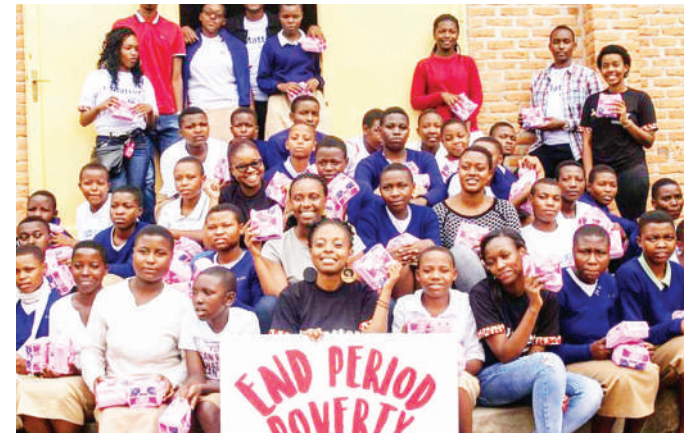
Mabinti wakishiriki kampeni, baada ya kupokea pedi zao.