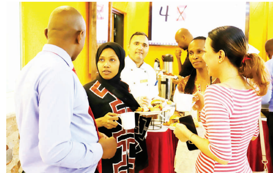
Wateja wa Diamond Trust Tanzania, wakiwa katika kifungua kinywa kilichoandaliwa na benki hiyo, kama ishara ya kumaliza ukarabati wa tawi la Masaki, lililopo Barabara ya Chole, jijini Dar es Salaam. DTB Tanzania ina matawi 28, 13 jijini Dar es Salaam na mengine 15 katika miji mingine nchini.