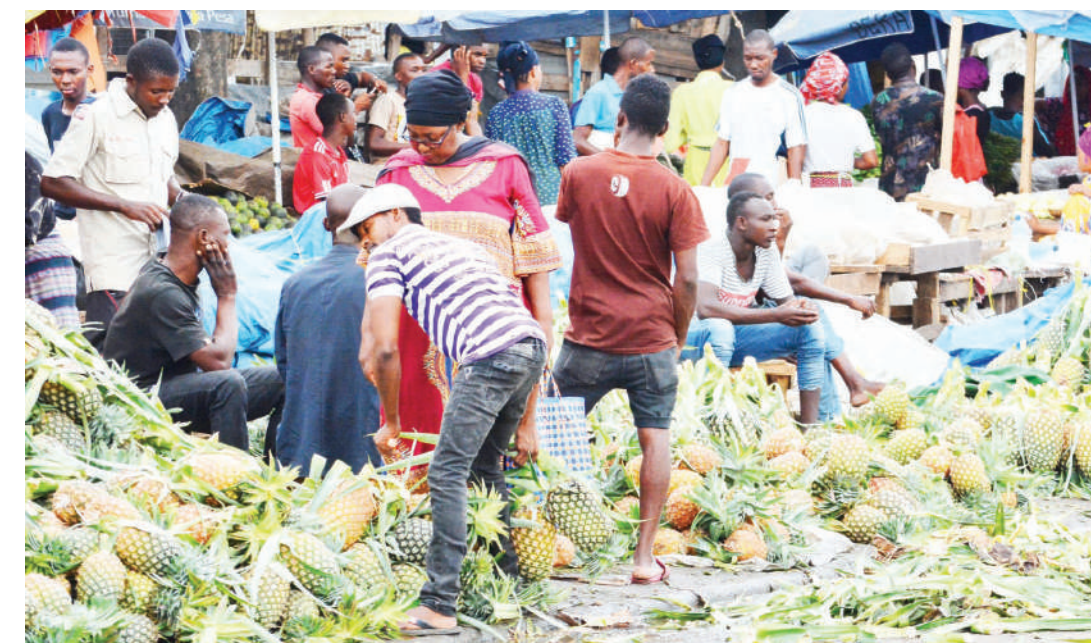
Wachuuzi wa mananasi, wakisubiri wateja katika soko la Buguruni, jijini Dar es Salaam, mape-ma wiki hii. Nanasi linauzwa kwa bei ya Sh. 500 hadi Sh.1000, kulingana na ukubwa wake.