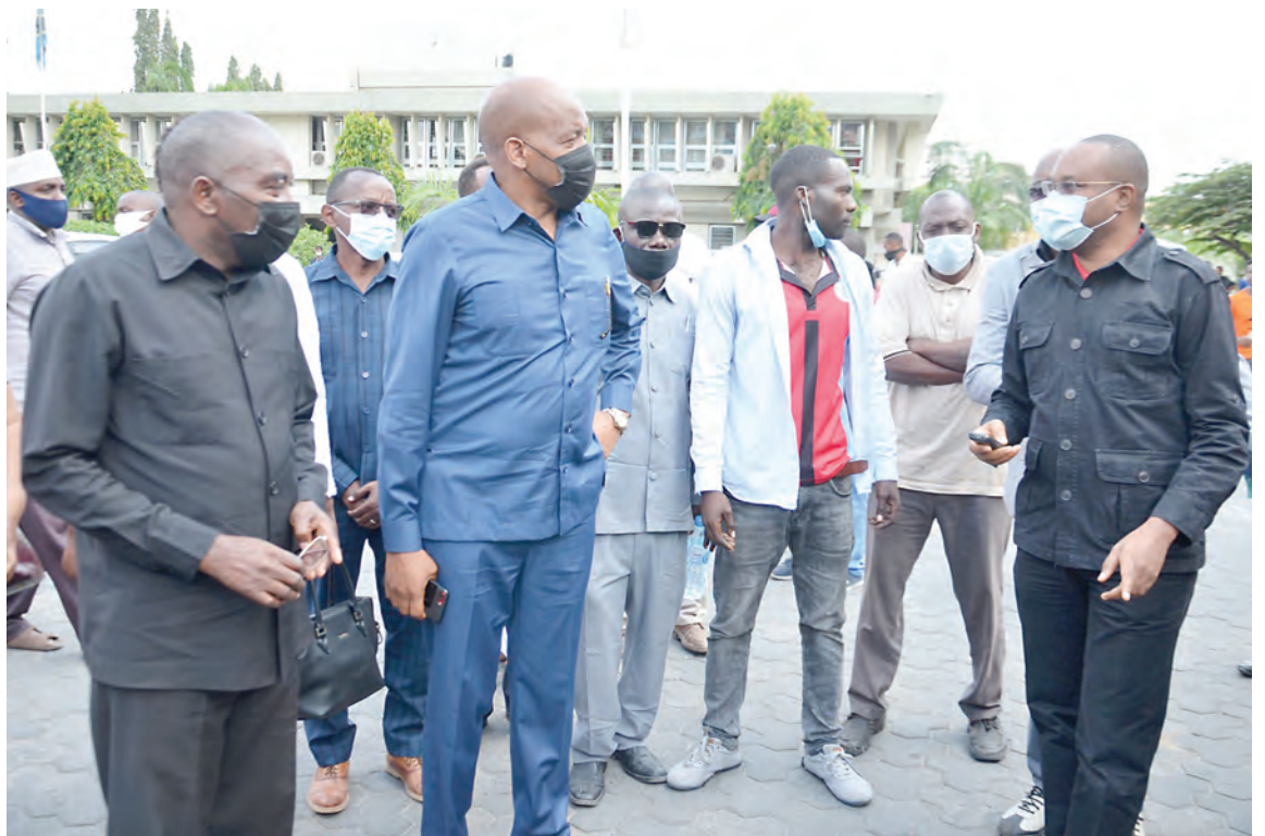
Mwenyekiti wa Chama cha NCCR-Mageuzi Taifa, James Mbatia (wapili kushoto), akijadiliana jambo na Katibu Mkuu wa Chama cha Demokrasia na Maendeleo (CHADEMA), John Mnyika (kulia), katika viwanja vya Mahakama ya Hakimu Mkazi Kisutu jijini Dar es Salaam jana, walipofika kufuatilia kesi inayomkabili Mwenyekiti wa Taifa wa CHADEMA, Freeman Mbowe.