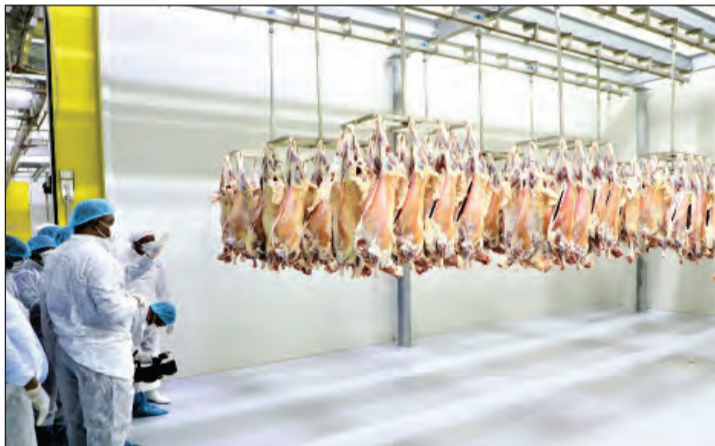
Kiwanda cha kisasa cha uchinjaji na usindikaji wa nyama cha Tan Choice kilichopo Soga, wilayani Kibaha mkoani Pwani.

ya YPC Israel Ilunde, anaeleza namna wanavyotoa elimu kwa vijana waweze kujikita kwenye Sekta ya Usindikaji badala ya kusubiri ajira.