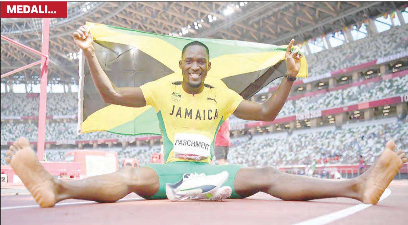
Hansle Parchment raia wa Jamaica, akishangilia kwa furaha baada ya kutwaa Medali ya Dhahabu katika mbio za kuruka vihunzi mita 110 akimpiku Mmarekani Grant Holloway kwenye michuano ya Olimpiki inayoendelea nchini Japan.