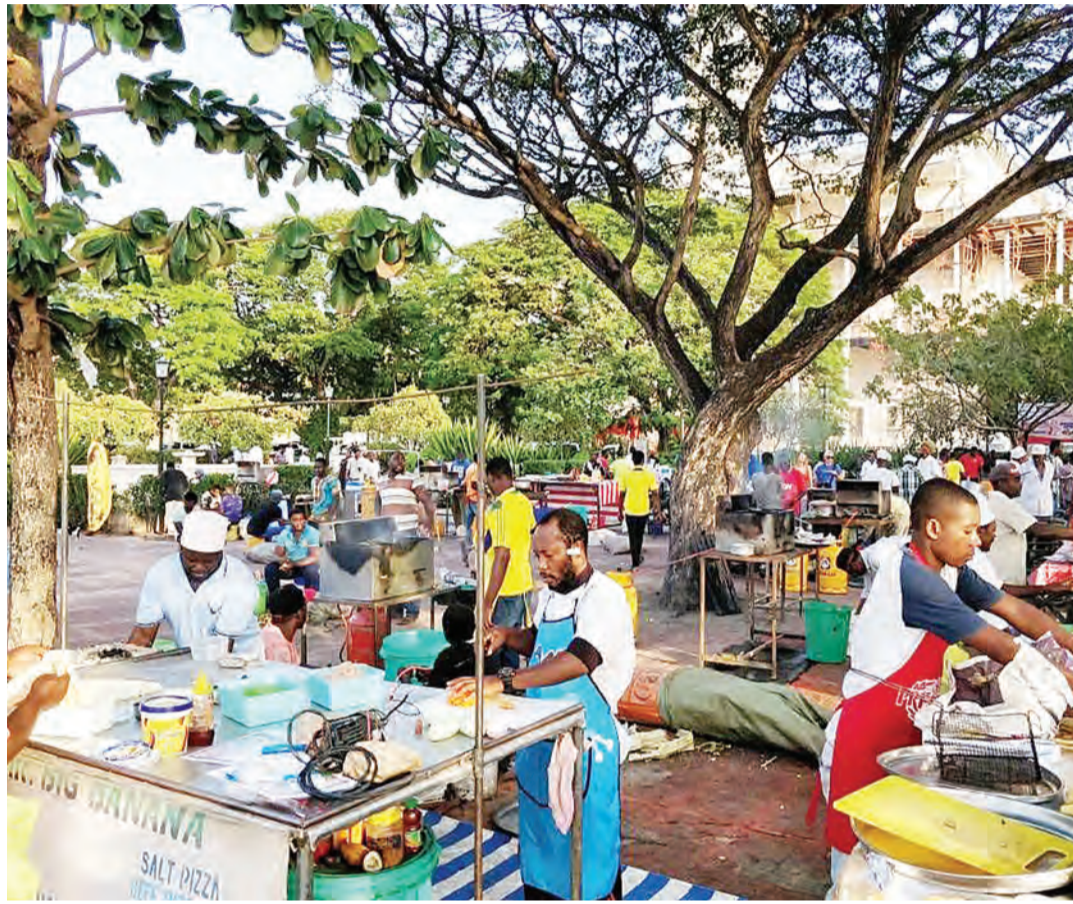
Biashara ya vyakula eneo la Forodhani visiwani Zanzibar ni moja ya mambo yanayovutia watalii.