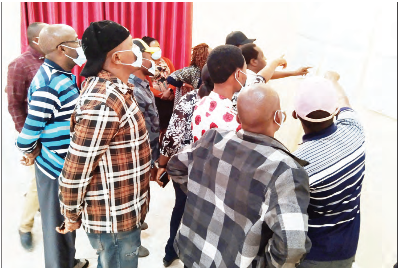
Waandishi wa habari za mitandaoni nchini wakiwa katika mafunzo ya siku tatu ya kuwajengea uwezo yaliyoandaliwa na Klabu ya Waandishi wa Habari ya Mkoa wa Arusha, jijini Dodoma jana.

Alisema mkandarasi huyo atakutana na makundi hayo Agosti 25, mwaka huu kwenye mkutano ulioundaliwa na TCCIA na Shirikla la Maendeleo ya Petroli Tanzania (TPDC).