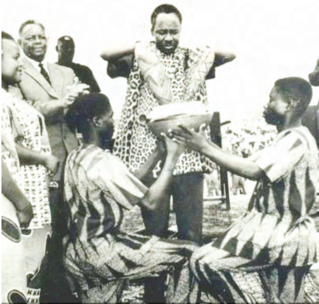
Waasisi wa Muungano wakichanganya udongo wa Bara na Visiwani ili kuunganisha mataifa hayo.

Kwa hiyo si suala la Watanzania tena kupinga Muungano na kutaka kuwe na serikali tatu, mara uwe