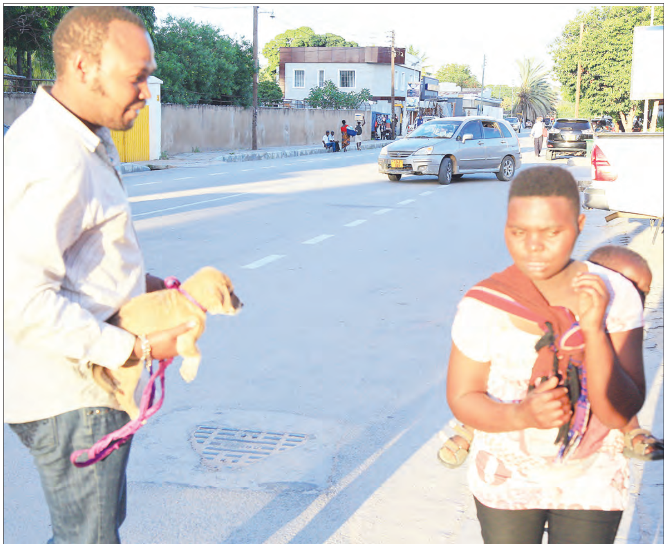
Kijana akiuza mbwa ili kujipatia riziki katika eneo la Uhindini, jijini Dodoma jana. Mbwa huyo, alimuuza kwa bei ya 20,000/-

Katika kukabiliana na changamoto mbalimbali katika miundombinu, Tarura imewataka wananchi kutunza mazingira na kuacha tabia ya kufanya shughuli za kibadamu kwenye maeneo yaliyotengwa kwa ajili ya hifadhi za barabara.