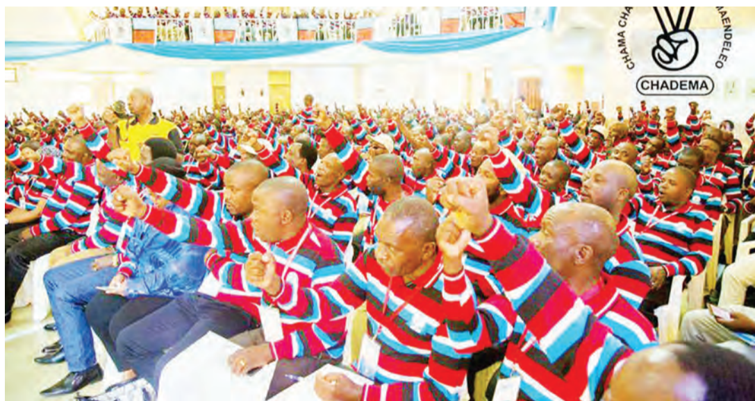
Wanachama wa Chadema katika moja ya mikutano yao ya ndani.

Sisi bado lakini wiki hii ndiyo tutatangaza utaratibu kwa watia nia wa ngazi za ubunge na udiwani kuanza kujitokeza, ili baadaye wapitie kwenye mchakato utakaowezesha kupata wagombea sahihi.