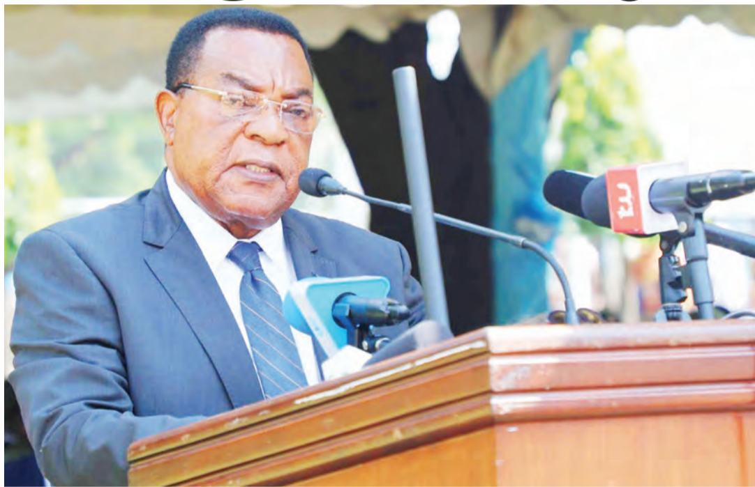
Balozi Mahiga akiwa kazini wakati wa uhai wake.

Mbunge wa Kawe kupitia Chama cha Demokrasia na Maendeleo