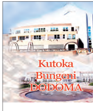
Habari na Augusta Njoji

"Endapo dalali yeyote atakuwa utaratibu wa kukamata mali ambayo haikuainishwa katika hati ya ukamataji atakuwa amekiuka utaratibu uliotajwa kwenye kanuni, hivyo kupele-