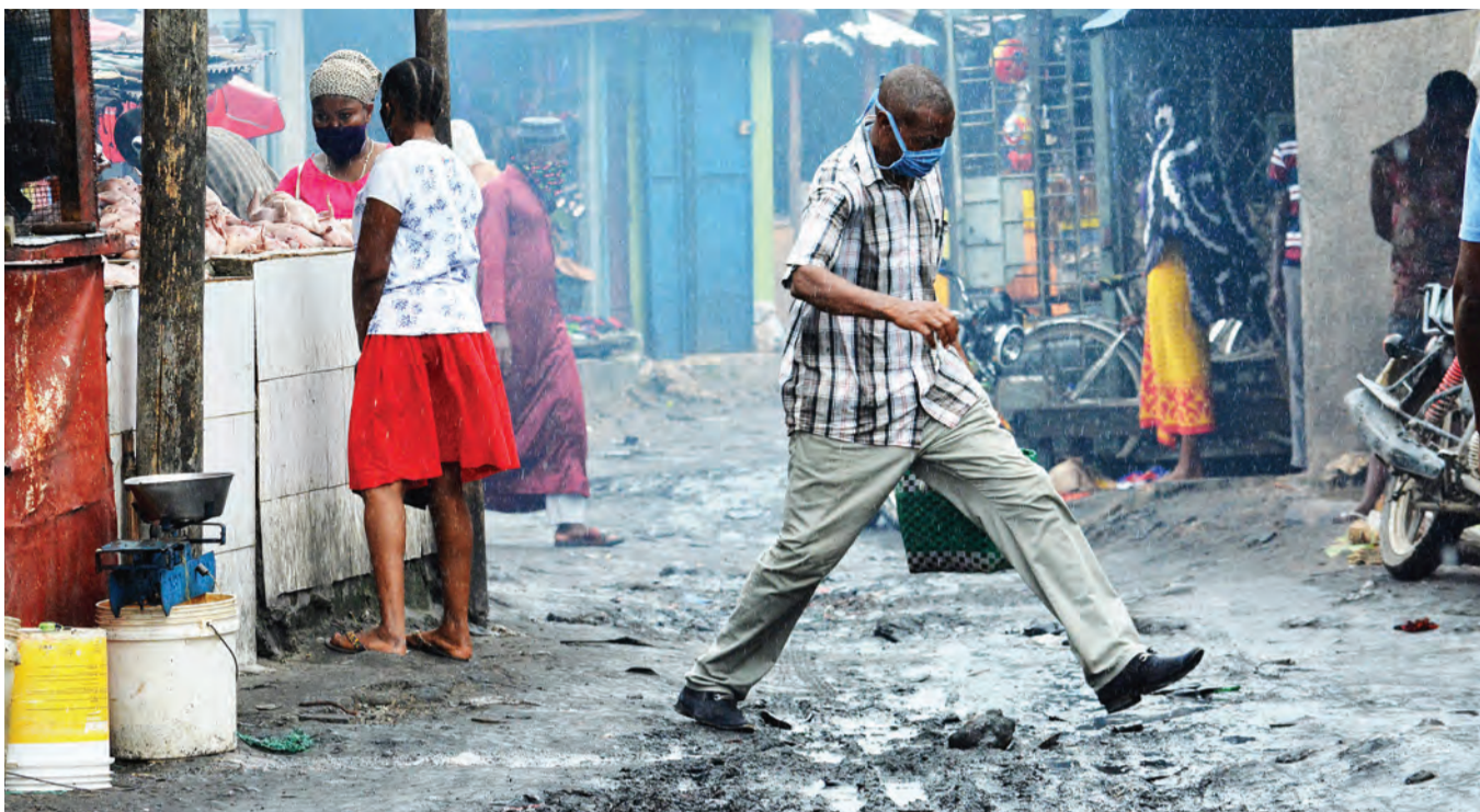
Mchuzi wa nyama ya kuku akifanya biashara katika mazingira hatarishi kwa afya za wateja wake, kutokana na tope jingi katika soko la Msasani 'Maandazi Road', jijini Dar es Salaam jana.