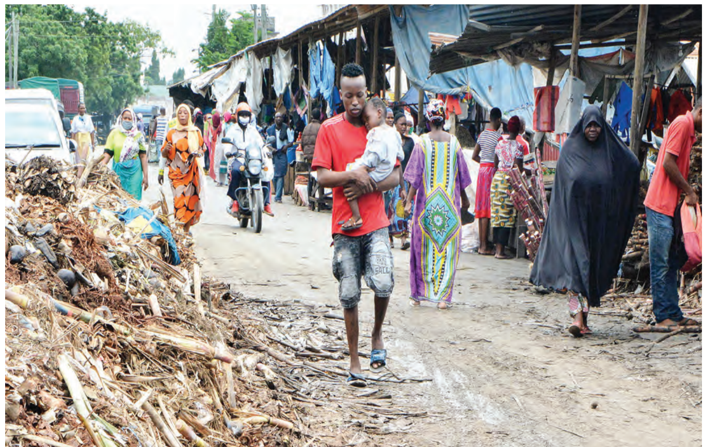
Wakazi wa Jiji la Dar es Salaam, wakipita jirani na rundo la takataka zilizotelekezwa kando ya barabara katika eneo la Tandale Sokoni, jijini humo jana, na kusababisha usumbufu kwa waenda kwa miguu na wafanyabiashara wenyewe.

“Nawasihi wajielekeze katika kulinda afya za wananchi wetu kwani serikali haitasita kuchukua hatua kali za kisheria kwa wote watakaobainika kujihusisha na vitendo vya aina hiyo,” alionya.