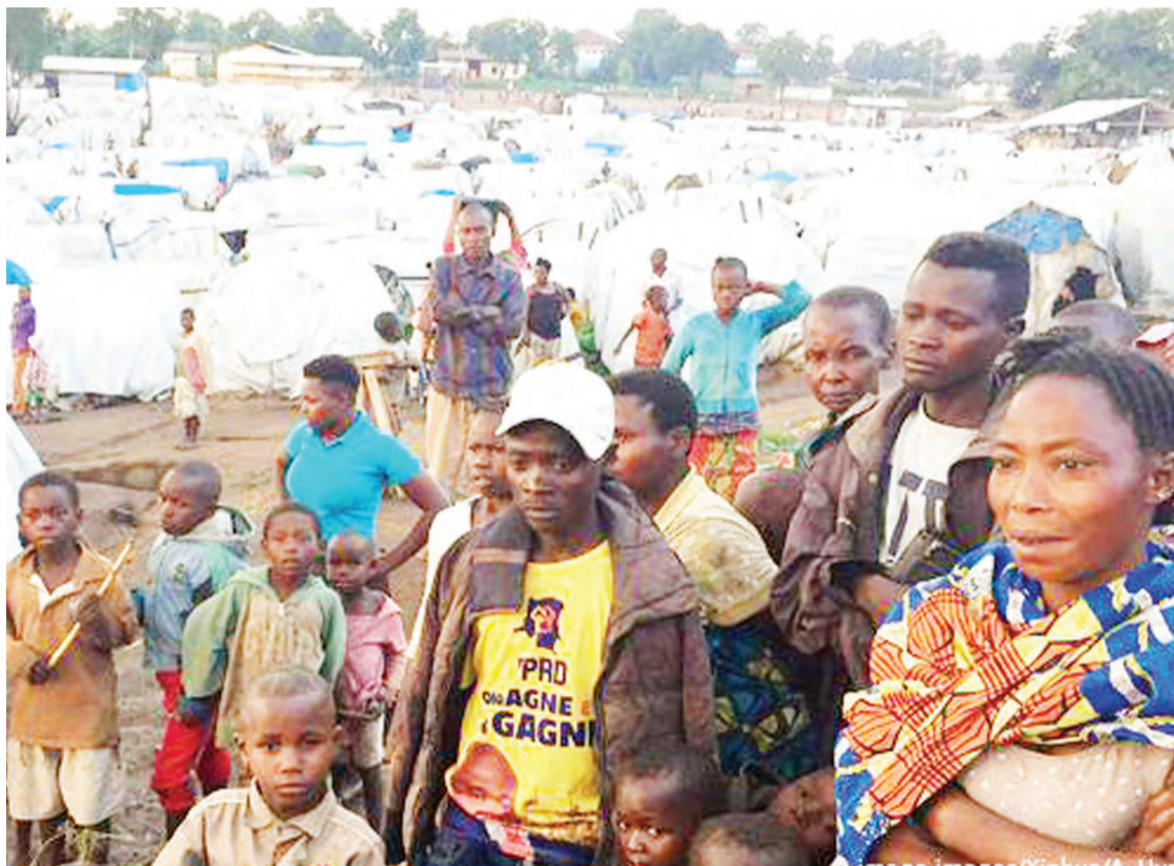
Mojawapo ya kambi ya wakimbizi wa ndani iliyoepo eneo la Ituri, Kaskazini Mashariki mwa Jamhuri ya Kidemokrasia ya Congo (DRC).