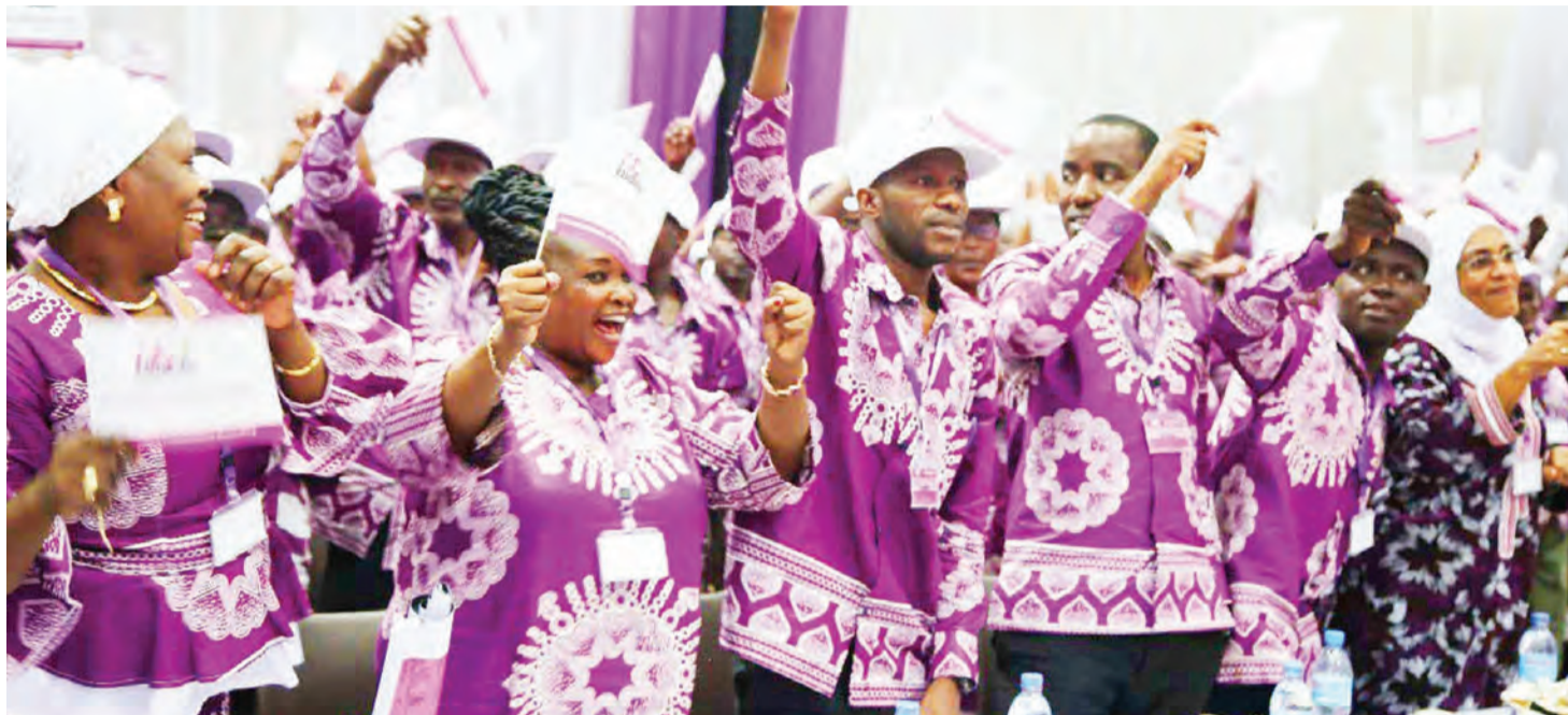
Wanachama wa ACT-Wazalendo wakipasha moto mchakato wa kuchagua viongozi, hivi karibuni.

Hali hiyo imeendelea kuvikumba vyama hivyo na huenda miezi michache kabla ya uchaguzi mkuu vikakimbiwa, hivyo ni wazi kwam-