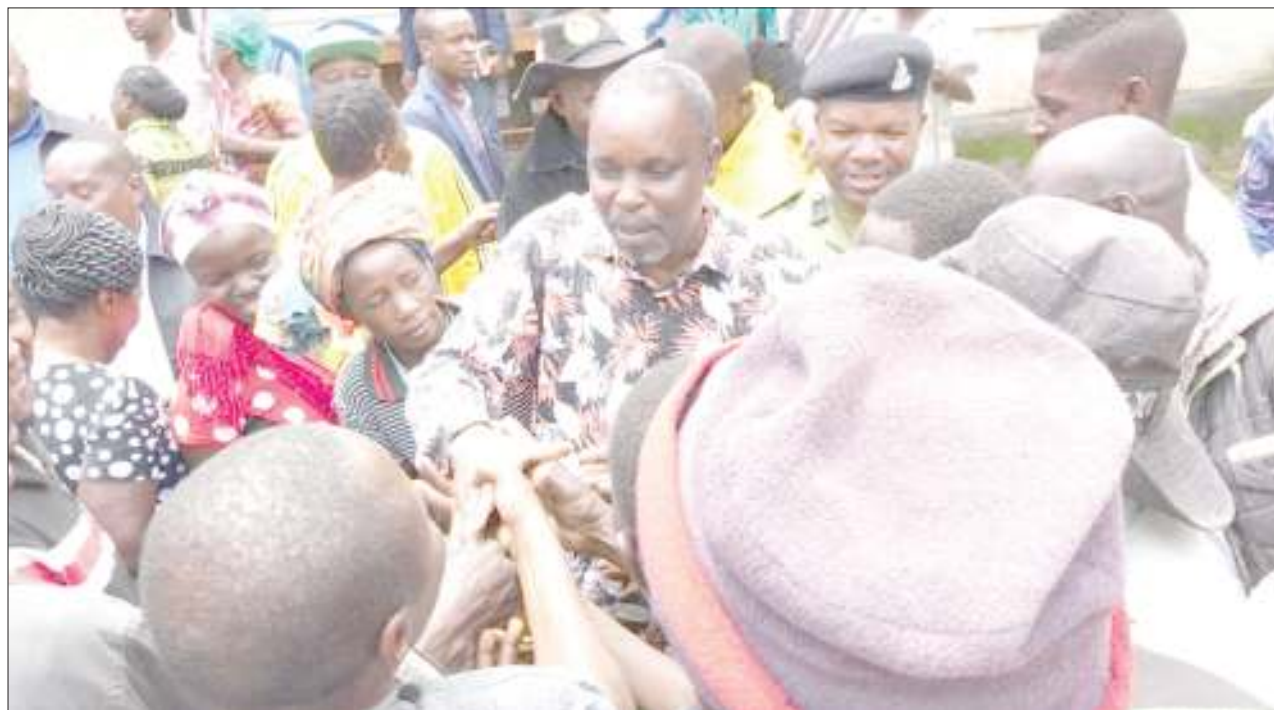
Waziri wa Mifugo na Uvuvi, Mashimba Ndaki, akisalimiana na baadhi ya wakulima na wafugaji wanaofanya shughuli zao kwenye Ranchi ya Usangu ili-yopo Wilaya ya Mbarali, mkoani Mbeya jana.

Awali, kulifanya msako na kumkamata mtu mmoja aliyeyiunganishia maji kinyume cha sheria ikiwa ni mwendelezo wa kuwakamata watuhumiwa wa aina hiyo.