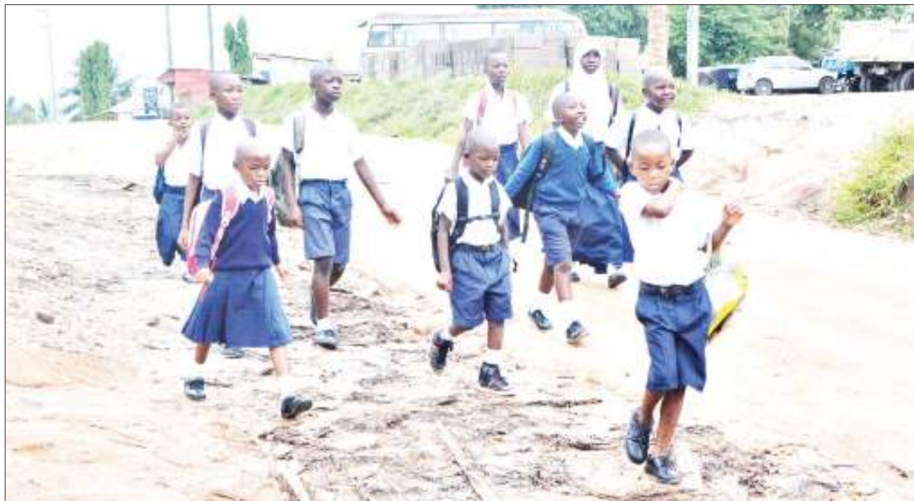
Wanafunzi wakitembea kwa miguu kuelekea shuleni umbali wa kilometa mbili katika eneo la Goba Tegeta A, jijini Dar es Salaam jana, kutokana na eneo hilo kukosa usafiri wa daladala kwa sababu ya ubovu wa barabara.

"Mkoa wetu unatarajia kuanjikisha wanafunzi wenye mahitaji maalumu 1,259 ndani ya mwaka huu na hiyo ni kwa halmashauri zote tisa zilizo katika mkoa wa Mtwara na tuna matumaini makubwa ya kufikia lengo hili," alisema.