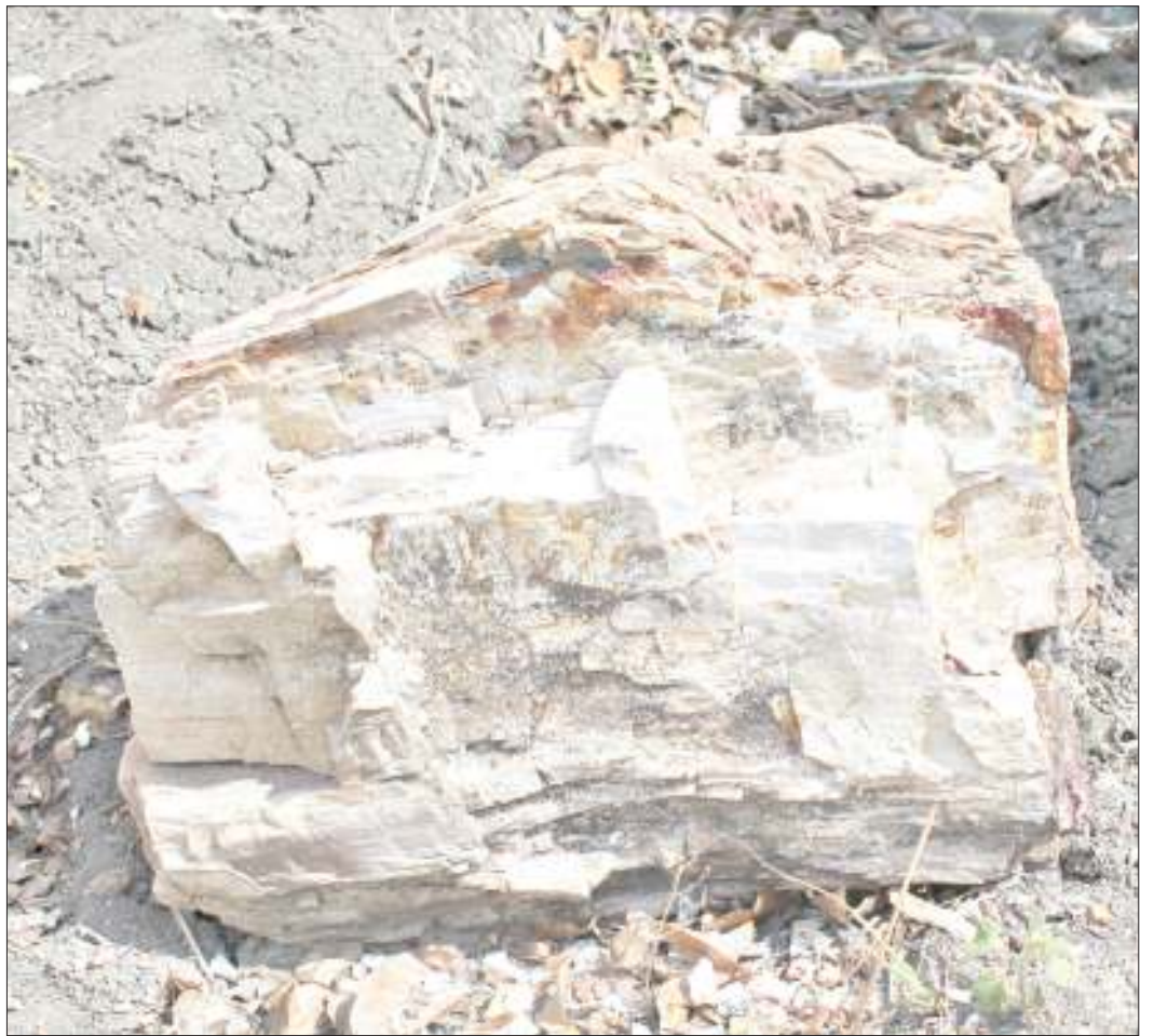
Gogo lililogeuka jiwe zito kwenye Msitu wa Mbogo wilayani Tunduru.

Kwa mujibu wa mhifadhi huyo, maeneo yote ambayo miti imegeuka mawe, hayakaliwi na watu wengi wala hakuna mtu anayeingia ndani ya eneo hilo, hivyo maeneo hayo yamebaki katika hali yake ya asili ya kiikolojia.