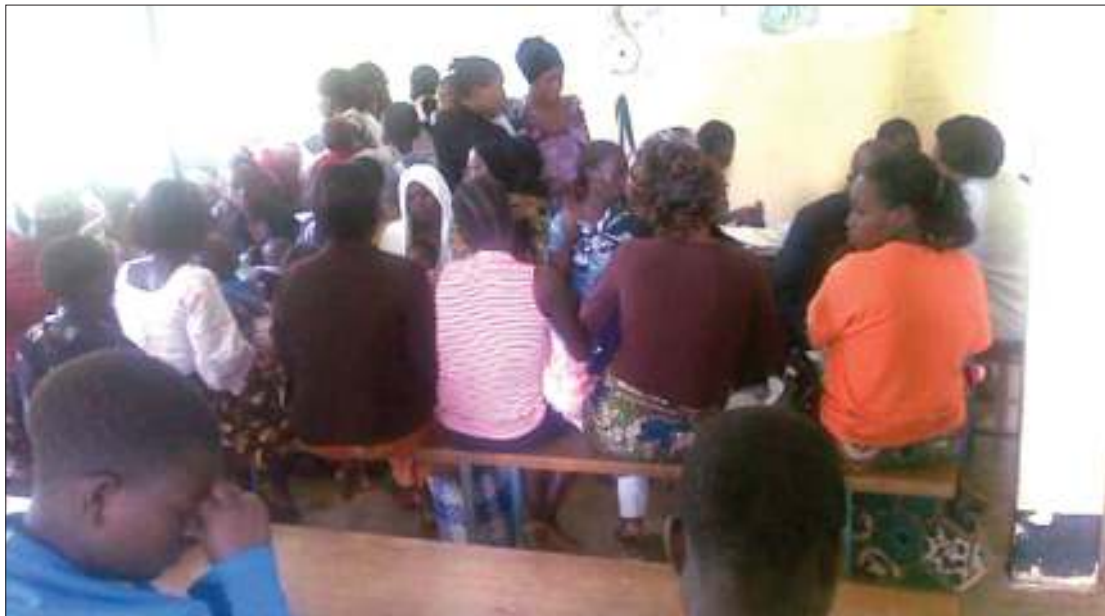
Moja ya kliniki za watoto iliyopo mkoani Kagera.