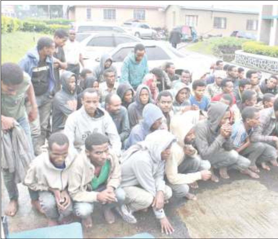
Kundi la Waethiopia 61 walionaswa na Jeshi la Polisi, wakisafirishwa kwa lori kuelekea nchini Malawi wakiwa chini ya ulinzi katika Kituo Kikuu cha Polisi jijini Mbeya jana.