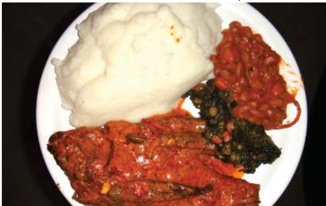
Aina tofauti za mlo ambazo watu wanatumia, kwa kiasi kikubwa huegemea kwenye ladha.

Ni kuanza ratiba au mpangilio mpya wa kuchukua chembe za lishe hizo kutokana na upatikanaji wake, hali inayofanya sukari au mafuta kutawala mwilini,