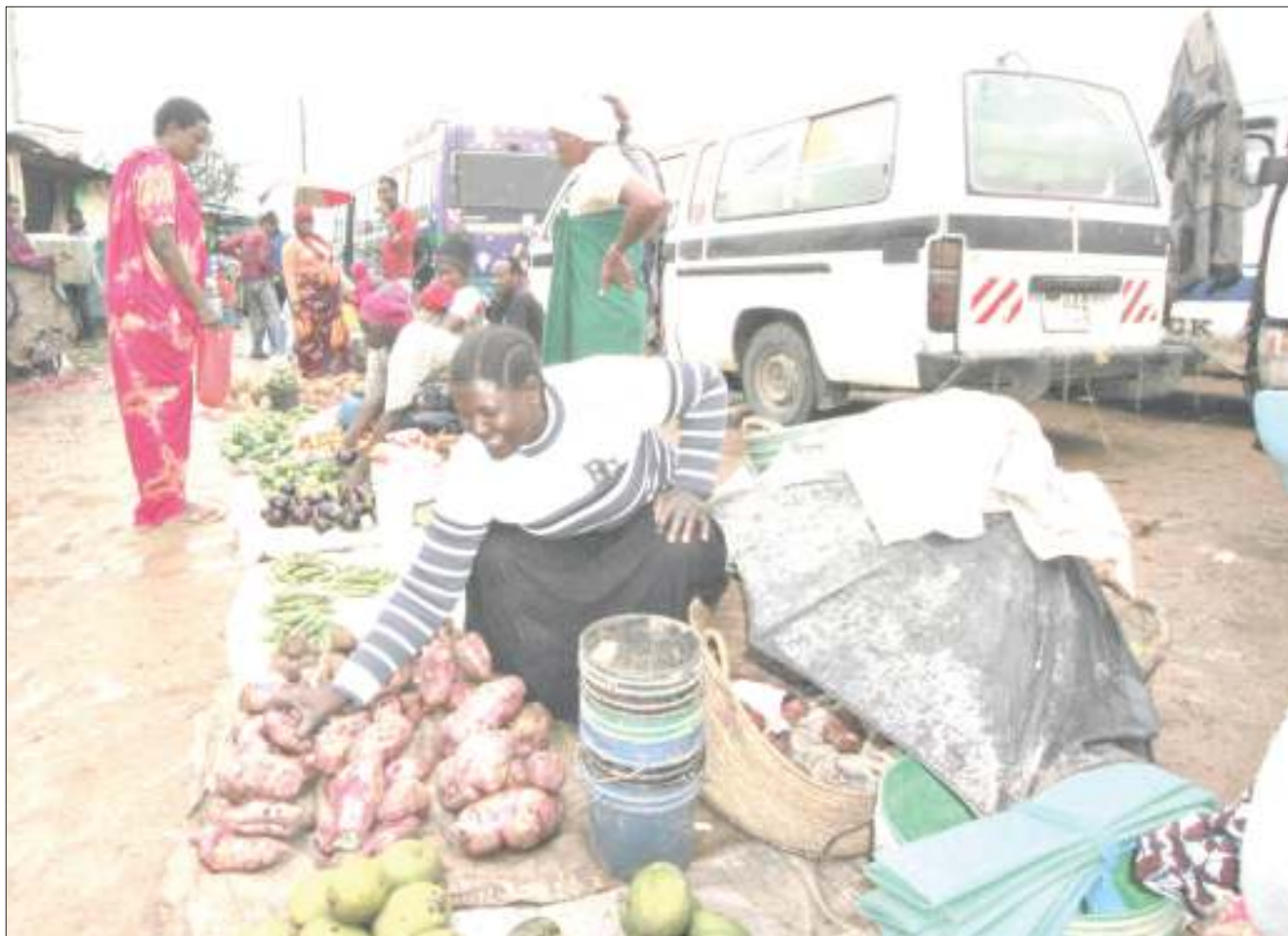
Kinamama wachuuzi wakifanya biashara katika mazingira hatarishi kiafya kutokana na kuzungukwa na matope katika soko la Sabasaba, jijini Dodoma jana.

“Tunategemea halmashauri kwa kushirikiana na TARURA wataitengeneza barabara hii ambayo ni muhimu kutokana na shughuli zinazofanyika za uvuvi ambao umekuwa ukieletea halmashauri mapato kwa ajili ya maendeleo yake,” alisema.