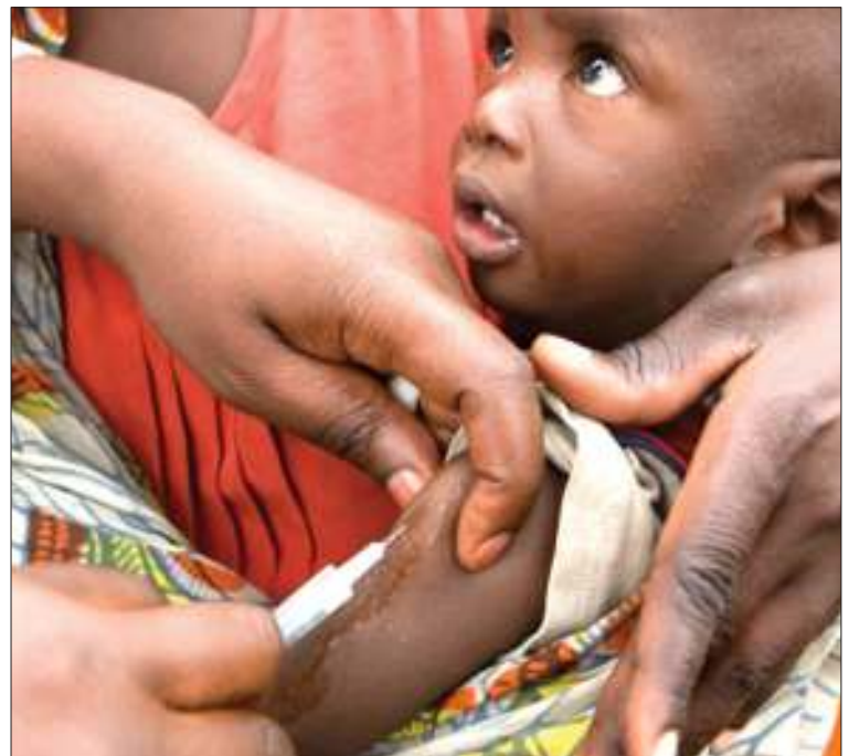
Mtoto akipatiwa chanjo.

Ofisa huyo anasema, kuna kipindi asasi yao iliamua kujenga zahanati katika Kijiji cha Kikukwe, Kata ya Kanyigo, wilayani Misenyi, lengo ni kuwasogezea karibu huduma za afya.