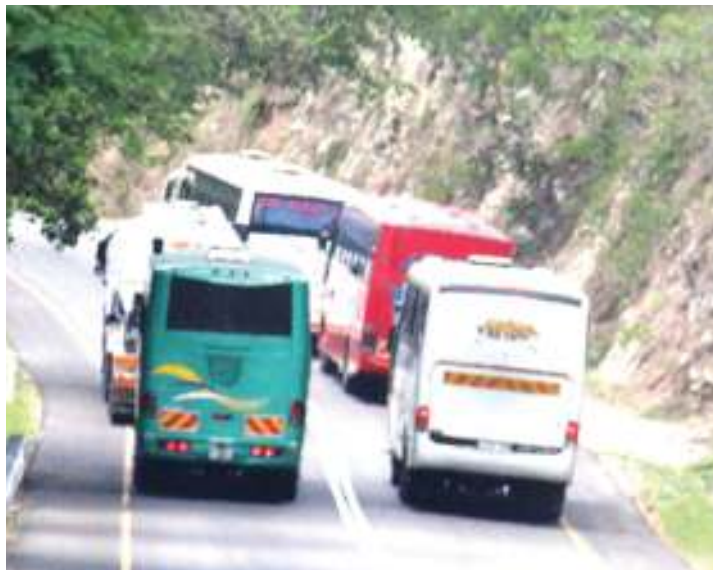
Picha kuhusu yanayojiri barabarani na kelele za vidhibiti mwendo.

Inazitaja athari hizo ni kuwaacha majeruhi kila kona ya dunia na inaongeza mamilioni wanaosalia kuwa tegemezi wa kudumu katika baadhi ya mambo, kutokana na