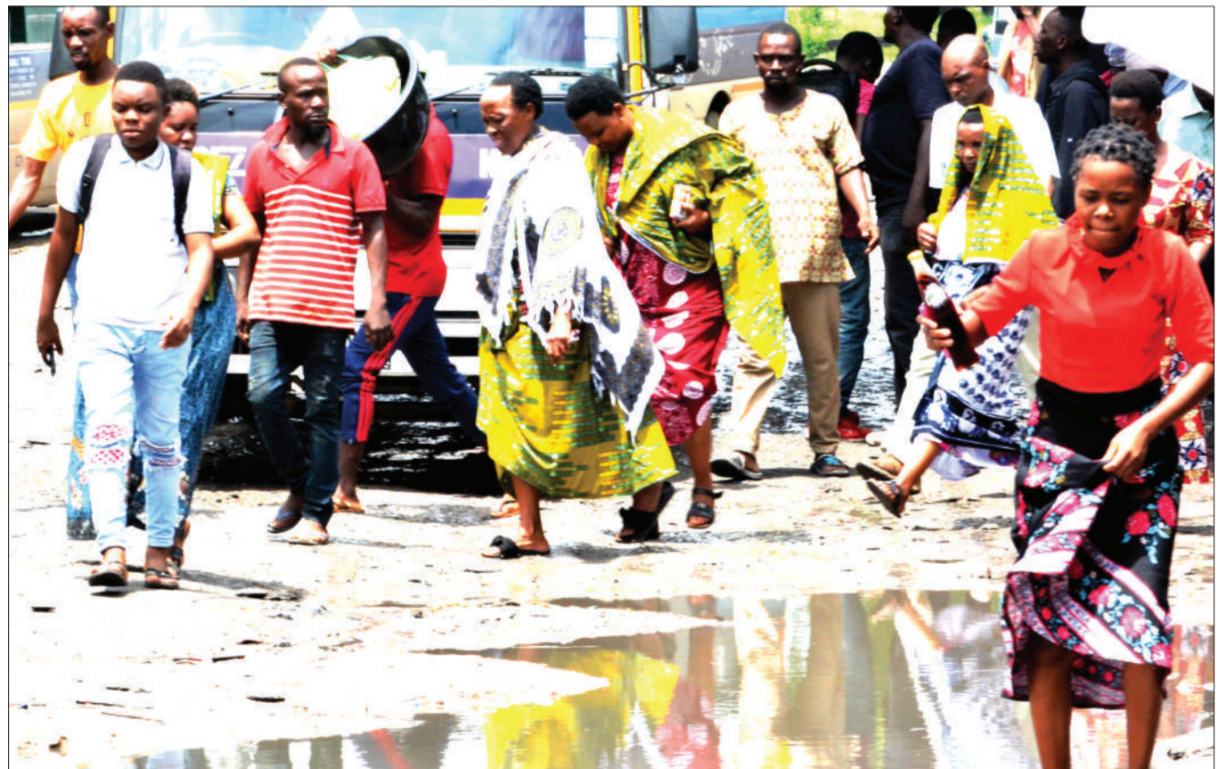
Abiria wakipita kwa shida kutokana na matope, baada ya kushuka kutoka kwenye mabasi ya daladala katika stendi ya Kawe jijini Dar es Salaam mwishoni mwa wiki.

Pia, mkurugenzi huyo alitumia fursa hiyo kuishukuru Serikali ya Awamu ya Tano kwa kuboresha mazingira ya uwekezaji nchini.