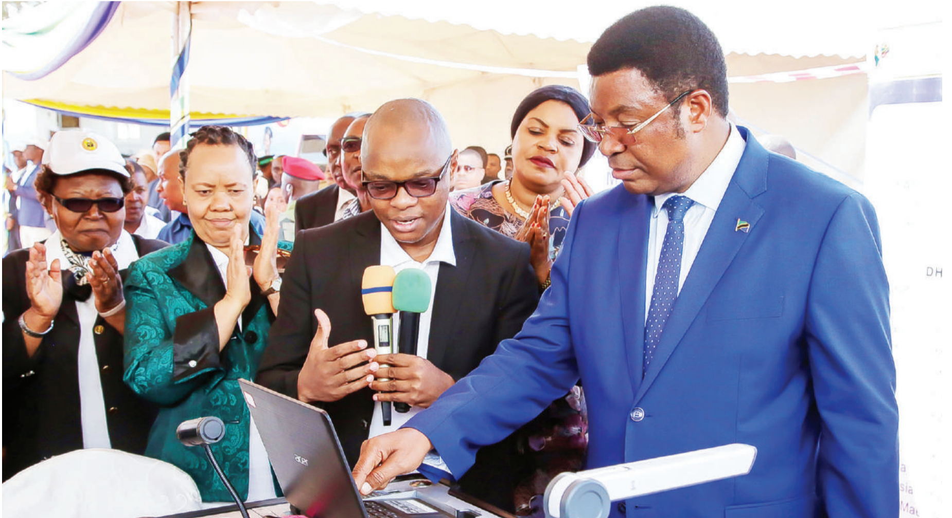
Waziri Mkuu, Kassim Majaliwa, akifuatilia usajili wa wapiga kura kwa kutumia teknolojia ya bayometriki- BVR