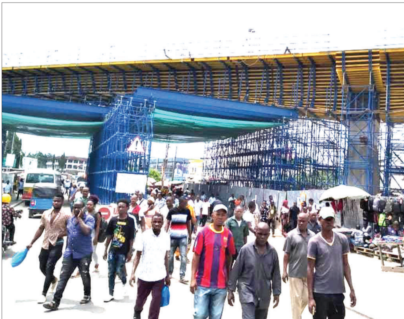
Mwonekano wa ujenzi unaoendelea wa daraja la treni ya kisasa, unaoifanywa na kampuni ya Yapi Merkezi ya Uturuki, katika eneo la Kamata, jijini Dar es Salaam jana.

Pia makandarasi hao wamekabidhi vifaa mbalimbali vya tiba Hospitali ya Rufani Amana iliyopo Manispaa ya Ilala.