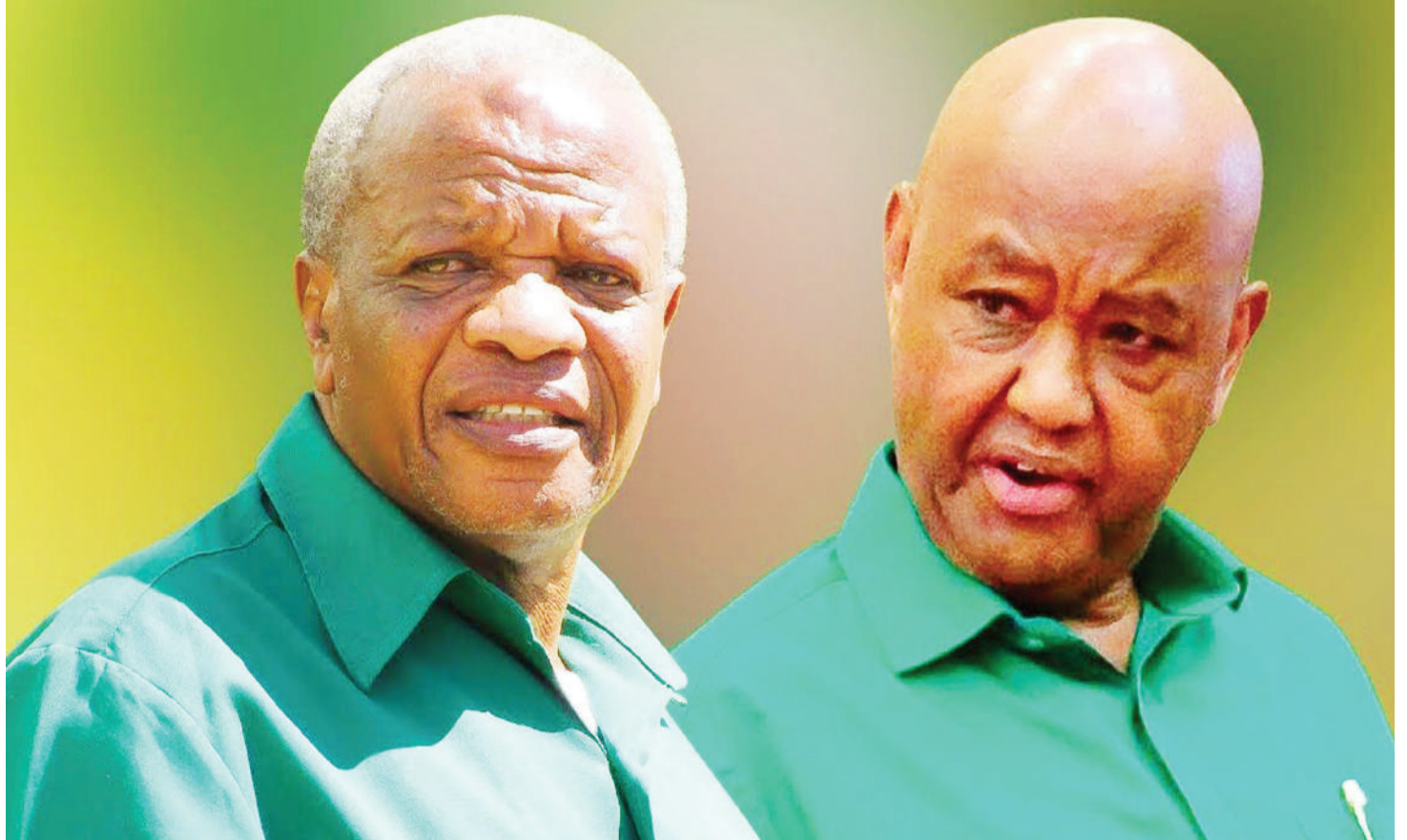
Makatibu wakuu wastaafu Kinana na Makamba.

Ileweke kuwa hapa siingili mamlaka ya Kamati ya Maadili ya CCM ambayo ndiyo yenye jukumu la kulinda maadili yetu. Ninakumbusha tu machache niliyonayo hususan kwa wanachama wenzangu na umma kwa ujumla.