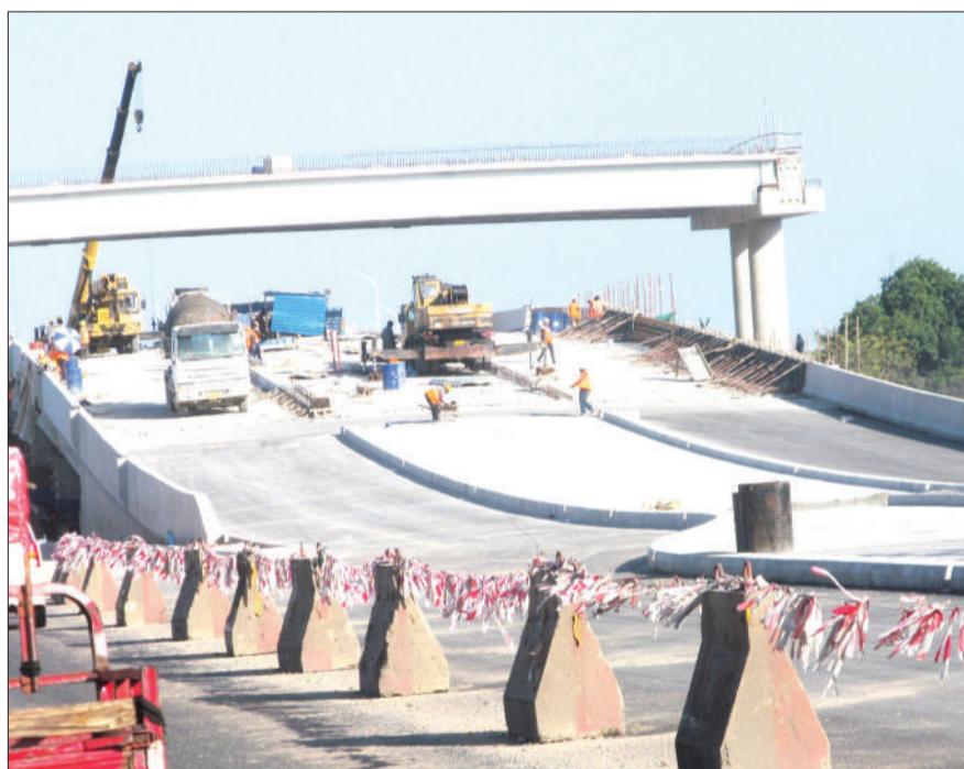
Ujenzi wa barabara za juu (Interchange), ukiendelea katika eneo la Ubungo jijini Dar es Salaam jana, ambapo ukikamilika unatarajia kupunguza msongamano wa magari kwenye eneo hilo.