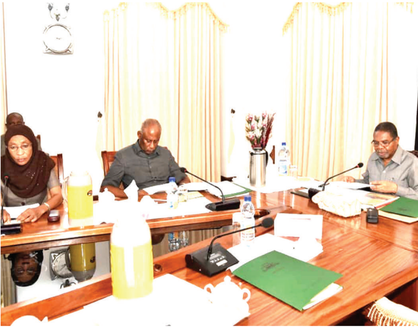
Rais wa Zanzibar, Dk. Ali Mohamed Shein, akizungumza na uongozi wa Wizara ya Uchukuzi na Mawasiliano, Ikulu mjini Zanzibar, juzi.

"Zamani tulikuwa tunaenda pwani kuvua pweza, lakini kutokana na kuwa hakukuwa na utaratibu, tulikuwa tunapata mavuno madogo ambayo wakati mwingine hupata kitoweo tu, lakini sasa kwa utaratibu huu tunavua pweza ambao hata kama siyo sawa na wanaume, lakini tunapata mpaka laki na nusu (Sh. 150,000)," alitamba.