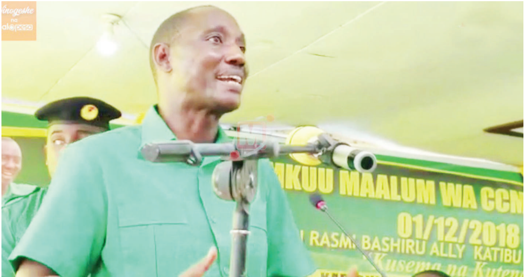
Katibu Mkuu wa CCM, Bashiru Ally.