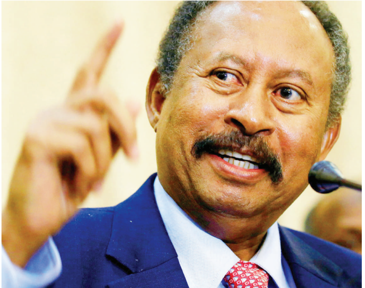
Waziri Mkuu wa Sudan Abdalla Hamdok, anayepambana na changamoto za kujikwamua kiuchumi.