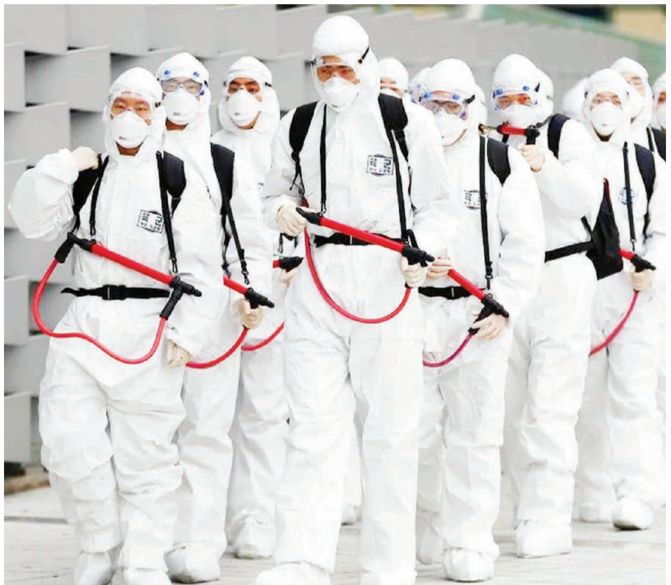
Wanajeshi wa Korea Kusini katika zoezi la kupambana na kuenea kwa virusi vya Covid-19 huko Daegu