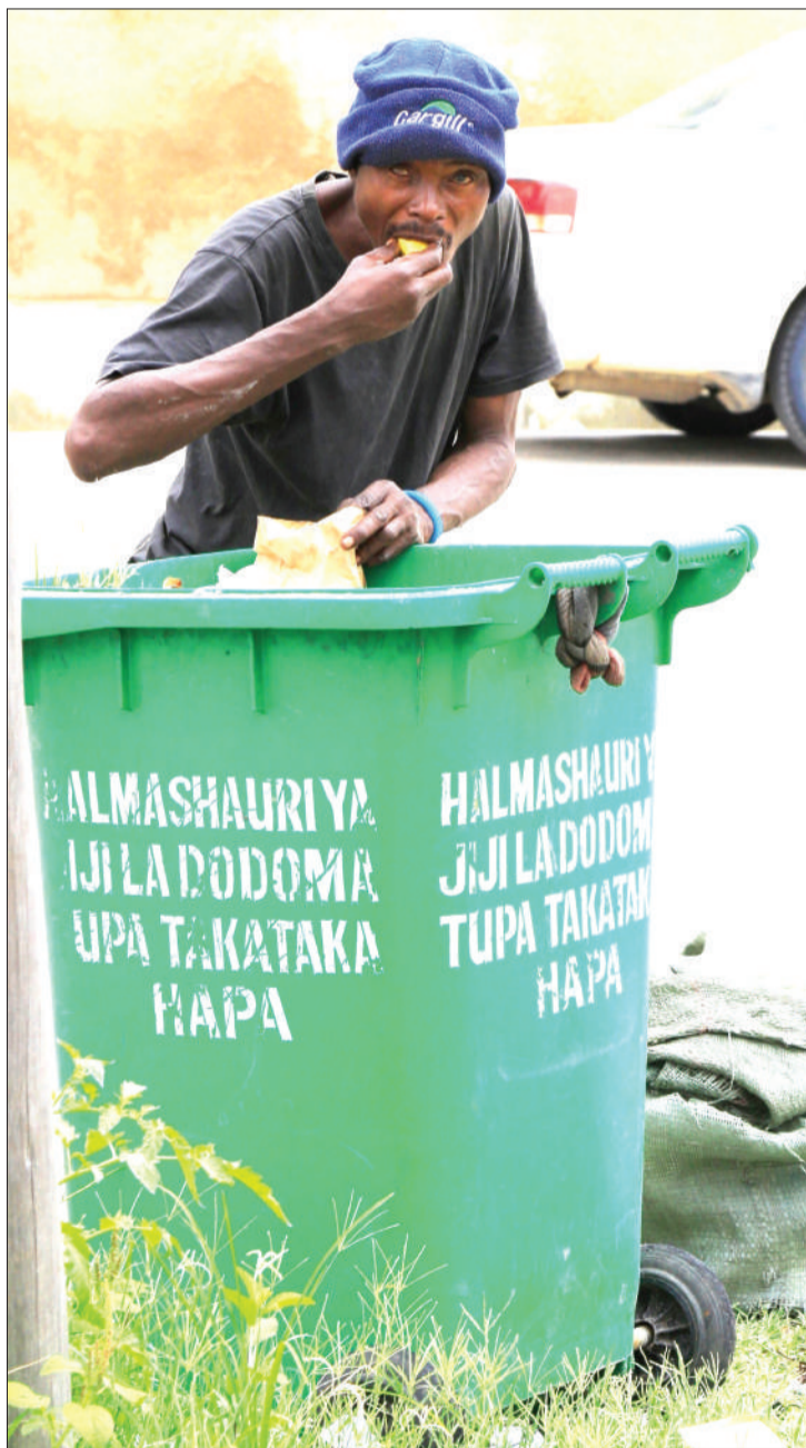
Mwokota chupa tupu za plastiki, akila mabaki ya vyakula vilivyotupwa kwenye chombo cha kuhifadhiwa takataka katika eneo la Barabara ya Mbeya, jijini Dodoma jana, kitendo ambacho ni hatari kwa afya yake.

Alisema kwa mwaka huu wamepokea maombi 583 na kutakuwa na makundi saba ambapo kila kundi litatoa washindi watatu ambao mshindi wa kwanza atapata Sh. milioni tano, wa pili atapata Sh. milioni tatu na mshindi wa tatu atapata Sh. milioni mbili.