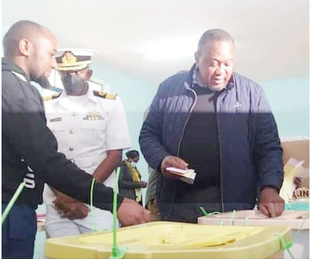
Rais Uhuru Kenyatta akipiga kura katika uchaguzi mkuu uliofanyika nchini humo jana.

Pia baadhi ya maofisa wa majimbo walisema bado kuna mengi yanapaswa kujadiliwa ili kuhakikisha suala hilo linafikia hatua nzuri za maelewano kwa kufuata hatua zote muhimu za upendekezaji wa sheria hiyo. DW