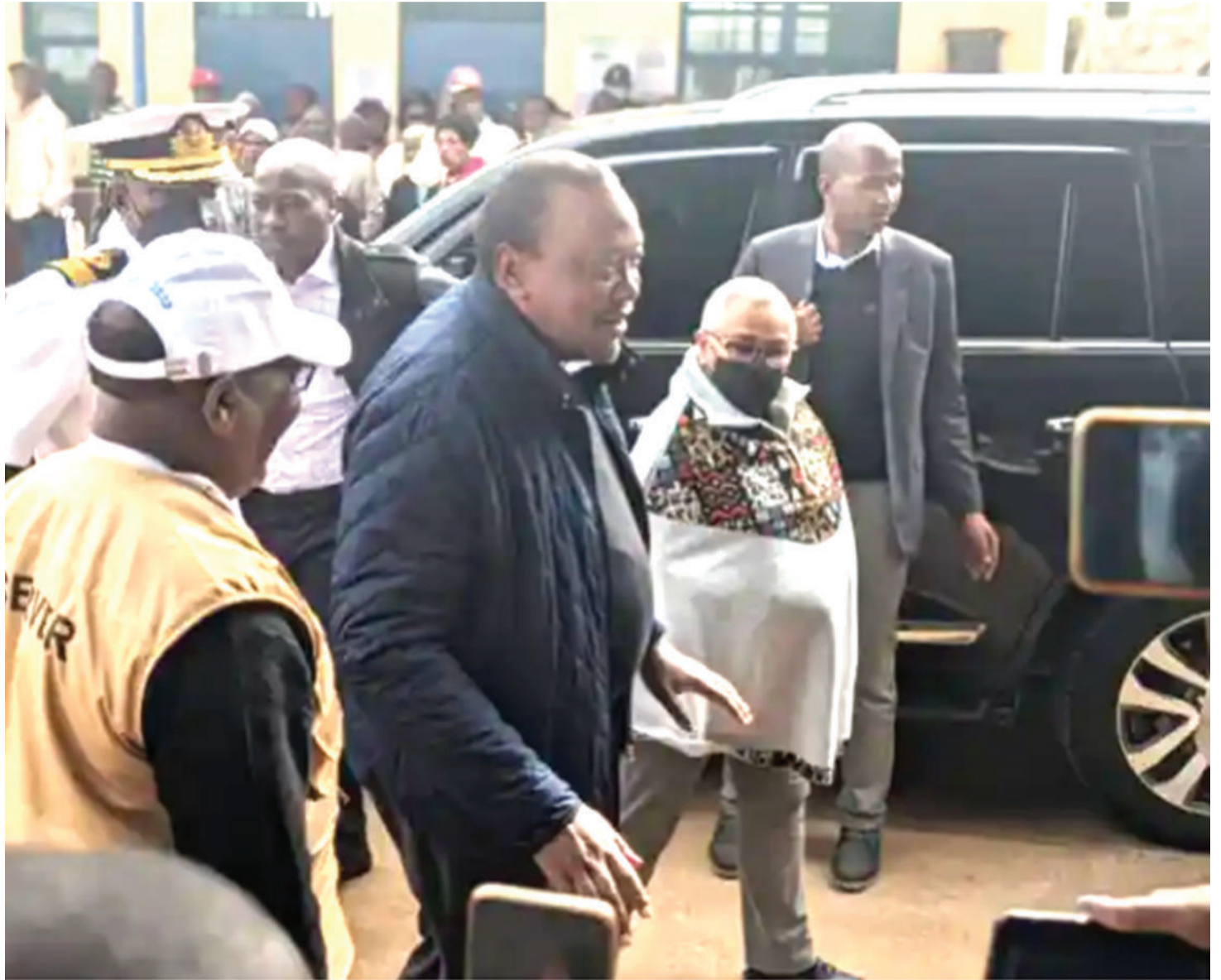
Rais wa Kenya, Uhuru Kenyatta, akiwasili jana kupiga kura katika kituo cha Gatundu, mji alikozaliwa.

"Kenya imepiga hatua sasa kuonekana kwamba makabila yanaweza kukubali kushiriki-