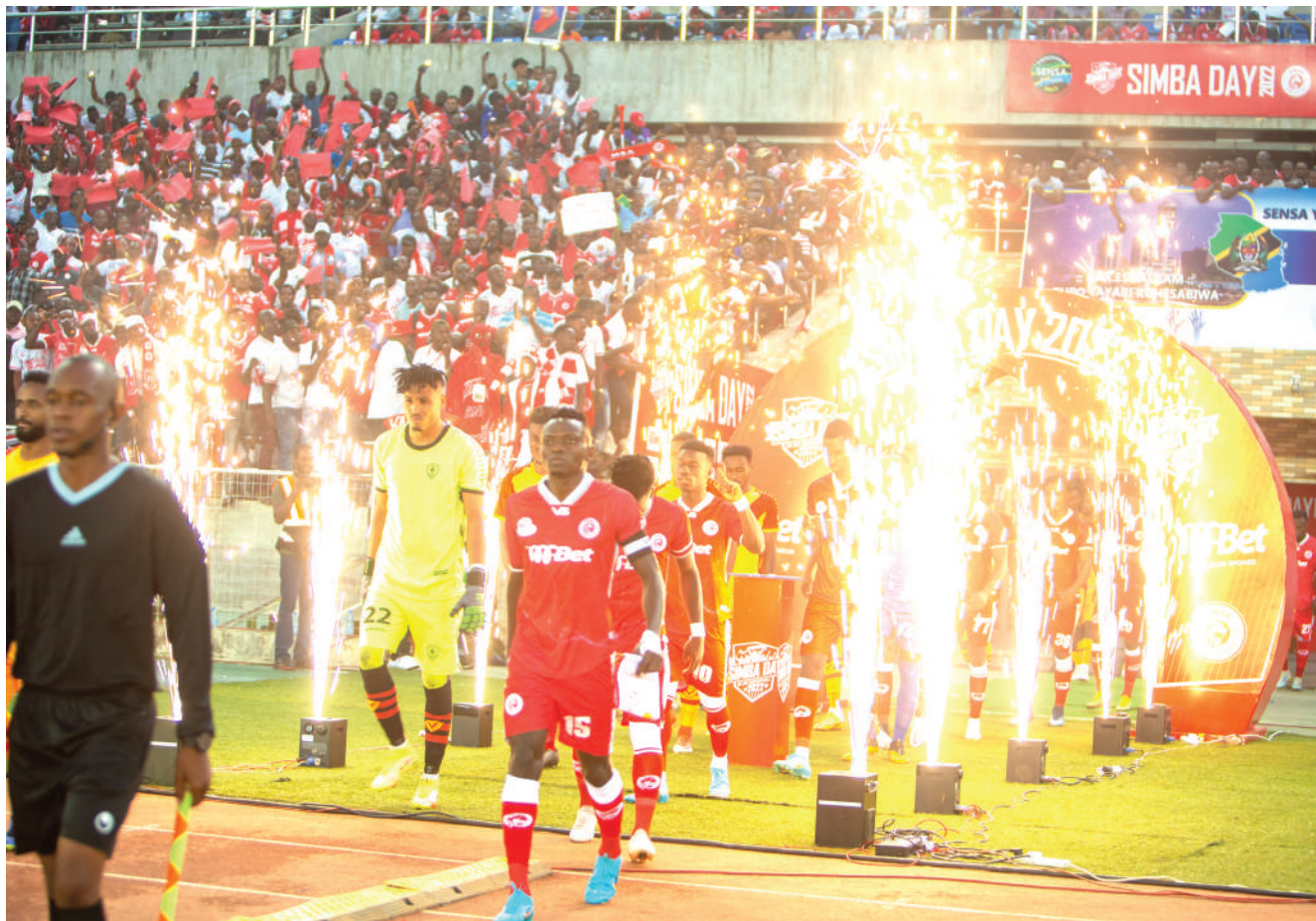
Wachezaji wa Klabu ya Simba na St. George wakiingia uwanjani tayari kwa ajili ya kuanza mechi ya kirafiki iliyopigwa dimba la Benjamin Mkapa juzi na wenyeji kushinda mabao 2-0.

M-BET itazidi kuongezea Simba fedha kwani mwaka wanne wataipa Sh. bilioni 5.5 huku mwaka wa tano ikiipa kiasi cha Sh. bilioni 5.8.