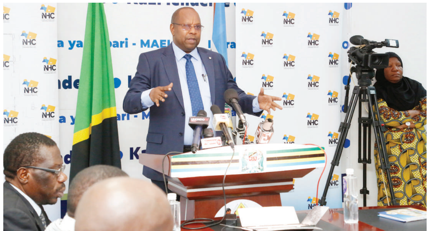
Meneja Habari na Uhusiano wa Shirika la Nyumba za Taifa (NHC), Muungano Saguya, akizungumza na waandishi wa habari jijini Dodoma jana, kuhusu utekelezaji na mwelekeo wa shirika hilo kwa bajeti ya mwaka 2022/2023 ambapo wanatarajia kuanza mradi wa nyumba 5,000 ujulikanao kwa jina la Samia Housing Scheme na utagarimu Sh. bilioni 466.

Alisema watatengeneza utaratibu wa uwezeshwaji vyama vya ushirika ili kuongeza ufansi.