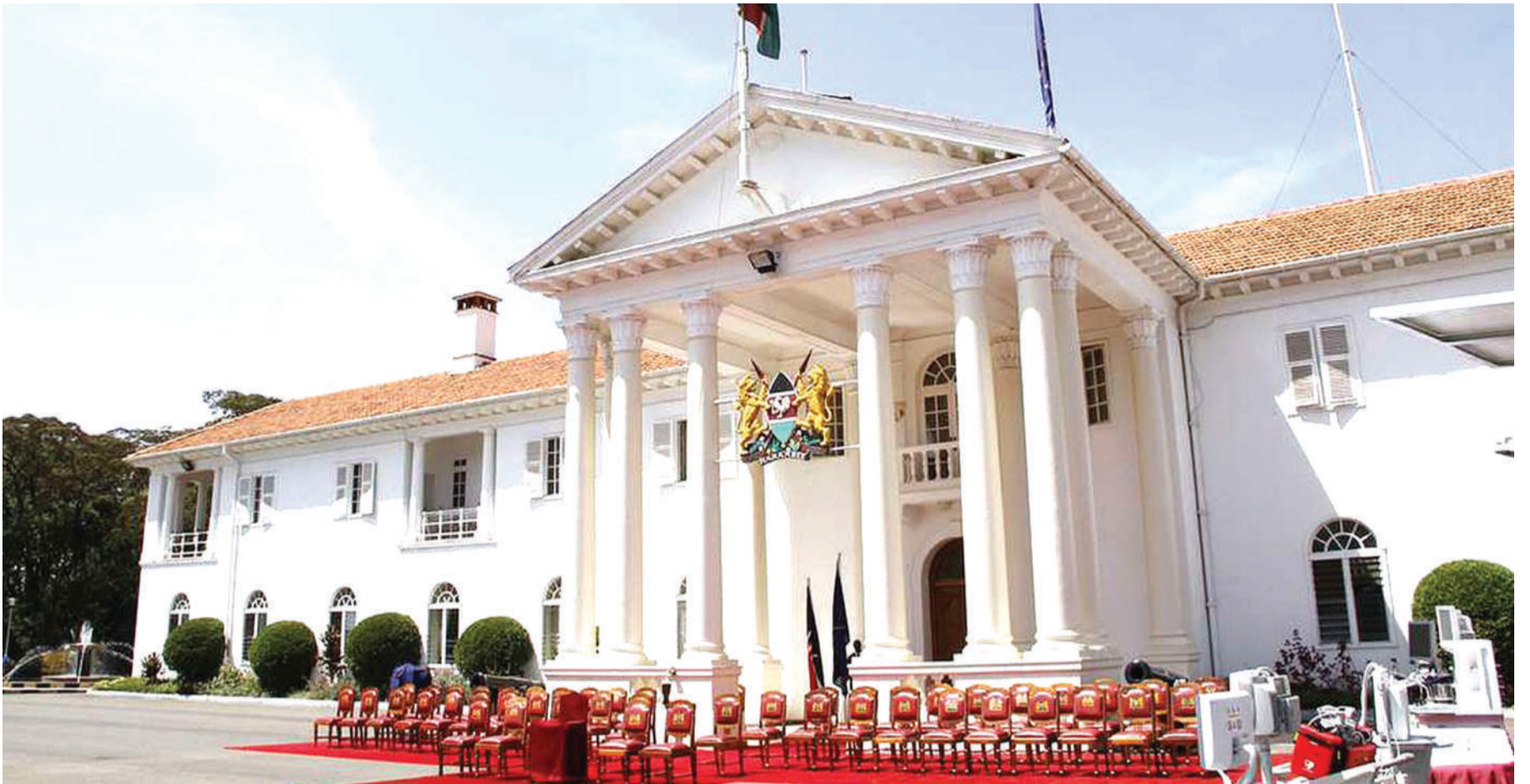
Ikulu ya Nairobi .