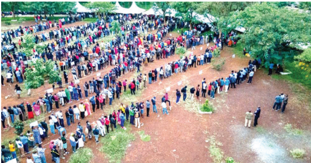
Mamia ya wapigakura kwenye misururu wakiwa katika kituo cha kupigia kura nchini Kenya.

Wagombea wengine ni George Wajackoyah wa Chama cha Roots na David Mwaure wa Chama cha Agano, ambao wanaweza kuitwa wasindikizaji.