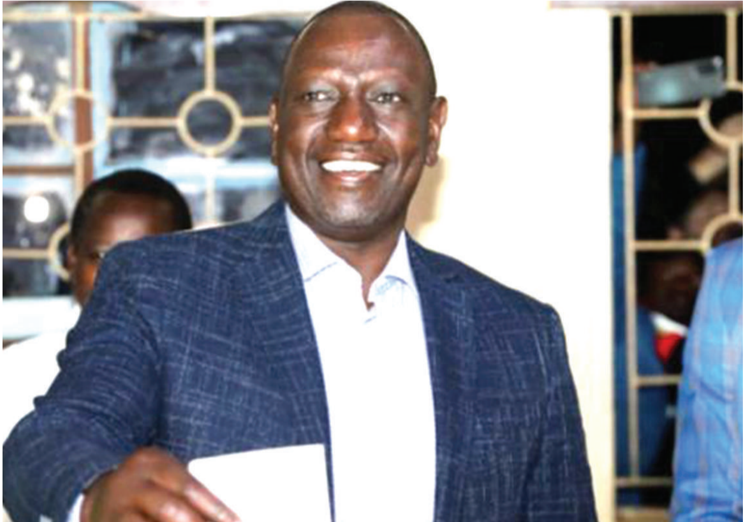
Naibu Rais wa Kenya na mgombea urais William Ruto akipiga kura yake jana alfajiri katika kituo cha Shule ya Msingi Kosachei.