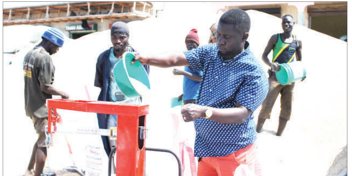
Mnunuzi wa nafaka na msafirishaji wa kampuni ya Madinda Store, Madinda Chibago, akipima mtama kwenye mizani kwa ajili ya kuhifadhi kwenye mifuko, baada ya kununua kutoka kwa wakulima, mkoani Dodoma hivi karibuni.

Kamishna huyo alisema Wizara ya Fedha itaendelea kutoa fedha kwa ajili ya miradi mbalimbali ambayo ina manufaa kwa nchi.