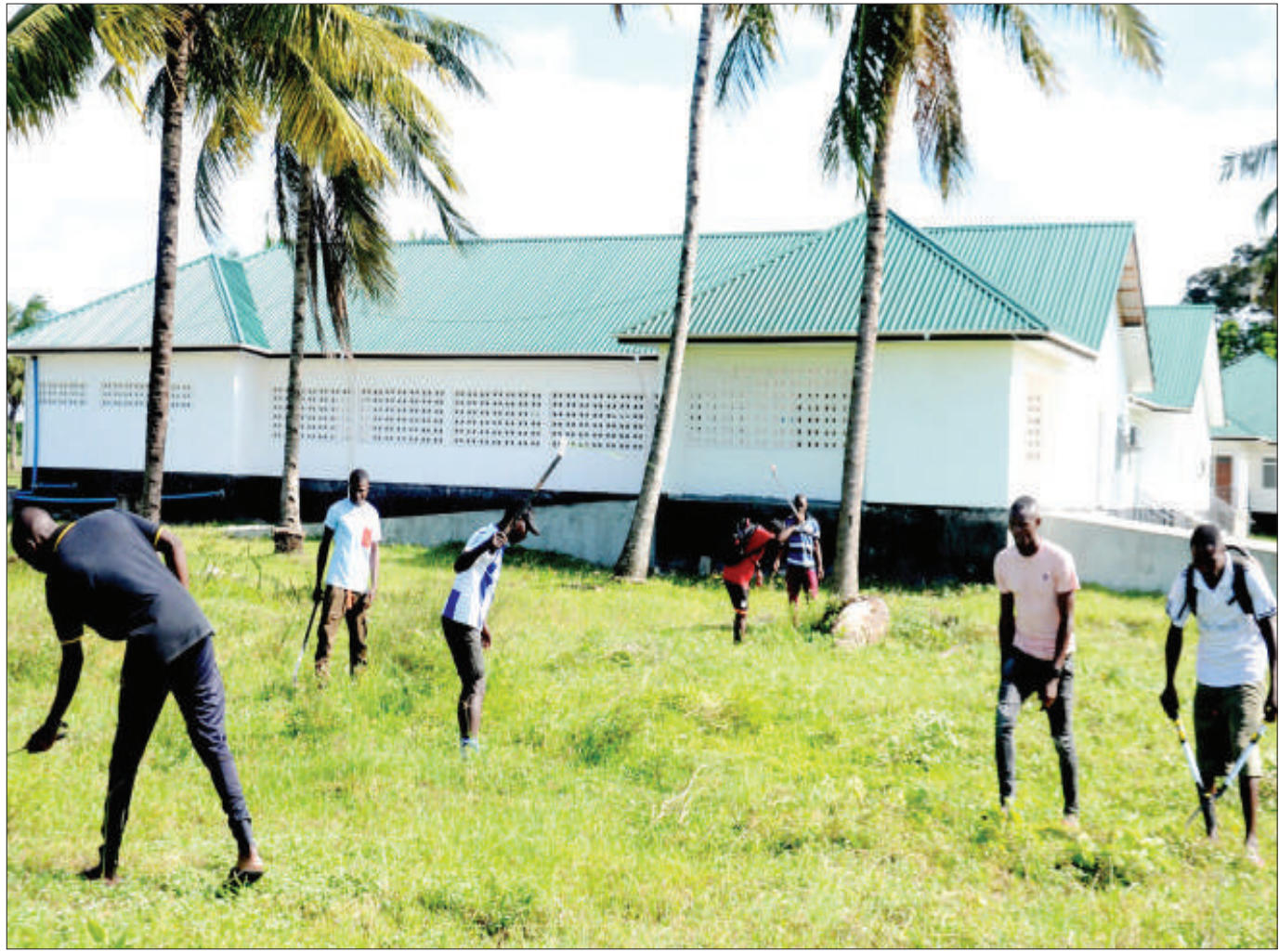
Wachezaji wa timu ya Fedha FC ya Kivule, wakifanya usafi katika eneo la Hospitali ya Wilaya ya Ilala, Kivule jijini Dar es Salaam hivi karibuni.