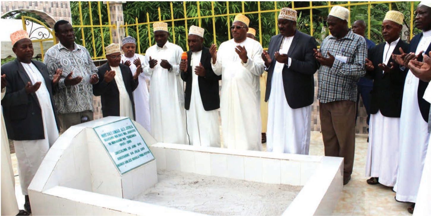
Baadhi ya viongozi wa serikali na jamaa wakiomba dua kwenye kaburi la Dk. Omar lililoko kijijini kwao kisiwani Pemba.

■ Shujaa kuondoa umaskini, Baba MKUKUTA na NEP