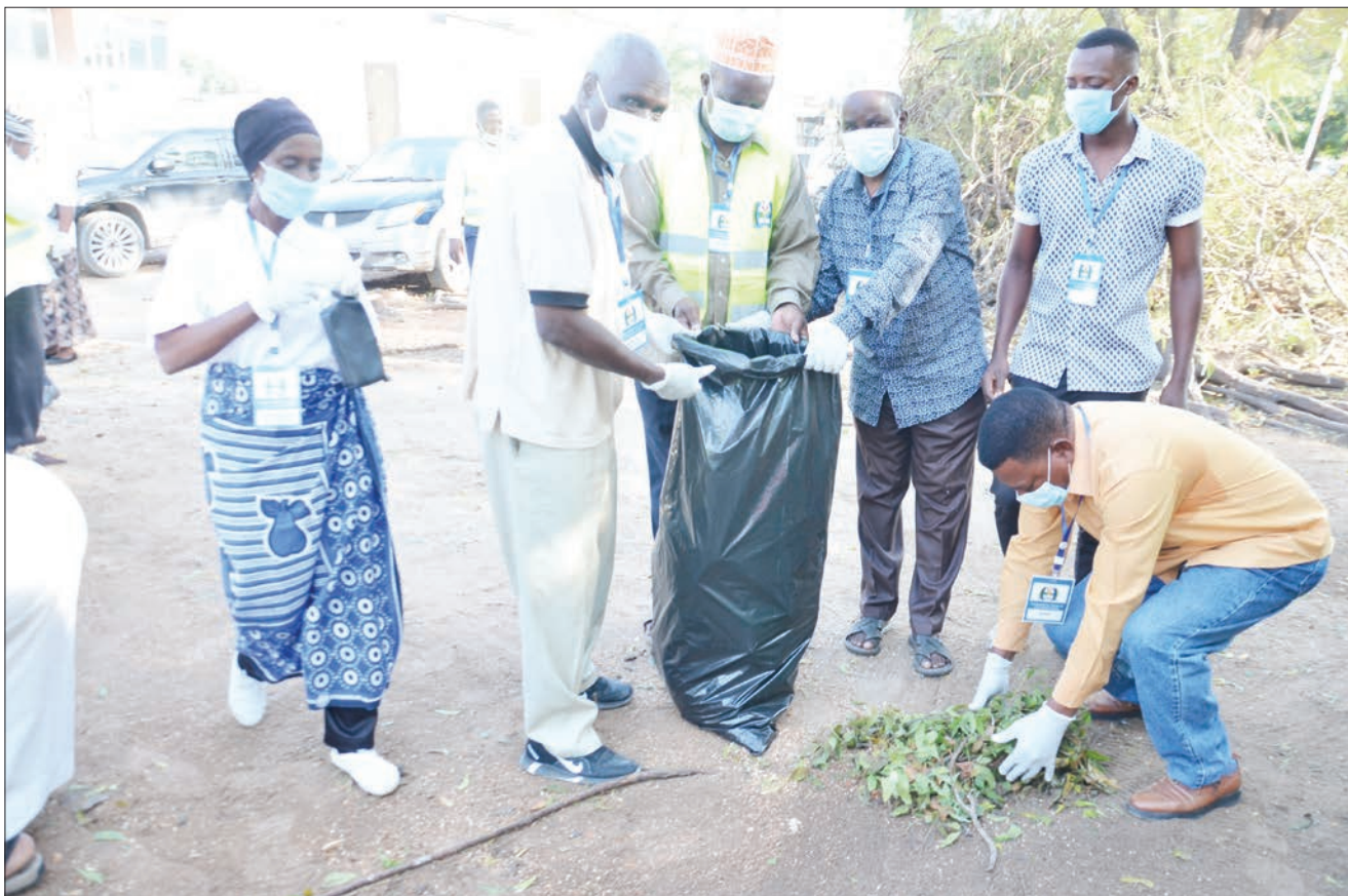
Wanaumojwa wa Taasisi ya Tanzania Peace (TPF), wakifanya usafi katika Hospitali ya Mwananyamala, jijini Dar es Salaam mwishoni mwa wiki, baada ya kukabidhi misaada ya vitu mbalimbali hospitalini hapo.

“Tunaipongeza HakiElimu kwa jitihada zake ambayo imekua ikizifanya katika sekta hii, kama serikali tumekuwa tukifanya nao kazi pamoja japokuwa kila mmoja anakwenda kwa approach yake,” alisema Prof. Nombo.