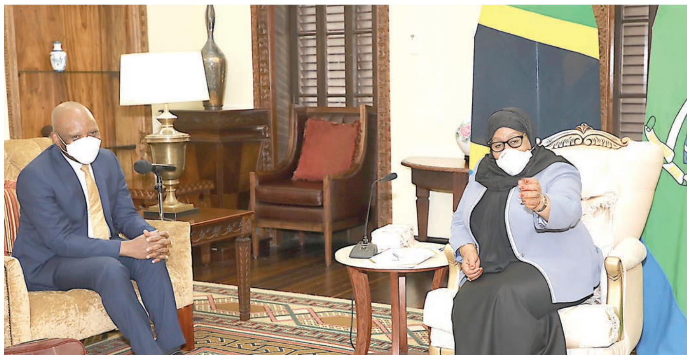
Rais Samia Suluhu Hassan, akizungumza na Mkurugenzi wa Kituo cha Kudhibiti na Kuzuia Magonjwa (CDC) barani Afrika, Dk. John Nkengasong, Ikulu jijini Dar es Salaam jana.

Majaliwa alisema serikali imeleta chanjo hiyo ili kutoa fursa kwa Watanania watakuhitaji kuchanjwa kwa ajili ya kujikinga na ugonjwa wa UVIKO 19, waweze kuipata kwa ukaribu na urahisi zaidi na si vinginevyo.