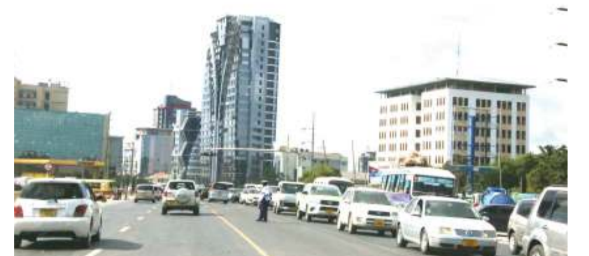
Sehemu ya majengo ya biashara yanayoendelea kujengwa kando ya barabara ya Bagamoyo eneo la Kijitonyama jijini Dar es Salaam, ambayo yanaongeza wigo wa upangaji wa ofisi za biashara.