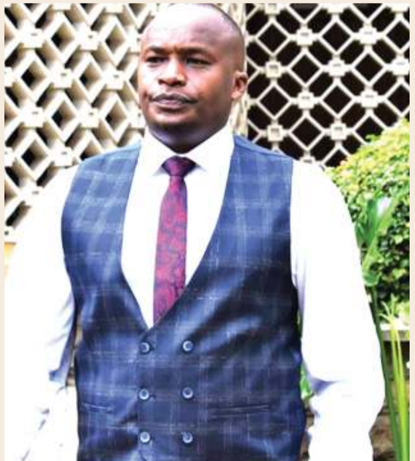
Mbunge wa Jimbo la Starehe nchini Kenya, Charles Jaguar Njagua.

Rekodi ya Jaguar ndiyo ya kwanza iliingia sokoni mnamo mwaka 2004 na baadaye akajiunga na kampuni ya muziki ya Afrika Mashariki Ogopa Dee Jays mnamo mwaka 2005 na kuipua miziki mmoja baada ya mwingine miongoni mwake ni "kigeugeu." Uliovuma sana na kupokea tuzo nyingi.