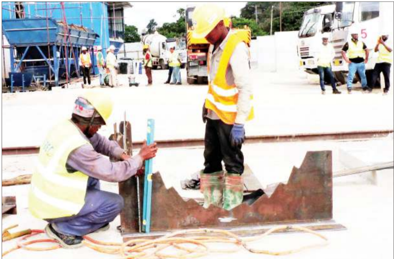
Mafundi wakiendelea na kazi za awali za maandalizi ya ujenzi wa daraja jipya la Salender litakaloanzia eneo la Aga Khan Upanga hadi ufukwe wa Coco, Oysterbay, jijini Dar es Salaam jana.

Waziri Kamwelwe aliwataka LATRA, kutoa elimu kwa wadau wote na umma kwa ujumla kuhusiana na mfumo.