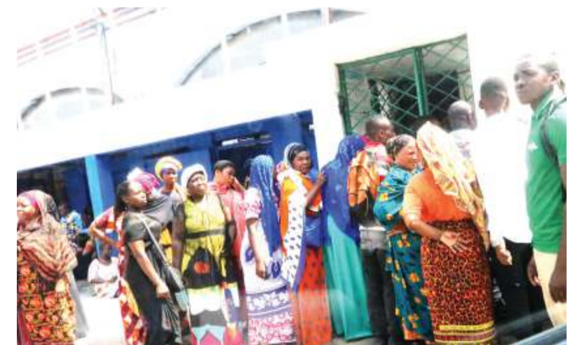
Baadhi ya wananchi wa jijini Dar es Salaam wakiwa kwenye Uwanja wa Maonyesho ya Kimataifa ya Biashara kufuatilia majina yao ya kuruhusiwa kufanyakazi na biashara ndogo kwenye uwanja huo jana.