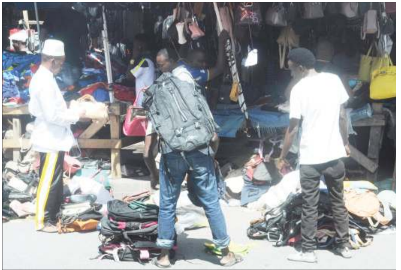
Wakazi wa Jiji la Dar es Salaam, wakichagua mikoba ya mitumba kando ya Barabara ya Morogoro, eneo la Manzese, jana. Wananchi wengi wa kipato cha kati na chini hupendelea matumizi ya bidhaa za mitumba kutokana na unafuu wa bei.

Alisema wanaipongeza serikali kwa maamuzi yake ya ufuta nao kuuza kwa njia ya mfumo wa stakabadhi ghalani kwa kuwa umeondoa mambo mengi ikiwamo mkulima kupunjwa malipo yake.