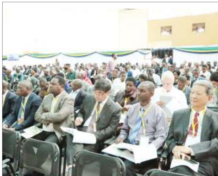
Baadhii ya wawekezaji wakifuatilia kwa makini Kongamano hilo.