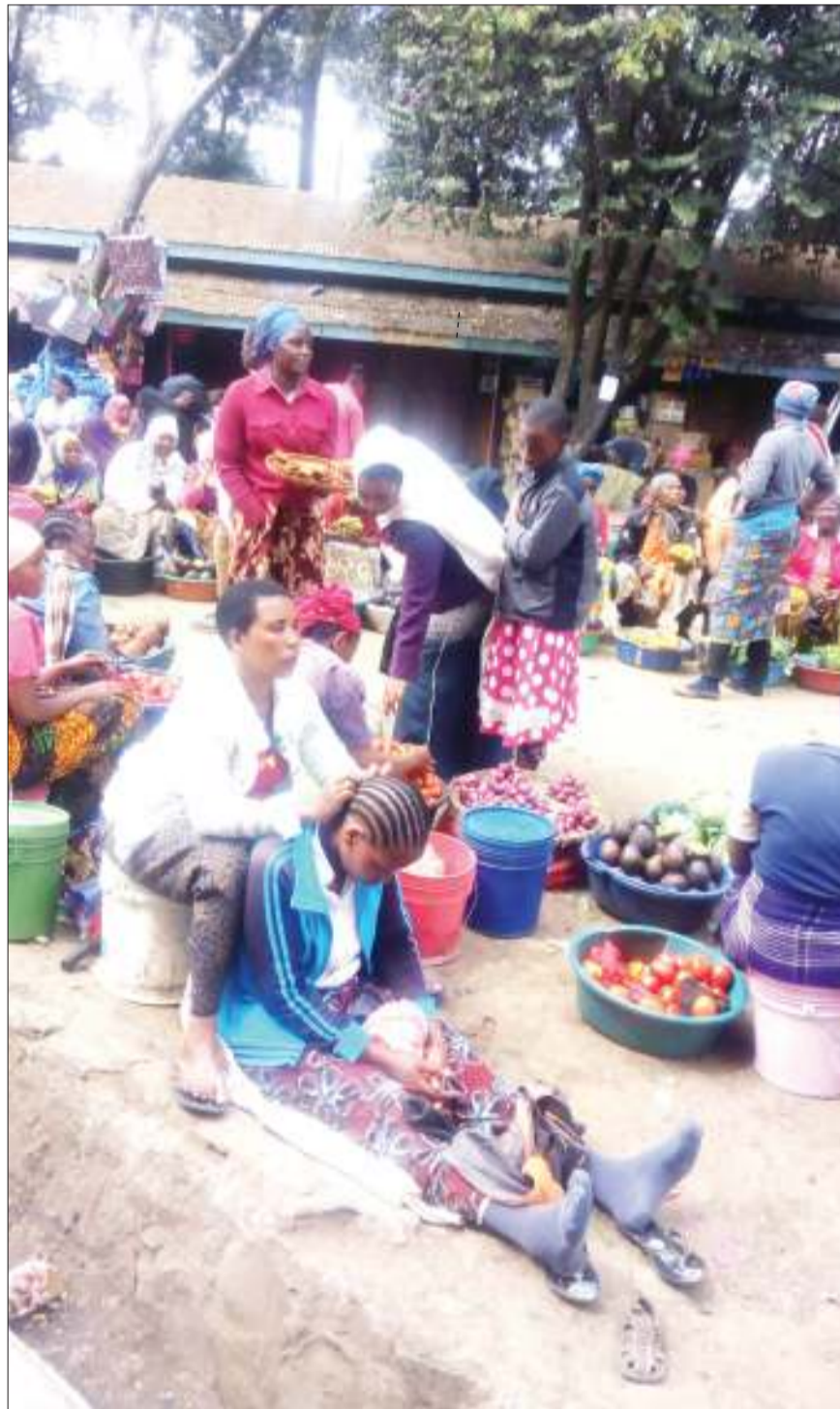
Kinamama wafanyabiashara ndogo kama walivyonaswa na kamera yetu wa soko la Kilombero lililopo ndani ya Jiji la Arusha wakiwa wanauza bidhaa zao huku wakisukana.