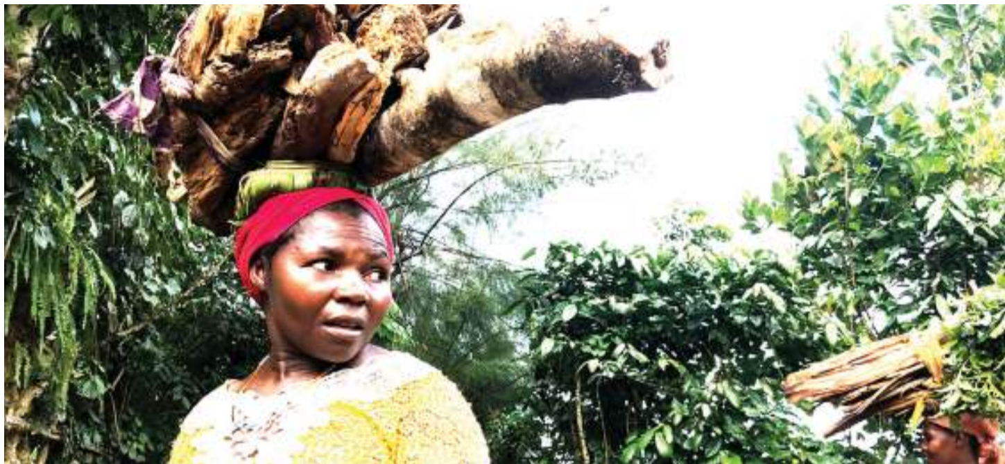
Ukosefu wa kuni unaotokana na uharibifu wa misitu unaogeza nchi kuwa jangwa kutokana na mabadiliko ya tabianchi unaathiri zaidi wanawake ambao ndiyo wanaotafuta nishati kwa ajili ya kuzihudumia familia: PICHA:MTANDAO.

Lengo kuu ni kuhakikisha Makubaliano ya Paris yanayoelekeza mataifa kutengeneza sera zinazotekelezeka kuhusu uhusishwaji wa wanawake katika vita