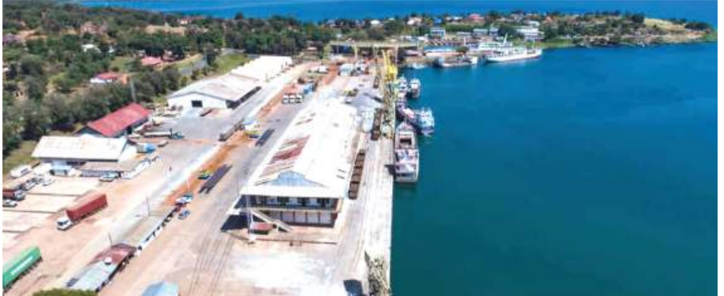
Mwonekano wa Bandari ya Kigoma.

"Dira ya Bandari ya Kigoma ni kuwa 'gateway' ya mizigo ya maziwa makuu," anaeleza meneja huyo na kuongeza kuwa, uchumi wa nchi wateja wake; DRC na Burundi unakuwa kwa kasi kutokana na hali ya utulivu wa kisiasa.