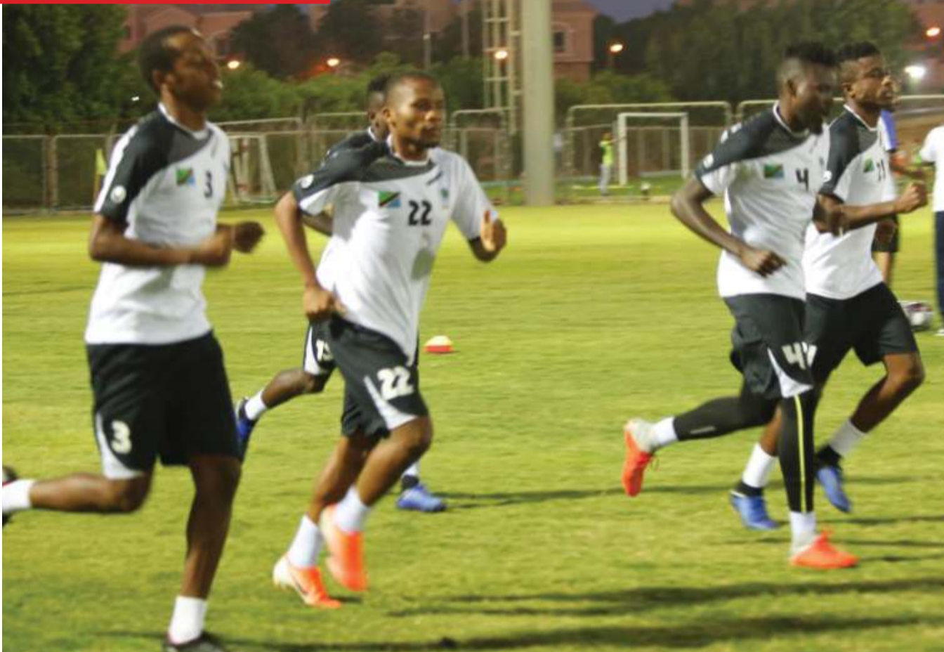
Baadhi ya wachezaji wa kikosi cha Taifa Stars wakiwa mazoezini katika Uwanja wa Petrosport jijini Cairo, Misri juzi kabla ya jana kuivaa Harambee Stars kwenye mechi yao ya pili ya Kundi C ya michuano ya Afcon 2019.