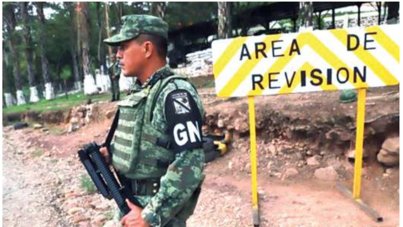
Polisi akiwa kwenye doria Mexico.

“...Ukiangalia soko letu, Watanzania na Waganda wamechukua biashara zetu, sasa sisi tumesema enough is enough,” alisema mbunge huyo ambaye ni mwanamuziki, mwanasiasa na mjasiriamali tajiri nchini Kenya na katika eneo la Afrika Mashariki na moja ya nyimbo alizoimba ni ‘Kigegeu’. BBC