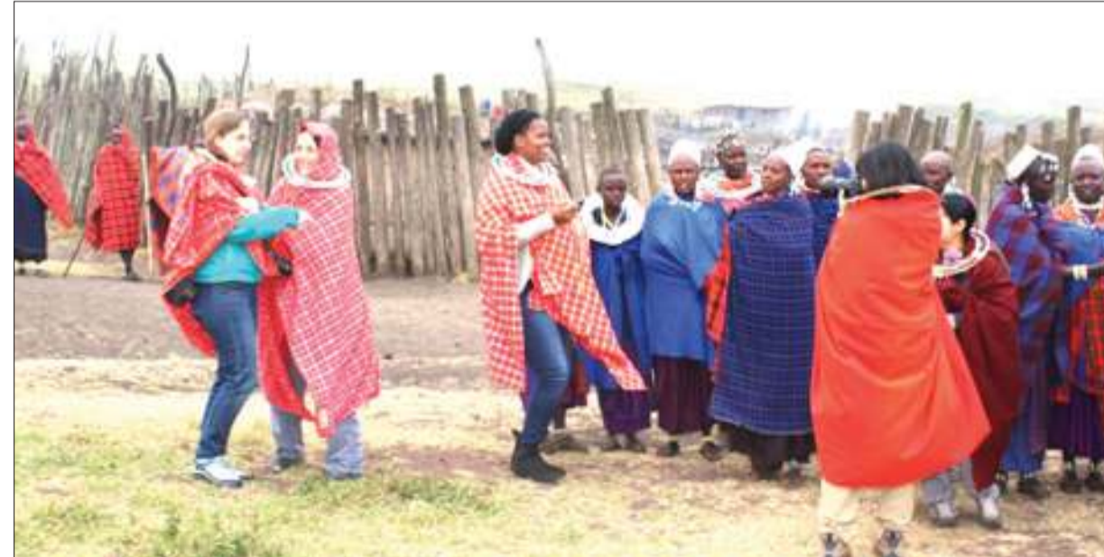
Wataalamu wa USAID Protect Tanzania na Washington Marekani, wakiwa pamoja na wafugaji wa jamii ya Kimasai wanaoishi ndani ya Mamlaka ya Hifadhi ya Ngorongoro (NCAA), eneo hilo linajulikana kama Masai Boma.

Mbanjoko, anasema katika miaka ya 1970 na 1980, faru na tembo waliuawa sana na baadaye serikali ilianzisha kikosi cha kupambana na ujangili katika kanda za Arusha, Mwanza, Tabora na Iringa.