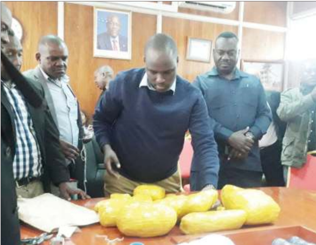
Waziri wa Madini, Doto Biteko (katikati), aki-kagua madini yaliokamatwa Juni 26 mwaka huu, mpakani Namanga, wakati yak-isafirishwa kwenda Kenya kinyemela, yakiwa yamehifadhiwa Benki Kuu ya Tanzania (BoT), tawi la Arusha jana.