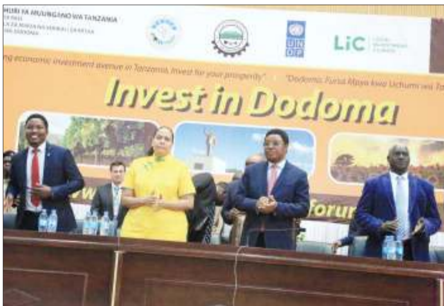
Waziri Mkuu Kassim Majaliwa, Waziri wa Uwekezaji, Angella Kairuki, Waziri wa Tamisemi, Suleiman Jafo (kushoto) na Mkuu wa mkoa wa Dodoma, Dk. Binilith Mahenge, wakati wa ufunguzi wa Kongamano la Uwekezaji Mkoa wa Dodoma, jana.