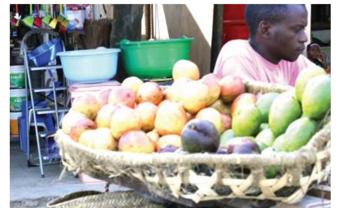
Mchuzi wa matunda akiwa kwenye sehemu yake ya biashara eneo la Namanga jijini Dar es Salaam jana.