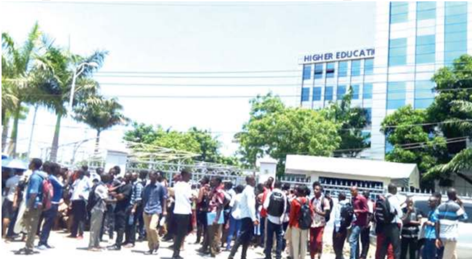
Wanafunzi wakifuatilia mikopo HESLB.