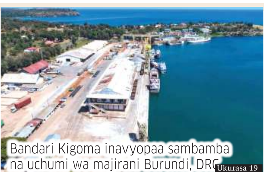
Bandari Kigoma inavyopaa sambamba na uchumi wa majirani Burundi, DRG