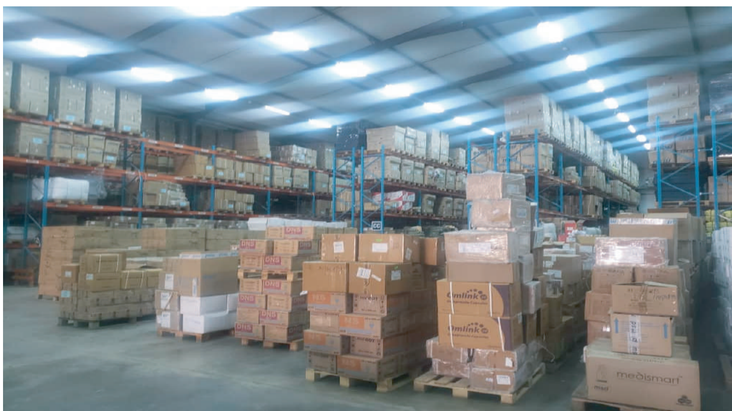
Sehemu ya mzigo wa dawa uliohifadhiwa katika bohari kuu ya dawa (MSD) kanda ya kati kwa ajili ya kusambazwa katika maeneo mbalimbali nchini.

Kwa Kanda ya MSD Dodoma katika mwa wa fedha uliopita tumeweza kukusanya fedha taslimu kwa asilimia 66 ya lengo, kupunguza uwezekano wa bidhaa za Afya kuchotora ama kwa neno jingine ni kuchina. Kanda ya MSD Dodoma pia imeweza kusambaza vifaa tiba kwa vituo vya Afya kwa fedha