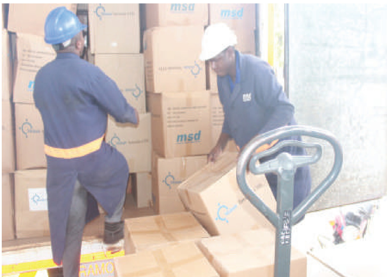
Watumishi wa MSD Dodoma wakipakia bidhaa za afya tayari kwenda vituo vya kutolea huduma za afya

Katika kituo cha afya Mkonze na Hombolo vilivyopo katika jiji la Dodoma tumefanikiwa kuwapatia majokofu ya kuhifadhi miili na hivyo kuwasaidia wananchi kutofuata huduma hizi mjini katika hospitali ya Rufaa ya Mkoa wa Dodoma. Katika kituo cha afya kibaigwa, Kongwa DC tumefanikiwa kusambaza mashine ya kidijitali ya Mionzi, hivyo kuwasaidia wananchi wa kibaigwa kutosafiri kwenda kufuata huduma hiyo katika hospitali ya wilaya ya Kongwa. Katika awamu hii ya sita tunaona maboresho makubwa katika huduma za afya nchini haya ni baadhi tu kwani kanda ya Dodoma pia vituo vimeongezeka vya kutolea huduma za afya na tayari tumekwisha anza kusambaza vifaa tiba kwa vituo vipya vya Mazengo halmashauri ya Chamwino, Msembeta, Soweto na Nkuhungu vyote hivi Dodoma jiji.