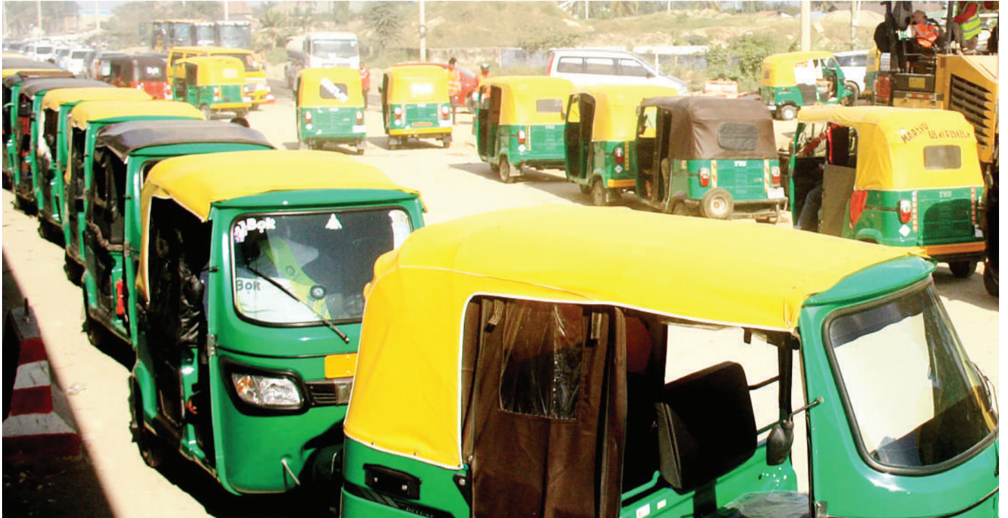
Bajaji zinazotumia gesi, zikiwa kwenye foleni ya kujaza nishati hiyo, katika eneo la Uwanja wa Ndege, jijini Dar es Salaam.