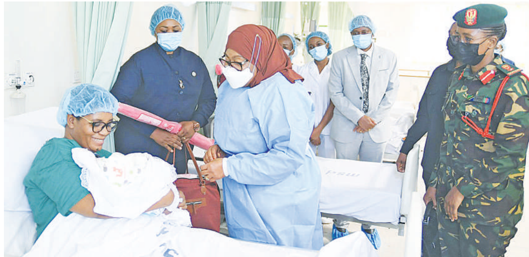
Rais Dk. Samia Suluhu Hassan, akiwapa zawadi kinamama waliojifungua katika jengo jipya la 'Mama na Mtoto' kwenye Hospitali ya CCBRT, Dar es Salaam, Julai, 2022.

Serikali ya Awamu ya Kwanza hadi kutimu miaka 10 ya Uhuru, 1971 kukawapo Mpango wa Maendeleo wa Pili 1969-1974, ikiwa na sura ya maboresho zaidi katika huduma na mifumo ya uchumi