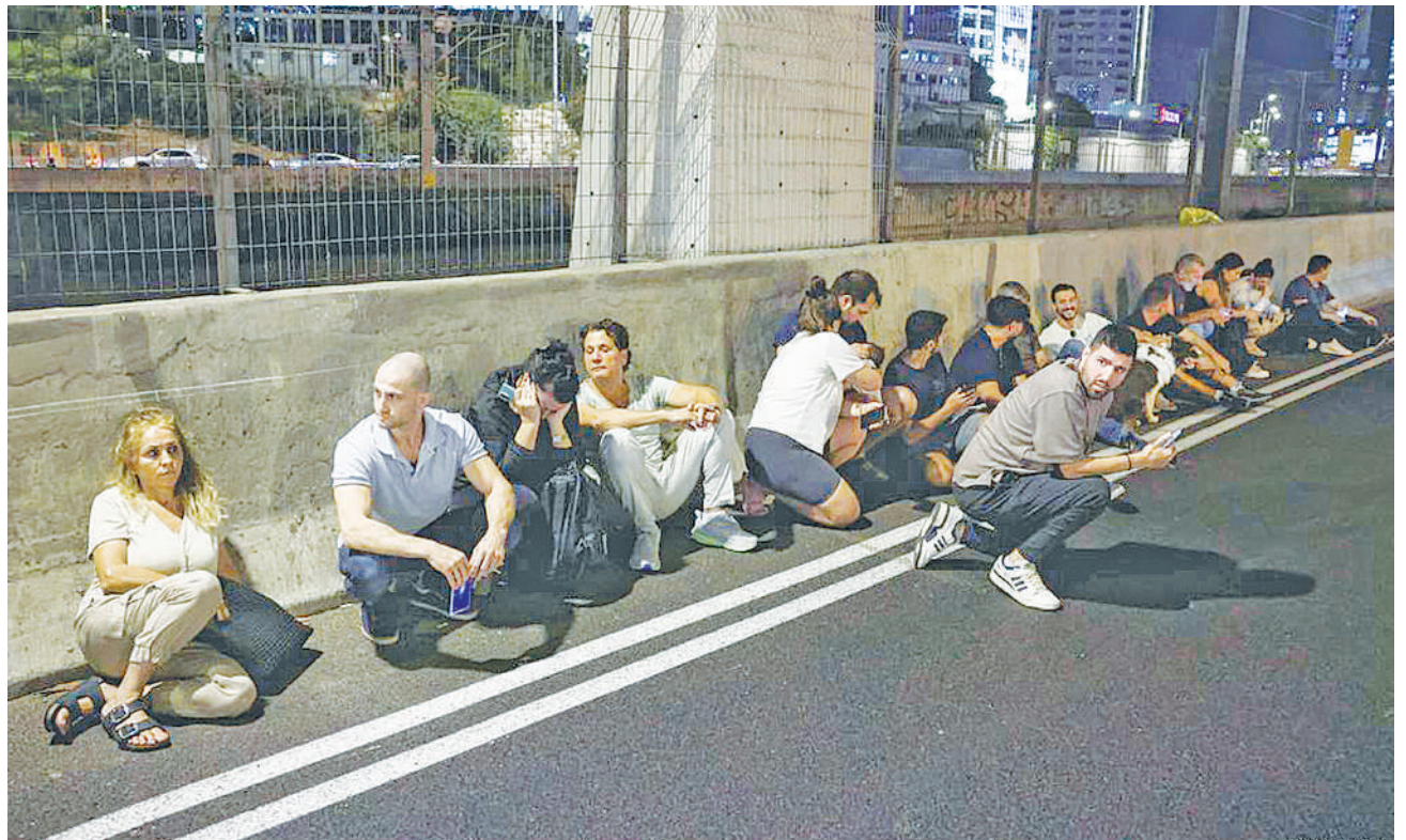
Watu wakijificha kando ya barabara mjini Tel Aviv baada ya king'ora kulia kufuatia shambulizi la Iran jana.