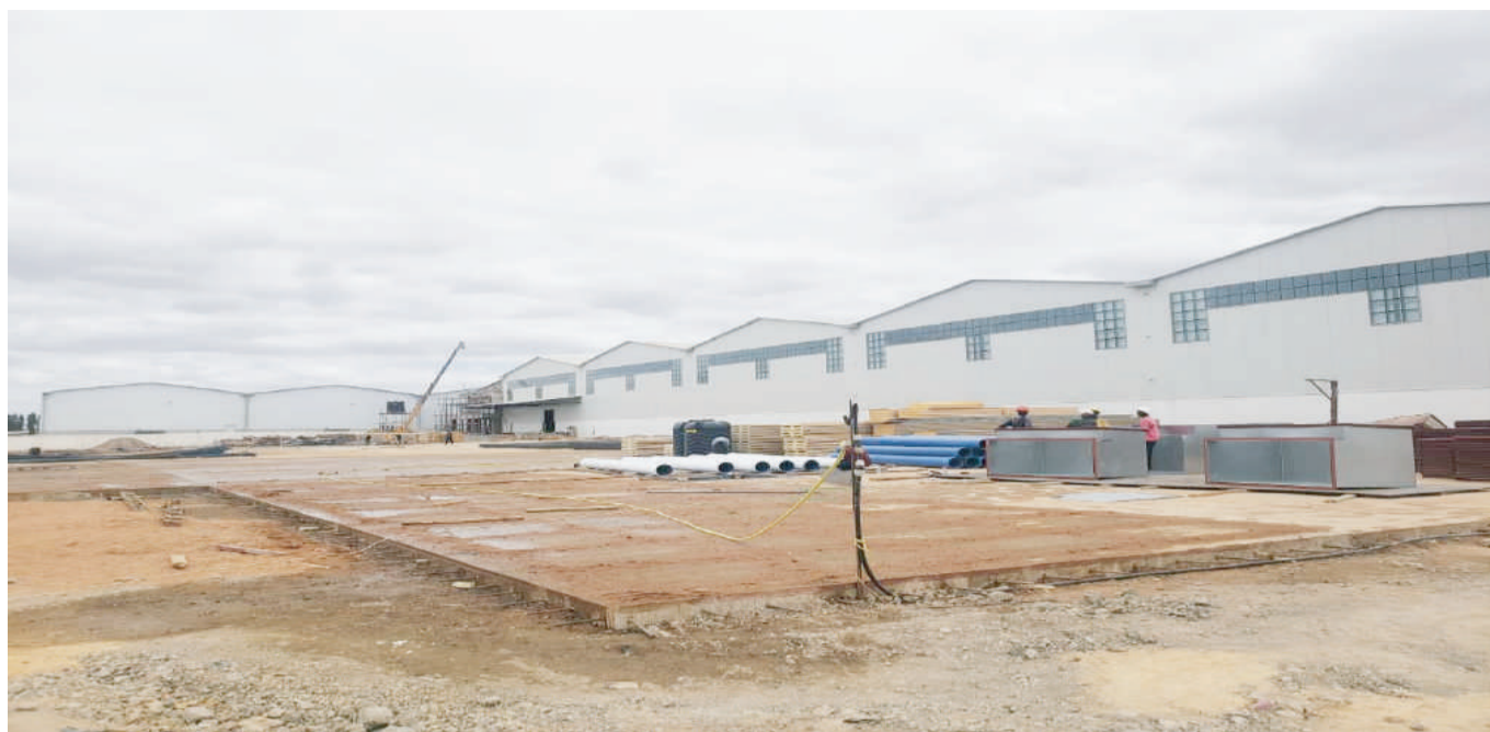
Muonekano wa Ghala Jipya ambao unaendelea kujengwa unakaribia kumalizika mwezi November mwaka huu

Mwanashehe Jumaa: Katika kuhakikisha kanda ya Dodoma inatoa huduma bora imejipanga kuimarisha mawasiliano na wadau na wateja wote, kushiriki vikao kazi vinavyofanyika kwenye Halmshauri na vikiwashirikisha watumishi na wataalam wa vituo vya kutolea huduma za afya kwenye Halmashuri na kupata mahitaji yenye uhalisia kutoka kwa wateja wetu kukwepa kukosekana ama kuwa na bidhaa zaidi ya mahitaji na kusababisha dawa kuchotora. Pia kukaa na wateja wakubwa kuandaa mahitaji na kujadili namna ya kuimarisha mnyororo