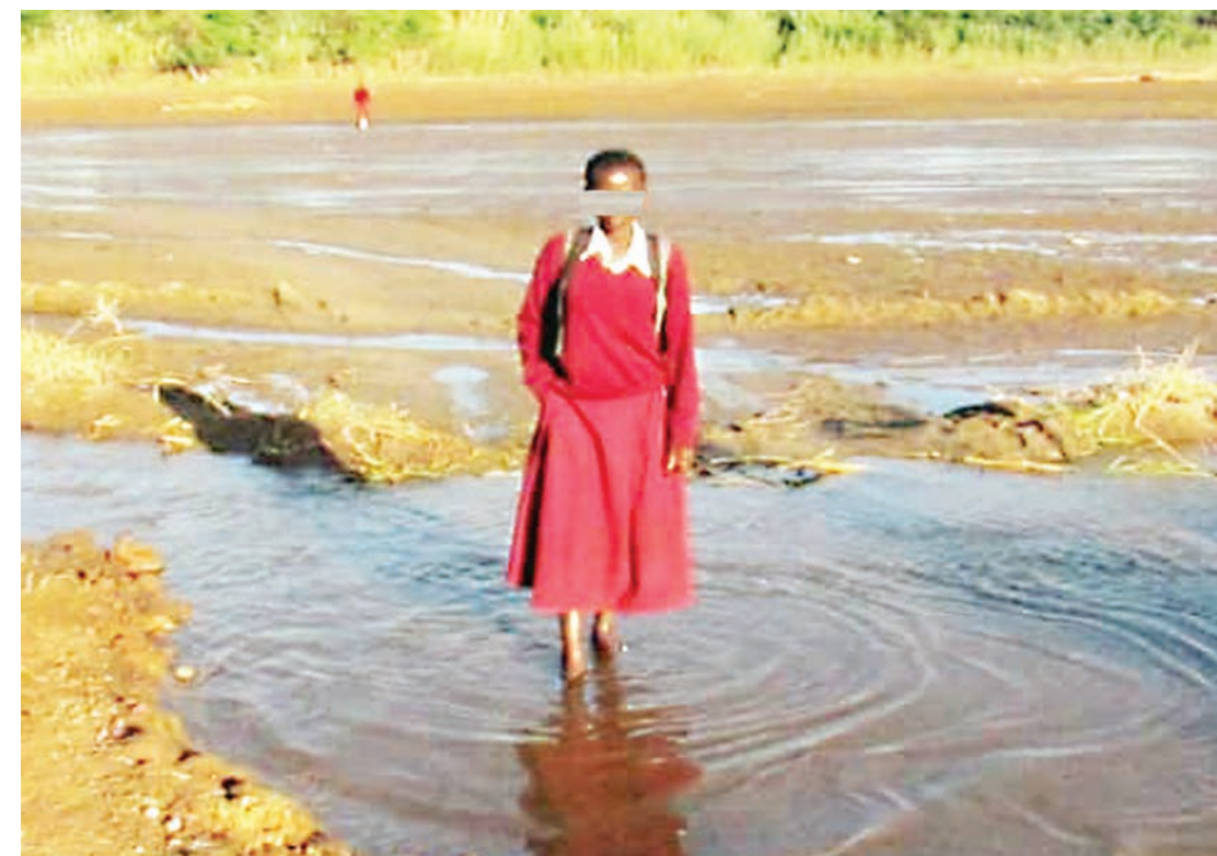
Mmoja wa wanafunzi wa Shule ya Sekondari Matomondo akivuka Mto Mamba wilayani Mpwapwa mwanazoni mwa mwezi huu.

"Mara nyingi nilipokutana na hatari na kubakwa nililazimika kukimbia na kupiga kelele kuomba msaada kwa wapita njia, hivyo wachunga ng'ombe wanaogopa kuen-