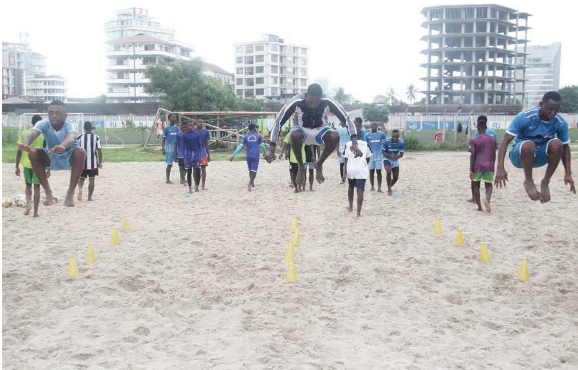
Wachezaji wa timu ya soka la ufukweni ya Wakala Msomi wakifanya mazoezi kwenye Uwanja vya Karume Ilala jijini Dar es Saalam kwa ajili ya kujiandaa na mashindano mbalimbali watakatayoshiriki hivi karibuni.

"Walinzi wangu hajawa na muunganiko kwa sababu kila tunapotengeneza 'upatina' na walinzi, mmoja au wawili wanaondoka na hivyo tunakuwa na kazi ya kuanza upya kutafuta tena muunganiko kila wakati," alisema.