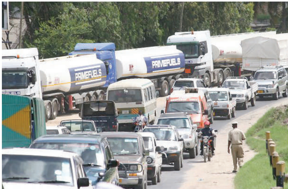
Sehemu ya malori yakiwa kwenye foleni kuingia katika Bandari ya Dar es Salaam.

Mbaroni tuhuma za kuua kwa malipo ya 100,000/-