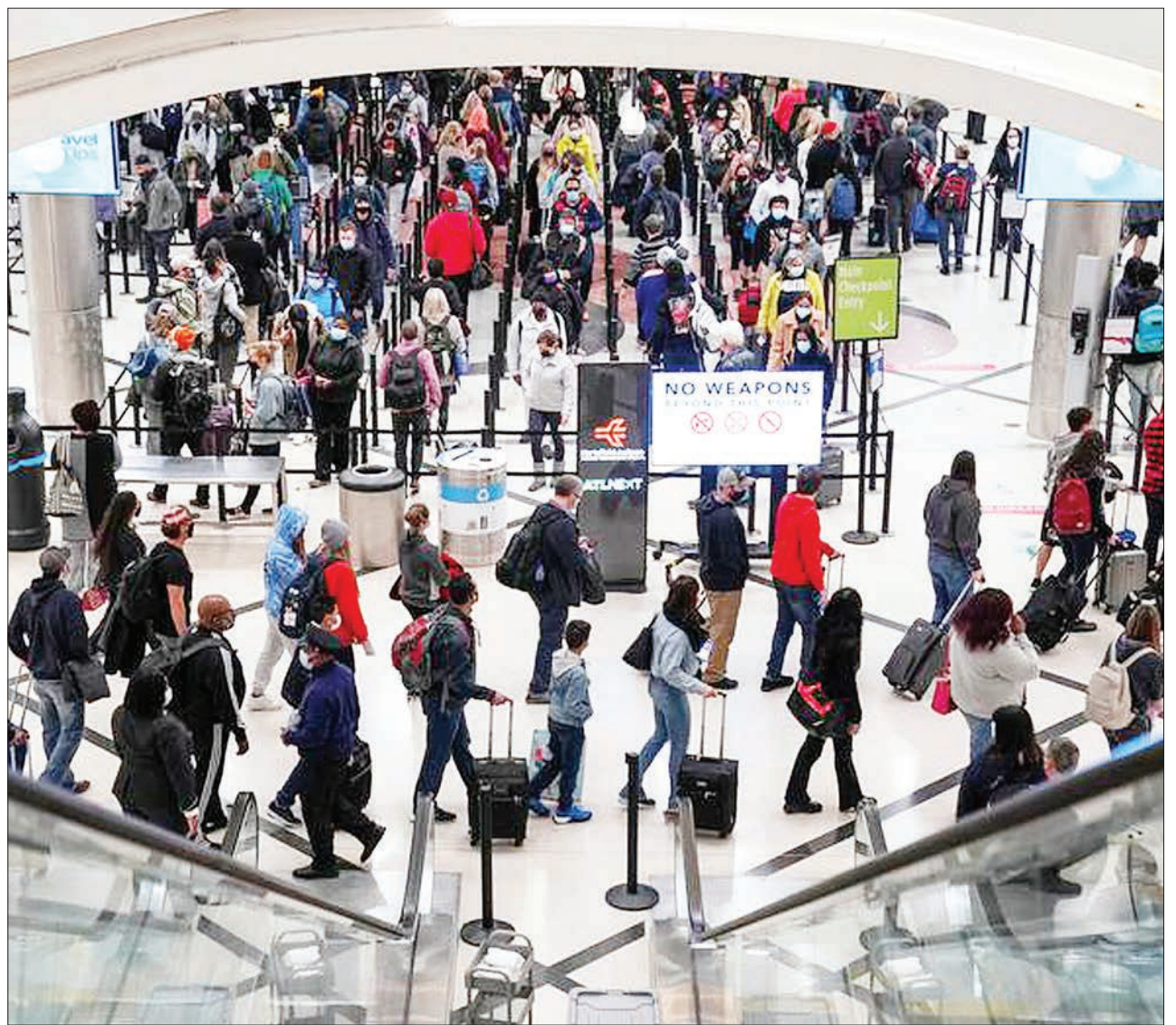
Wasafiri wakisubiri kukaguliwa kabla ya kuanza safari za msimu wa sikukuu za mwisho wa mwaka, wakiwa eneo la Hartsfield-Jackson, kwenye uwanja wa kimataifa Atlanta, Georgia, nchini Marekani, juzi. Licha ya kuwapo kwa maambukizi ya kirusi kipya cha omicron idadi ya wasafiri duniani imeongezeka.