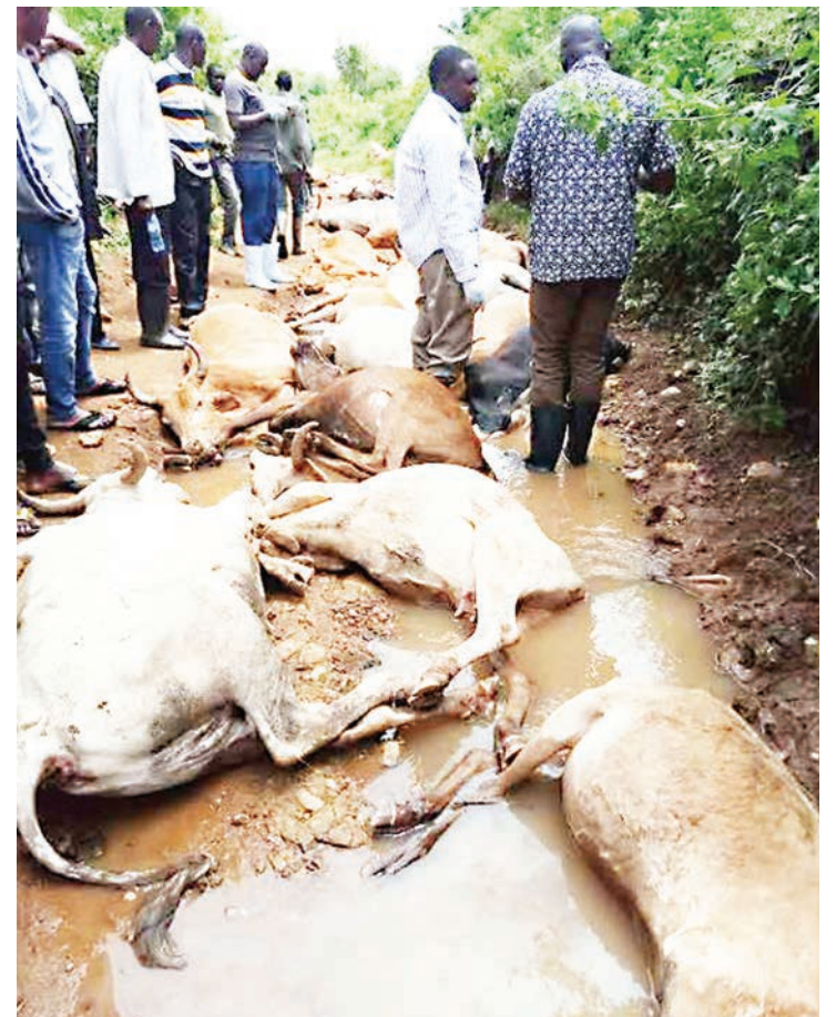
Sehemu ya mifugo 36 iliyoripotiwa kufa Aprili mwaka jana, katika Kijiji cha Kewanja kilichoko Nyamongo wilayani Tarime baada ya kunywa maji yanayohofiwa kuwa na kemikali za sumu zinazotokana na maji yanayotumika kusafisha mawe ya dhahabu.

"Kero nyingi za wakazi wa Nyamongo bado hazijapatiwa ufumbuzi lakini tuna imani na serikali, tunaamini zitatatuliwa," alisema.