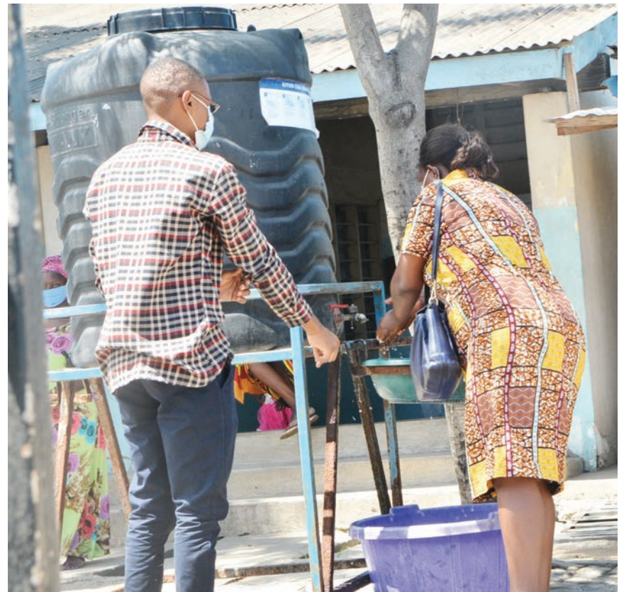
Baadhi ya wananchi wakinawa mikono ili kujikinga na UVIKO-19 wakati wa kuingia katika Hospitali ya Wilaya ya Ubungu ya Palestina, Sinza mkoani Dar es Salaam jana, kupata huduma.

●●● Ashuhudia msongamano wa malori, aziweka mtegoni taa- sisi husika... Endelea ukurasa 2