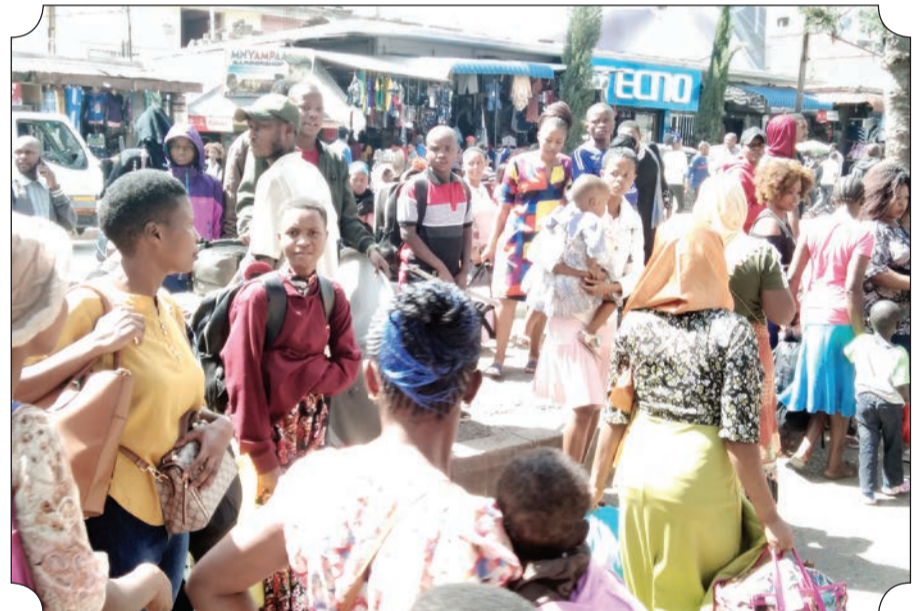
Mafuriko ya abiria waendao mkoani Kilimanjaro wakiwa katika kituo kikuu cha mabasi wakihangaika kupata usafiri kwenda kula sikukuu ya Krismasi mikoani.