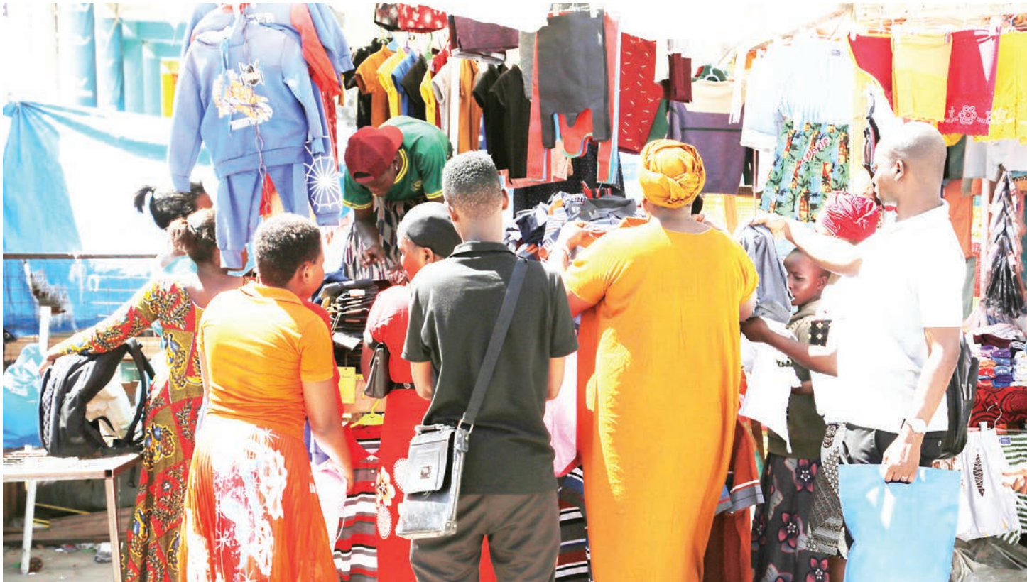
Baadhi ya wananchi wakiwa kwenye pilika pilika za kutafuta mahitaji ya sikukuu ya Krismasi Mtaa wa One Way Jijini Dodoma jana.