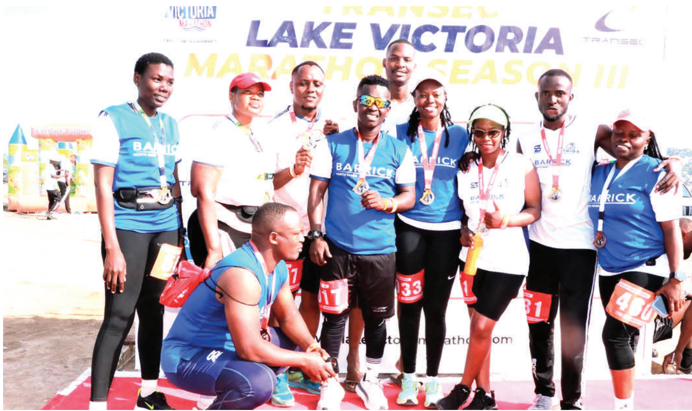
Baadhi ya wanariadha wa Barrick North Mara Runners Club wakifurahi baada ya kumaliza kushiriki kukimbia mbio za Lake Victoria Marathon zilizofanyika jijini Mwanza hivi karibuni.

Alisema iwapo itatolewa tarehe nyingine ya kucheza mashindano hayo, wataweka kambi ya muda mfupi ya kujiandaa na safari.