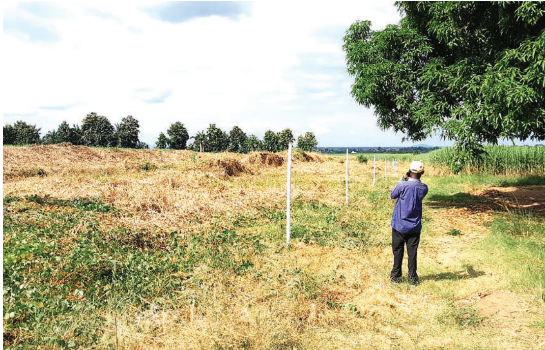
Mwonekano wa shoroba ya tembo Kilombero, kando ya mashamba ya miwa na eneo lililofyekwa na sasa limelipwa kupisha maboresho ya shoroba. PICHA: SALOMÉ KITOMARI

Mwalugelo anasema shoroba hiyo itapita katika Kijiji cha Kanyenja, chenye ukubwa wa kilomita za mraba 23.5 na zilichukuliwa ni