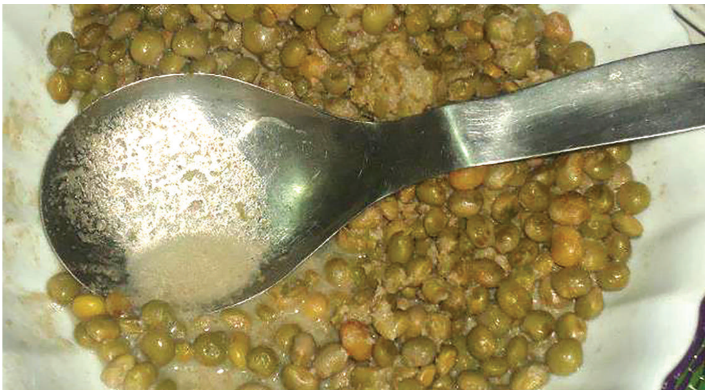
Sehemu ya mlo wa mbaazi.