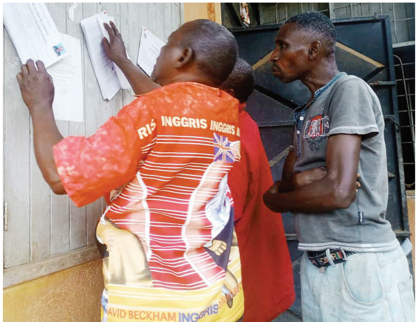
Wakazi wa Kata ya Potwe wilayani Muheza, mkoani Tanga, wakisoma majina ya wagombea udiwani kutoka vyama vya siasa baada ya Tume ya Taifa ya Uchaguzi (NEC) kutangaza uchaguzi mdogo wa udiwani juu.

Washiriki wa mkutano walijadili ni jinsi gani nchi za Afrika, zinaweza kuja na ubunifu wa pamoja na mikakati mipya ya kukabiliana na ugonjwa wa kifua kikuu.