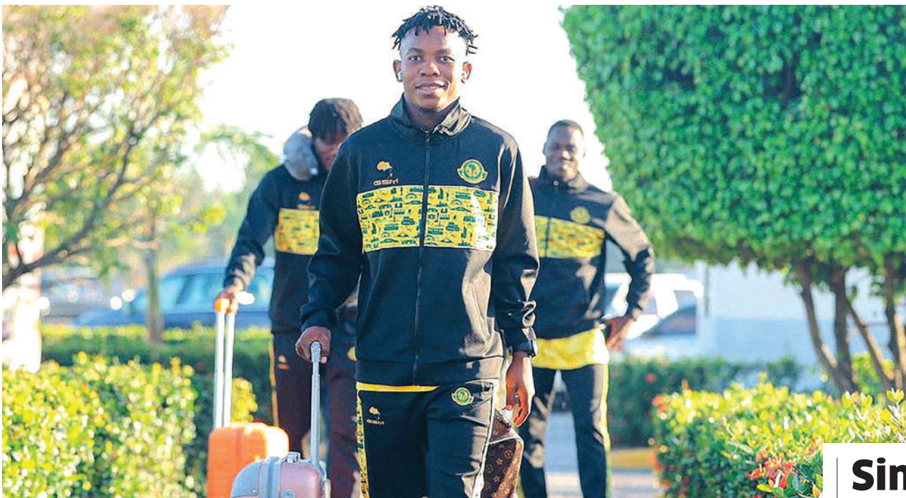
Wachezaji wa Yanga wakielekea Uwanja wa Ndege wa Julius Nyerere, Dar es Salaam jana tayari kwa safari ya Malawi kwenye maadhimisho ya sherehe za uhuru wa nchi hiyo. Leo watacheza mechi ya kirafiki dhidi ya Nyasa Big Bullets ya nchini humo.