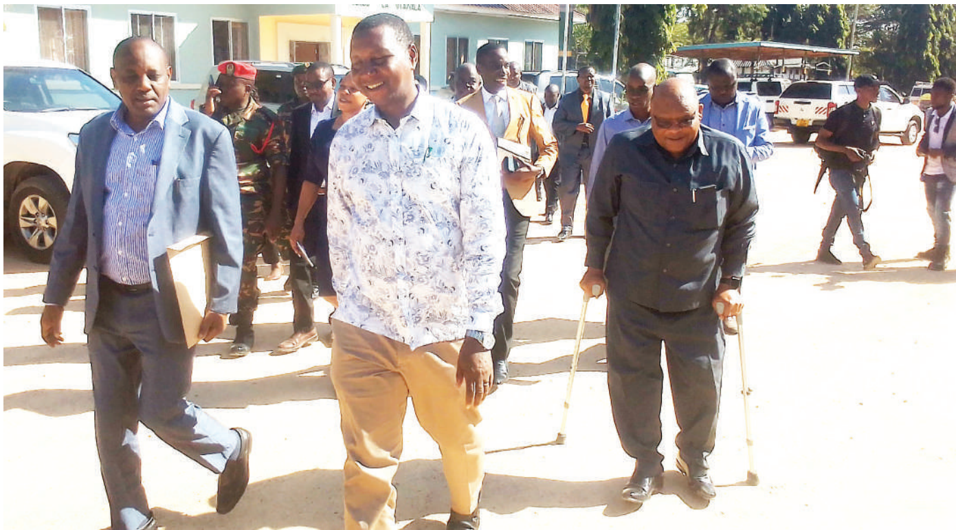
Waziri wa Elimu, Prof. Adloph Mkenda (katikati), akitoka kufungua mafunzo endelevu ya walimu kazini (MEWAKA) kwa maafisa elimu kata 2,384 kutoka mikoa yote nchini yatakatayofanyika kwa siku tatu katika Chuo cha Ualimu Butimba jijini Mwanza jana. Kulia ni Katibu Mkuu Wizara ya Elimu, James Mdoe.

Nao wadau wa kupinga vitendo vya ukatili mkoani Shinyanga wakiwamo (SMAUJATA), wameliomba Jeshi la Polisi mkoani humo kuhakikisha wanamkamata mzee huyo na kuchukuliwa hatua kali za kisheria ili liwe fundisho kwa watu wengine.