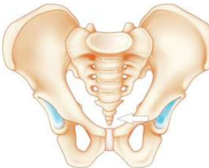
Kiungo cha mwili, mithili ya mkia wa mtu.

nyesha mabadiliko ya binadamu.' Uvimbe mdogo uliopo juu ya sikio ni mojawapo ya misuli hiyo. Miongoni mwa wengi, misuli hiyo haina maana yoyote, lakini