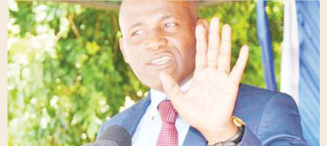
Naibu Waziri wa Afya, Maendeleo ya Jamii, Jinsia, Wazee na Watoto, Dk. Faustine Ndugulile.

duma za Jamii jijini Dodoma na anafafanua: "Hadi kufikia tarehe 31 Oktoba 2018 jumla ya Watanzania 2,405,296 walikuwa wamepima VVU (Virusi vya Ukimwi) kupitia kampeni ya 'Furaha Yangu' ambao ni sawa na asilimia 52 ya lengo la kuwapima Watanzania wapatao 4,638,639 hadi Desemba 2018."