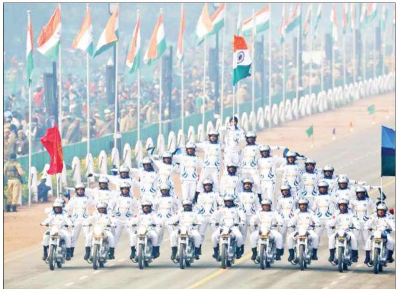
Askari wa vikosi vya usalama vinavyolinda mpaka wa India (BSF) wakiendesha pikipiki kushiriki mazoezi ya gwaride la kuadhimisha siku ya Uhuru jijini New Delhi, jana.

Juzi Waziri Mkuu wa Italia, Giuseppe Conte, alisema kuwa mzo-zo wa wakimbizi hautishii urafiki wa kihistoria kati ya mataifa hayo mawili majirani, akisema kuwa mahusiano yao yataendelea kusalia madhubuti na imara, licha ya mzo-zo huu wa kisiasa. DW