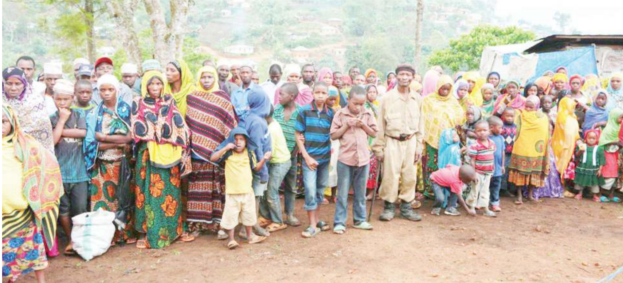
Wanakijiji cha Mpale, Korogwe katika tukio linalohusu uzunduzi wa mradi wa umeme kijijini, mwaka juzi.

• Familia zaanza alfajiri bondeni, kisha shambani