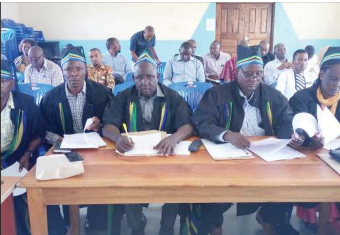
Madiwani wa Halmashauri ya Wilaya ya Simanjiro, mkoani Manyara, wakipitisha rasimu ya mpango wa bajeti ya Sh. bilioni 35.4 kwa mwaka wa fedha wa 2019/2020, juzi.

Aliongeza kuwa marehemu alifariki dunia katika Hospitali ya Muhimbili jijini Dar es Salaam, akiwa na umri wa miaka 47 na kuacha mume, watoto wawili na mjukuu mmoja.