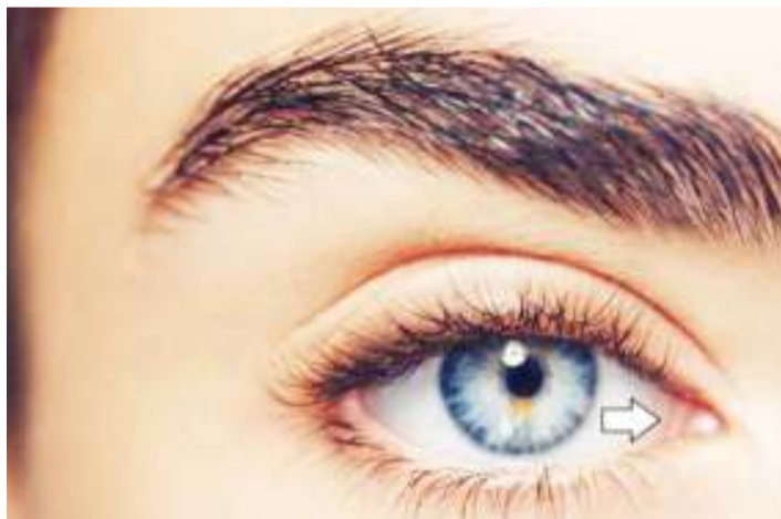
Kigubiko cha jicho.

Wakati tulipoanza kupoteza baadhi ya nywele hizo mwilini, msisimko huo ulianza kukosa maana hadi kufikia kiwango cha kukosa kazi ya kufanya.