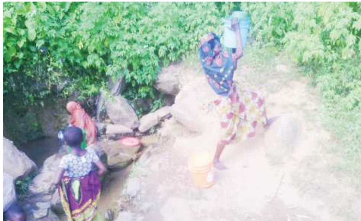
Kinamama wa kijiji cha Mpale, wakichota maji.

Ingawa sijawahi kusikia taarifa yoyote mbaya, lakini siwezi kumwacha mke wangu aende kuchota maji mwenyewe, kwa sababu kuna mapori wanyama wakali wanaweza kuvamia.