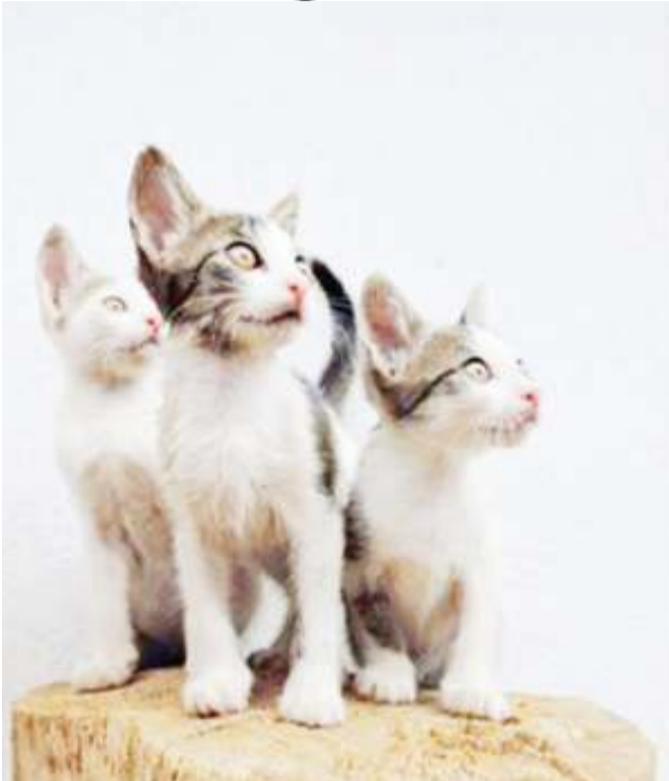
Sikio. Kando ni wanyama wanaohusishwa.