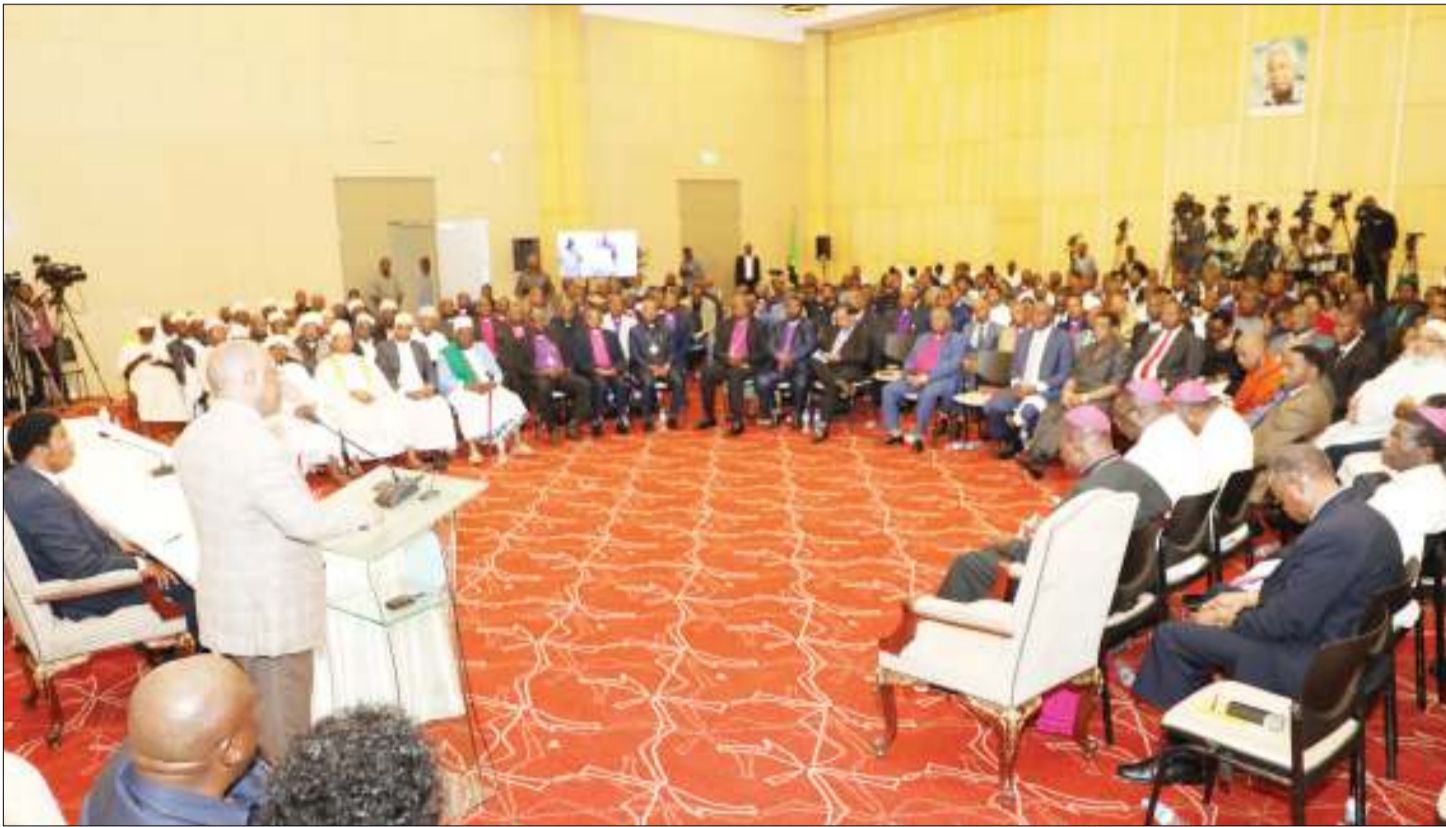
Rais John Magufuli, akizungumza na viongozi wa dini, Ikulu, jijini Dar es Salaam jana. Kushoto kwake ni Waziri Mkuu, Kassim Majaliwa.