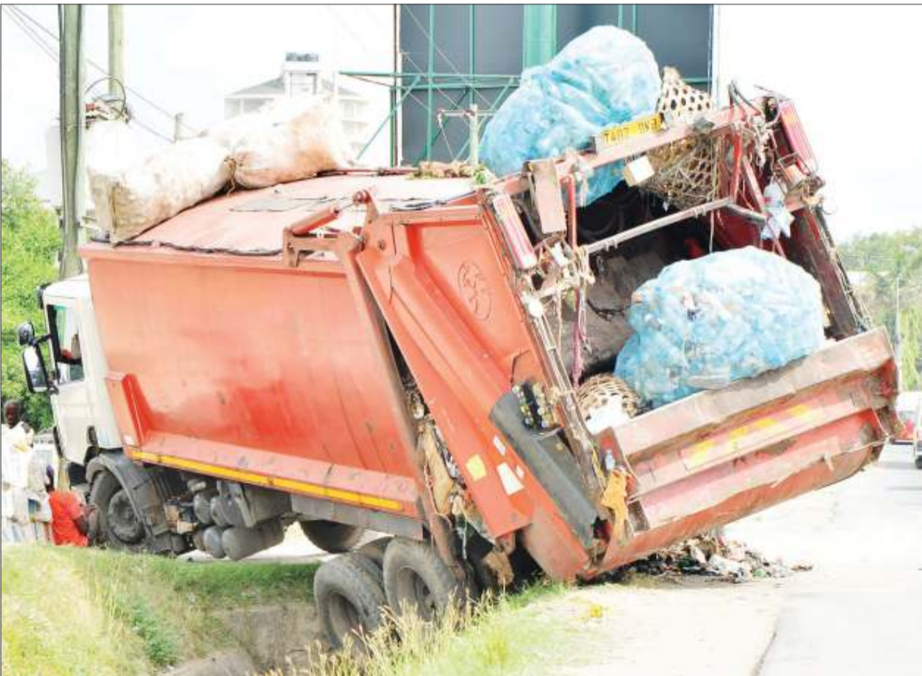
Gari likiwa limetumbukia kwenye mtaro baada ya kushindwa kukata kona katika Barabara ya Shekilango, eneo la Sinza Legho, jijini Dar es Salaam jana.

Baada ya kusomewa mashtaka, watuhumiwa hao walikana kuomba na kupokea rushwa, lakini walipelekwa rumande baada ya kushindwa kutimiza masharti ya dhamana. Kesi hiyo itatajwa Februari 4, mwaka huu.