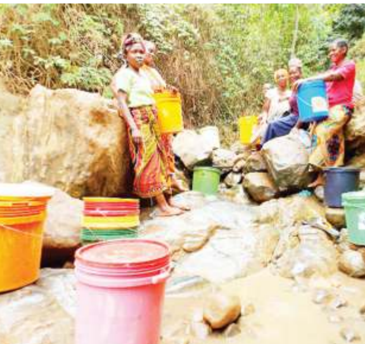
Wanakijiji wa Magundi, tarafa ya Bungu wilayani Korogwe, wakichota maji katika mazingira duni.

Anaongezea kuwa, maji yanayotiririka wakati mwingine yanaku-