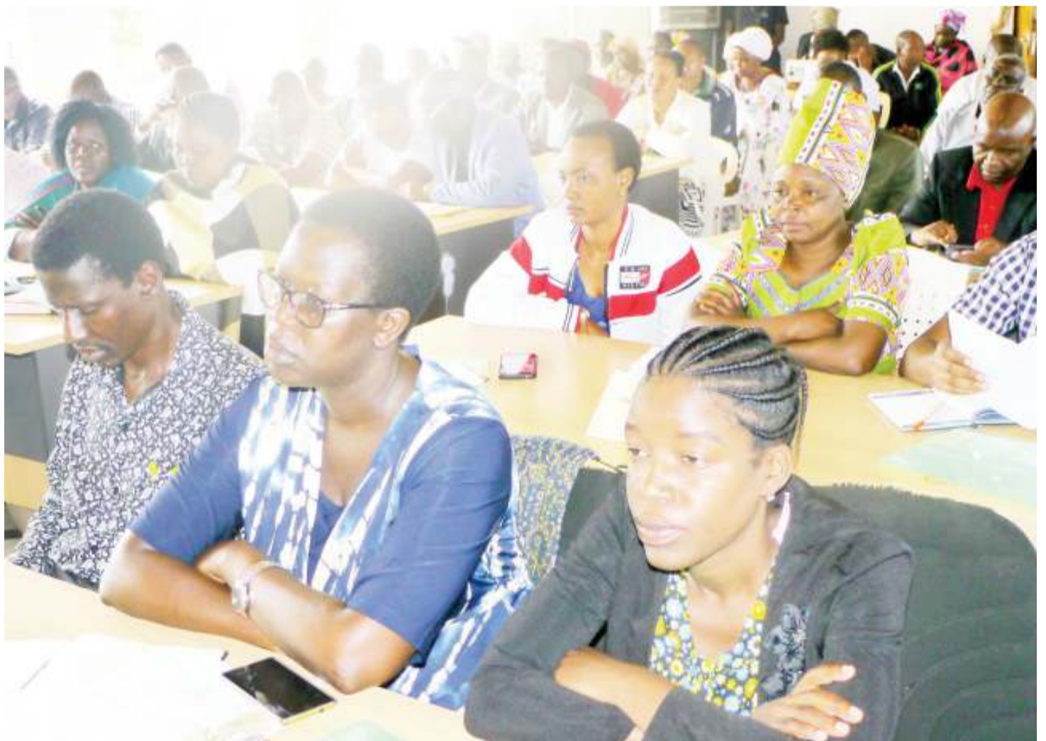
Wadau wa Afya mkoani Shinyanga, wakiwa kwenye uzinduzi wa kampeni ya uwajibikaji kuzuia vifo vitokanavyo na uzazi.