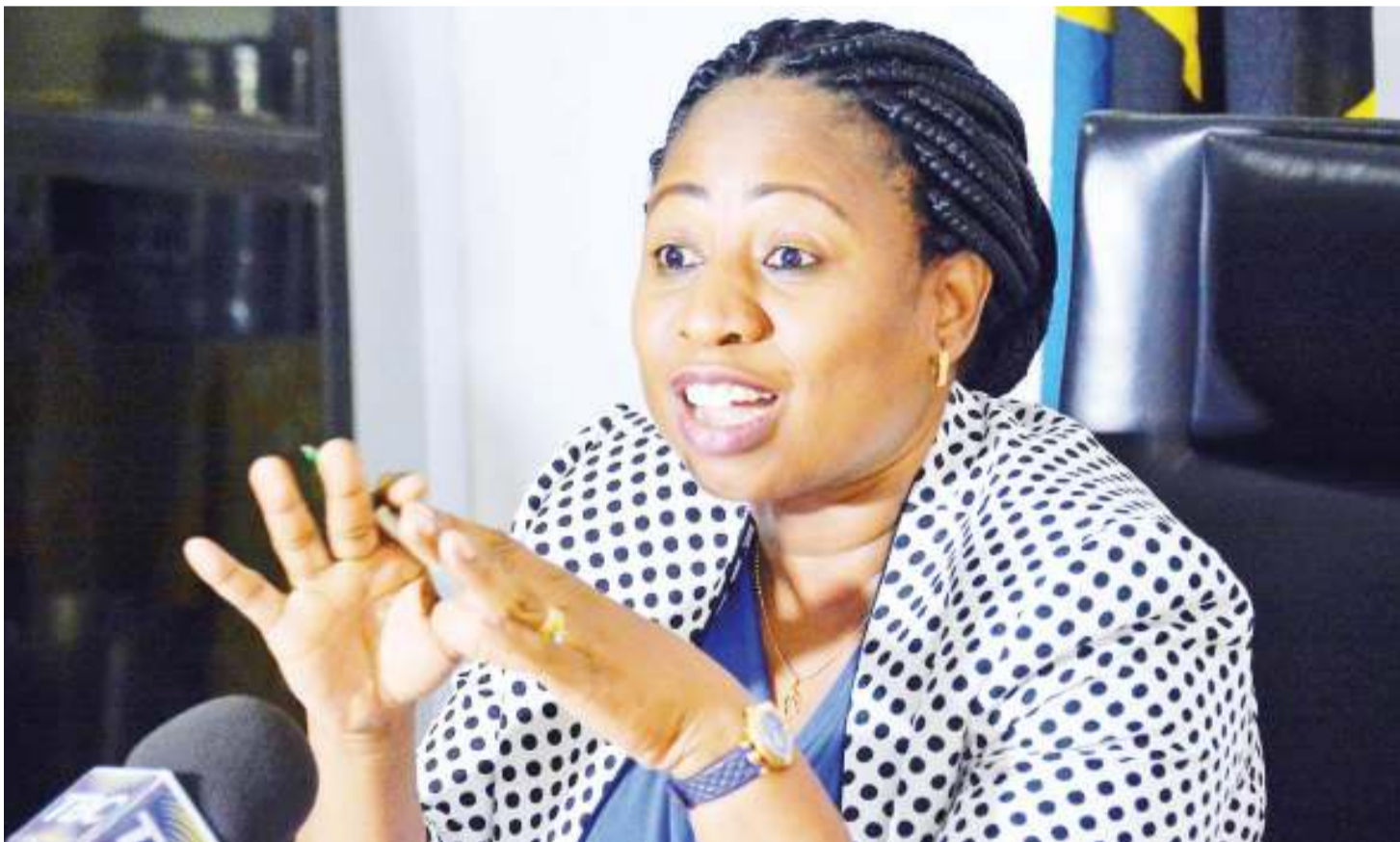
Waziri wa Afya, Maendeleo ya Jamii, Jinsia, Wazee na Watoto, Ummu Mwalimu.