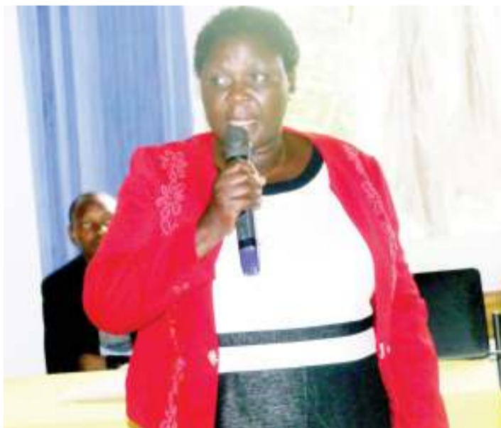
Mkuu wa Wilaya ya Kishapu, Nyabaganga Taraba, akitoa ushuhuda wa alivyonusurika kifo cha uzazi.

Natoa agizo kwa kila mtendaji wa kijiji mkoani hapa, waanze kuwa na madaftari ya kuandikisha wajawazito kwa kila kaya.