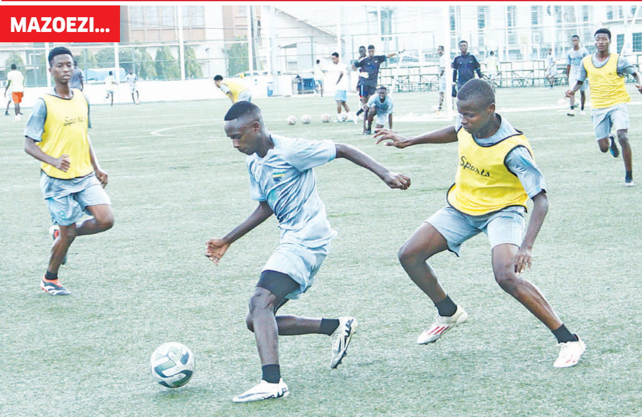
Vijana wa Kituo cha Michezo cha Jakaya Kikwete, wakiwania mpira katika Uwanja wa kituo hicho wakati waki-fanya mazoezi jijini Dar es Salaam jana.