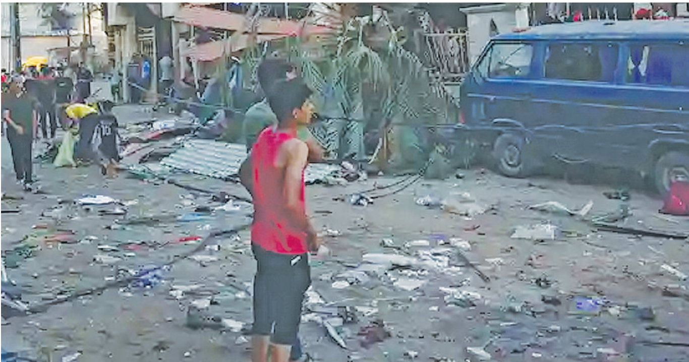
Wapalestina wakiangalia uharibifu na maafa yaliyosababishwa na shambulio la Israel katika shule huko Gaza.