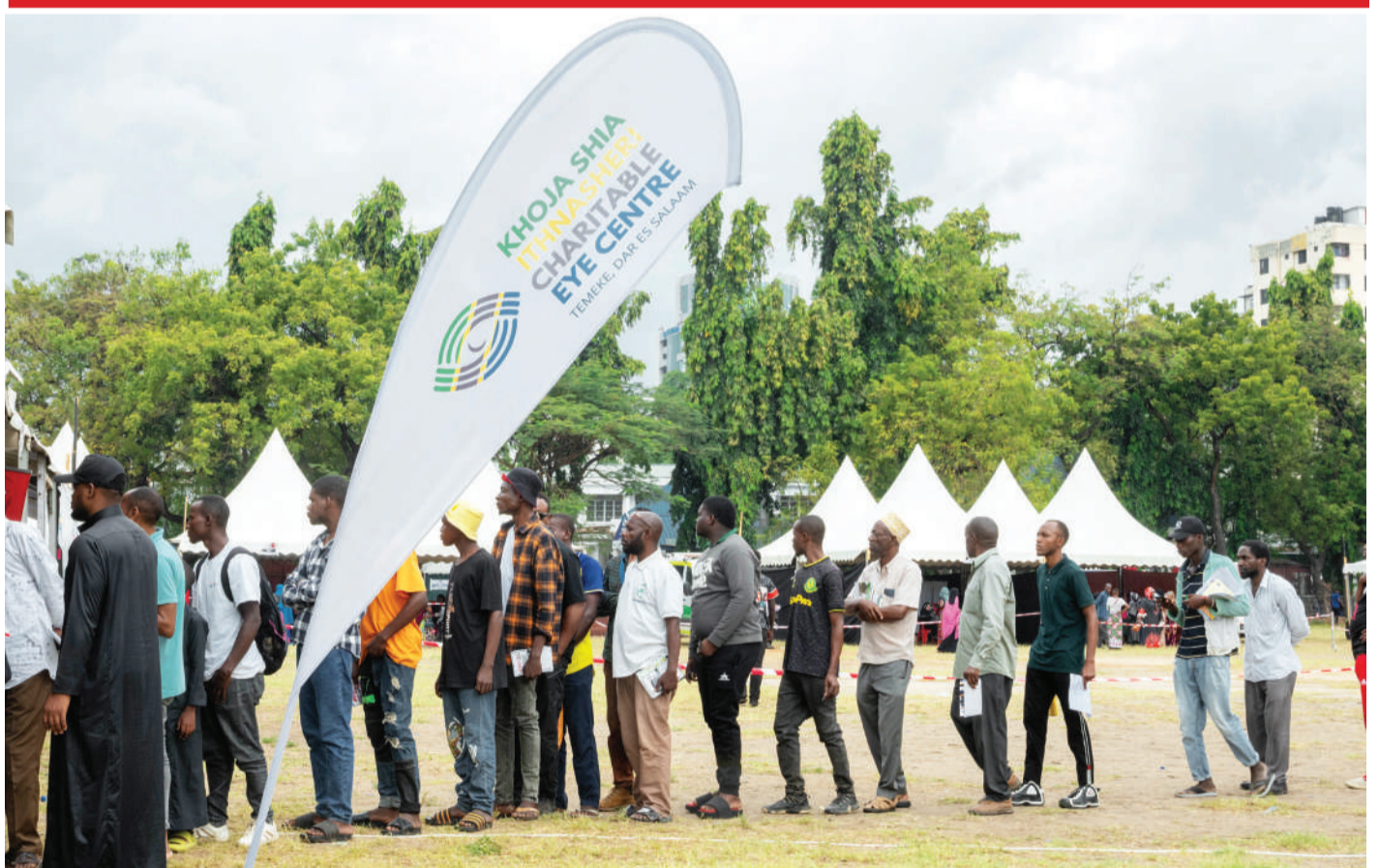
Wananchi waliojitokeza katika Viwanja vya Mnazi Mmoja wakipanga mstari kwa ajili ya kupata huduma za bure zilizotolewa katika kambi ya siku tatu jijini Dar es Salaam iliyoandaliwa na Jumuiya ya Khoja Shia Ithnaashari katika kuenzi kifo cha Mjukuu wa Mtume Muhammad (S.A.W), Imamu Hussein miaka 1,400 iliyopita katika Kalbar nchini Iraq.

Alisema hivi sasa Kizimkazi ina hospitali ya kisasa kwa ajili ya huduma za afya ya mama na mtoto, ambapo awali wananchi wa kijiji hicho walikuwa wakitembea umbali mrefu kufuata huduma hiyo.