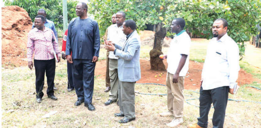
Waziri wa Kilimo, Japhet Hasunga, akikagua shamba darasa la korosho, katika Kituo cha Utafiti wa Kilimo Tari-Naliendele, Mtwara, Desemba mwaka 2018.

Anaeleza undani huo akitaja athari za kupungua kiwango cha mvua sasa, inaleta uhitaji tofauti wa zamani