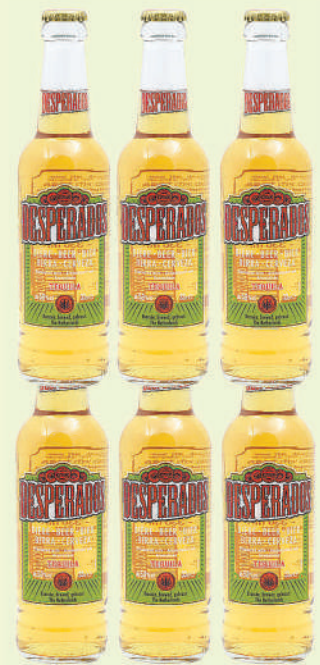
Desperados Tequila Beer Bottles