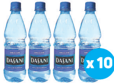
Dasani Still Water 500ml