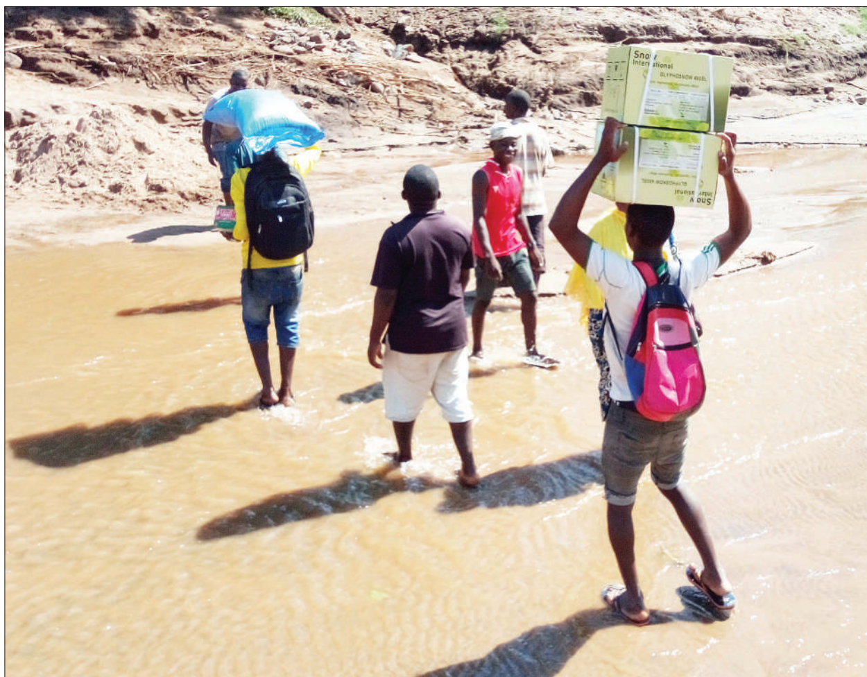
Wakazi wa vijiji vya Mkumbululu na Luatala Halmashauri ya Wilaya ya Masasi, mkoani Mtwara wakipita ndani ya maji katika Mto Mkoo uliopo Kata ya Mchaulu baada ya daraja linalounganisha vijiji vyao kukatika juzi kutokana na mvua.

Alisema Tanzania imepiga hatua kubwa kimaendeleo chini ya uongozi wake, hasa katika miundombinu ya barabara, vituo vya afya, miradi ya maji, umeme na usafiri wa anga.