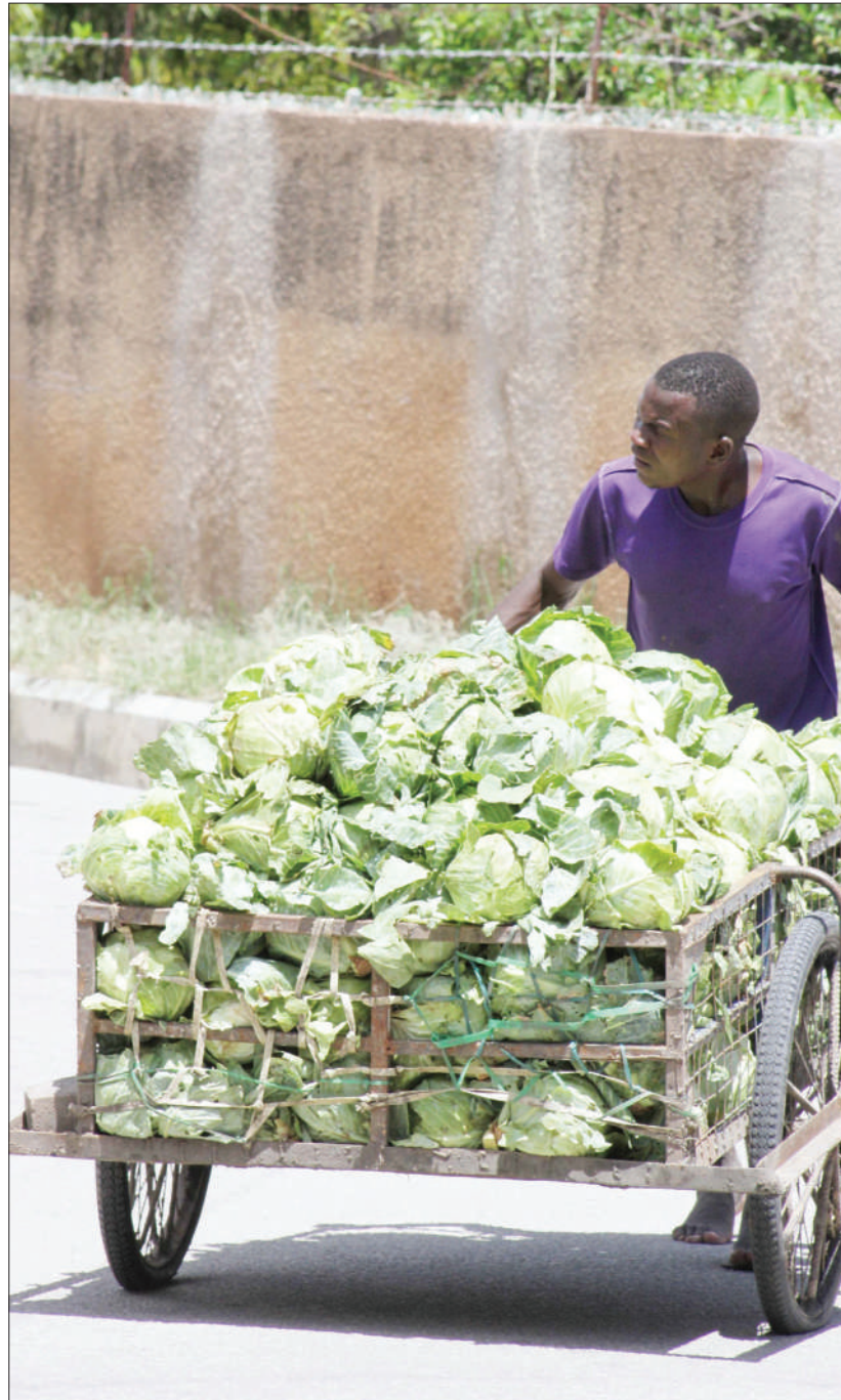
Mchuuzi wa mboga aina ya kabeji ambaye jina lake halikupatikana akitafuta wateja kama alivyokutwa eneo la Uhindini jijini Dodoma jana.

Alisema mvua hiyo ilisababisha maji kufurika hadi kiwango cha juu na daraja mzima kujaa maji hadi iliyopelekea maji hayo kupita juu ya daraja na kuharibika kingo hizo kisha daraja.