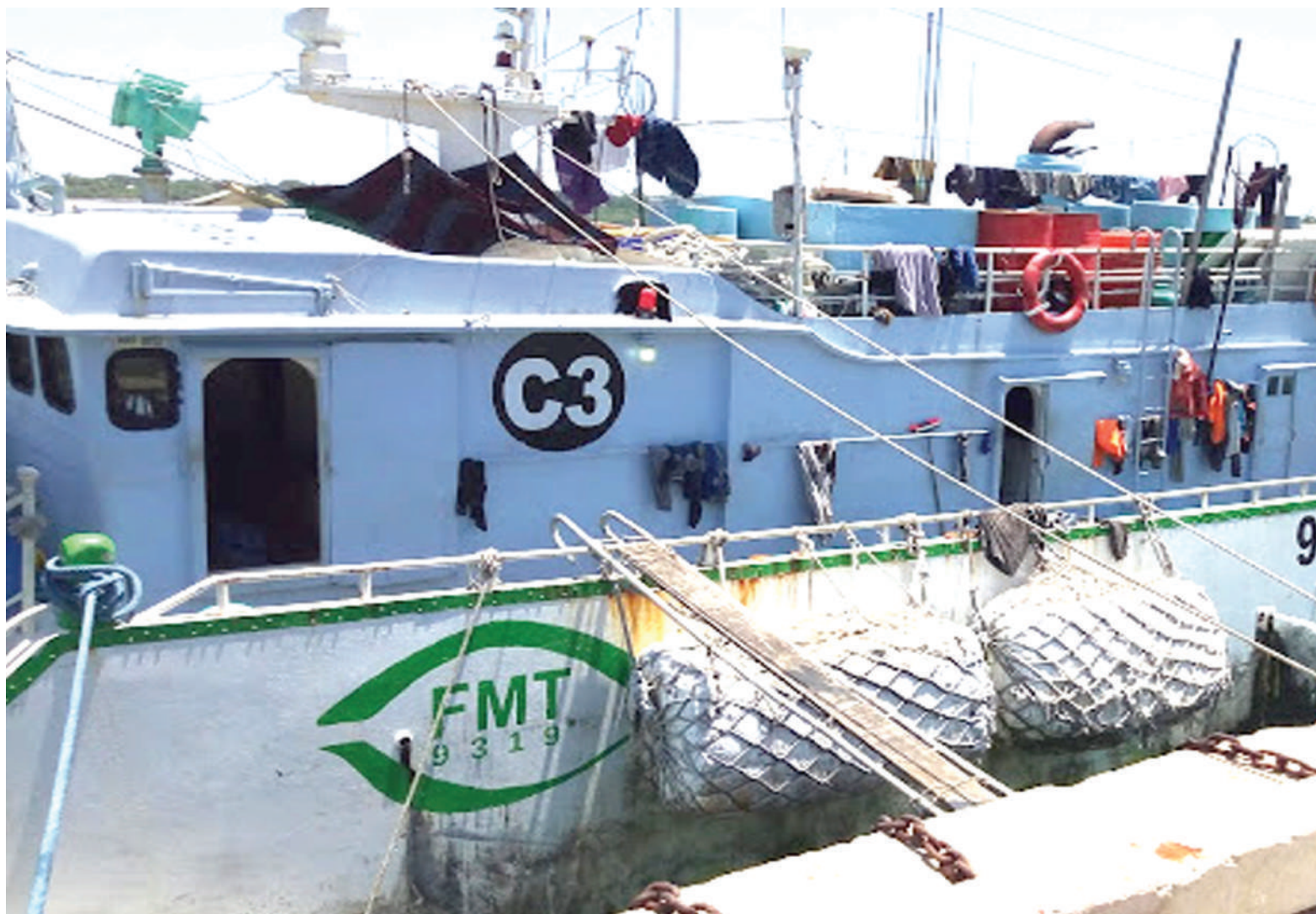
Meli iliyokamatwa katika Pwani ya Mtwara ikiwa na samaki iliyowapata kinyume cha Sheria ya Usimamizi wa Bahari Kuu(DSFA) ya Mwaka 1998. Ilitozwa faini ya Sh. milioni 770. PICHA ZOTE: MTANDAO.

Kukua kwa sekta ya uvuvi kunaakisiwa kufikia asilimia 9.4