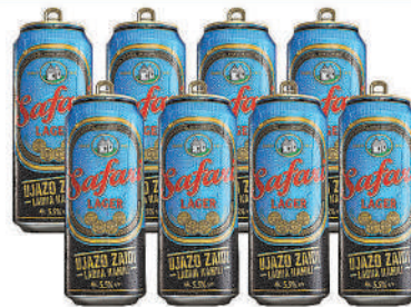
Safari Lager 500ml Can Beer