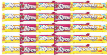
Alpenliebe Candy 36g, Assorted