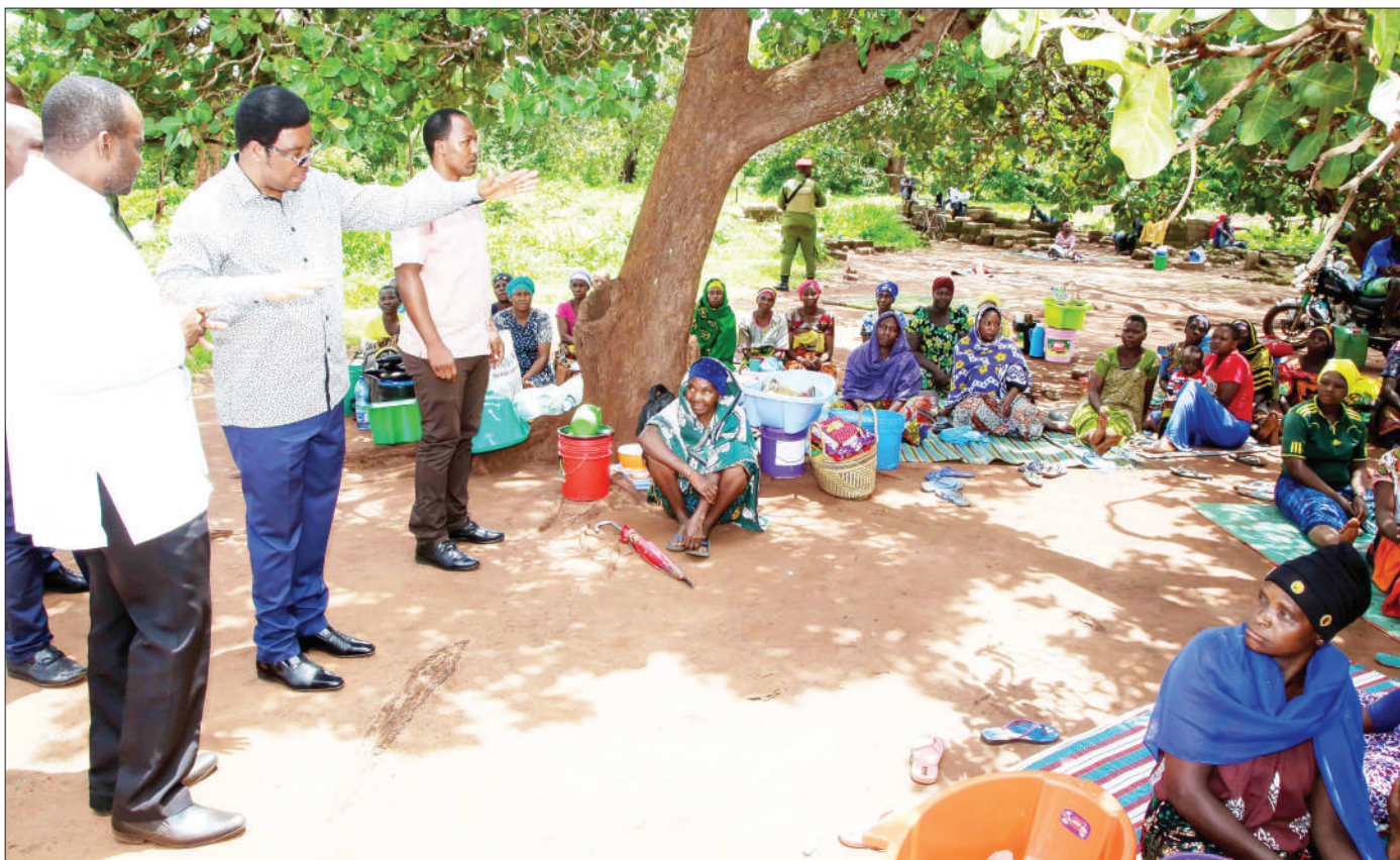
Waziri Mkuu, Kassim Majaliwa, akizungumza na wananchi baada ya kuwajulia hali wagonjwa, katika Hospitali ya Wilaya ya Ruangwa, mkoani Lindi, jana.