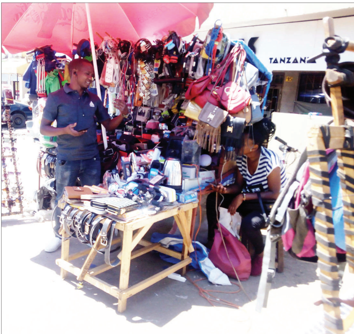
Mnunuzi akiwa anachagua bidhaa za vifaa vya umeme kwa ajili ya kununua.