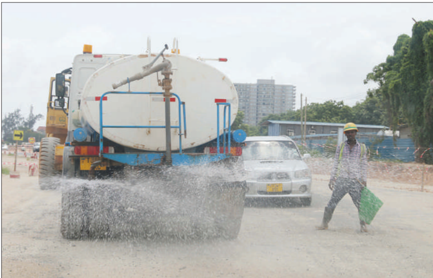
Gari la kampuni inayojenga barabara ya Ocean Road jijini Dar es Salaam likimwaga maji kupunguza vumbi ili kuweka mazingira bora ya kazi.