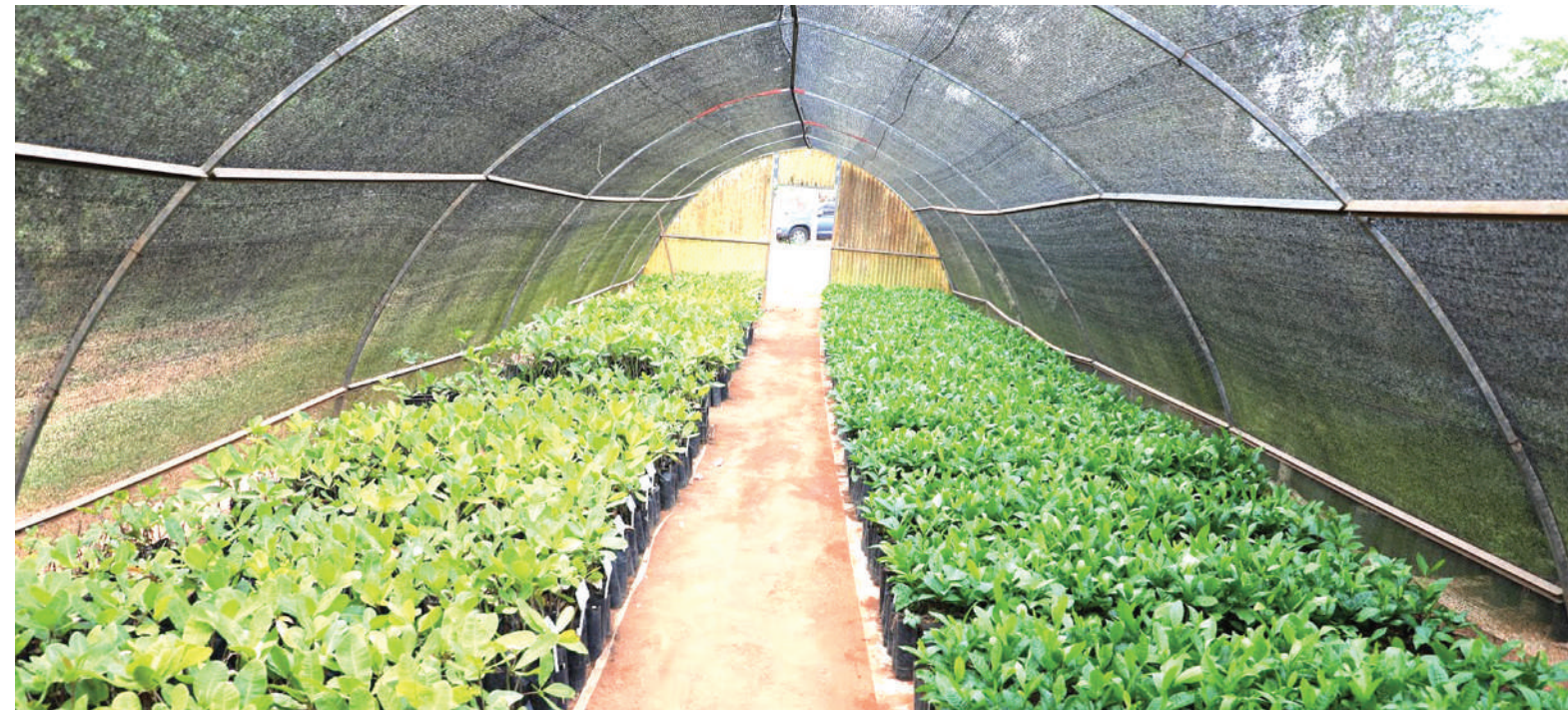
Miche ya korosho katika Kituo cha Utafiti wa Kilimo TARI-Naliendele, mkoani Mtwara, ikiwa katika kitalu nyumba (Green House) kabla ya kupelekwa kwa wakulima.

Kituo cha Ilonga - (Kilosa) Morogoro kimepewa jukumu la kuzalisha mbegu za alizeti, mtama, mahindi, mazao ya mikunde na mazao ya mizizi kama viazi vitamu kwa mikoa ya kanda ya kati,” anasema bosi huyo wa Tari.