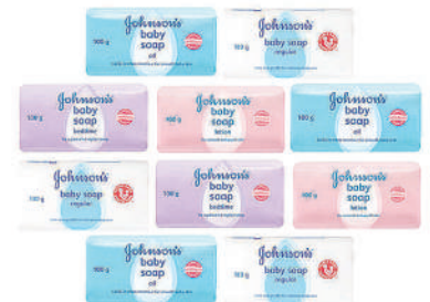
Johnson's Baby Assorted Soap 100g