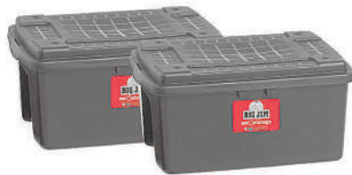
Big Jim 25L Storage Box