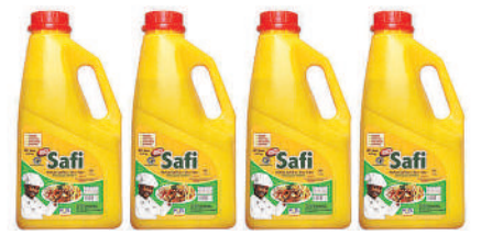
Palm Oil 900ml