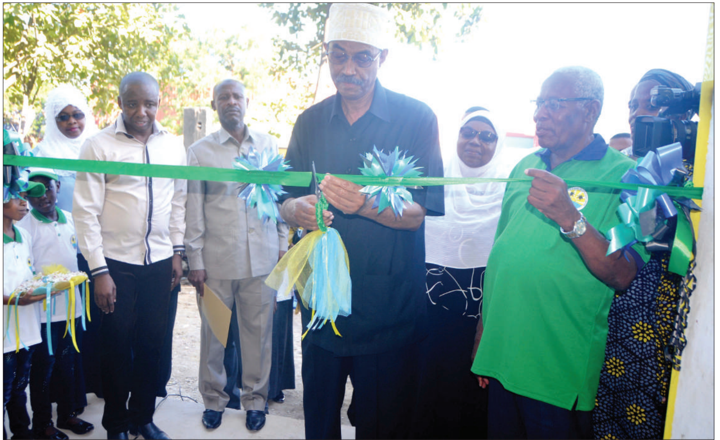
Rais mstaafu wa Awamu ya Sita, Dk. Aman Abeid Karume, akikata utepe katika hafla ya uwekaji wa jiwe la msingi wa jengo jipya la Benki ya Watu wa Zanzibar (PBZ), Malindi (MOTOR TRADE) Zanzibar. Ikiwa ni shamra shamra za miaka 56 ya Mapinduzi ya Zanzibar.

Alisema kukamilika kwa ujenzi wa jengo hilo kutaondoa mrundikano wa wanafunzi katika madarasa, kutoka wanafunzi 49 kwa darasa hadi kufikia 36 kupitia mkondo mmoja wa masomo.