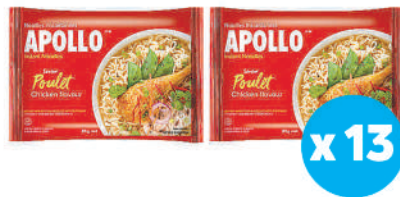
Apollo Noodles Packet