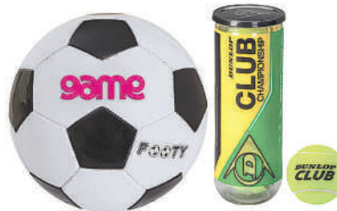
Game 2Ply Soccer Ball Or Club Championship Tennis Ball