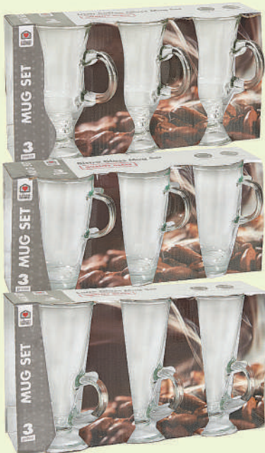
Always Home 3Piece Mug