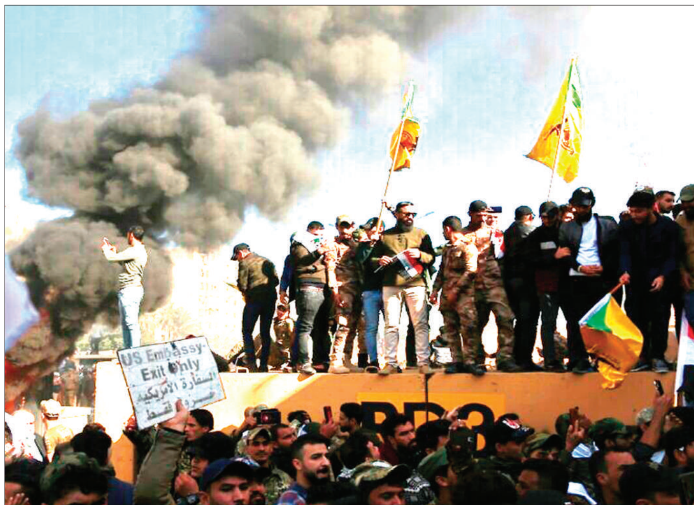
Waandamanaji wakishambulia jengo la ubalozi wa Marekani nchini Iraq juzi.