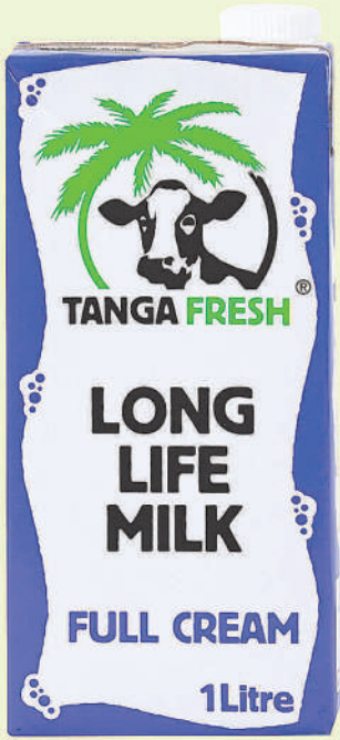
Uht Full Cream Milk