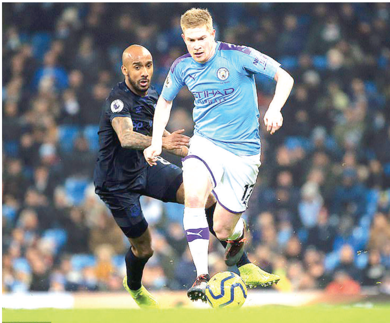
Mshambuliaji wa Manchester City, Kevin De Bruyne (kulia), akijiandaa kumtoka beki wa Everton, Fabian Delph, katika mechi ya Ligi Kuu England iliyochezwa juzi usiku. City ilishinda 2-1.

Vinara hao wa Ligi Kuu pia wanakum-bukumbu ya kupata ushindi wa mabao 6-0 katika mechi yao ya mashindano ya Kombe la FA dhidi ya Arusha FC, wakati Yanga ilipata ushindi wa magoli 4-0 dhidi ya Iringa United, katika michuano hiyo.