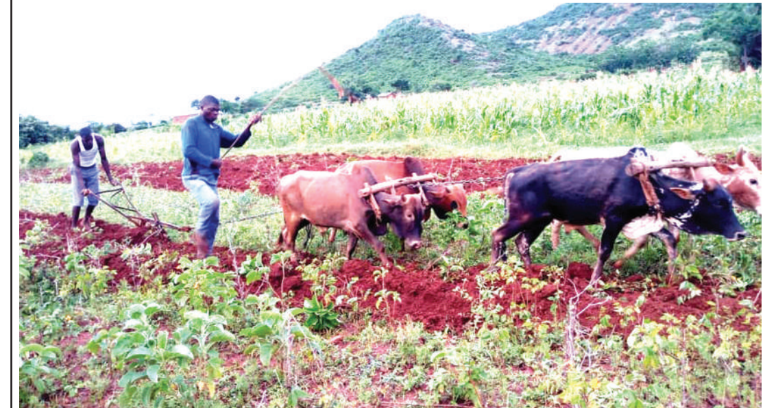
Wakazi wa Kijiji cha Bukumi, Musoma Vijijini mkoani Mara, Tanga Bugimbi aliyeshika plau na Majura Mbogora, wakilima shamba lao kwa jembe la kukokotwa na ng'ombe juzi, na pia wamekuwa wakikodishwa kulima mashamba ya watu wengine kwa Sh. 40,000 kwa kila heka moja.