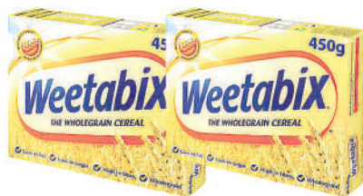
Weetabix Cereal 450g