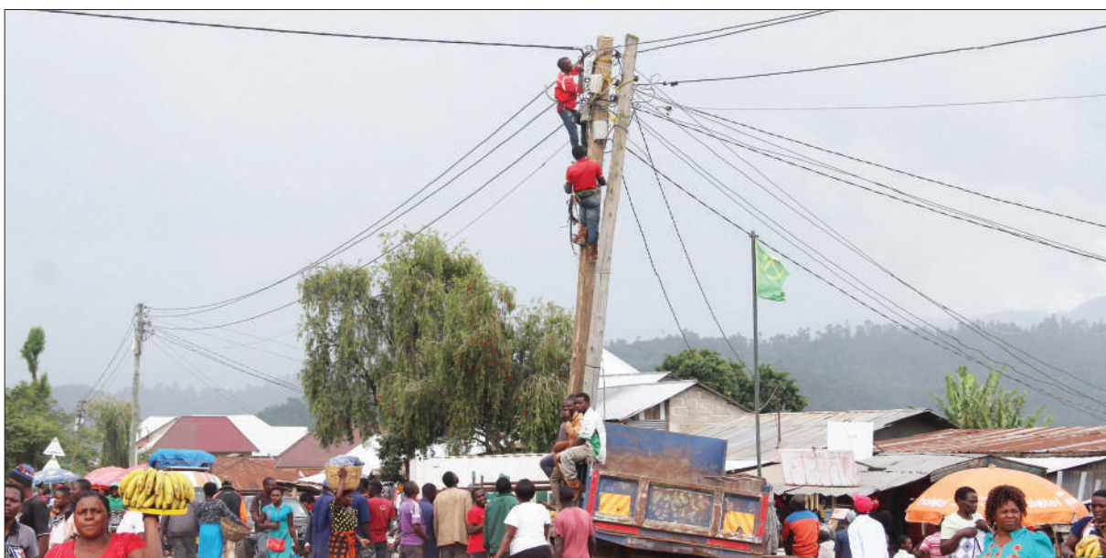
Mafundi wa Shirika la Umeme nchini (Tanesco), Wilaya ya Rungwe mkoani Mbeya, wakihangaika kukata umeme katika eneo la Kiwira, baada ya gari la mchanga kugonga pikipiki na kuangukia kwenye nguzo ya umeme.