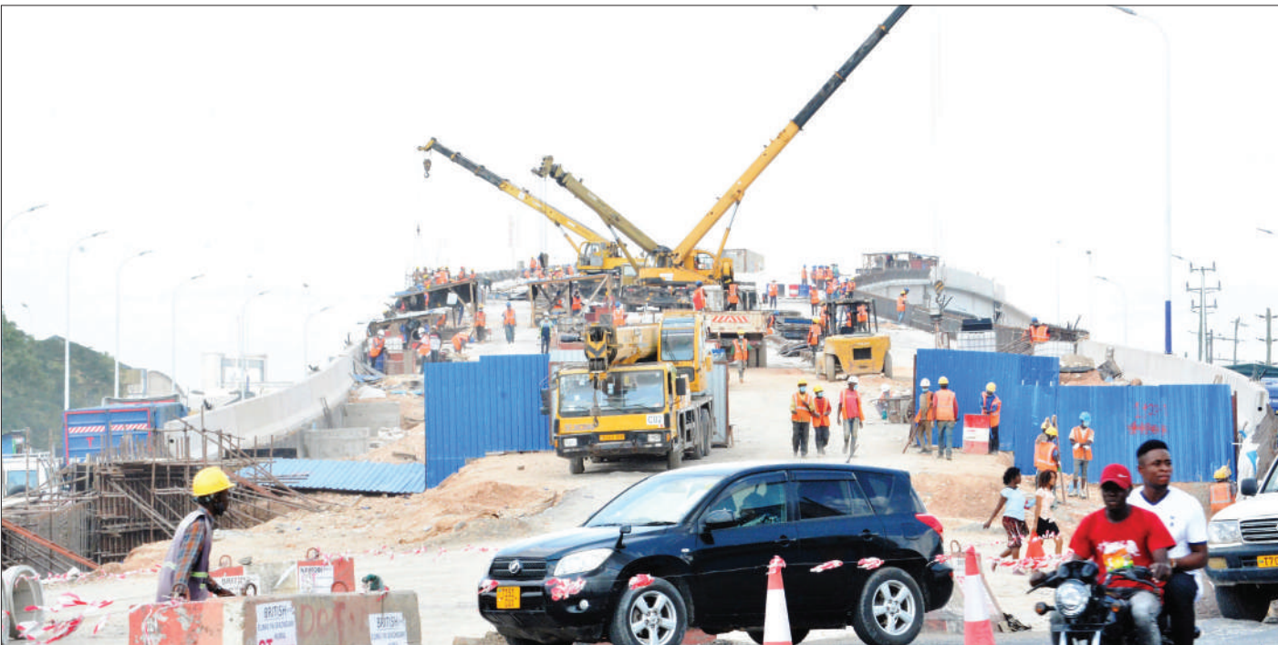
Mafundi wakiendelea na kazi ya ujenzi wa daraja la juu katika makutano ya Barabara za Morogoro, Mandela na Sam Nujoma, eneo la Ubungo (Ubungo Interchange), jijini Dar es Salaam jana.