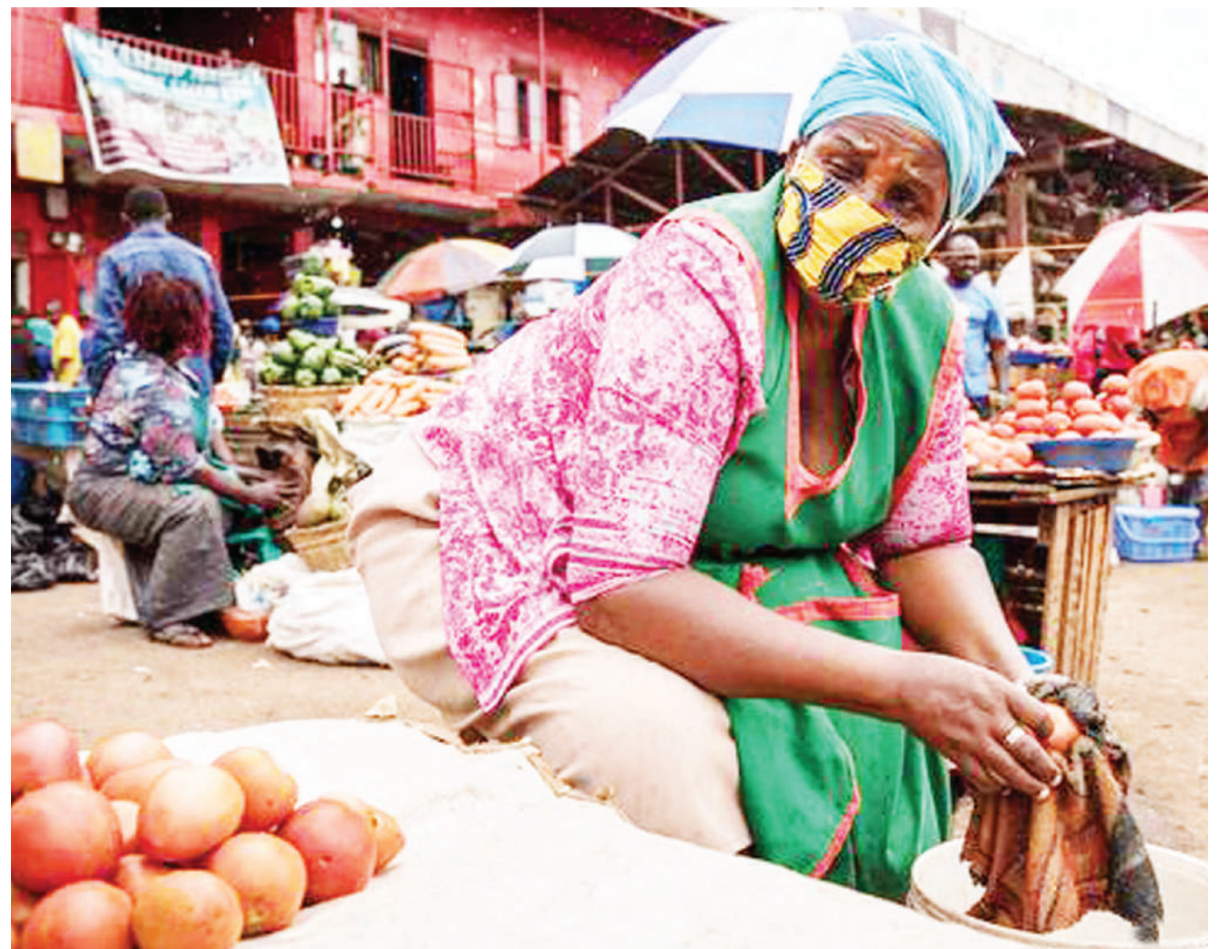
Mwanamama nchini Uganda akiwa sokoni akiuza bidhaa zake baada ya Rais Yoweri Museveni kutoa ruhusa ya kuelelea kwa shughuli za biashara nchini humo.

"Sina virusi vya corona hata kido. Sina dalili. Namshukuru Mungu. Nafuata maagizo niliojiweka, lakini zaidi ya yote mimi na wapenzi wangu mke wangu na watoto wangu, tunakunywa na kufuata maagizo ya dawa yetu ya mitishamba." BBC