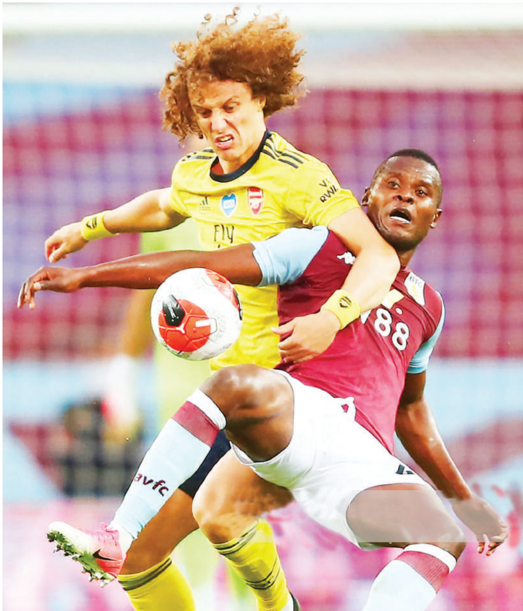
Mshambuliaji wa Aston Villa, Mbwana Samatta, akipambana na mlinzi wa Arsenal, David Luiz wakati wa mchezo baina ya timu hizo kwenye Ligi Kuu ya England, juzi Jumanne usiku katika uwanja wa Villa Park mjini Birmingham, England. Aston Villa ilishinda bao 1-0.