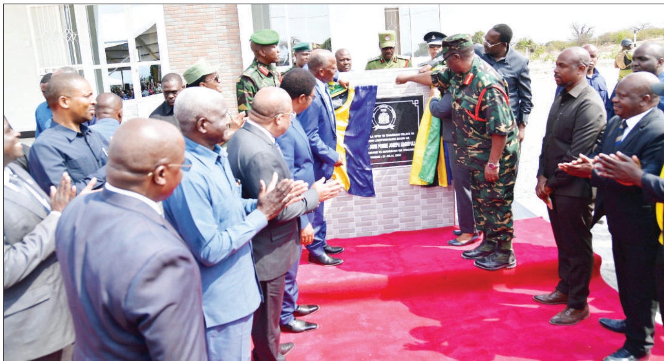
Rais John Magufuli akizindua jengo la ofisi ya Taasisi ya Kuzuia na Kupambana na Rushwa (TAKUKURU), akiwa na Makamu wa Rais, Samia Suluhu Hassan, Waziri Mkuu, Kassim Majaliwa na viongozi wengine katika eneo la Chikuyu B, Chamwino, mkoani Dodoma jana.

Katika hatua nyingine, Rais alitoa wiki mbili kwa taasisi za umma na serikali zinazodaiwa, kuhakikisha zinalipa madeni zinayodaiwa na Shirika la Uzalishaji Mali JKT (SUMA JKT) yanayokadiriwa kufikia Sh. bilioni 11.