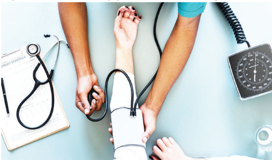
Iliyovyo huduma na matibabu ya shinikizo la damu. PICHA ZOTE: MTANDAO

Nini maana ya 120/80 mmHg? Namba ya juu yaani 120 huitwa 'systolic blood pressure.' Maana yake ni kiwango cha msukumo 'presha' ambacho damu husababishwa kwenye