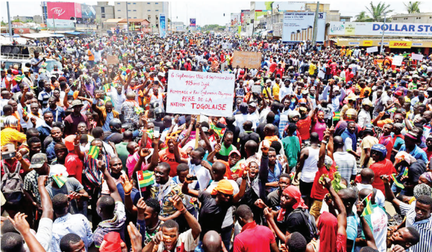
Wakazi wa Nigeria wakiwa katika maandamano yanayowahusu.

• Kusini Jangwa Sahara rekodi yaja, Nigeria 'yawasha taa' kwa mengi