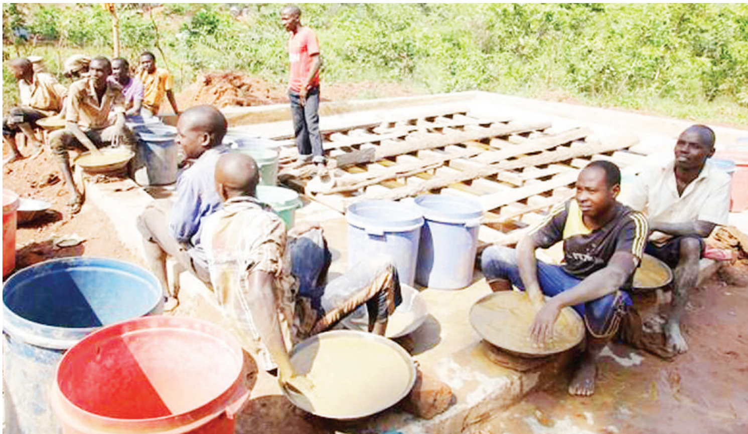
Ndivyo ilivyo, kazi ya uchenjuaji dhahabu kwa kutumia zebaki.

• Shida jibu la 'mbadala uko wapi?' • Angalizo; athari kiafya zinatisha