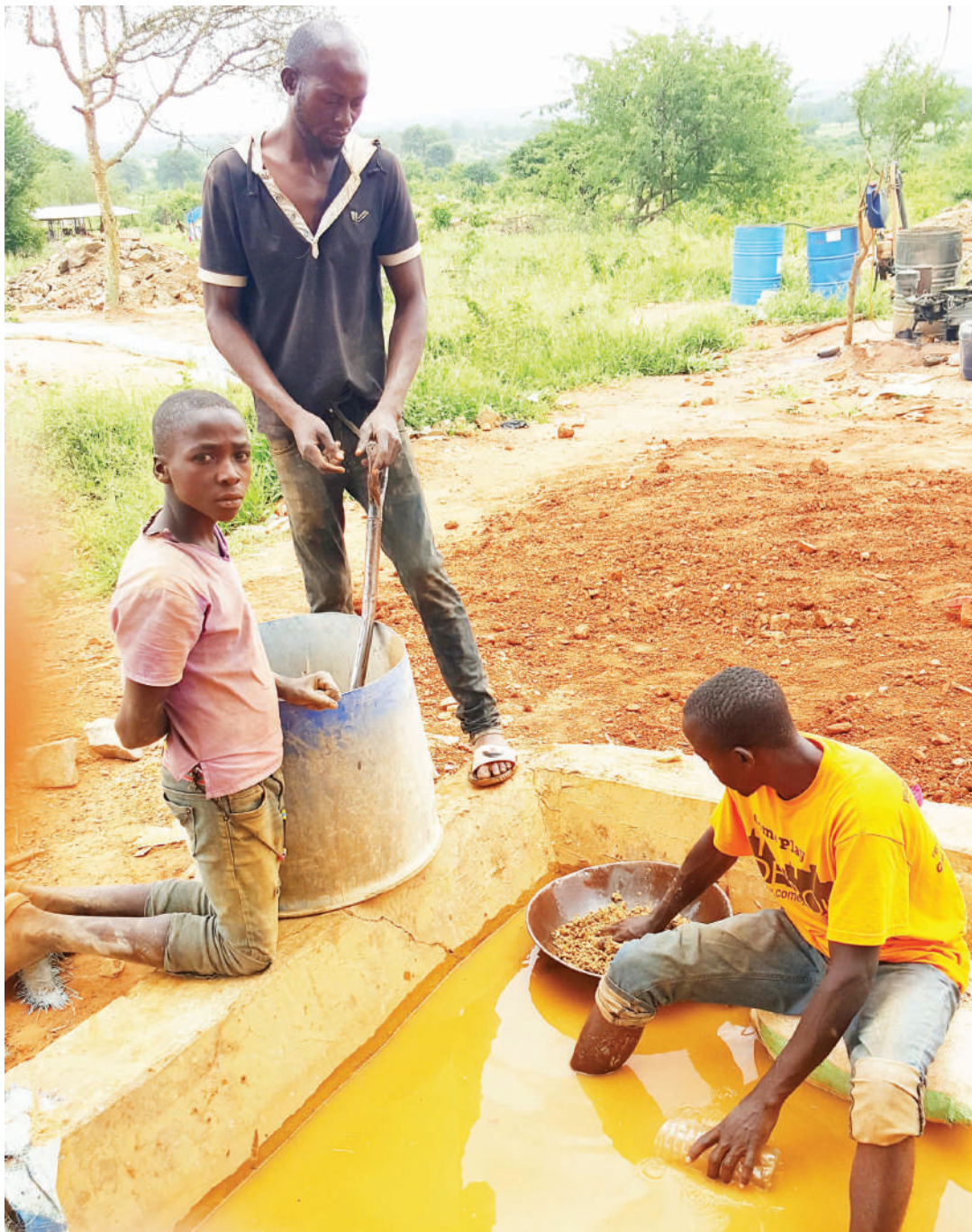
Wachimbaji 'watoto' wakichenjua dhahabu kwa kutumia zebaki kwenye machimbo ya Noli Dodoma.

Zebaki ambayo imetumiwa sana kusafisha dhahabu katika ukanda mzima wa mikoa