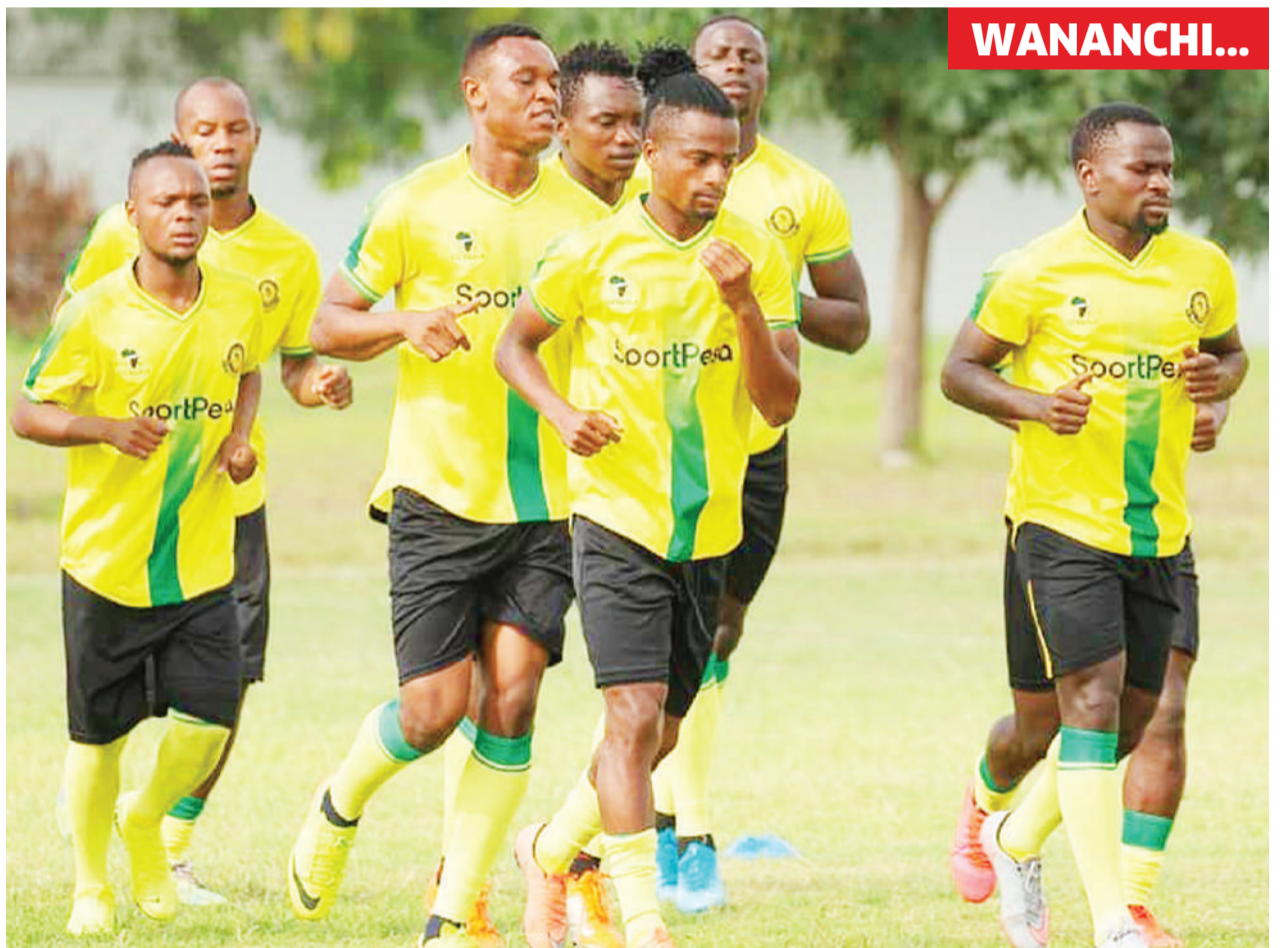
Wachezaji wa Yanga wakiwa mazoezini jijini Dar es Salaam kujiandaa na Ligi Kuu Bara msimu mpya wa 2020/21. Yanga itafungua ligi hiyo dhidi ya Tanzania Prisons katika Uwanja wa Mkapa Jumapili.

Gwambina itashuka dimbani Jumapili kufungua pazia la Ligi Kuu dhidi ya wenyeweji wao, Biashara United, katika mechi itakayopigwa Uwanja wa Kumbukumbu ya Karume mjini Musoma.