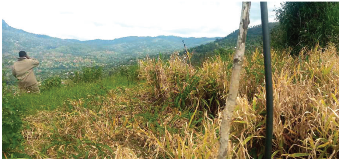
Sehemu ya mabomba yanayosafirisha maji kutoka kwenye chanzo, kwenda kwenye baadhi ya mashamba ya tangawizi yaliyopo milimani.

“Hivyo, hamasisheni na wenzu ambao bado hawajalipa tozo kwa mujibu wa sheria, taratibu na kanuni na mwaka wa pili, tutaweza kubuni,” anashauri.