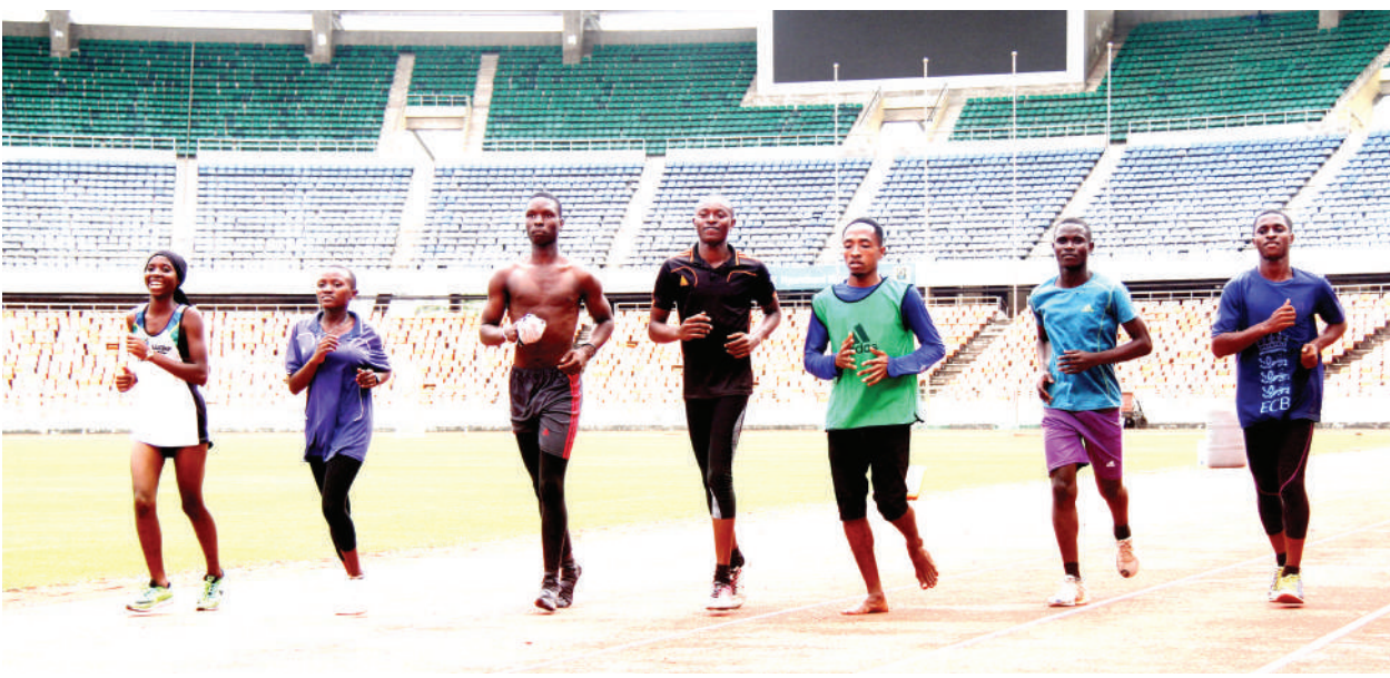
Wanariadha wa Timu ya Mkoa wa Dar es Salaam wakifanya mazoezi kwenye Uwanja wa Benjamin Mkapa jijini Dar es Salaam ili kujiandaa na mashindano ya UMISETA yanayotarajiwa kufanyika mkoani Tabora mwezi ujao.

“Kazi kubwa kwenye uwanja wa mpira wa miguu ilikuwa ni kuweka ‘levo’ uwanja na kuupima katika vipimo vinavyokubalika kama viwanja vingine rasmi vya mpira, baada ya hapo ni kuotesha nyasi za kisasa na kujenga miundo mbinu yake kuzunguka uwanja, kazi imeshaanza na mpaka sasa ndani ya wiki mbili tumefika asilimia 25,” alisema Mhere.