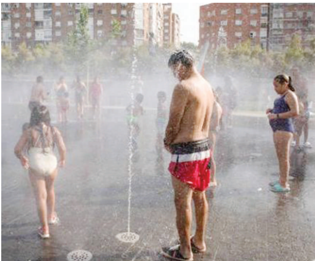
Wananchi wakipooza miili kutokana na joto kali Madrid Hispania.

Sehemu zingine za Bahari ya Mediterania zimeathiriwa ikiwemo Italia, huku serikali ikitangaza hali ya hatari katika Bonde la Po lililoharibiwa ambalo ni mto mrefu zaidi nchini humo.