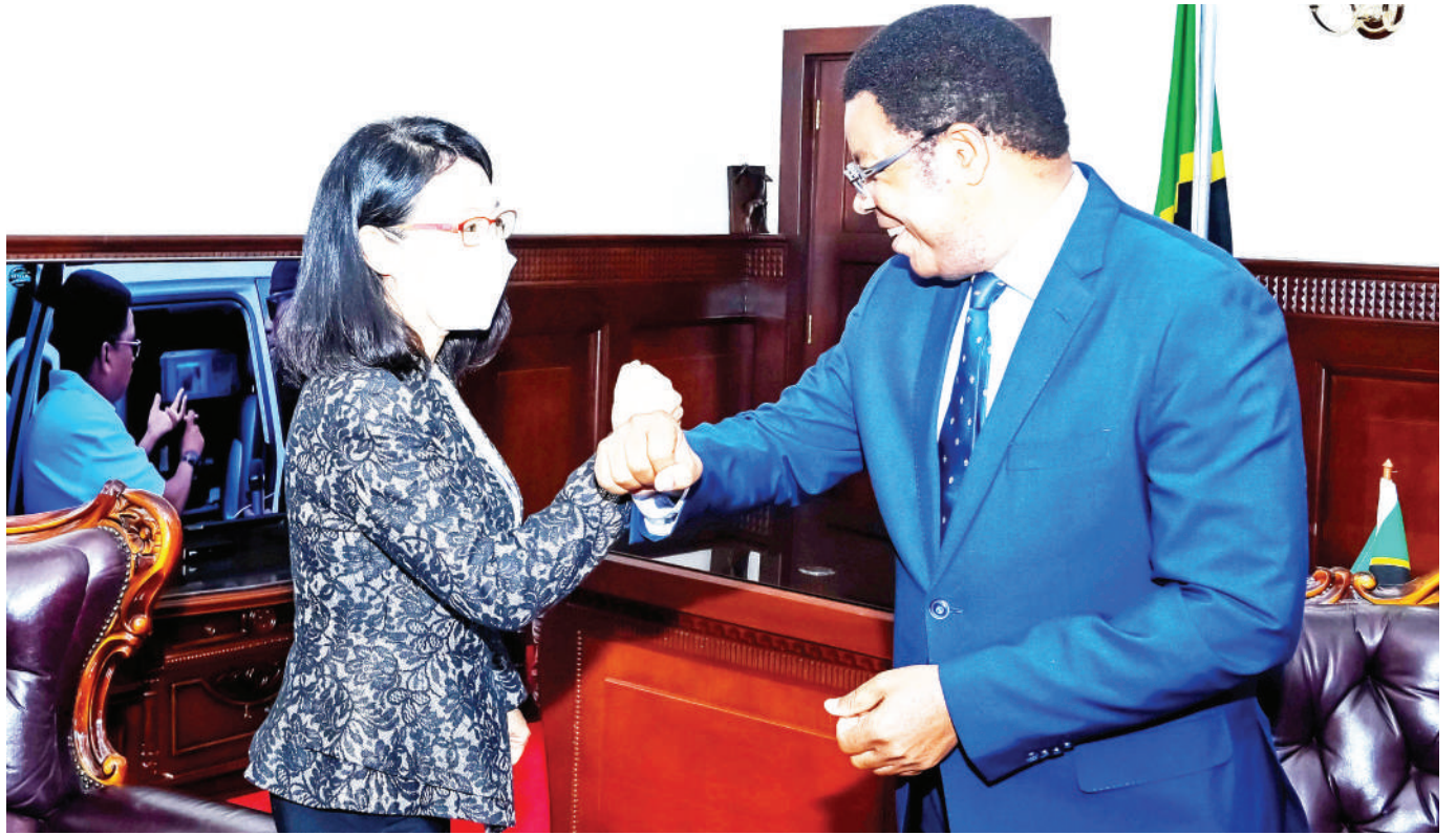
Waziri Mkuu, Kassim Majaliwa, akisalimiana na Balozi wa China hapa nchini, Chen Mingjian, kabla ya mazungumzo yao, ofisini kwake, Ikulu Magogoni, jijini Dar es Salaam jana.

Mwanzoni mwa wiki, Waziri wa Afya, Ummu Mwalimu, alisema ugonjwa huo ni miongoni mwa magonjwa yanayoambukizwa kutoka kwa wanyama kwenda kwa binadamu na unasababishwa na bakteria aina ya leptospira interrogans.