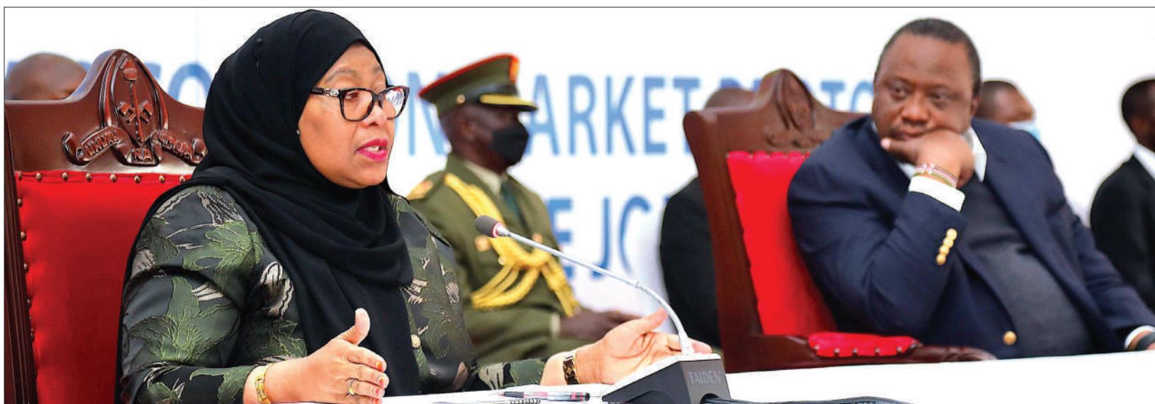
Rais Samia Suluhu Hassan akizungumza katika Mkutano wa 22 wa Wakuu wa Nchi za Jumuiya ya Afrika Mashariki (EAC), jijini Arusha jana. Kulia ni Rais wa Kenya, Uhuru Kenyatta.