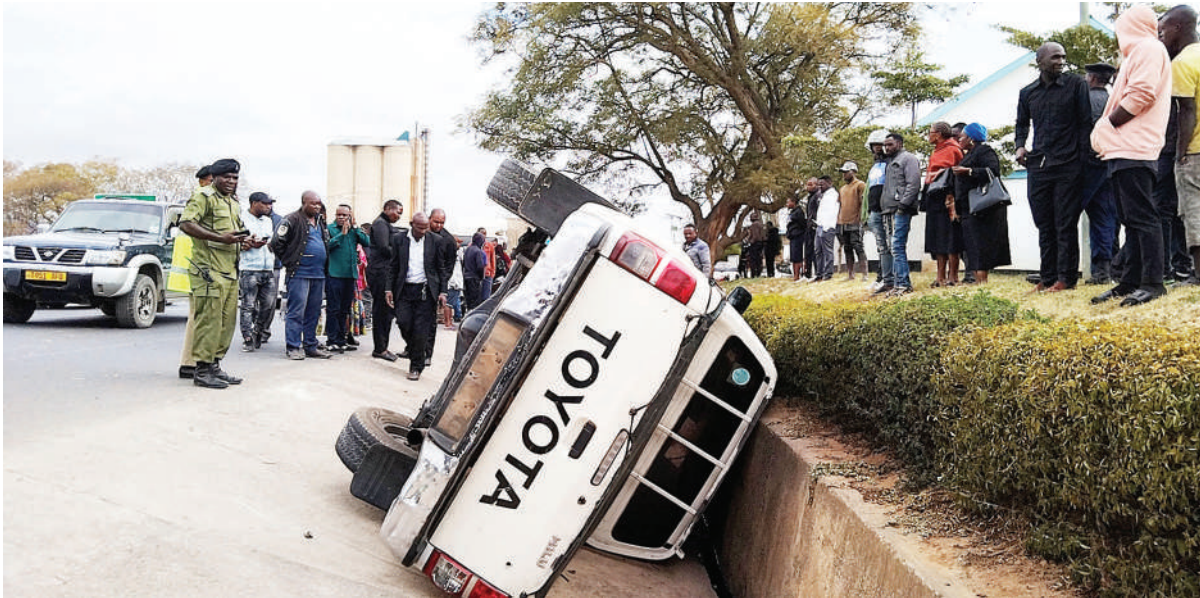
Wakazi wa Manispaa ya Iringa, wakitazama ajali ya gari la Halmashauri ya Manispaa hiyo, lililopinduka baada ya kugongana na gari jingine dogo, eneo la Iruwasa, juzi jioni, ambapo dereva wake alijeruhiwa.