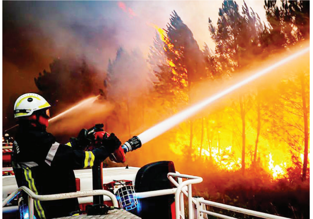
Zimamoto Ureno wakiendelea na jitihada za kuukabili moto unaoteketeza msitu.

Pia alisema kwa mazingira ya huko watoto wasipokwenda shuleni ina maana na mzazi pia