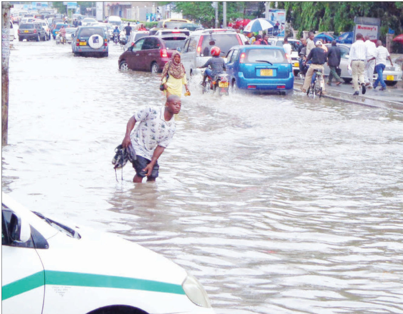
Mkazi wa jijini Dar es Salaam akivuka barabara iliyojaa maji ya mvua, ambayo mitaro yake imezibwa na uchafu na kusababisha maji kutopita kwa urahisi.

Nawaombeni mwendako mkazitumie vema taaluma zenu kutoa huduma kwa wananchi bila kinyongo au ubaguzi, mkawe mfano wa kuigwa kwa jamii kuwa na maadili mema.