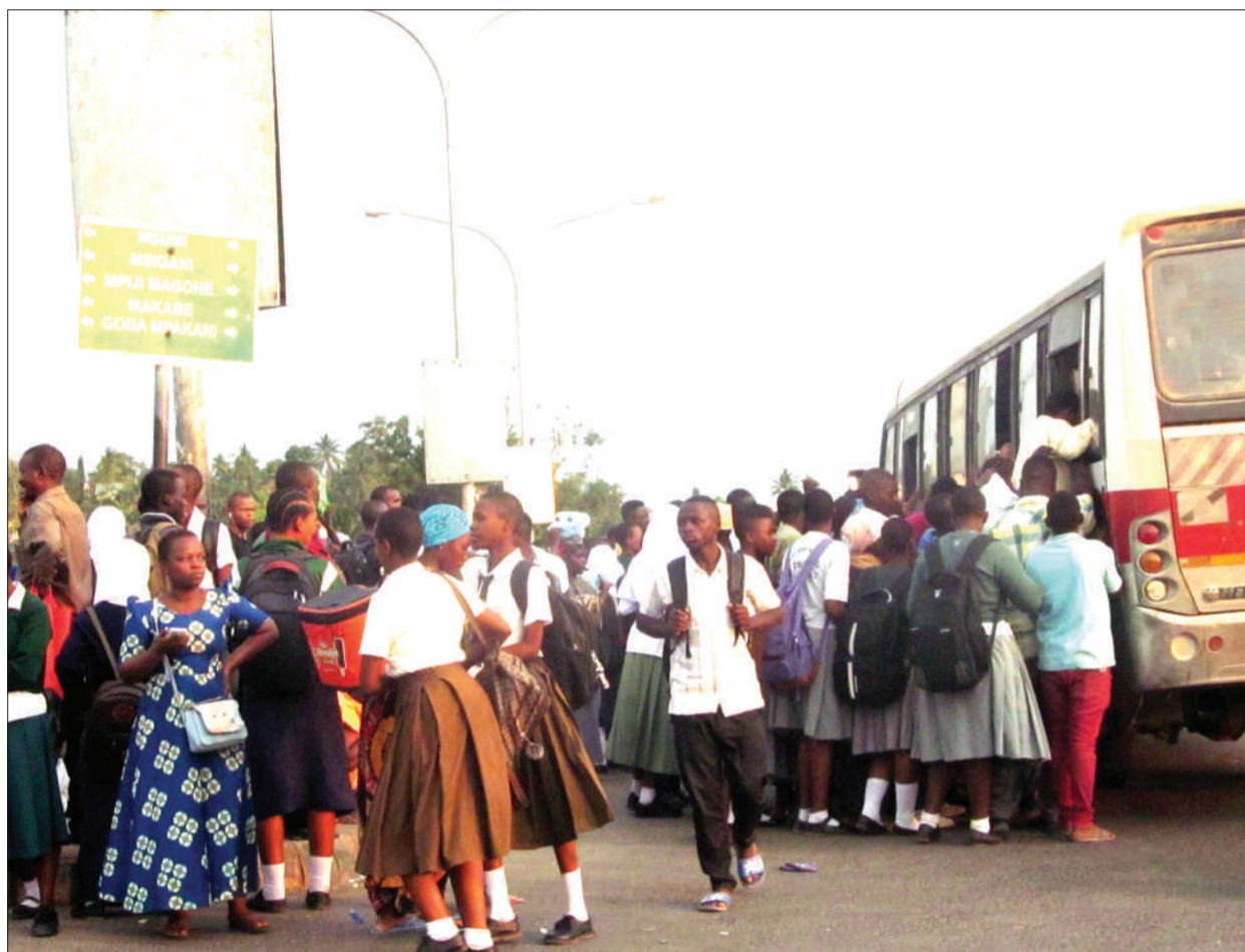
Wanafunzi wakigombea kuingia kwenye daladala katika kituo cha Mbezi Mwisho, jijini Dar es Salaam jana, mara kwa mara huachwa na makondakta vituoni na kusababisha usumbufu.

“Hatimaye mshiriki ambaye ataweza kuzalisha zaidi ndiye atakayeku-wa mshindi,” alisisitiza Mniwasa na kuongeza kwamba shindano linatarajia kufikia tamati mwisho wa mwezi De-semba mwaka huu.