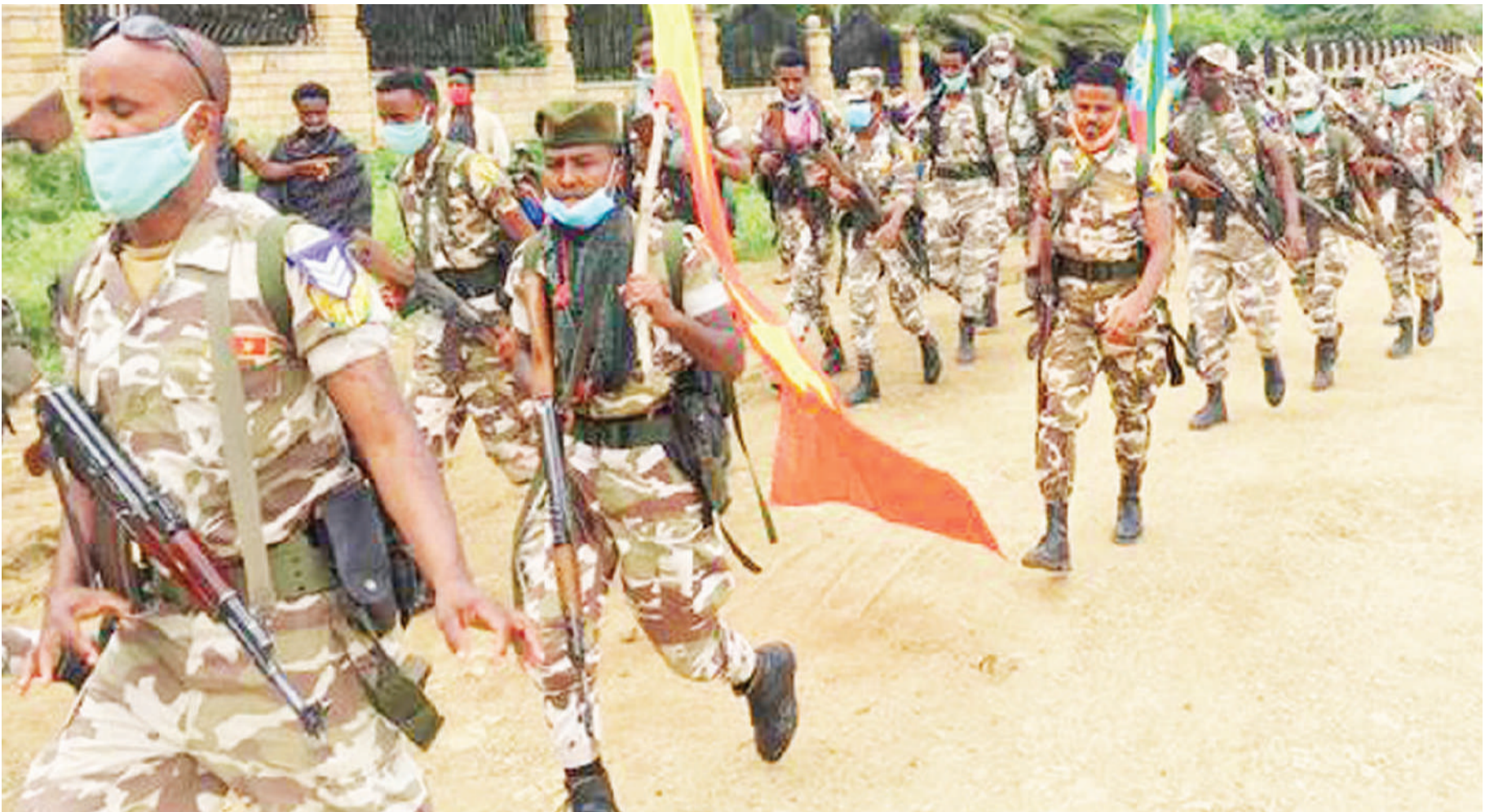
Wanajeshi kutoka vikosi vya serikali ya Ethiopia wakiwa mjini Tigray, tayari kwa makabiliano na vikosi vya mji huo.