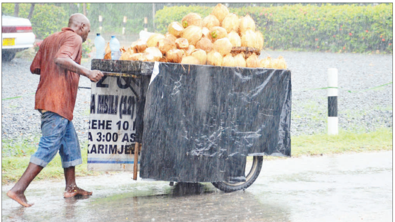
Mchuzi wa madafu akisaka wateja kwenye mvua kubwa katika eneo la Posta, jijini Dar es Salaam jana. Dafu moja aliliuzwa kwa bei ya 1,000