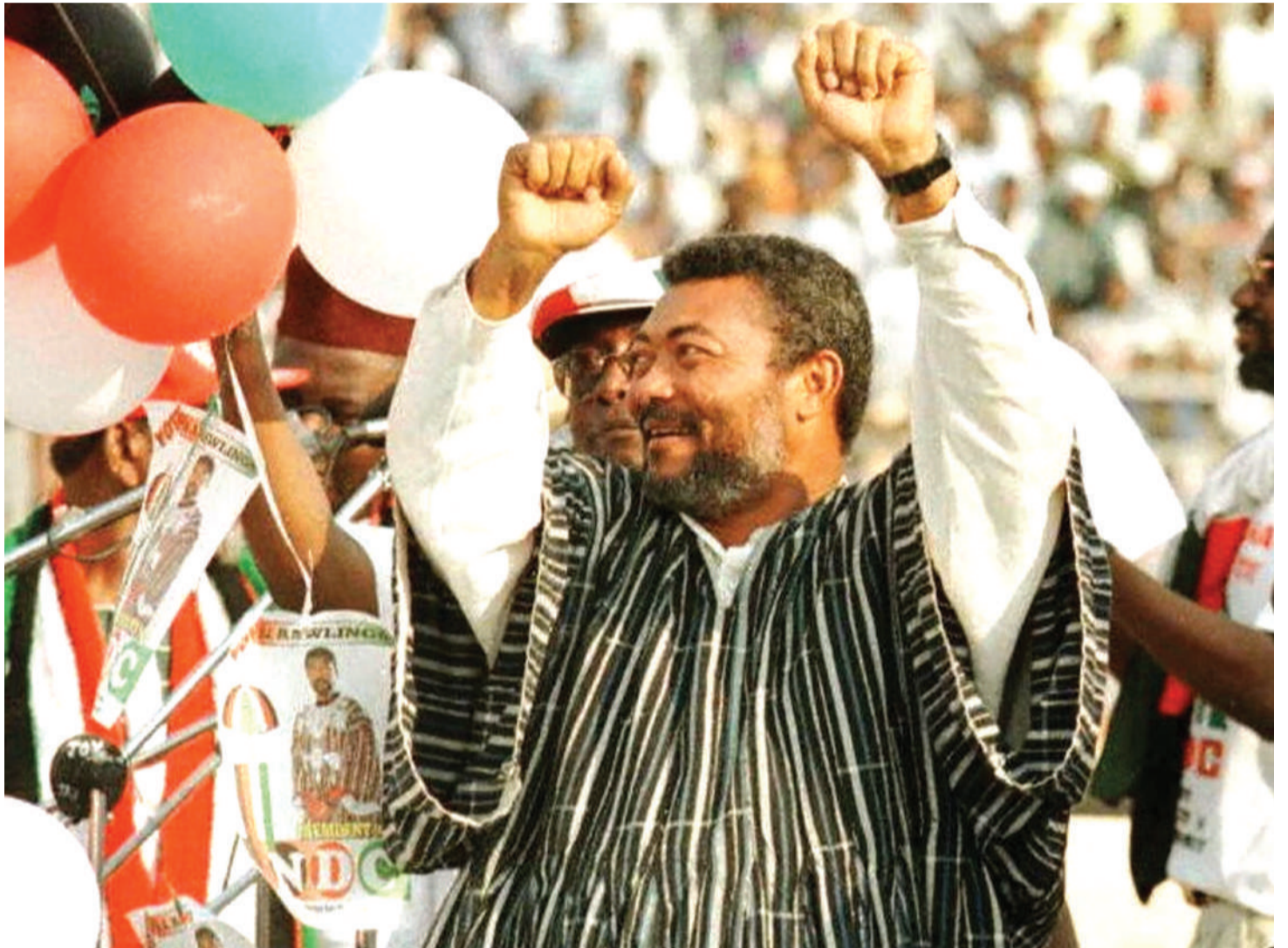
Jenerali Jerry Rawlings akifurahia ushindi wa chama chake baada ya kuanzisha siasa za vyama vingi.

Rawlings anasifika kuwa baadaye alianzisha mageuzi wa soko huria na akaanzisha kipindi kirefu cha utulivu wa kisiasa, ambao unaendelea hadi leo, baada ya msururu wa mapinduzi katika miaka ya 1960 na 1970.