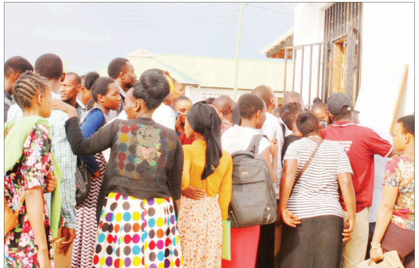
Vijana waliomaliza elimu ya vyuo mbalimbali wakiangalia majina yao kwenye orodha iliyobandikwa katika Ofisi ya Mkurugenzi Mtendaji wa Halmashauri ya Bahi, mkoani Dodoma jana, kwa ajili ya nafasi zilizotolewa za maofisa watendaji wa vijiji.