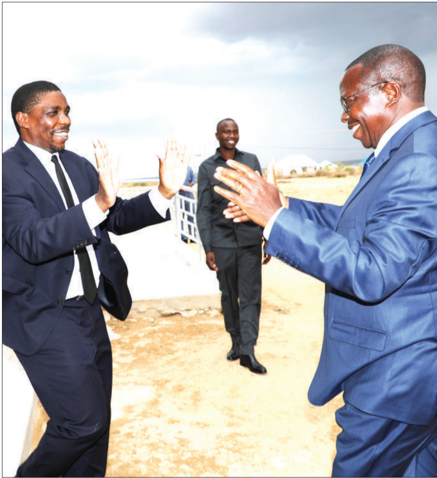
Waziri wa Fedha na Mipango, Dk. Philip Mpango (kulia), akipokelewa kwa furaha na Katibu Mkuu wa Wizara hiyo, Doto James, baada ya kuwasili katika Ofisi za Wizara zilizopo Mtumba, jijini Dodoma juzi.