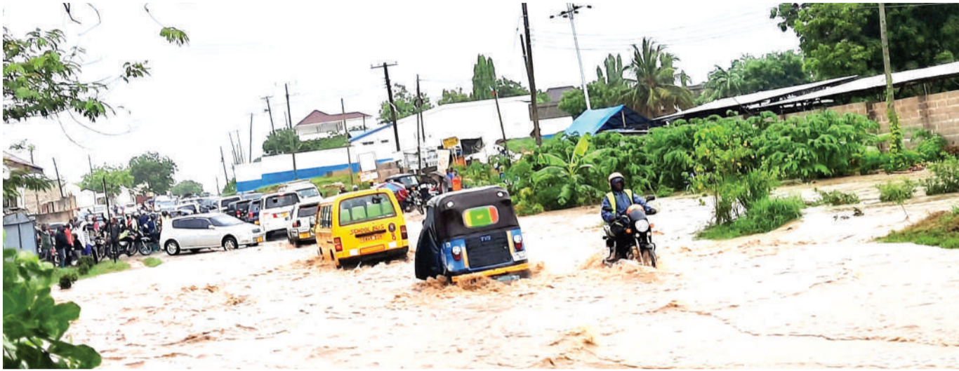
Vyombo vya moto vikipita kwa shida katika Barabara ya Salasala Tangi la DAWASA, iliyofurika maji kutokana na mvua iliyonyesha jijini Dar es Salaam jana.