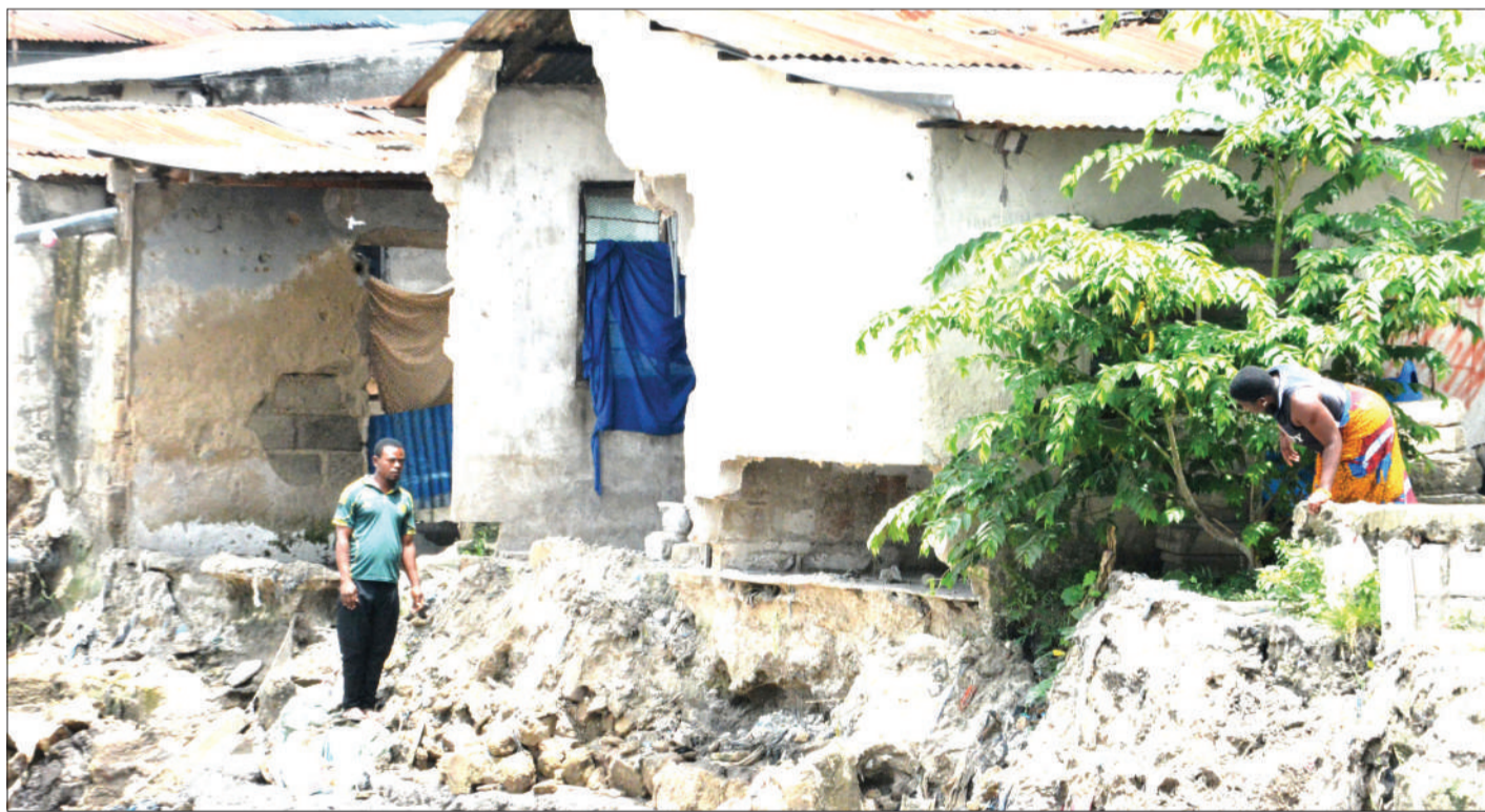
Wakazi wa eneo la Tandale kwa Mtogole, jijini Dar es Salaam, wakiangalia sehemu ya nyumba yao, iliyobomolewa na mvua iliyonyesha jana.

MA-RC waanza kutekeleza agizo la PM, Ma-DC nao wajitosa, maeneo mengine yaadimika ... Endelea Uk. 2