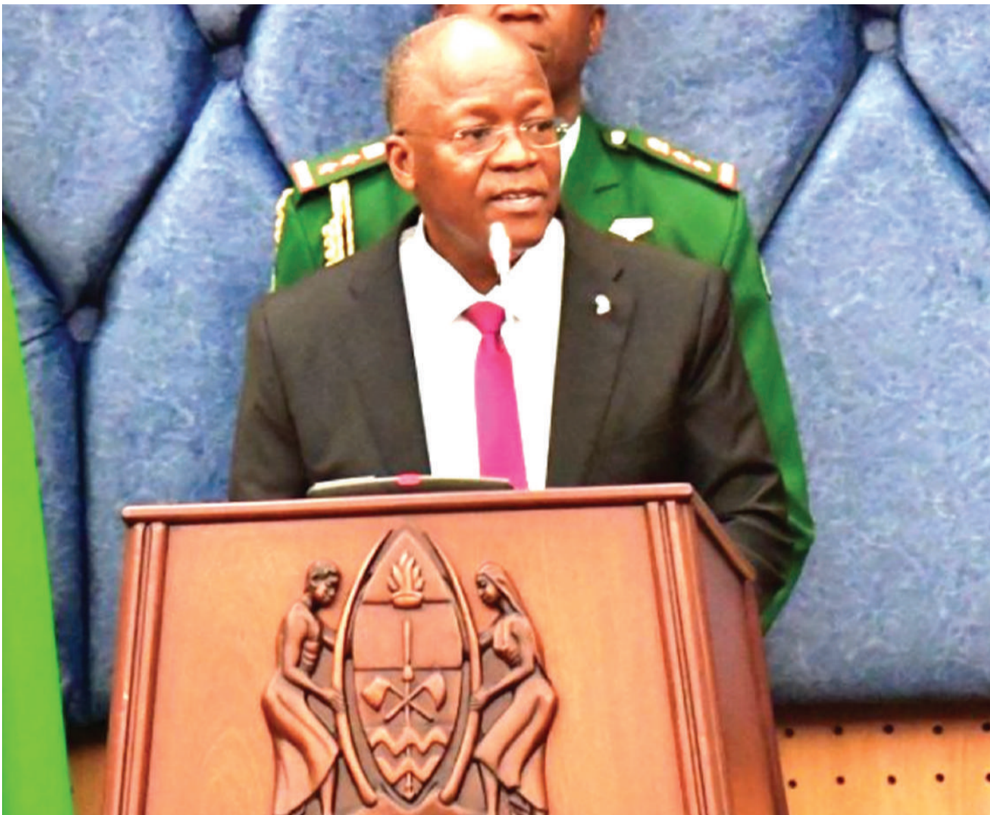
Rais John Magufuli, akizindua na kuhutubia bunge wiki iliyopita jijini Dodoma.