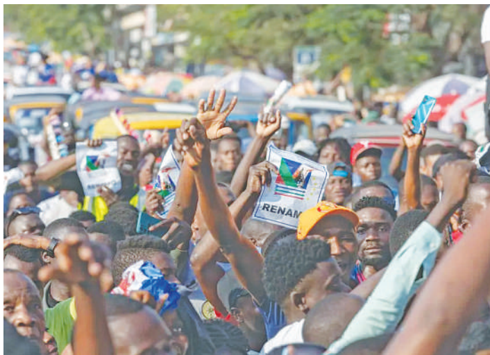
Wafuasi wa chama kikuu cha upinzani, Renamo, wakifurahia jambo katika harakati za uchaguzi nchini Msumbiji.

Michakato hiyo inatarajiwa kusababisha uamuzi sahihi. Hata hivyo, CNE inatakiwa kisheria kutangaza matokeo ya kura ndani ya siku 15, baada ya kupiga kura.