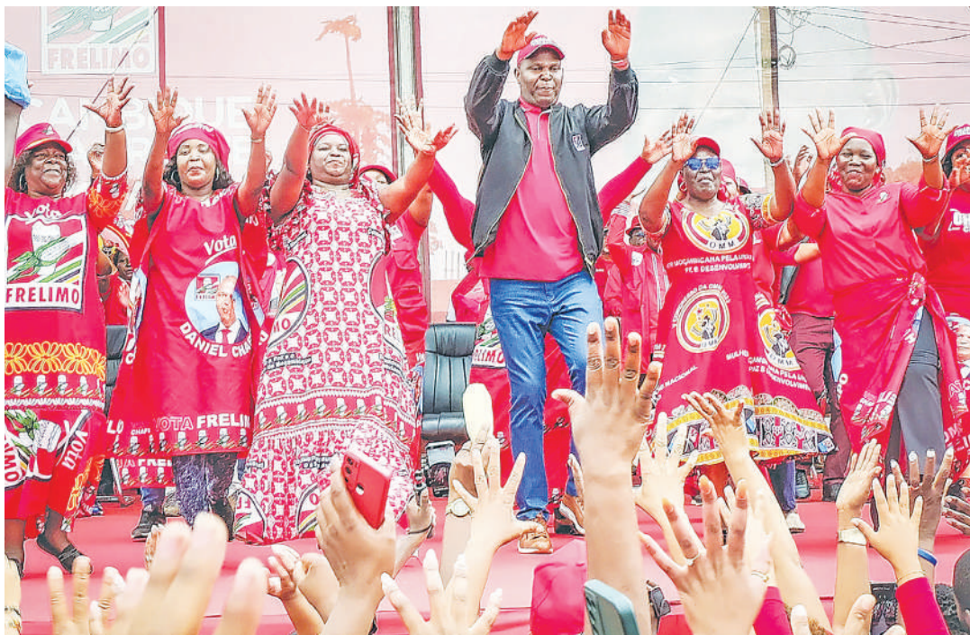
Mshindi wa kiti cha urais nchini Msumbiji, Daniel Chapo, alipokuwa katika harakati za kampeni.

“Kutangazwa kwa matokeo hakumalizi mchakato mzima, hadi matokeo yatakapohibitishwa na washindi kutangazwa.”