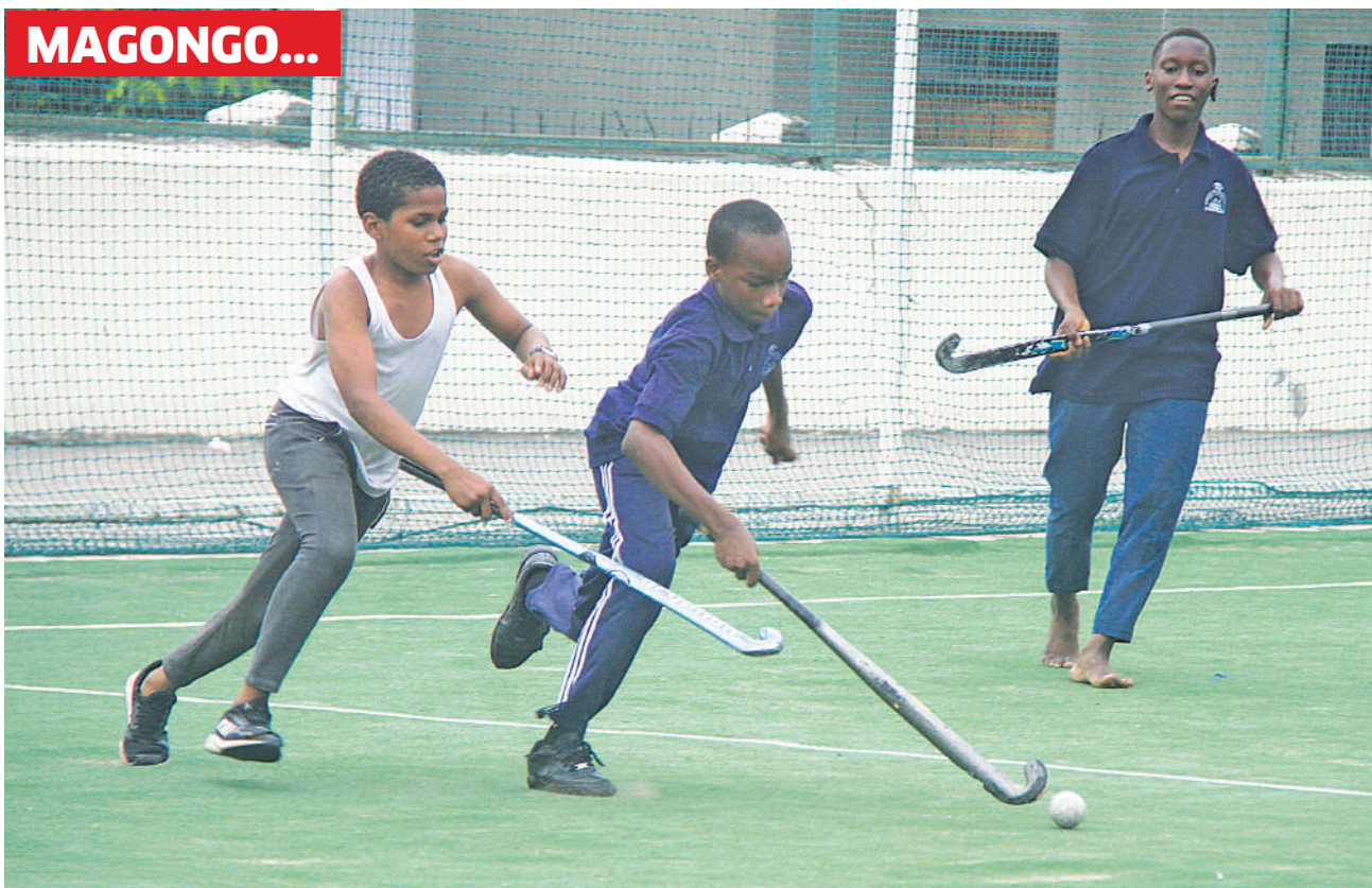
Watoto wakicheza mpira wa magongo katika Uwanja wa Jakaya Kikwete jijini Dar es Salaam juzi.