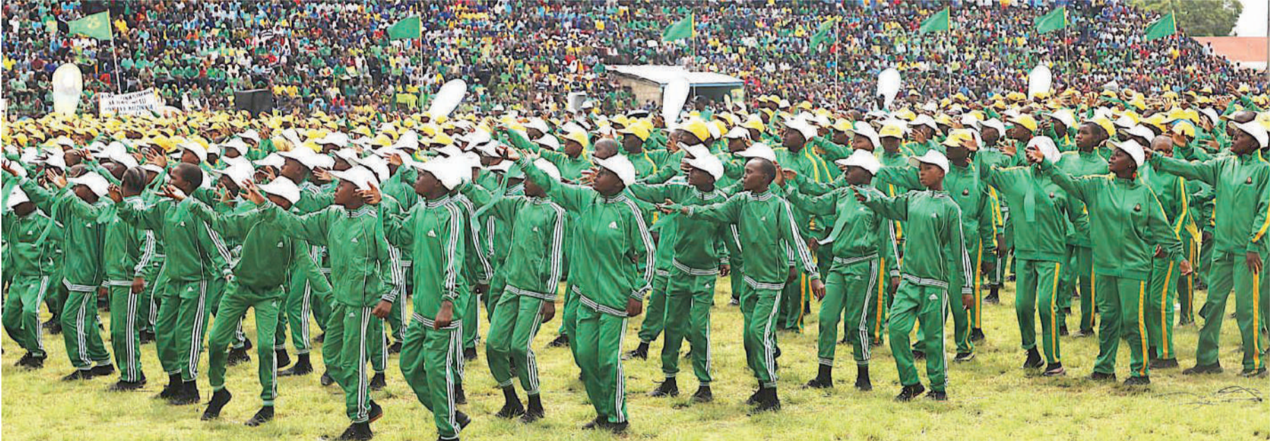
Sehemu ya maadhimisho ya miaka 45 ya CCM yaliyofanyika Uwanja wa Karume mkoani Mara.