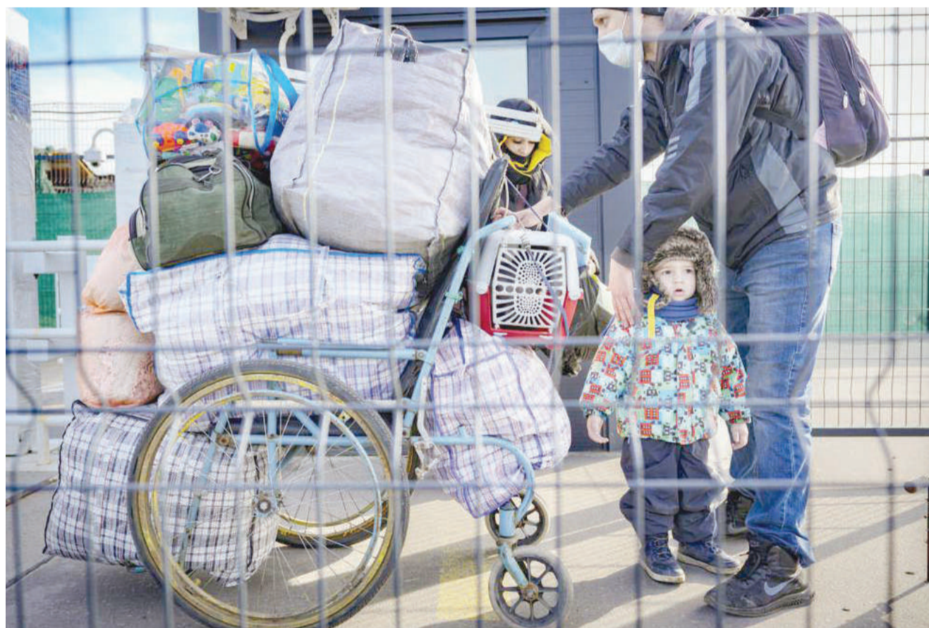
Familia wakisafiri jana, kutoka eneo la waasi linaloiunga mkono Russia, mjini Stanytsia mkoa wa Luhanska, nchini Ukraine. Eneo hilo ndilo pekee ambalo huwa wazi kila siku kwa ajili ya shughuli hizo, watu kadhaa wamekumbwa na hofu ya vita kutokana na mgogoro baina ya nchi hizo.

Russia imebiwa wakati wa kuanguka kwa Umoja wa Kisovieti (USSR) mwaka 1991, akiishutumu Ukraine kwamba ni koloni la Marekani, linaloendeshwa na serikali ya vibaraka.