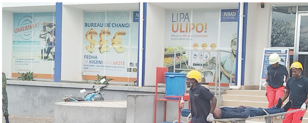
Askari wa Jeshi la Zimamoto na Uokoaji, wakisaidia kuwaokoa wafanyakazi wa benki ya NMB, tawi la Mkwawa, mjini Iringa jana, wakati wa zoezi la utimamu na utayari wa kukabiliana na majanga maeneo ya kazi, lililofanyika kwa kushirikiana na Jeshi la Polisi na benki hiyo.