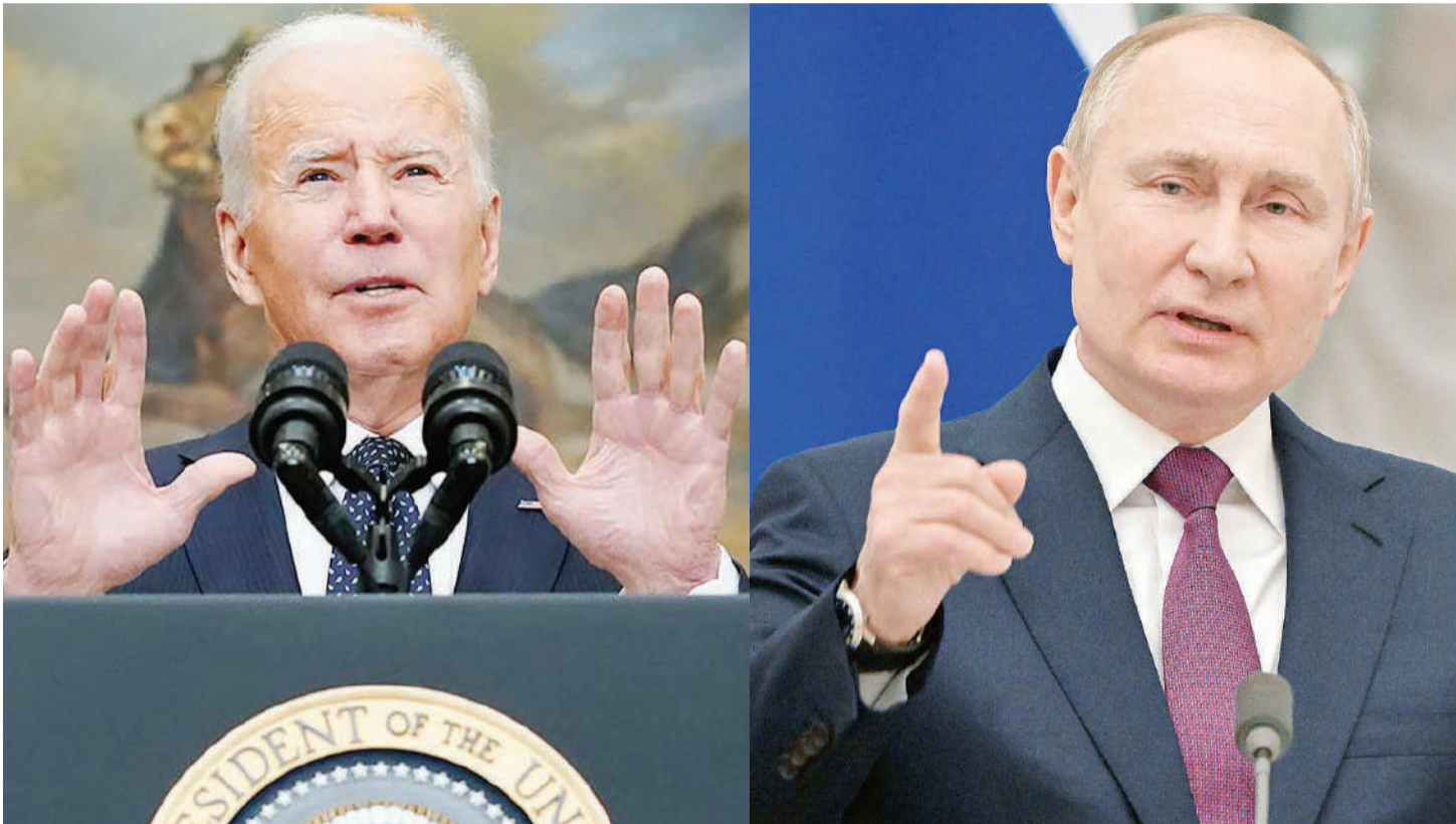
Marais Joseph Biden wa Marekani (kushoto) na Vladimir Putin wa Russia, wahusika wakuu wa mgogoro wa Ukraine unaotajwa kuwa kitisho cha vita vya tatu vya dunia.

• EU yaandaa mkeka wa vikwazo 'mambo yakae sawa'