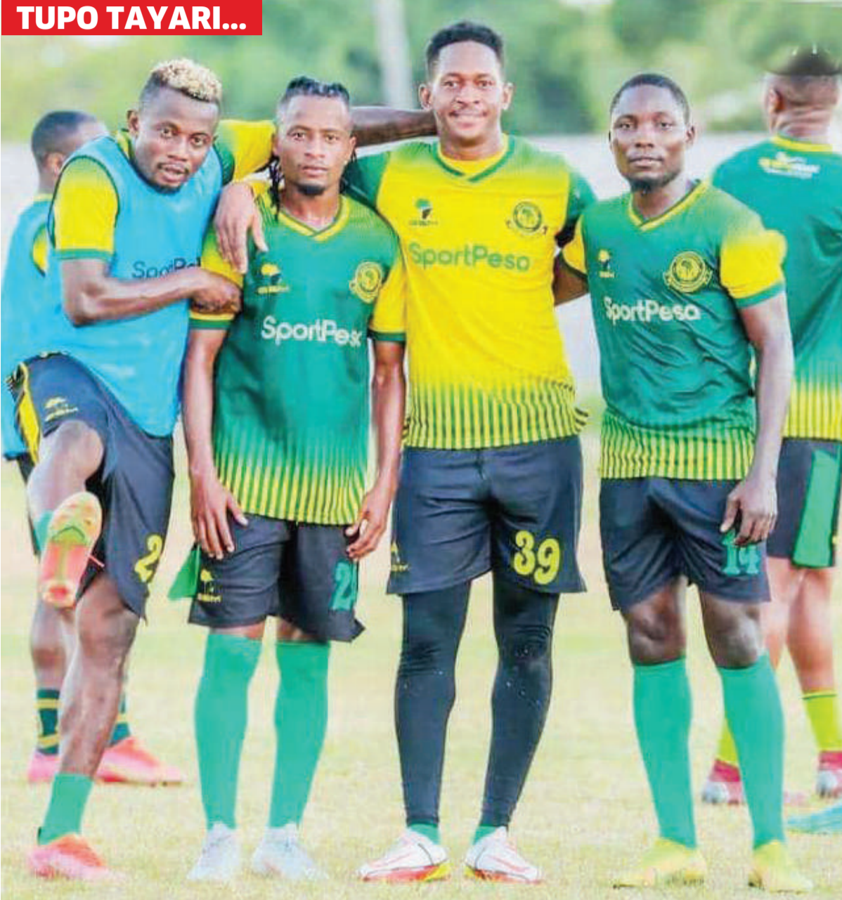
Wachezaji wa Yanga wakipozi katika picha baada ya mazoezi, timu hiyo itashuka Uwanja wa Manungu Complex leo kuivaa Mtibwa Sugar kwenye mechi ya kiporo ya Ligi Kuu Bara.