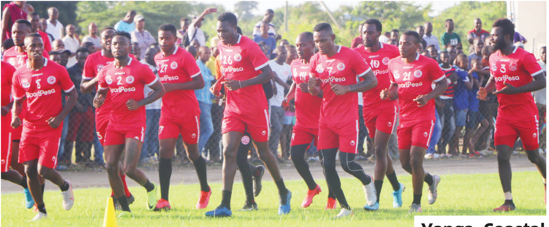
Kikosi cha Simba kikiwa mazoezini kujiandaa na mechi za Ligi ya Mabingwa Afrika. Jumamosi miamba hiyo ya Ligi Kuu Bara itashuka dimbani nchini Sudan dhidi ya Al-Merrikh.