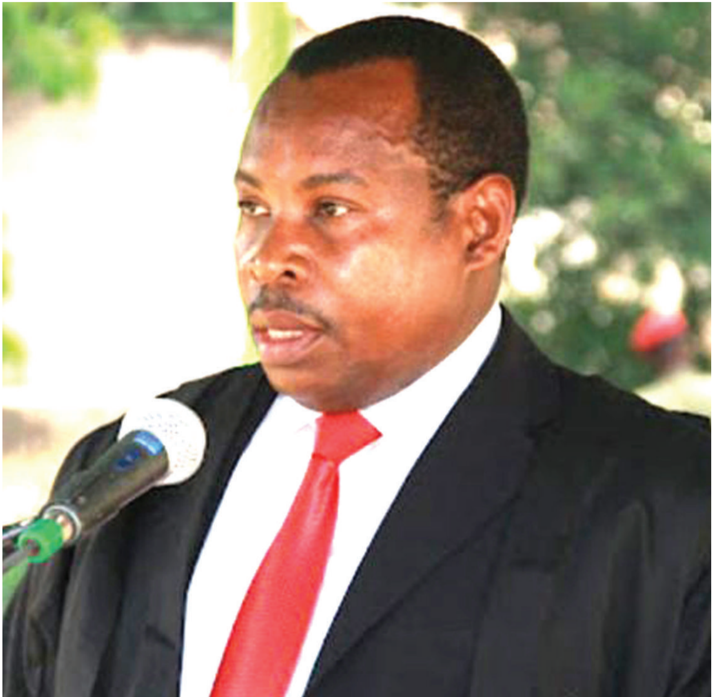
Makamu wa Kwanza wa Rais wa Serikali ya Mapinduzi Zanzibar, Othman Masoud Othman.