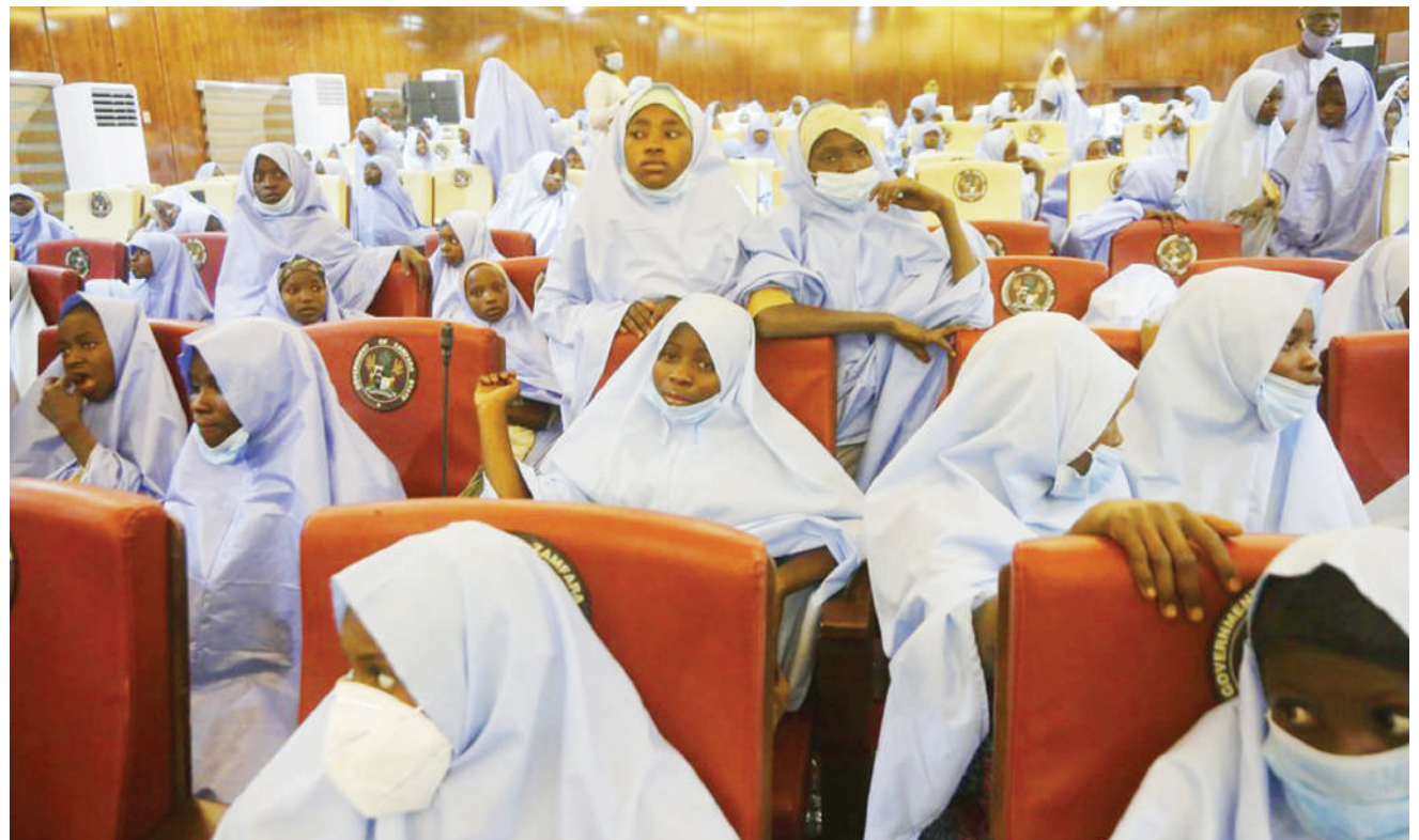
Wasichana 279 waliotekwa nyara na watu wenye silaha kutoka Shule ya Sekondari ya Wasichana ya Serikali, huko Jangebe, wiki iliyopita, wakiwa kwenye mkutano na Gavana wa Jimbo la Zamfara, Bello Matawalle, Gusau, Kaskazini mwa Nigeria, jana.

Mwaka jana ilikadiriwa watu takriban milioni mbili wangetembelea Mecca na Medina, msimu wa kiangazi kwa ajili ya Hija. TRT/NIPASHE