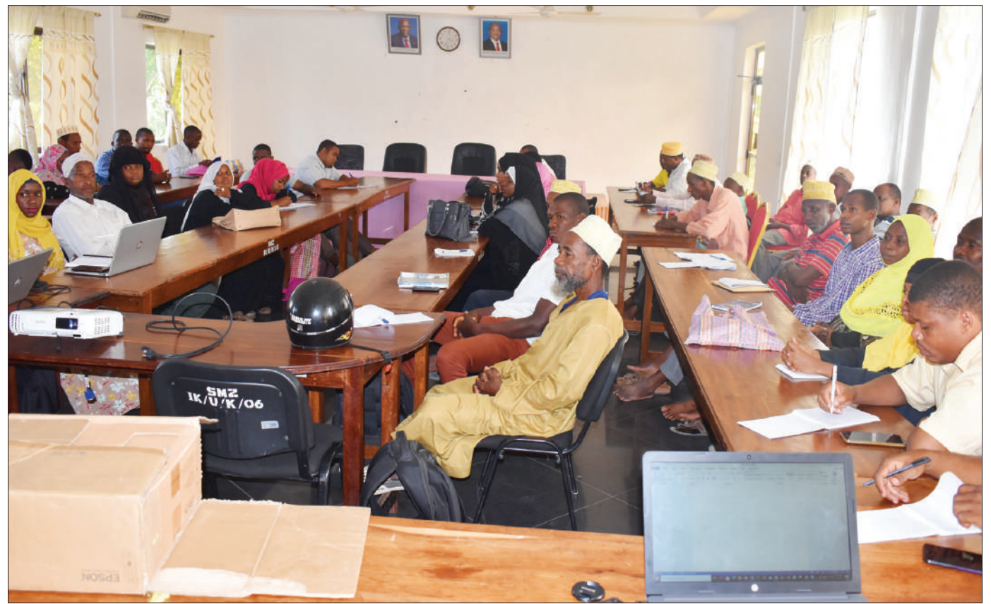
Wataalamu wa kilimo wa kisiwa cha Pemba, wakiwa katika mafunzo ya mbinu bora za kuwafundisha wakulima wa kilimo cha viungo, yaliyofanyika kisiwani humo jana.

“Tuvumiliane tunajua kuwa Wanzibari sote ni ndugu na hili ni jambo zito linalomkumba Rais...kila mmoja atakula alichokipanda,” alisema.