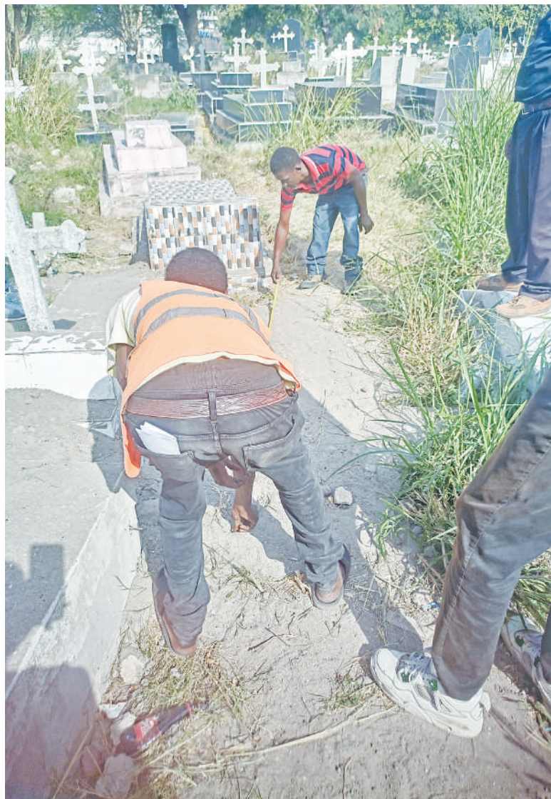
Baadhi ya wafanyakazi kwenye makaburi ya Sinza, Dar es Salaam, wakimwonyesha mteja eneo la kuzika ndugu yake licha ya makaburi hayo kutangazwa na serikali yamejaa.

• Vigogo watajwa, familia zachangia kaburi... Endelea ukurasa 4