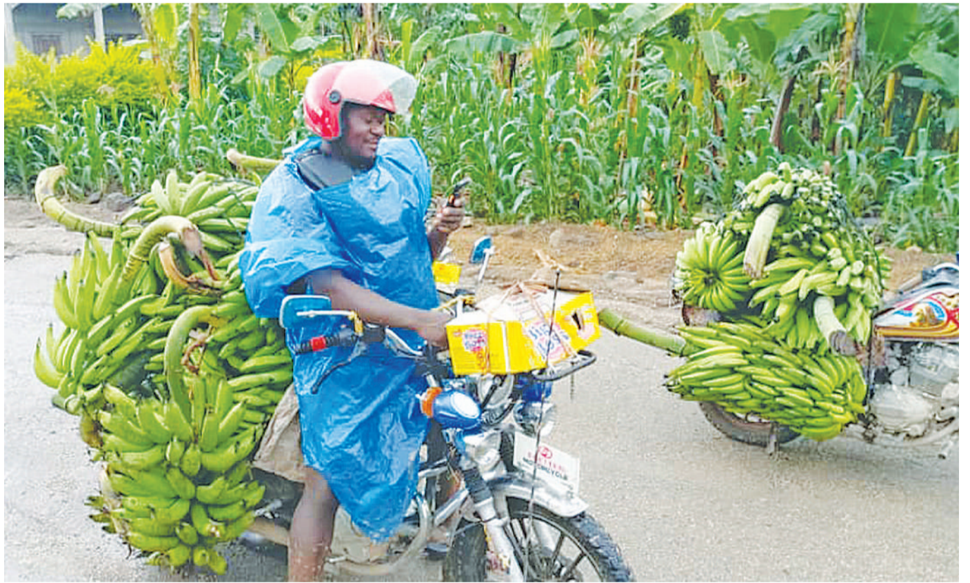
Dereva bodaboda wilayani Rungwe, mkoani Mbeya, akisafirisha ndizi kutoka shambani kwenda Soko la Kalasha ambalo lilianzishwa kwa mbadala wa Soko la Kiwira wilayani humo mwishoni mwa wiki.

Vilevile, aliwataka wataalamu wa Wakala wa Barabara za Mijini na Vijijini (TARURA) wilayani hapa kujiandaa kukabiliana na miundombinu ya barabara ambayo inaweza ikaharibika kutokana na mvua hiyo na kusababisha wananchi kukosa mawasiliano.