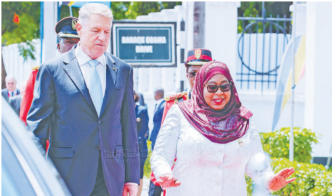
Rais Samia Suluhu Hassan akiwa na mgeni wake Rais wa Romania, Klaus Iohannis, Ikulu jijini Dar es Salaam jana katika hafla ya kumuaga baada ya kukamilisha ziara yake nchini.