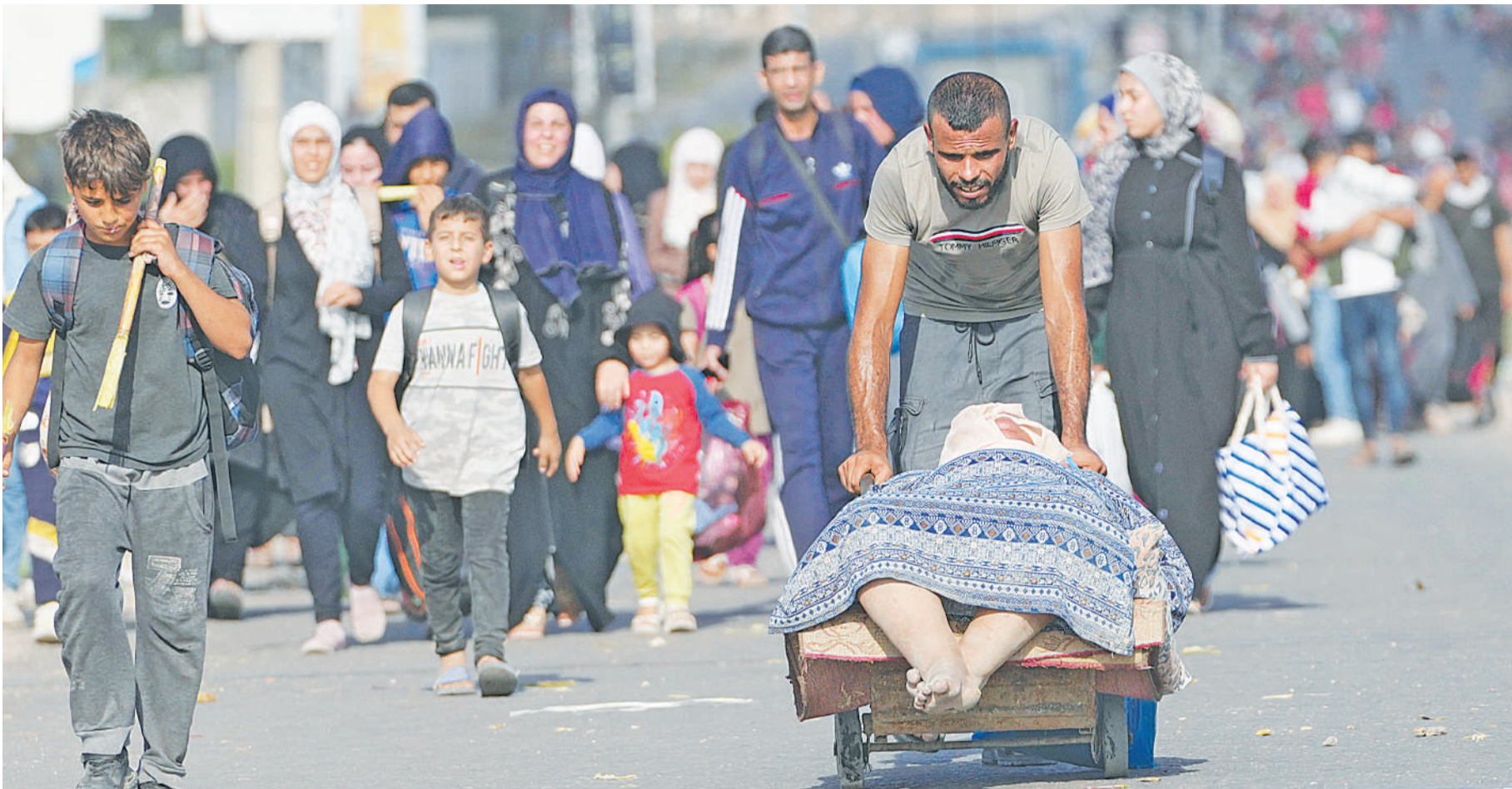
Wapalestina wakitembea kuelekea ufua wa bahari ya Gaza baada ya kutoroka kwenye Hospitali ya Al-Shifa ambayo imezingirwa na majeshi ya Israel jana.