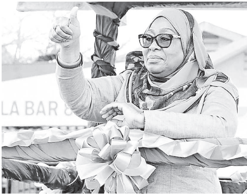
Rais Dk. Samia Suluhu Hassan, alipokuwa katika mji mdogo wa Tunduma, mkoani Songwe.

Mikoa aliyozuru iko juu katika uzalishaji zao kuu la mahindi, kwa mkoani Katavi, Rais Dk. Samia akipandisha bei ya mahindi