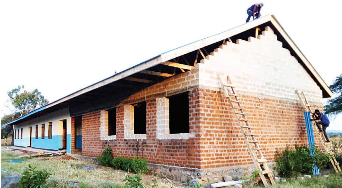
Mafundi wakimalizia ujenzi wa jengo la maabara ya fizikia katika Shule ya Sekondari Etaro, jimbo la Musoma Vijijini mkoani Mara juji.

Alisema uboreshaji huo umeanza kwenye Mkoa wa Kigoma, Tabora na Katavi na sasa kuongezeka katika mikoa ya Kagera, na Geita ikiwa lengo ni kueleza jukumu la uboreshaji wa awamu ya kwanza unafanya kikatika mizunguko 13 iliyoanishwa na katiba.