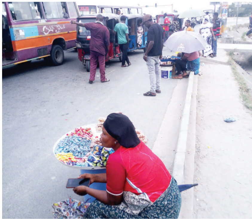
Baadhi ya wafanyabi-ashara wadogo wakiwa wamepanga bidhaa zao katika barabara ya Morogoro, eneo la Kimara Temboni, Manispaa ya Ubungo Dar es Salaam jana, kitendo ambacho ni hatari kwa usalama wao.

Jana walikuwa majimbo ya Bahi, Maswa, Itilima, Kigoma Kaskazini na Peramiho. Na leo wataendelea na ziara katika majimbo ya Buhigwe, Rorya, Tarime Mjini, Manyoni, Buyungu na Songea Mjini.