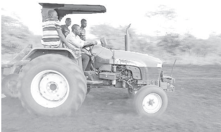
Shughuli za kilimo zikiendelea kijijini Msomera, walikohamia wakazi wa Ngorongoro.

kuvuna mazao mengi katika mashamba wanayolima.