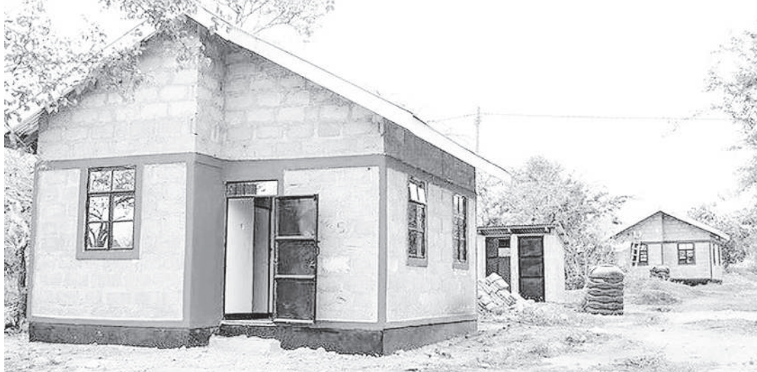
Makazi mapya ya wananchi waliotoka Ngorongoro.

Kazi hiyo imefanyika kwa kila eneo, kuna maofisa ugani wanasaidia wakulima kujua afya ya udongo kabla hawajaanza kulima, ili walime mazao stahiki katika eneo husika ili waweze