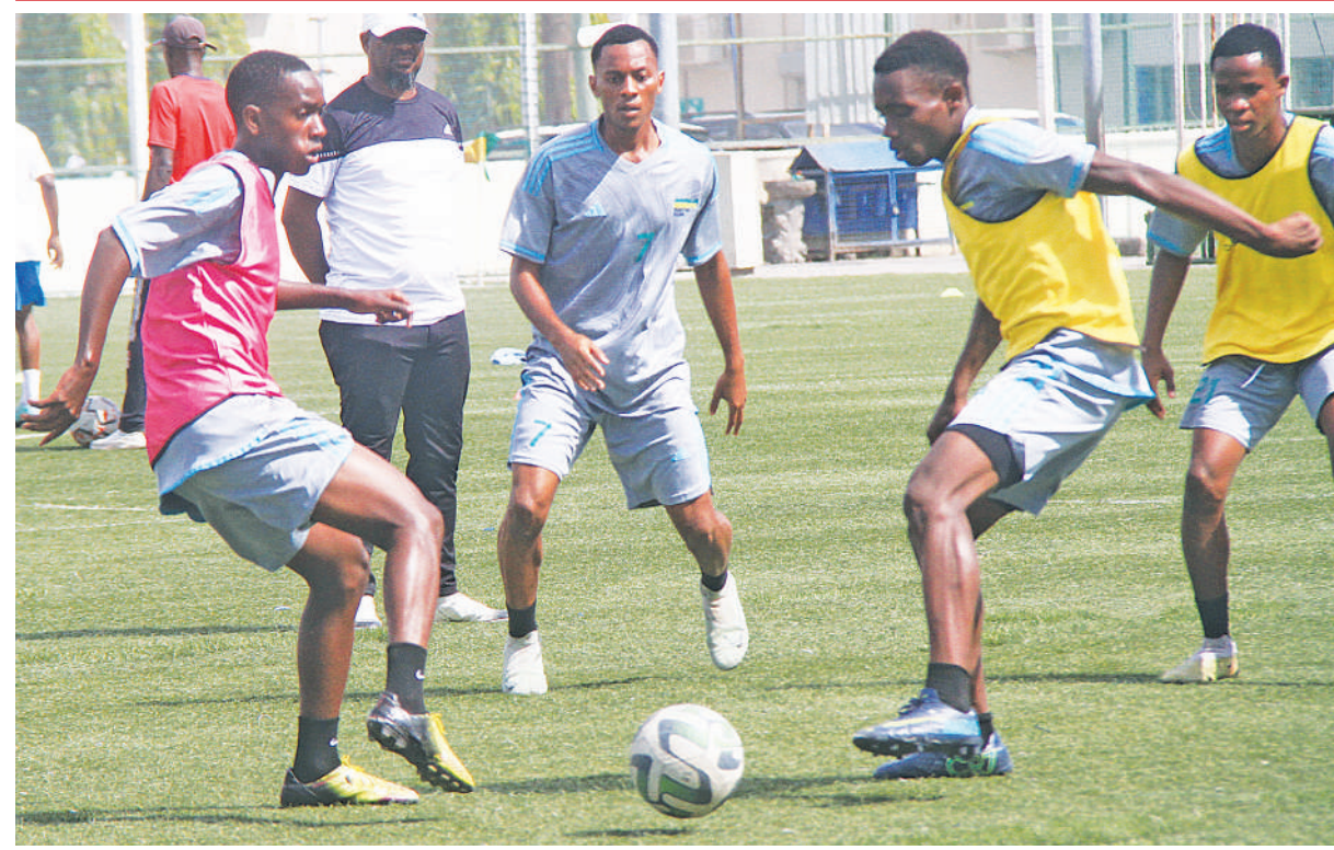
Wachezaji wa soka wa kituo cha michezo cha Jakaya Kikwete wakiwanjia mpira walipokuwa wakifaya mzozi katika uwanja wa Kituo hicho jijini Dar es Salaam jana.