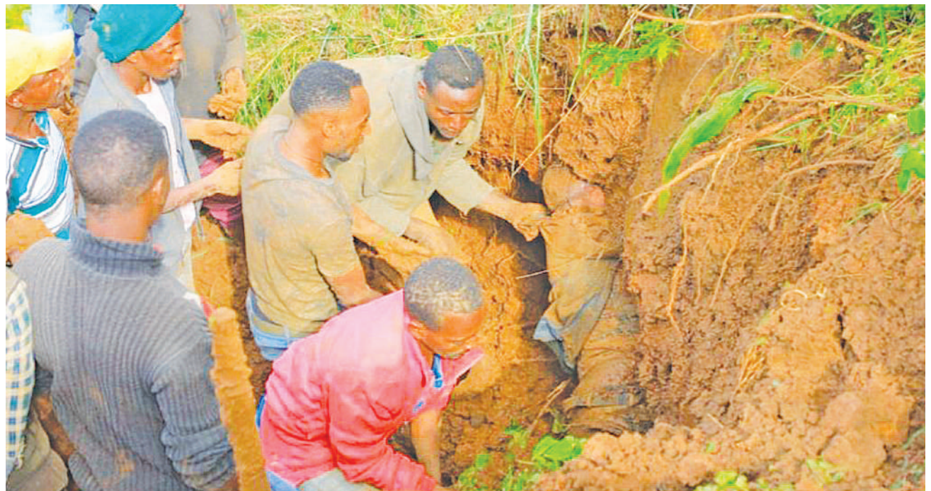
Watu wakichimba kifusi kuopoa maiti ya mwathiriwa wa maporomoko ya udongo yaliyotokea juzi katika eneo la Gofa, kusini mwa Ethiopia.