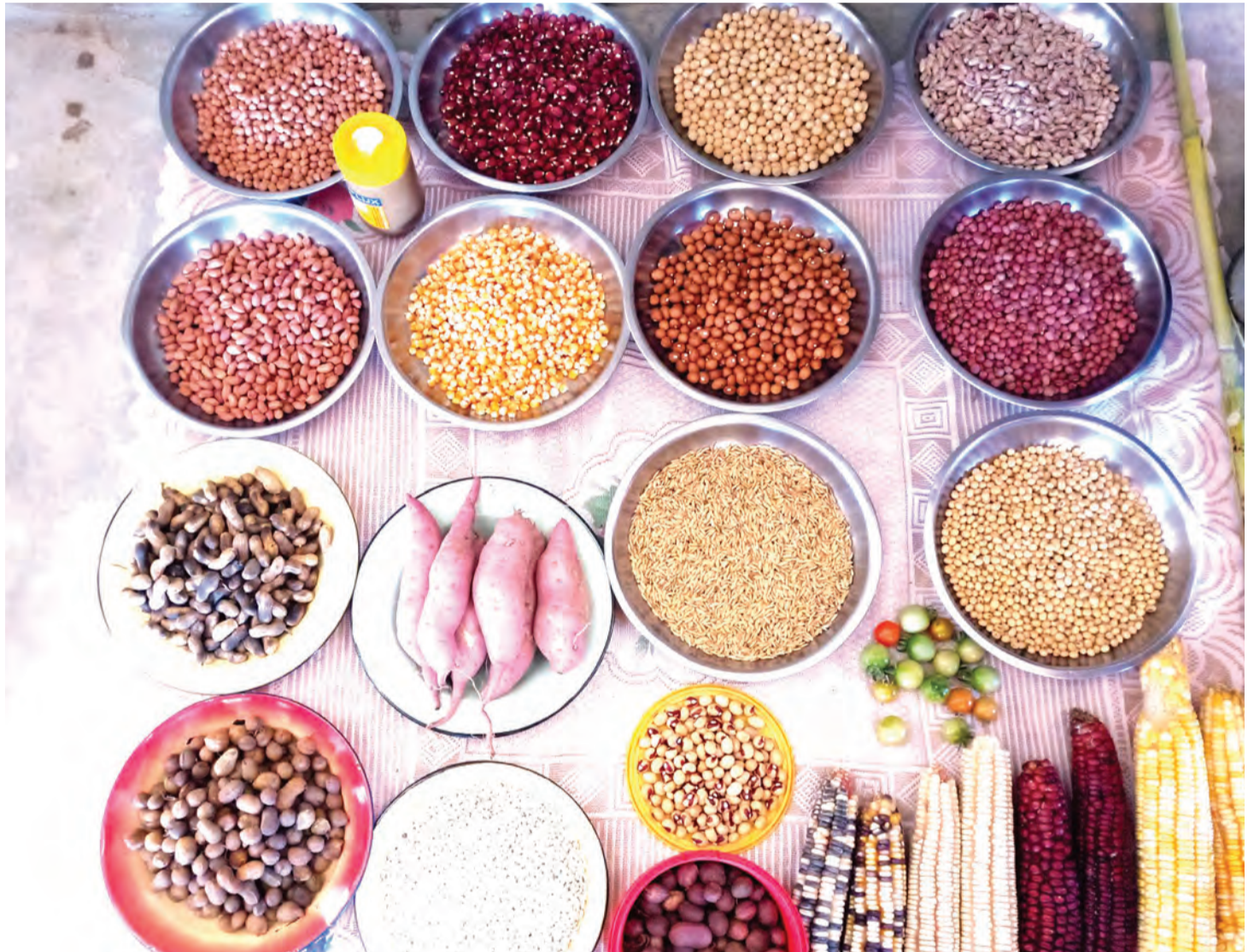
Mbegu zipo za aina mbalimbali, lakini kinachohitajika ni uhakiki wa ubora na usalama ili kulinda afya za walaji.

jeshi hilo jukumu kwa kuwa mbegu za GMO zinazoelezwa kuwa zinaoteshwa mara moja na zikioteshwa mara ya pili baada ya kuvunwa hazioti wala haziweza kuzaa mara nyingine kwa sababu ya kutumia teknolojia ya kuharibu nasaba na jeni ya asili teknolojia inayoitwa 'gene terminator'.