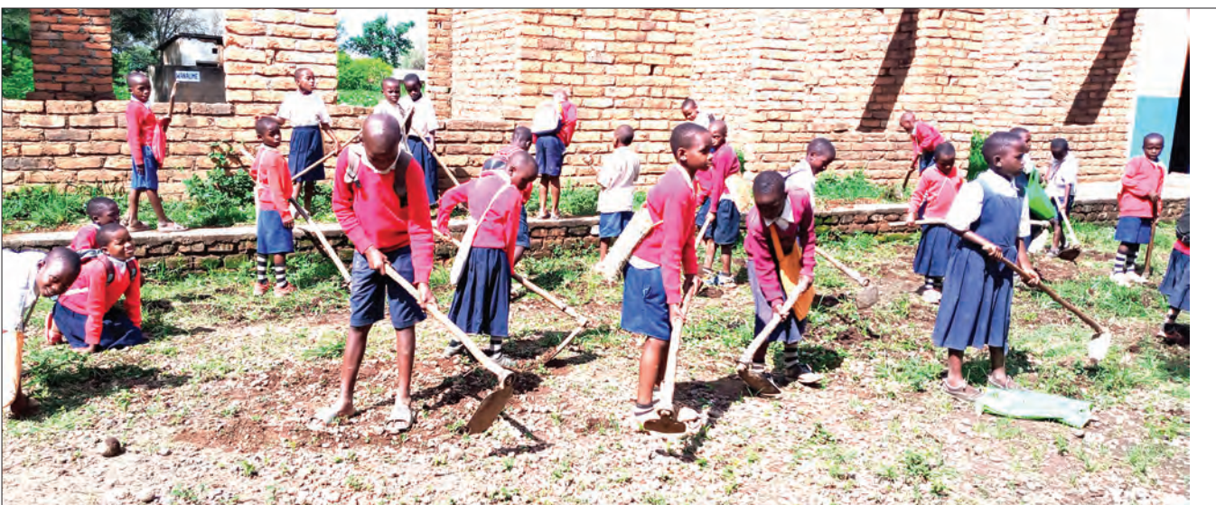
Wanafunzi wa Shule ya Msingi Uhusiano iliyoko Kata ya Mwatenga, Halmashauri ya Wilaya ya Mbarali, mkoani Mbeya, wakiendelea na shughuli za usafi wa mazingira kuzunguka maeneo mbalimbali ya shule hiyo, kabla ya kuruhusiwa kwenda nyumbani mwishoni mwa wiki.

Alidai zaidi ya miti 2,000 ilipandwa na Jumuiya ya Wazazi ya CCM Mbeya kama jitihada za kuhifadhi na kurejesha uoto wa asili katika maeneo yaliyoathiriwa na uvamizi wa shughuli za kibinadamu.