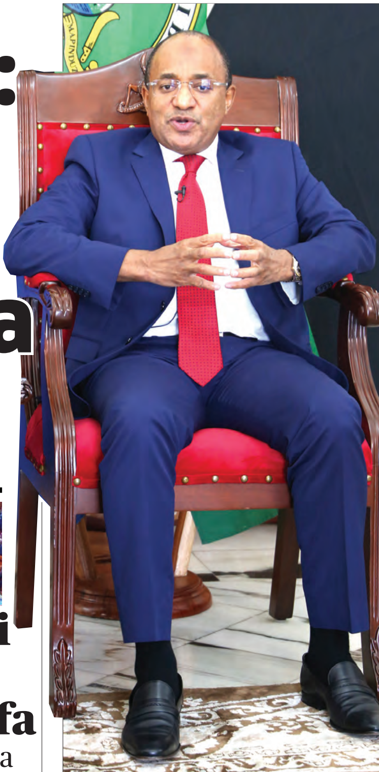
Rais wa Zanzibar, Dk. Hussein Ali Mwinyi.

BAJETI ya 2021/22 kutumia tril. 36.26/- Endelea Uk. 2