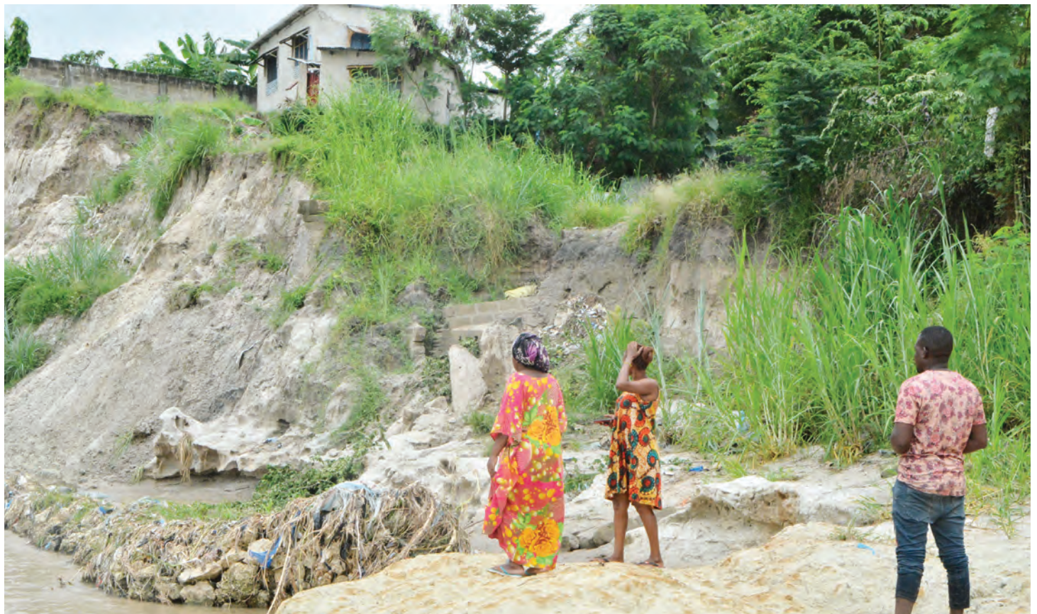
Wakazi wa Goba Manispaa ya Ubungo, jijini Dar es Salaam jana, wakiangalia Mto Mbezi unavyozidi kubomoa makazi yako kutokana na kutokuwa na kingo za kuzuia maji.