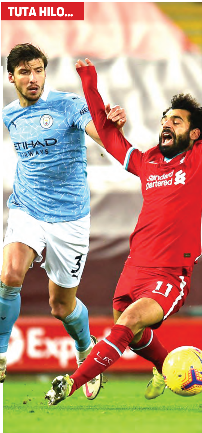
Beki wa kati wa Manchester City, Ruben Dias (kushoto), akimchezea madhambi mshambuliaji wa Liverpool, Mohamed Salah, ambayo yalisababisha penalti iliyofungwa na straika huyo kwenye mechi ya Ligi Kuu England iliyopigwa Uwanja wa Anfield juzi na Man City kushinda 4-1.