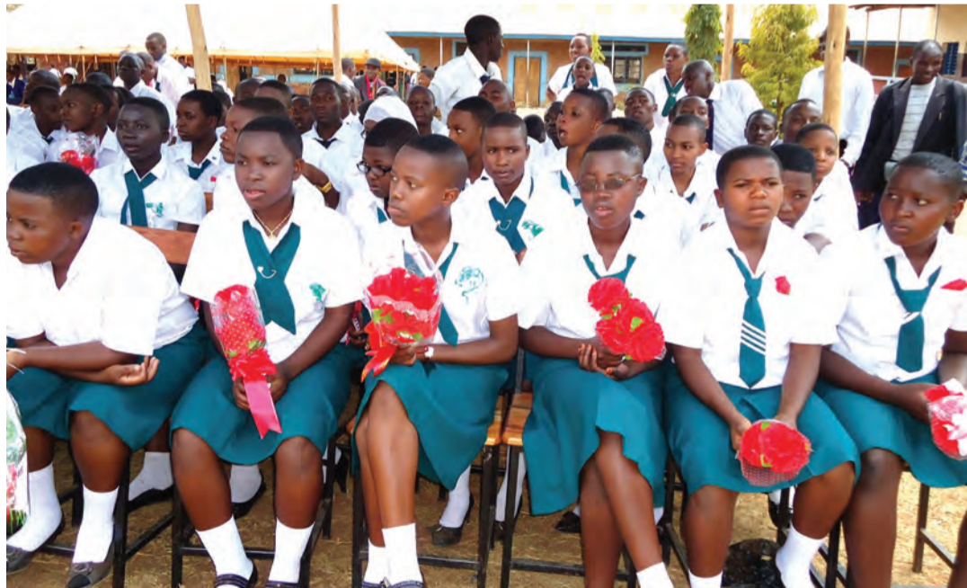
Wanafunzi wa kike kama hawa wanatakiwa kulindwa dhidi ya mimba, ili watimize ndoto zao katika elimu.