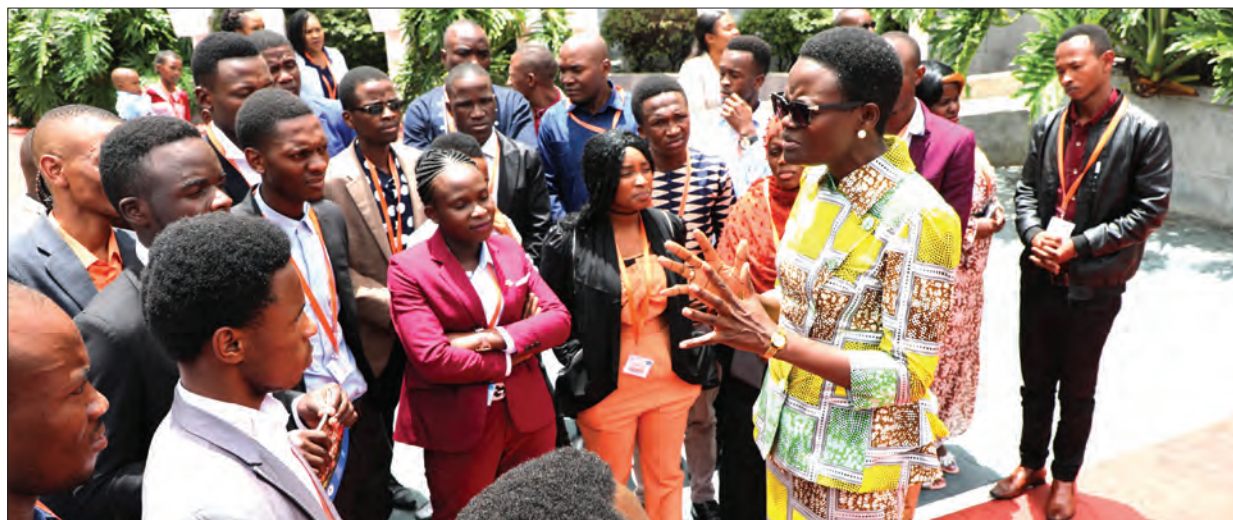
Naibu Spika wa Bunge, Dk. Tulia Ackson, akizungumza na wanafunzi kutoka Umoja wa Wanafunzi Vyu Vikiu nchini, wa mikoa mbalimbali nje ya ukumbi wa Bunge, jijini Dodoma, jana.

Aidha, alisema wizara inaendelea kukamilisha utaratibu wa kuweka alama katika shoroba na mapito ya wanyamapori ili kumaliza uhifadhi wake na kuenyeza kufanya utafiti na kuenyeza matumizi ya mbinu mbadala za kujikinga na wanyamapori waharibifu hasa tembo.