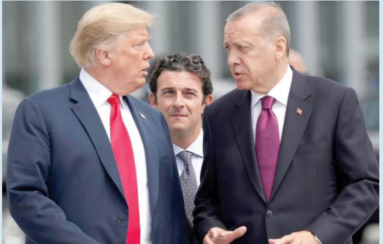
Rais Donald Trump wa Marekani (kushoto), akiwa na Rais Recep Tayyip Erdogan wa Uturuki.

Ilibidi Rais Erdogan afanye mageuzi makubwa jeshini aweze kupambana