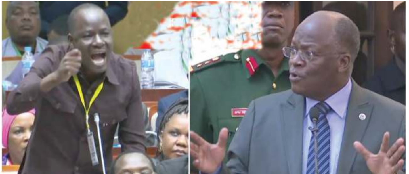
Mmoja wa wachimbaji madini (kushoto), aliyeshiriki kwenye mkutano wa Rais John Magufuli (kulia), alipokutana na wadau wa madini nchini hivi karibuni.

Hivyo, dhahabu inahusishwa na utukufu, utajiri, mamlaka na nguvu kiuchumi na kisiasa.