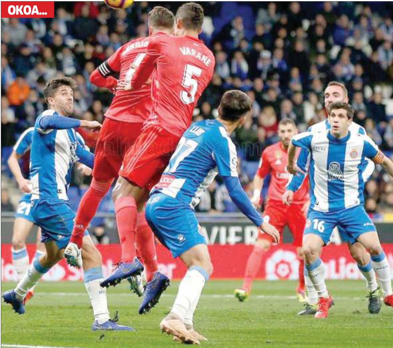
Mabeki wa kati wa Real Madrid, Sergio Ramos na Raphael Varane, wakiruka kuwahi kuokoa mpira kwa kichwa dhidi ya washambuliaji wa Espanyol kwenye mechi ya La Liga iliyopigwa usiku wa kuamkia juzi katika Uwanja wa RCDE. Real Madrid ilishinda 4-2.