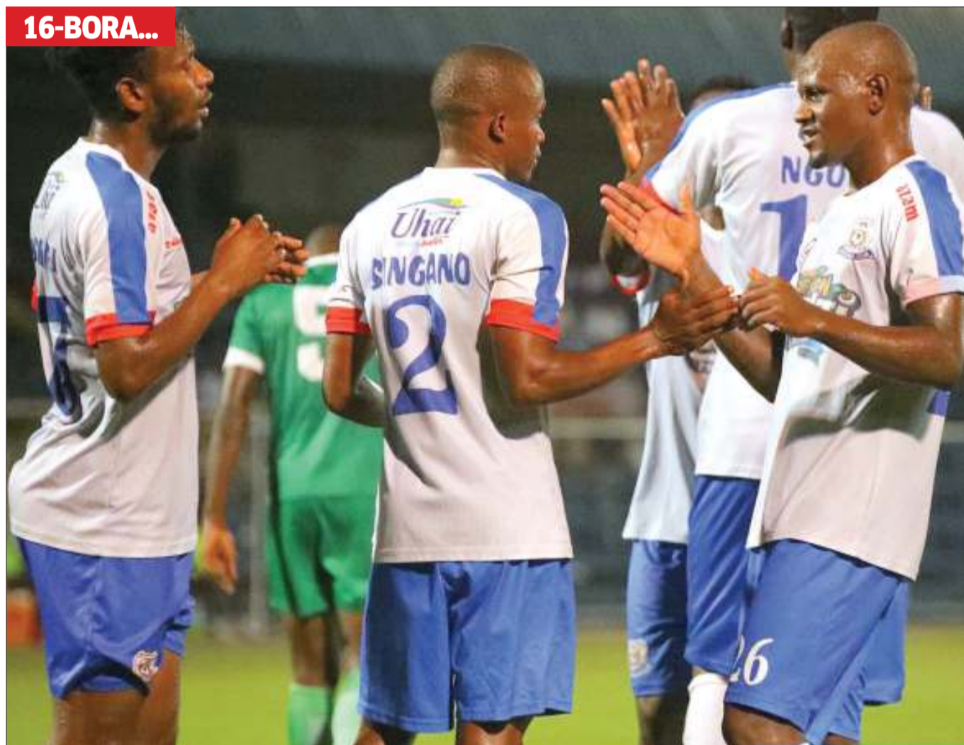
Wchezaji wa Azam, ambao juzi timu yao ilifanikiwa kutinga hatua ya 16-Bora ya michuano ya Kombe la Shirikisho la Soka Tanzania maarufu FA Cup kwa kuichapa Pamba ya Mwanza kwa mabao 2-0 katika mechi iliyopigwa Uwanja wa Azam Complex, Chamazi jijini Dar es Salaam.