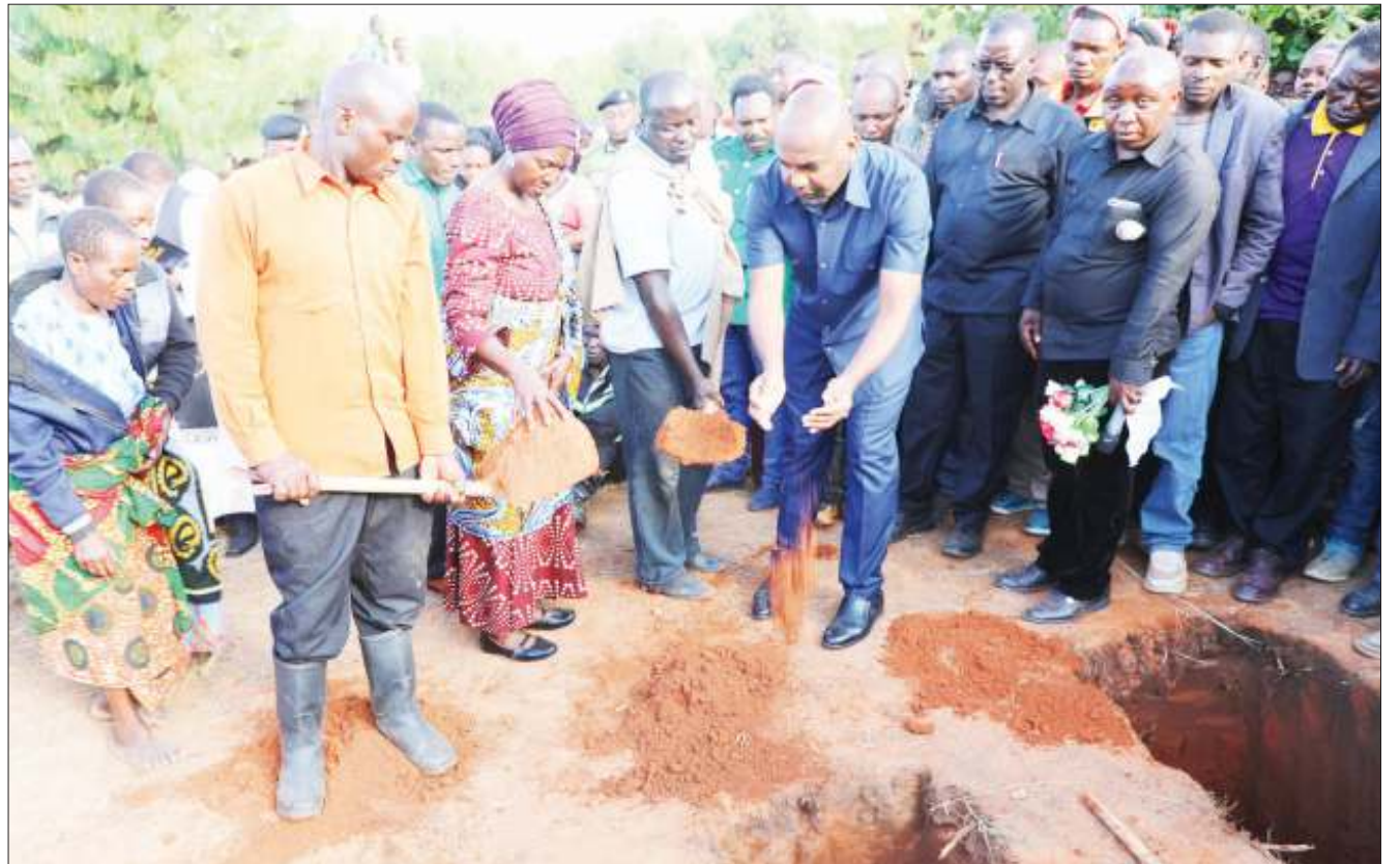
Naibu Waziri wa Mambo ya Ndani, Hamad Yusuf Masauni, akiweka mchanga juzi, katika moja ya makaburi ya watoto watatu wa familia moja waliouawa kikatili katika kijiji cha Ikando Kata ya Kichiwa, wilayani Njombe.