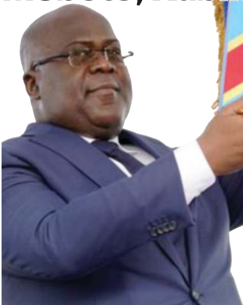
Rais Felix Tshisekedi wa DRC