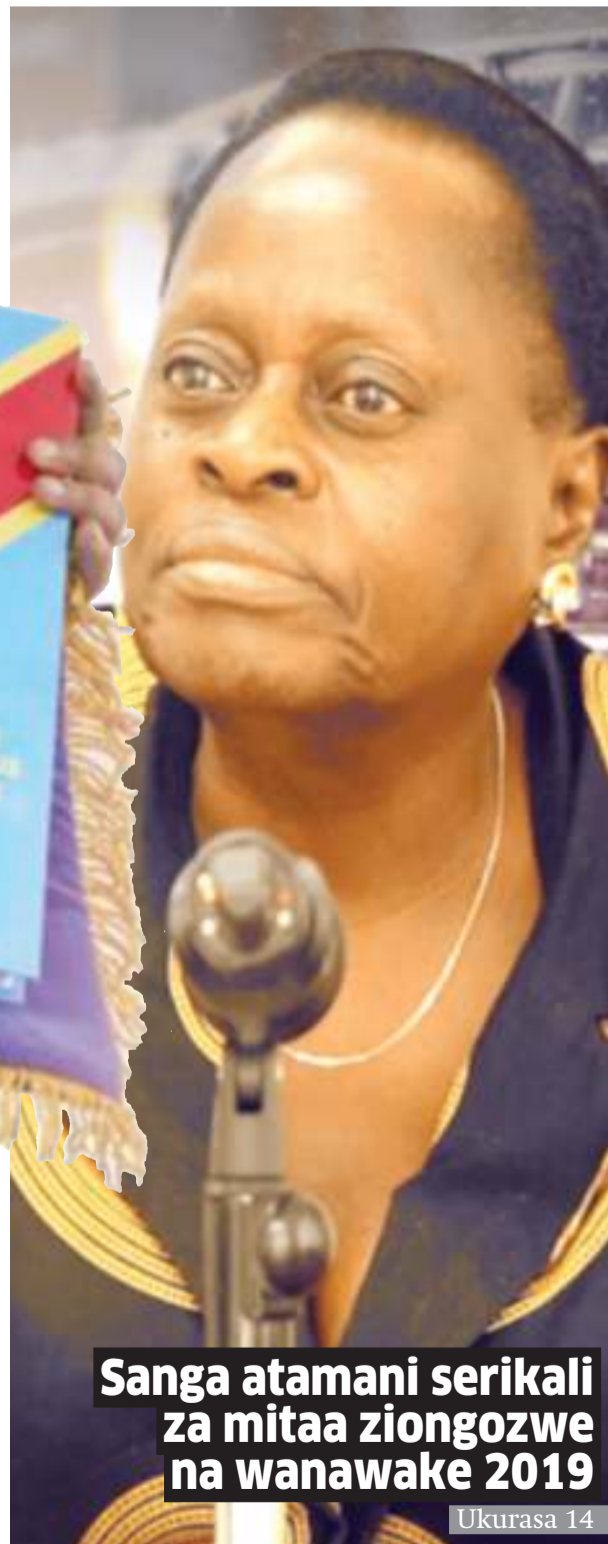
Sanga atamani serikali za mitaa ziongozwe na wanawake 2019