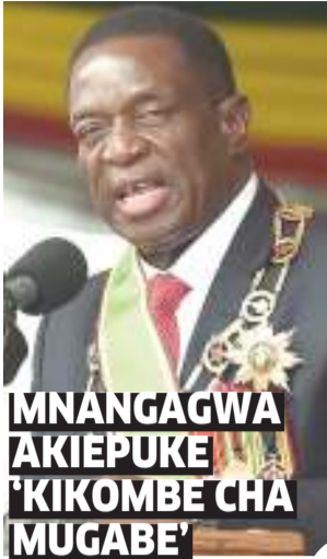
MNANGAGWA AKIEPUKE 'KIKOMBE' CHA MUGABE'