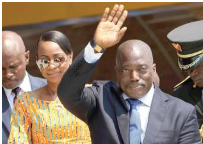
Rais aliyekabidhi madaraka hivi karibuni, Joseph Kabila.