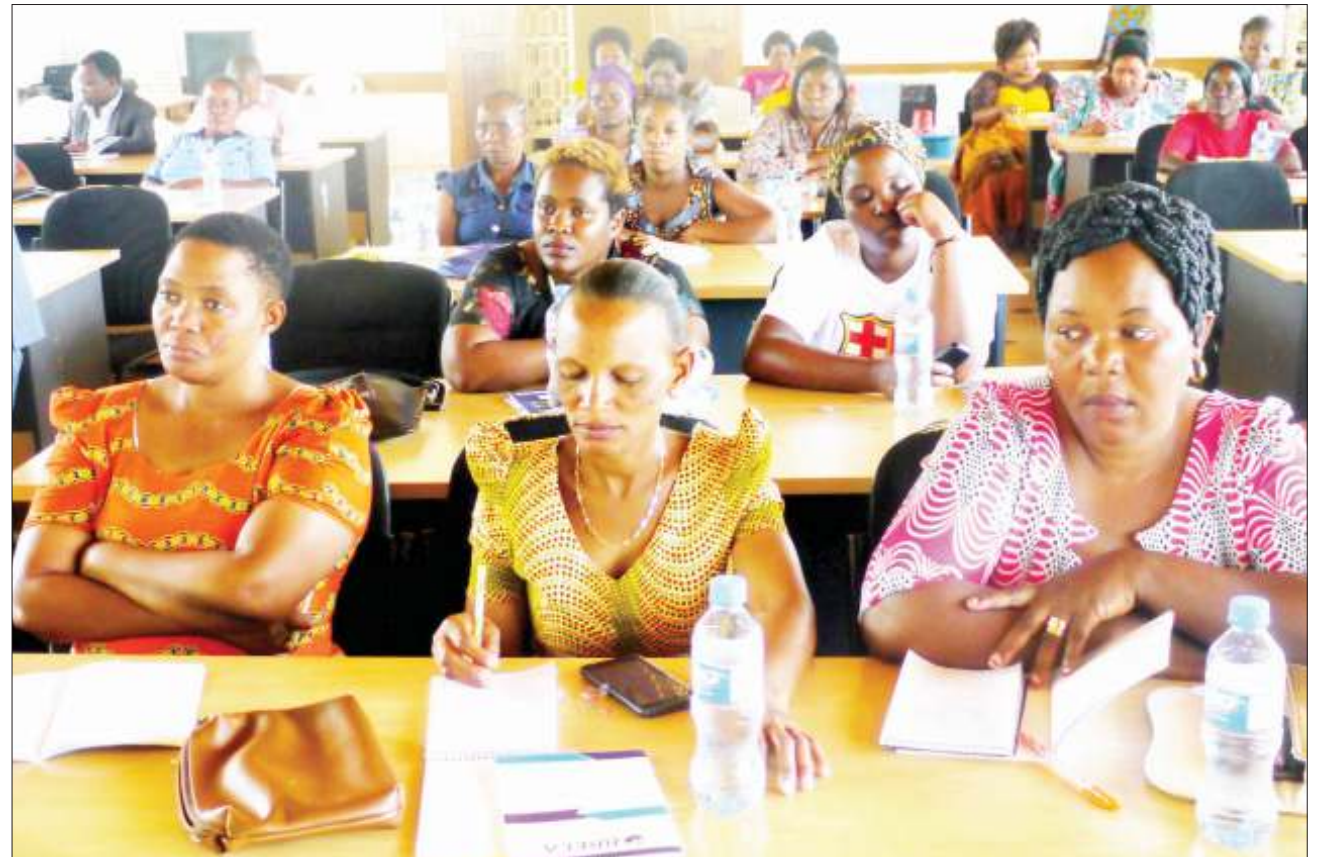
Wafanyabiashara mkoani Shinyanga wakipewa elimu ya kusajili biashara zao Brela kwa kutumia mfumo mpya wa mtandao.

Kwa upande wake Makamu wa Pili wa Rais wa Zanzibar, Balozi Seif Ali Iddi, alisema uimarikaji wa sekta ya afya kwa kuongezeka vifaa vya kisasa pamoja na miundombinu ya mawasiliano ya barabara inayotokana na misaada ya nchi hiyo kumeleta faraja kwa wananchi wanaoendelea kupata huduma kupitia miradi hiyo.