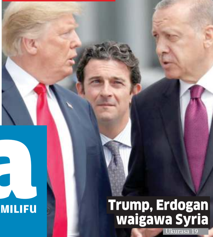
Trump, Erdogan waigawa Syria