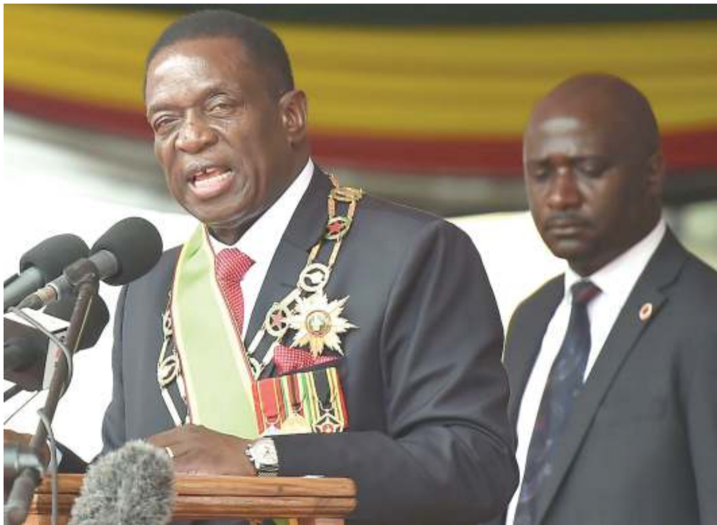
Rais Emmerson Mnangagwa wa Zimbabwe..

Serikali ikamtupia lawama Rais aliyondolewa madarakani kwa nguvu za jeshi, Mugabe, kwamba utawala wake ulidhorotesha uchumi wa nchi na kusababisha mfumuko wa bei kufikia asilimia 40, hali inayosababisha