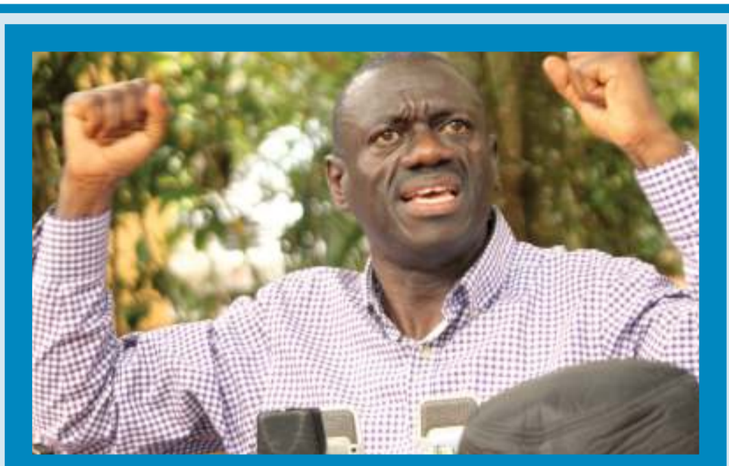
Dk. Kizza Besigye, kiongozi wa upinzani nchini Uganda.

Hali hiyo inatokana na baadhi ya jumuiya hizo, kutoa matamko ya awali yenye kutilia shaka, kukosa na ku-