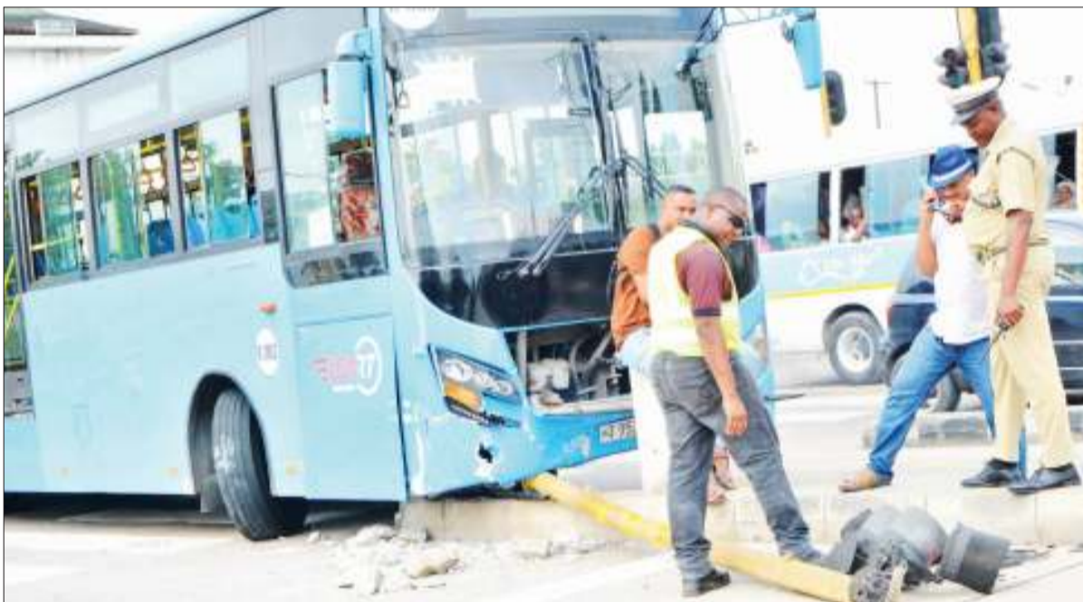
Askari polisi kitengo cha usalama barabarani, akiangalia taa za kuongezea magari baada ya kugongwa na gari la mwendokasi katika eneo la Magomeni Mapipa jijini Dar es Salaam jana, hakuna aliyeyeruhiwa.