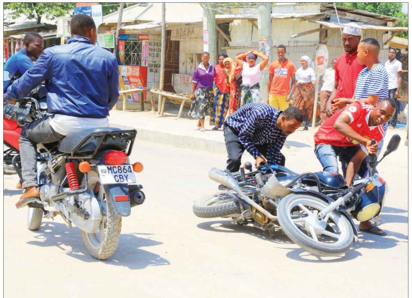
Mwendesha bodaboda na abiria wake wakijaribu kuinyanyua pikipiki baada ya kupata ajali, eneo la Chang'ombe, jijini Dodoma juzi.

Maeneo ambayo watu walijimilikisha waondoke mara moja hivi tukitaka kuwekeza tutakwenda kuwekeza bila matatizo