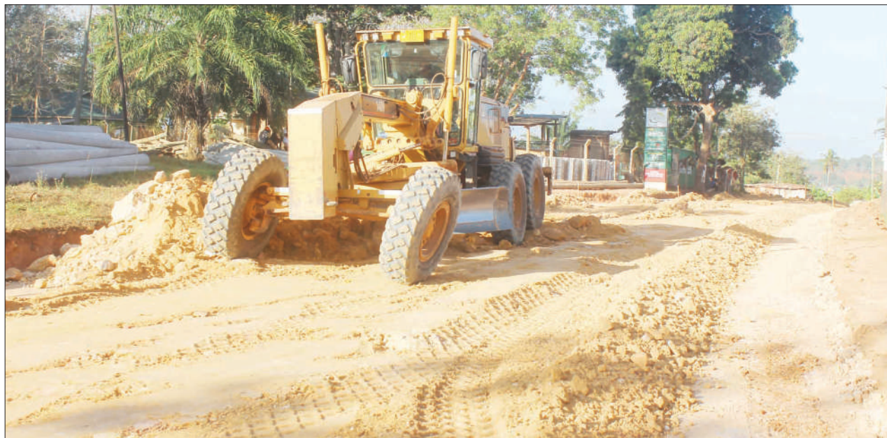
Kijiko cha kampuni ya Old South, kikichonga barabara ya Mtaa wa Tanesco, mjini Kisarawe, mkoani Pwani juzi.

Salum alisema kata yake imekuwa na fursa nyingi za kilimo ambazo zikitumika vyema zinaweza kuinua uchumi wa wananchi, iwapo ujuzi na ubunifu wa wataalamu utatumika vyema.