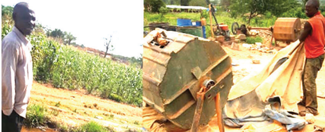
Wachimbaji wadogo wakiwa kazini kwenye moja ya migodi mkoani Geita.

Kinega anasema kuifanya sayanaid kuwa kemikali ya kuchenjua dhahabu ni jambo gumu kwao kwani wanahitaji kuchimba, kusaga