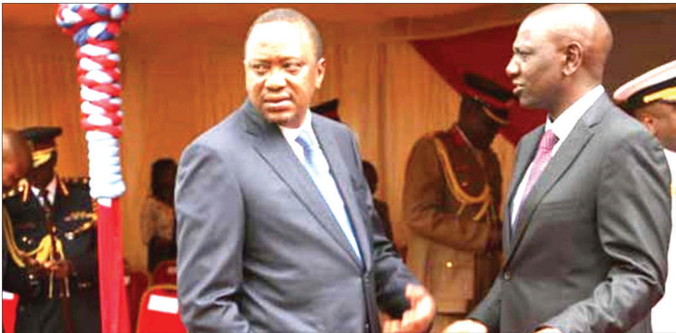
Ruto (kushoto) na Kenyatta katika tukio linaloonyesha kuwa wawili hao wana tofauti za kisiasa.