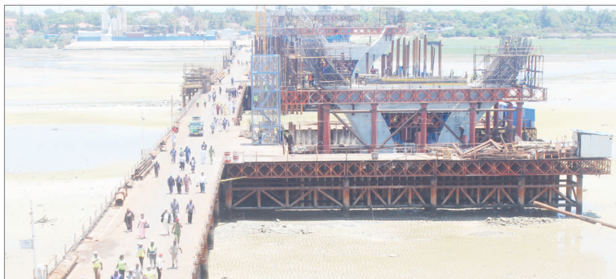
Mwonekano wa ujenzi unaoendelea wa daraja jipya la Tanzanite, lenye urefu wa km 6.3, litakalounganisha maeoneo ya Aga Khan Upanga Mashariki na Ufukwe wa Coco Oysterbay kupitia Bahari ya Hindi, jijini Dar es Salaam jana.