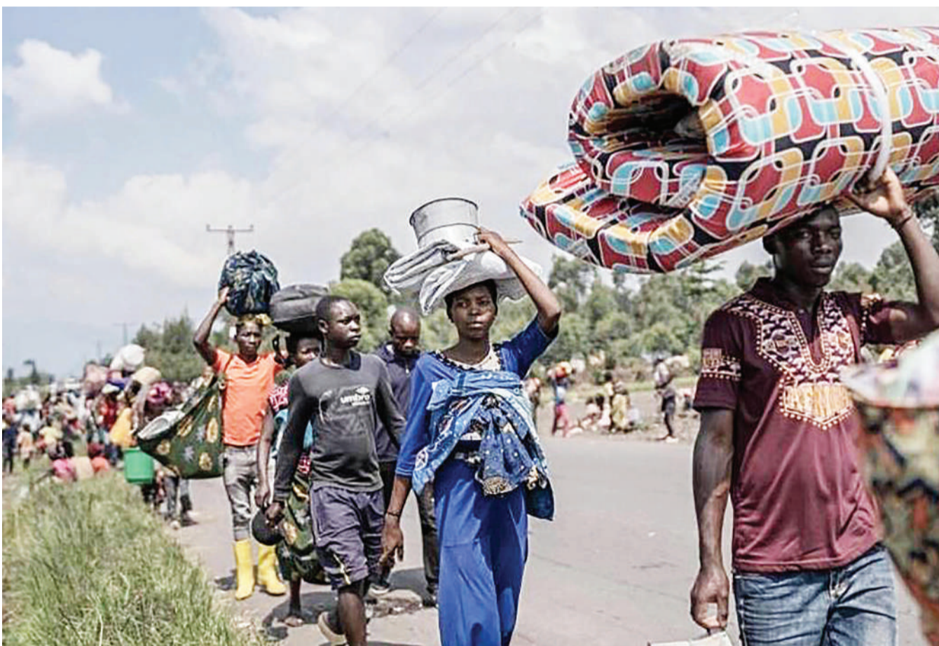
Raia wa Rubaya wilayani Musisi nchini Jamhuri ya Kidemokrasia ya Congo, wakikimbia baada ya waasi wa M23 kuliteka eneo hilo.