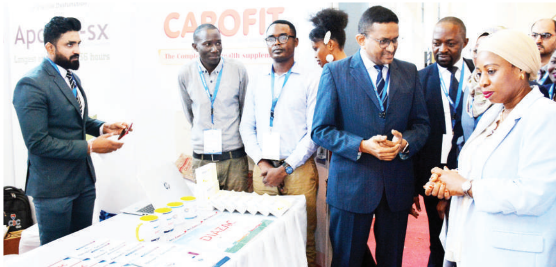
Waziri wa Afya, Umy Mwalimu (kulia), akitembelea maonyesho wakati wa mkutano Mkuu wa Chama cha Madaktari Bingwa wa Magonjwa ya Ndani Tanzania (APHYTA), jijini Dar es Salaam jana.