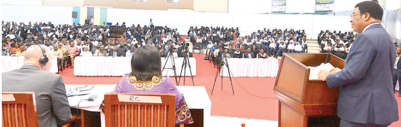
Waziri Mkuu, Kassim Majaliwa akizungumza katika kilele cha Maadhimisho ya Siku ya Uhuru wa Vyombo vya Habari Duniani, jijini Dodoma, jana.

Mikoa yapewa hadhari athari kimbunga Hidaya