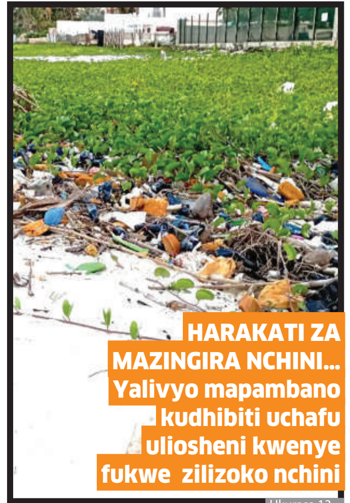
HARAKATI ZA MAZINGIRA NCHINI... Yalivyo mapambano kudhibiti uchafu uliosheni kwenye fukwe zilizoko nchini