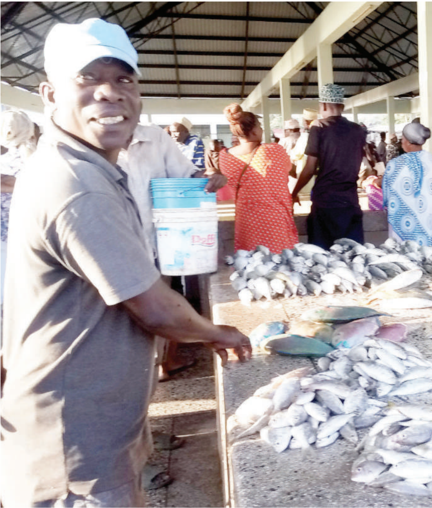
Mchuzi wa samaki (kushoto), akisubiri wateja katika soko la Bagamoyo, mkoani Pwani jana. Kutokana na kuanza kwa kipindi cha baridi samaki wamekuwa hawapatikani kwa wingi na kusababisha fungu moja kuuzwa kwa bei ya 7,000/- hadi 8,000/-.