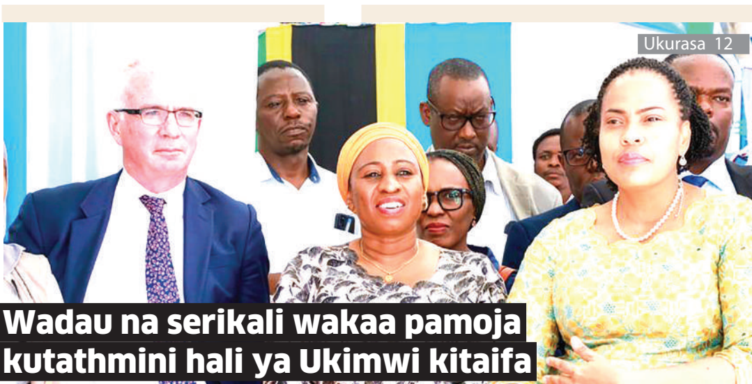
Wadau na serikali wakaa pamoja kutathmini hali ya Ukimwi kitaifa