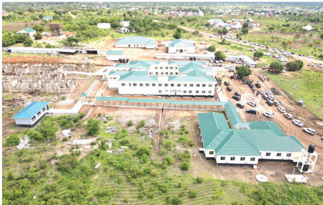
Hospitali ya Rufani Mkoa wa Katavi, mjini Mpanda katika hatua za ujenzi hadi kufika, Desemba mwaka jana.

Kadri muda ulivyosonga, kukashuhudiwa mageuzi na maendeleo, pia mahitaji mapya ya wakati husika. Hata ilipofika, katika zama za uongozi wa nchi awamu ya nne, kukafanyika maboresho ya