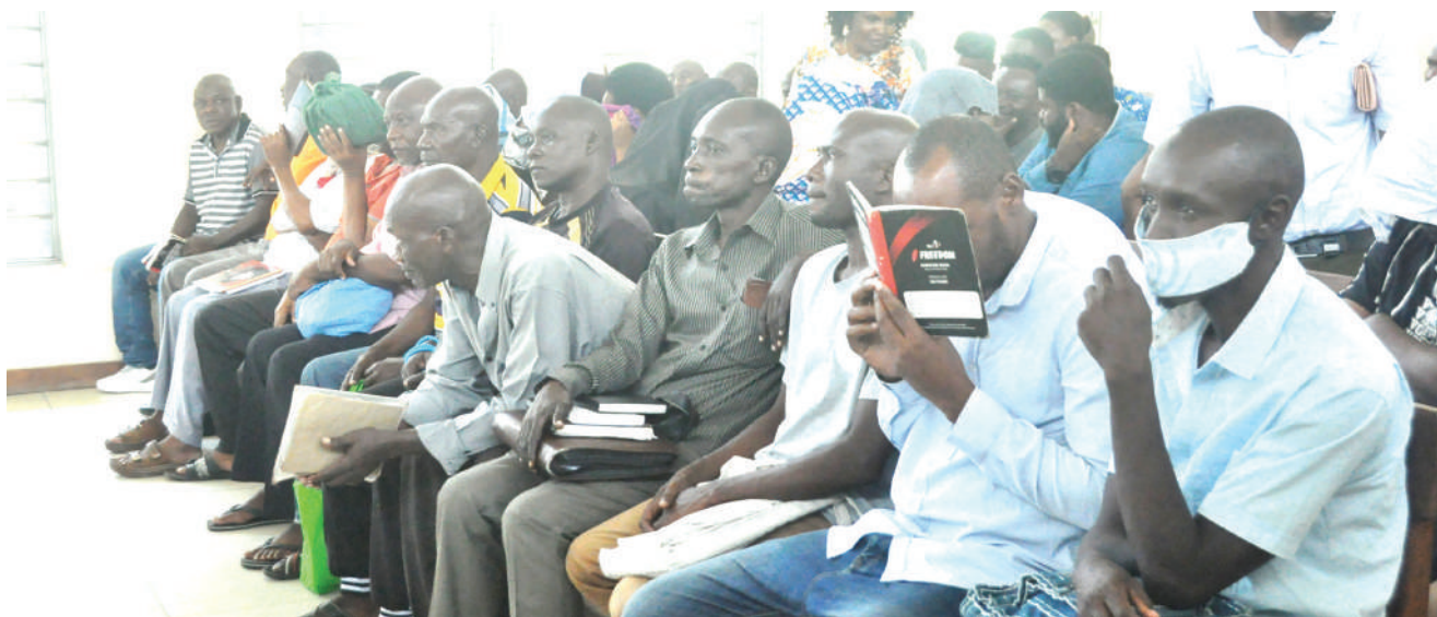
Watuhumiwa wa kesi ya kukutwa na vipande 660 vya meno ya tembo vyenye thamani ya zaidi ya Sh. bilioni 4 (mstari wa mbele), wakiwa katika chumba cha Mahakama ya Hakimu Mkazi Kisutu, jijini Dar es Salaam jana, kusikiliza shauri linalowakabili.

Katika hati ya mashtaka, mfanyabiashara huyo anatumia kuwa Oktoba 21, 2015, akiwa eneo la Ubungo External, aliiba gari aina ya RAV4 T 984 BPG, mali ya Victoria Njau ambalo alikuwa ameaminwa na Peter Sanga kwa ajili ya biashara.